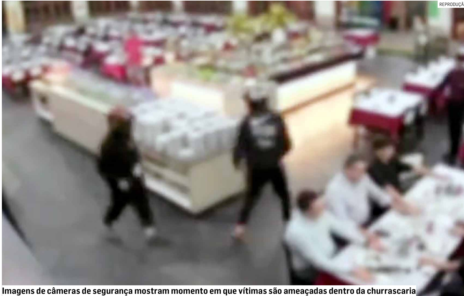
Imagens de câmeras de segurança mostram momento em que vítimas são ameaçadas dentro da churrascaria

Dupla armada invadiu estabelecimento às margens da Rodovia Anhanguera e rendeu funcionários e clientes; autores do roubo usavam capacetes para dificultar identificação e precisaram de apenas dois minutos para concluir o assalto