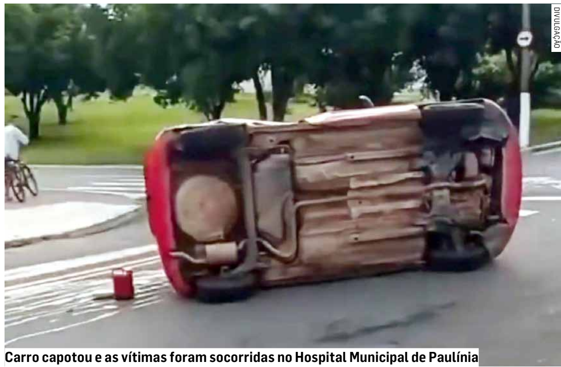
Carro capotou e as vítimas foram socorridas no Hospital Municipal de Paulínia