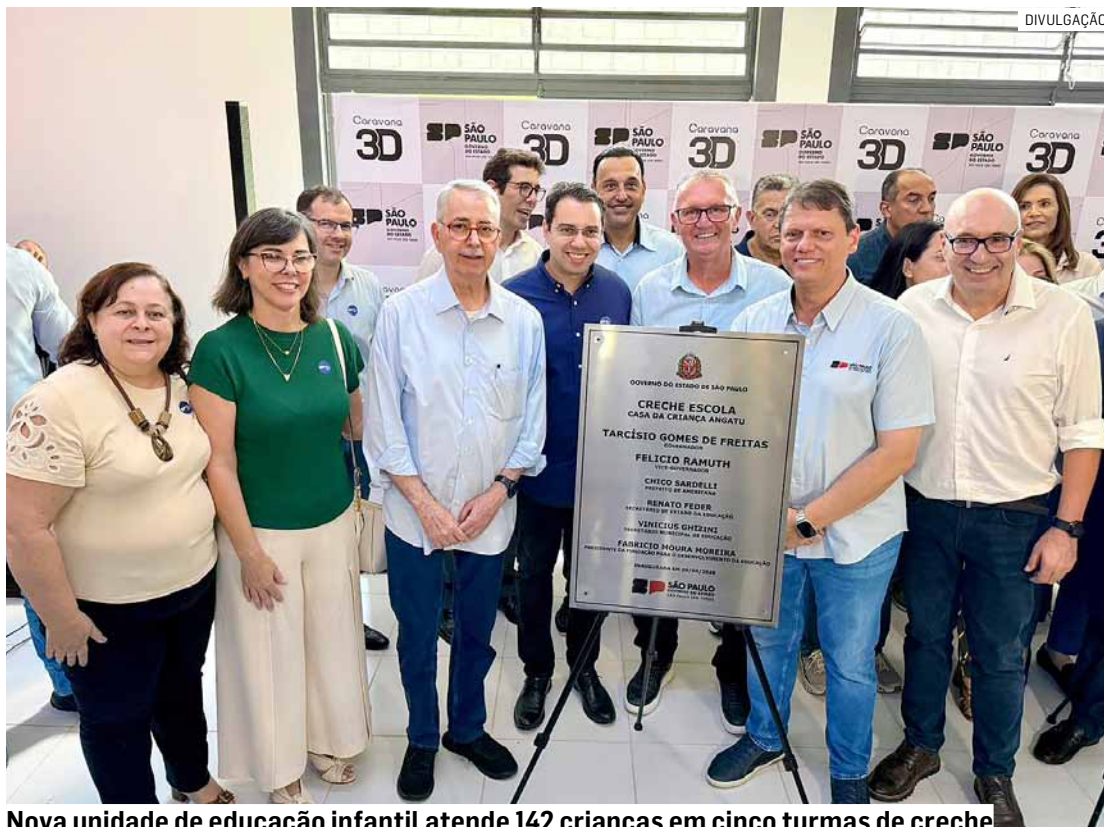
Nova unidade de educação infantil atende 142 crianças em cinco turmas de creche

“Estou muito feliz de estar aqui no dia de hoje. Agradeço o governador Tarcísio de Freitas e o secretário de Educação, Renato Feder, por todo o ca-