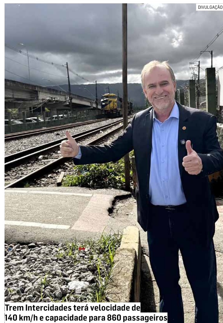
Trem Intercidades terá velocidade de 140 km/h e capacidade para 860 passageiros

O Trem Intercidades será o primeiro trem de média velocidade do Brasil, com velocidade de até 140 km/h, capacidade para cerca de 860 passageiros por viagem e tempo estimado de 64 minutos no trajeto de 101 km entre São Paulo e Campinas. O início da operação está previsto para 2031.