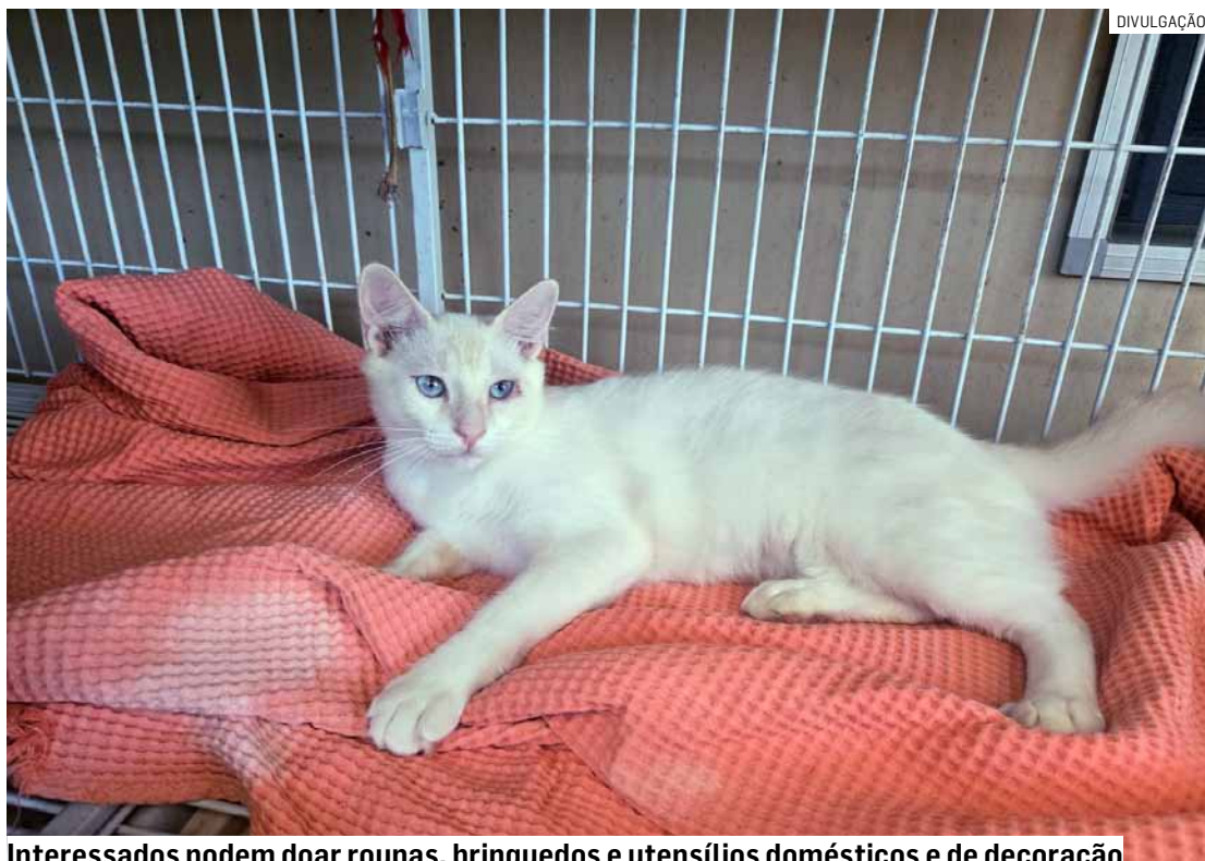
Interessados podem doar roupas, brinquedos e utensílios domésticos e de decoração

A ONG Viralatinhas, de Sumaré, está arrecadando itens diversos, em bom estado, para a realização do seu tradicional Bazar da Pechincha, que acontecerá em breve. Podem ser doados roupas, calçados, brinquedos, acessórios, itens de decoração, utensílios domésticos e eletrônicos. Tudo aquilo que já não tem mais utilidade pode ganhar um novo des-