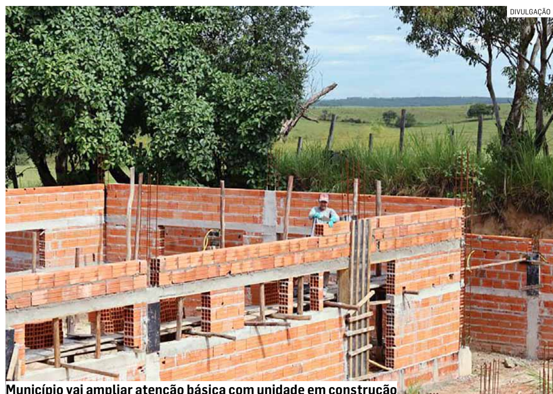
Município vai ampliar atenção básica com unidade em construção

Da Redação • MONTE MOR tribunaliberal@tribunaliberal.com.br