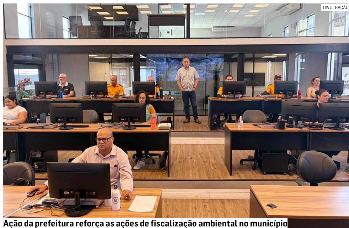
Ação da prefeitura reforça as ações de fiscalização ambiental no município

Hortolândia conta com o CIMH desde 2022. A Central está localizada na Rua Francisco Guimarães de Oliveira, 130, no Remanso Campineiro. O espaço, que funciona 24 horas por dia, sete dias por semana, é um órgão do governo que auxilia no monitoramento da cidade.