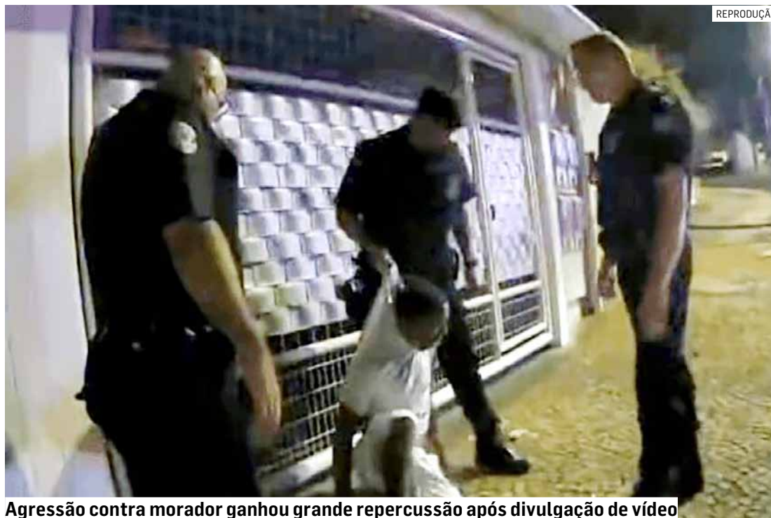
Agressão contra morador ganhou grande repercussão após divulgação de vídeo

Com o encerramento do procedimento, ao menos seis agentes foram desligados por justa causa. A medida foi oficializada por meio