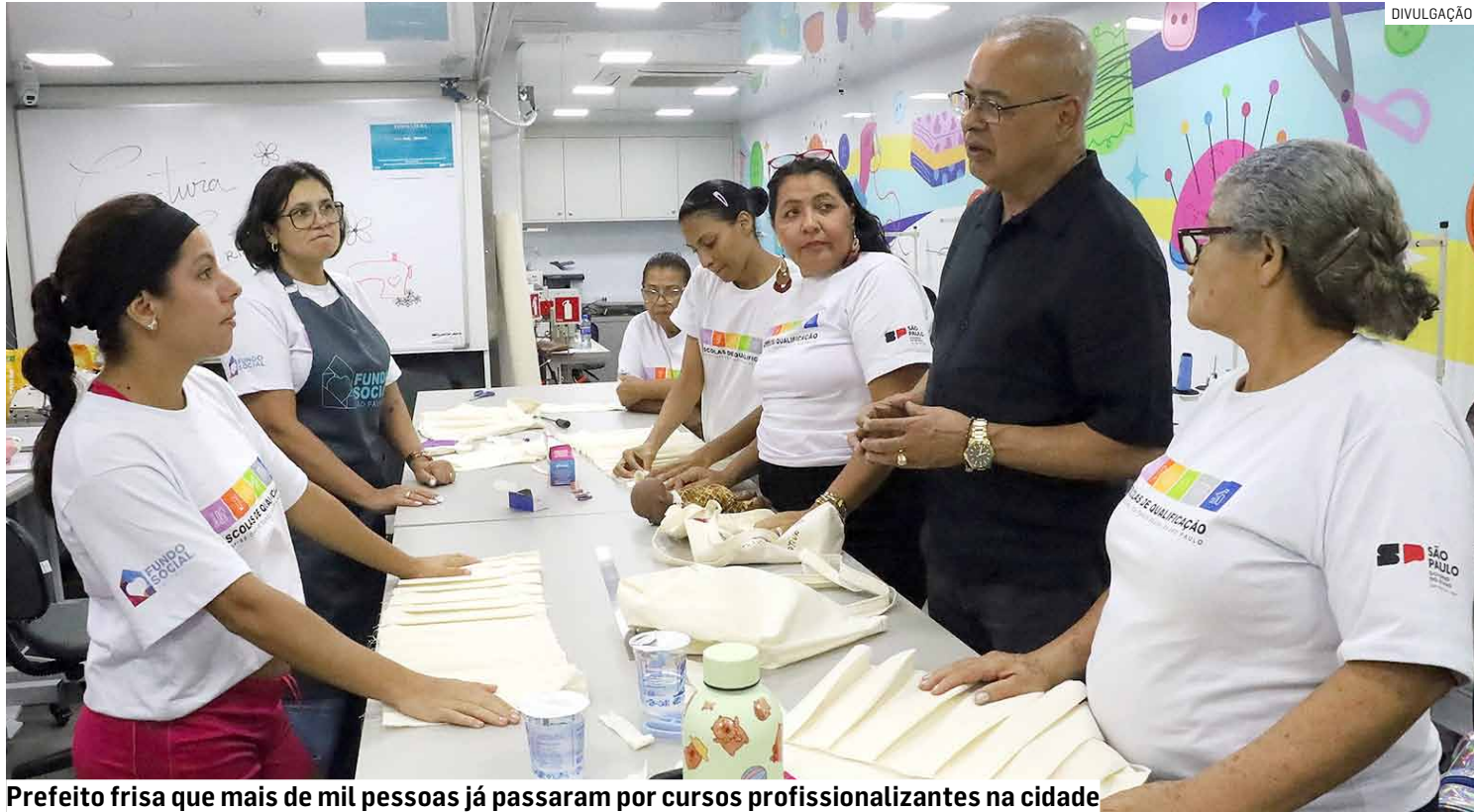
Prefeito frisa que mais de mil pessoas já passaram por cursos profissionalizantes na cidade

O programa, realizado pelo Governo do Estado em parceria com o Fundo Social de São Paulo, encontra em Hortolândia terreno fér-