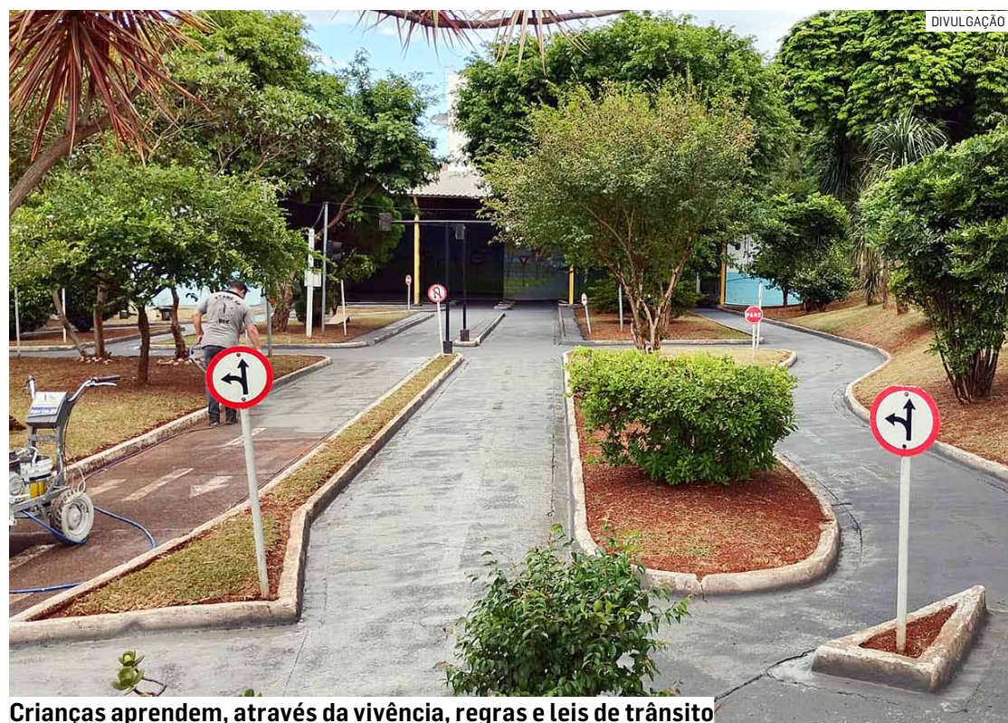
Crianças aprendem, através da vivência, regras e leis de trânsito

A Cidade Mirim de Trânsito é uma réplica de vias comuns existente nas mobilidades urbanas em menor dimensão. O intuito é que a criança viva uma experiência real dentro da temática do trânsito envolvendo sinalizações de solo, placas de regulamentação e advertência, semáforos, normas e conceitos.