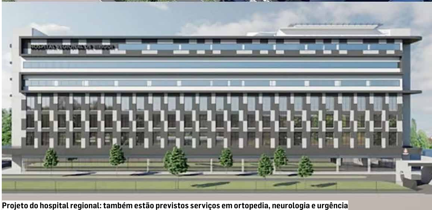
Projeto do hospital regional: também estão previstos serviços em ortopedia, neurologia e urgência