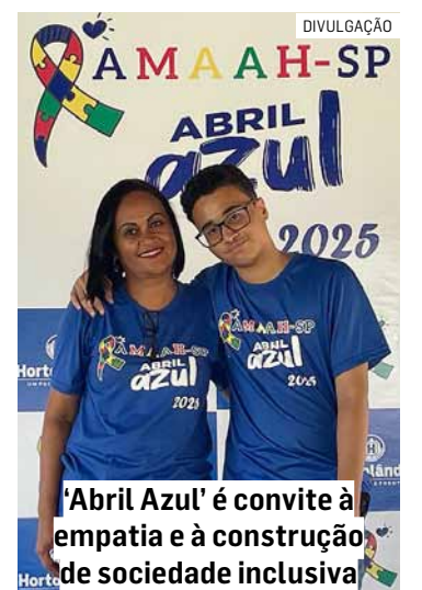
'Abril Azul' é convite à empatia e à construção de sociedade inclusiva

Segundo a organização, a programação deste ano foi planejada para atender especialmente pessoas autistas, ressaltando aspectos como estímulos sonoros, tempo de duração das atividades e organização do ambiente. Entre as