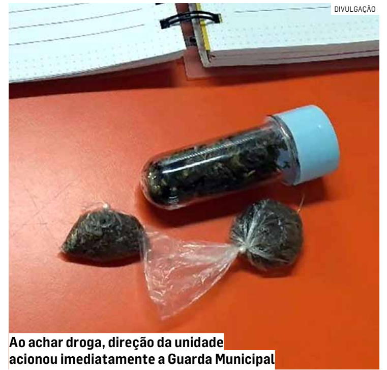
Ao achar droga, direção da unidade acionou imediatamente a Guarda Municipal

Após serem ouvidos pela autoridade policial, os responsáveis foram liberados. O Conselho Tutelar também foi acionado para acompanhar a ocorrência, enquanto a Polícia Civil prossegue com a investigação para apurar as circunstâncias do caso.