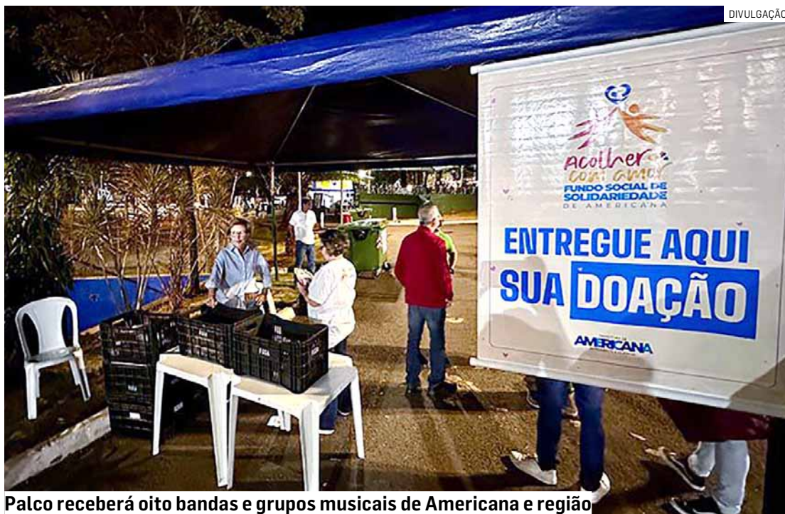
Palco receberá oito bandas e grupos musicais de Americana e região

Haverá ainda praça de alimentação com diversas opções de food trucks, área kids com brinquedos infláveis para as crianças e feira de artesanato com exibição e venda de produtos