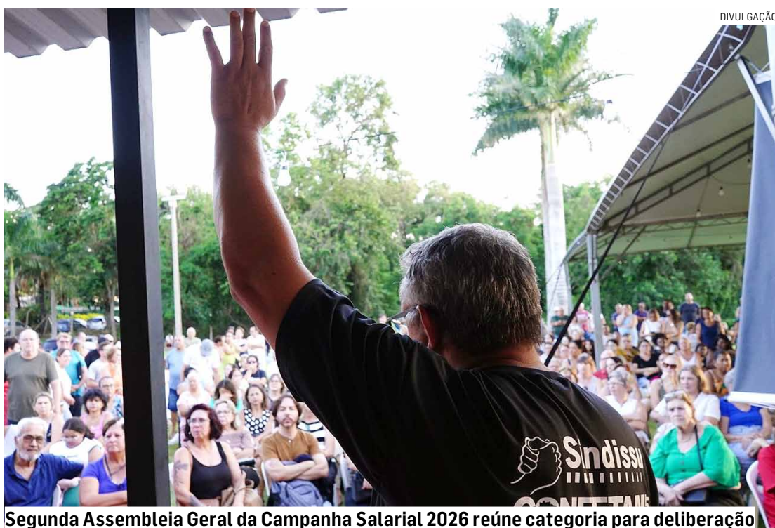
Segunda Assembleia Geral da Campanha Salarial 2026 reúne categoria para deliberação

A assembleia dá continuidade ao processo iniciado em fevereiro, quando os servidores aprovaram um conjunto de 49