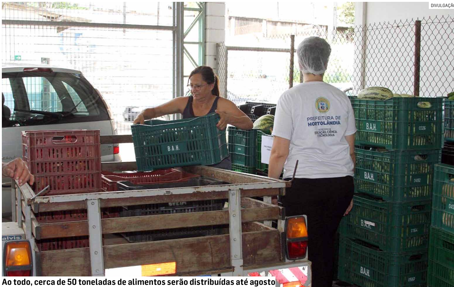
Ao todo, cerca de 50 toneladas de alimentos serão distribuídas até agosto

Em Hortolândia, o PAA é coordenado pelo Departamento de Segurança Alimentar, que, neste ano, dispõe de R$ 325 mil para executar o programa, valor maior que o de 2025, que foi de R$ 152 mil. O investimento é utilizado na modalidade de Compra com Doação Simultânea. Com uma previsão de aquisição de 50 toneladas de alimen-