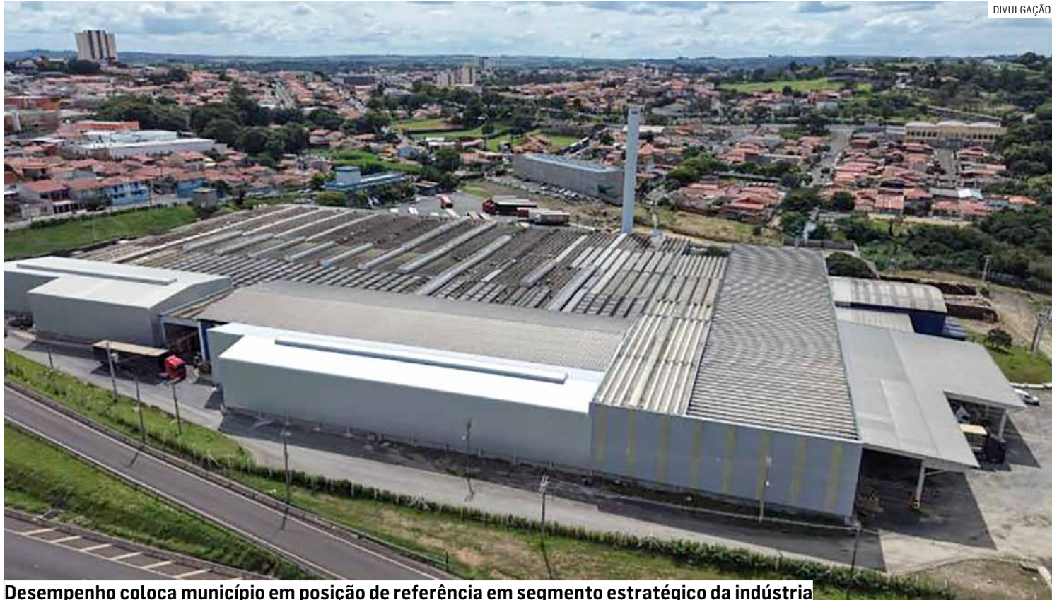
Desempenho coloca município em posição de referência em segmento estratégico da indústria

Além da liderança em reservatórios metálicos, a cidade também conquistou o primeiro lugar no Estado na exportação de amidos e féculas, com US$ 693,2 mil, alcançando ainda a segunda colocação no Brasil nesta categoria. Outro desta-