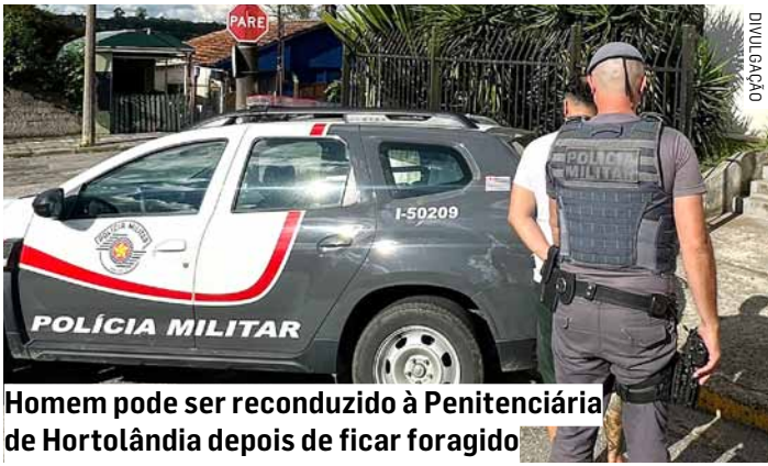
Homem pode ser reconduzido à Penitenciária de Hortolândia depois de ficar foragido

Concluídos os procedimentos, ele recebeu alta médica e foi conduzido ao Distrito Policial do município para as medidas legais cabíveis. Na unidade policial, a prisão em flagrante foi formalizada. Ainda não foi definida a unidade prisional onde o homem cumprirá o restante da pena, podendo ser transferido para a região de Sorocaba ou reconduzido à Penitenciária de Hortolândia.