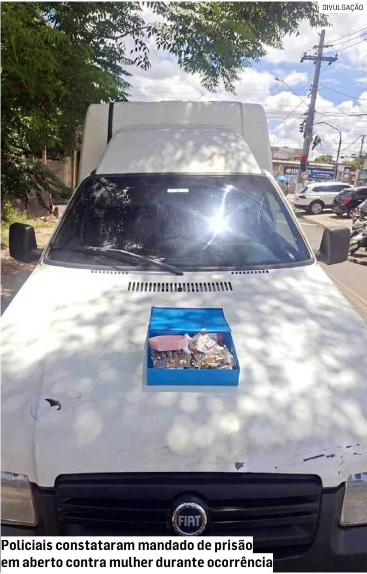
Policiais constataram mandado de prisão em aberto contra mulher durante ocorrência

A ocorrência foi apresentada no 4º Distrito Policial de Sumaré, onde a mulher permaneceu presa e à disposição da Justiça. O caso segue sob investigação.