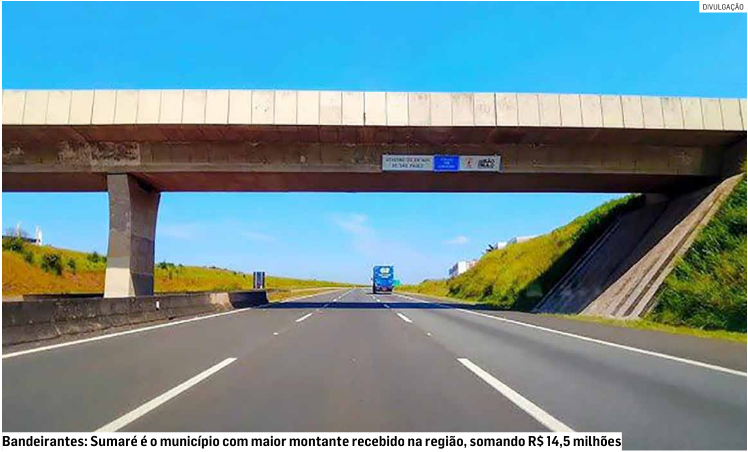
Bandeirantes: Sumaré é o município com maior montante recebido na região, somando R$ 14,5 milhões

Os repasses fazem parte do montante de R$ 199.261.421,37 transferido pela concessionária a 18 cidades ao longo de 2025. O valor corresponde a 5%