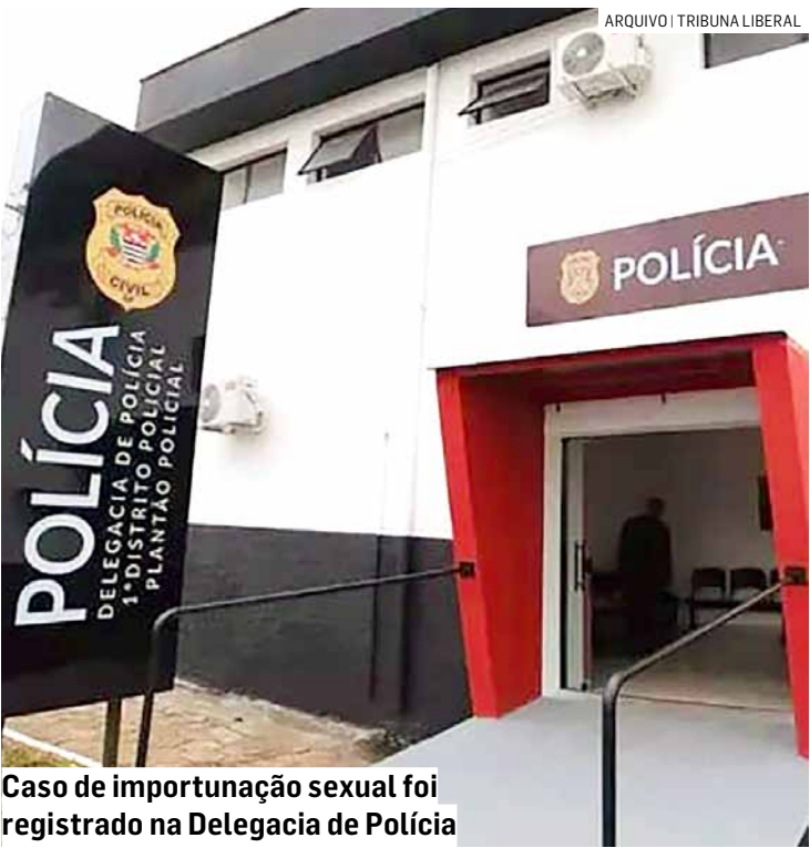
Caso de importunação sexual foi registrado na Delegacia de Polícia

rência pelos crimes de violência doméstica e maus-tratos. Os responsáveis permaneceram presos à disposição da Justiça, enquanto as crianças ficaram sob os cuidados do Conselho Tutelar.