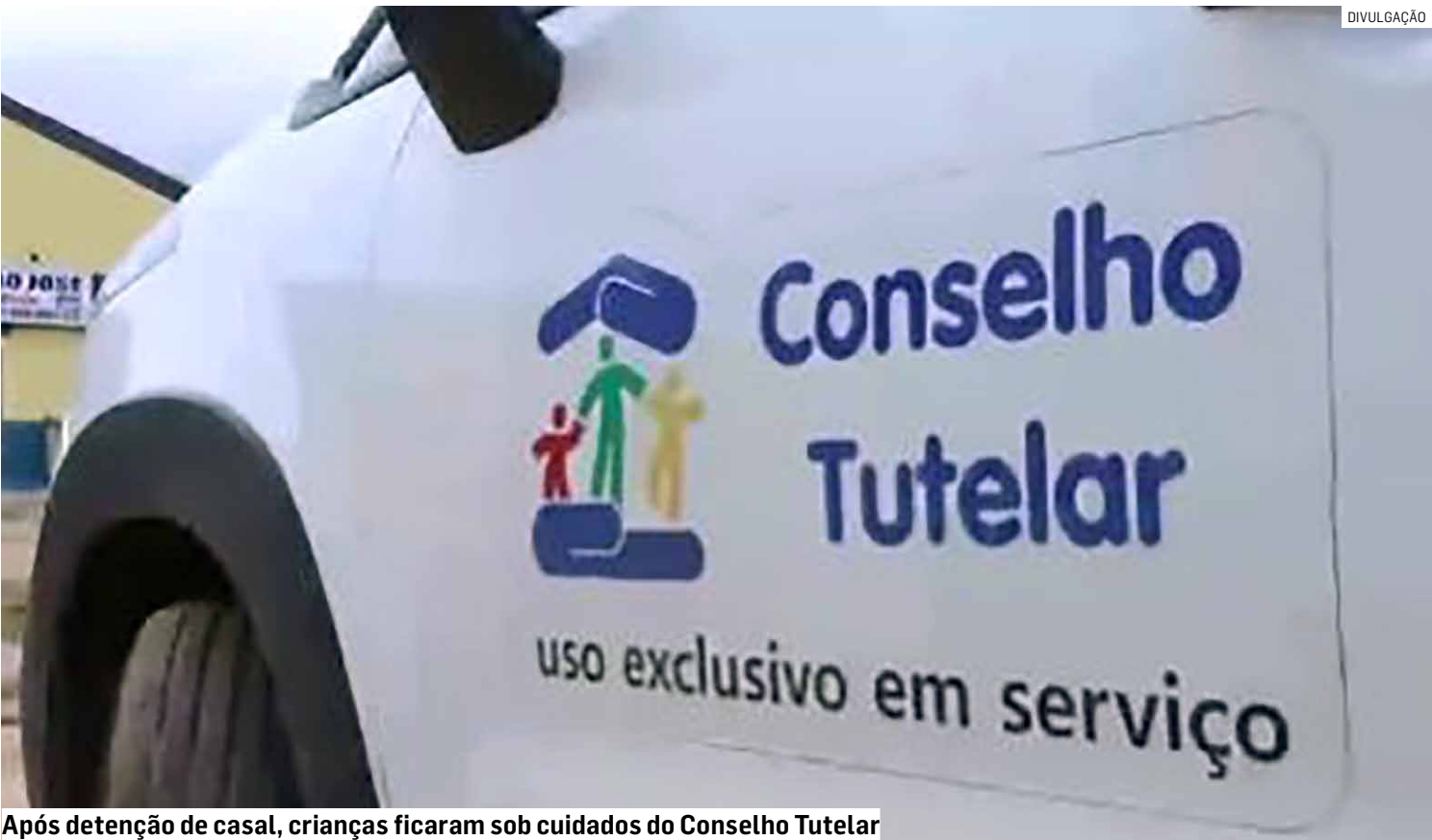
Após detenção de casal, crianças ficaram sob cuidados do Conselho Tutelar

Ainda no interior da residência, os policiais constataram a presença de duas crianças, uma de 9 anos e outra com apenas 4 meses