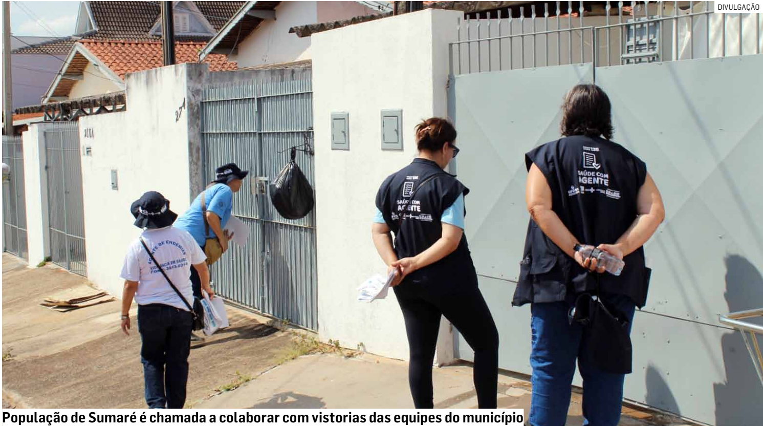
População de Sumaré é chamada a colaborar com vistorias das equipes do município

A Prefeitura de Sumaré lançou nesta semana a campanha “A Dengue Mora Onde Você Não Olha”, com o objetivo de reforçar a conscientização da população sobre a importância do combate contínuo ao mosquito Aedes aegypti . A iniciativa é coordenada pela Secretaria Municipal de Saúde, que mantém ações permanentes de prevenção e controle da doença em todas as regiões do município. De acordo com a Secretaria de Saúde, o trabalho das equipes de Controle de Arboviroses é realizado diariamente e inclui visitas domiciliares, orientações à população e eliminação de possíveis focos do mosquito. As ações são intensificadas neste período em razão das chuvas aliadas às altas temperaturas, cenário que favorece a proliferação do Aedes aegypti . A pasta reforça a importância da participação da