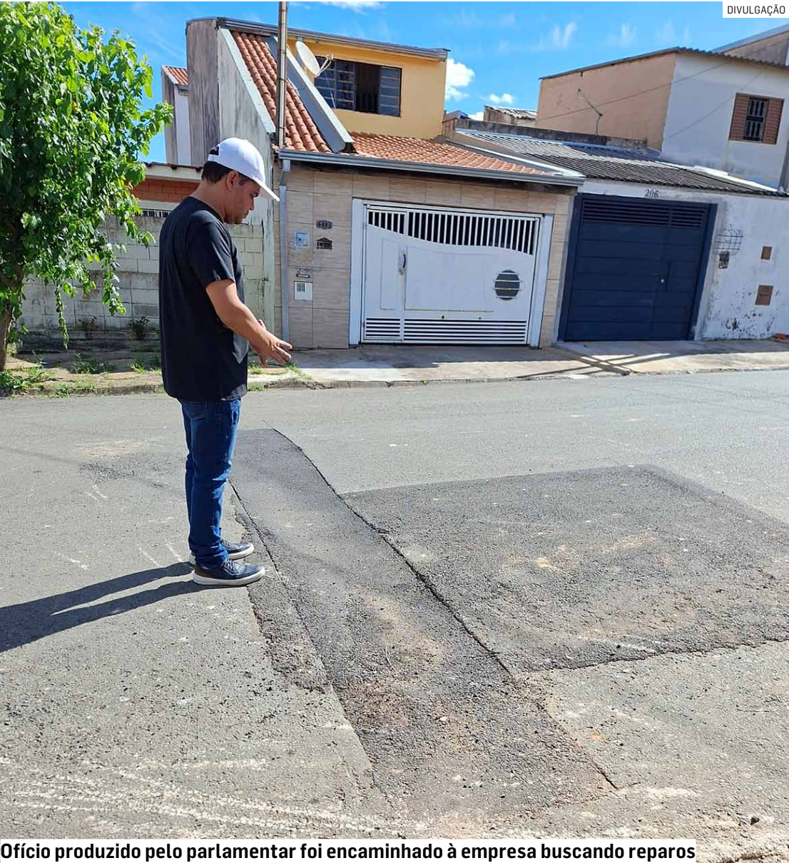
Ofício produzido pelo parlamentar foi encaminhado à empresa buscando reparos

Parlamentar pede solução para danos no pavimento após obras na rede de água e esgoto da cidade; BRK destaca que realizou vistoria nos endereços citados e equipes iniciaram melhorias nesta sexta-feira, refazendo asfalto nos locais