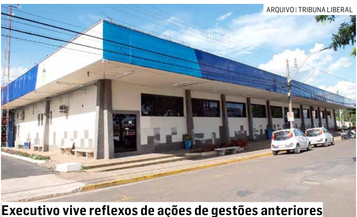
Executivo vive reflexos de ações de gestões anteriores

A referida lei institui o Conselho, não prevenindo instrumentos específicos de tombamento ou outras medidas legais complementares de proteção do patrimônio, o que demanda adequações normativas. “Desde sua criação, o município passou por reorganizações administrativas, incluindo o desmembramento, em 2024, da então Secretaria de Educação, Cultura e Turismo, com reflexos na gestão administrativa e documental. Diante