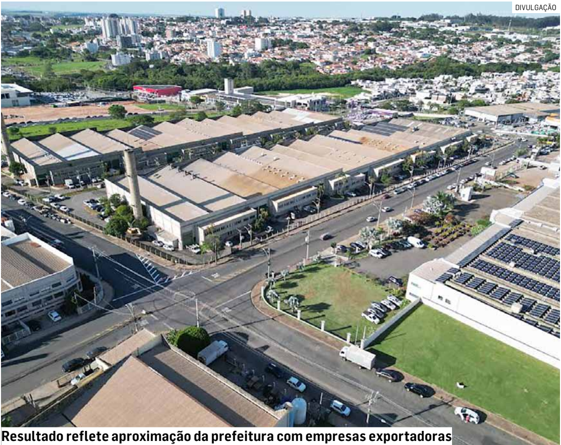
Resultado reflete aproximação da prefeitura com empresas exportadoras

Os números fazem com que a cidade seja a maior exportadora da Região do Polo Têxtil (RPT), que inclui os municípios de Santa Bárbara d'Oeste, Nova Odessa, Hortolândia e Sumaré. Americana também é a única, das cinco, com balança comercial positiva, resultado de um volume maior de vendas ao exterior do que de compras. Os países para onde Americana mais exportou foram Alemanha (US$ 297,7 mi), Bélgica (US$ 41,6 mi), México (US$ 39,5 mi), Argentina (US$ 33,1 mi) e Estados Unidos (US$ 23,5 mi). Outras nações que importaram produtos americanos em 2025 foram Chile, África do Sul, Colômbia, Peru, Equador, Uruguai, Paraguai, França, Singapura, Costa do Marfim, Guatemala, Bolívia, China