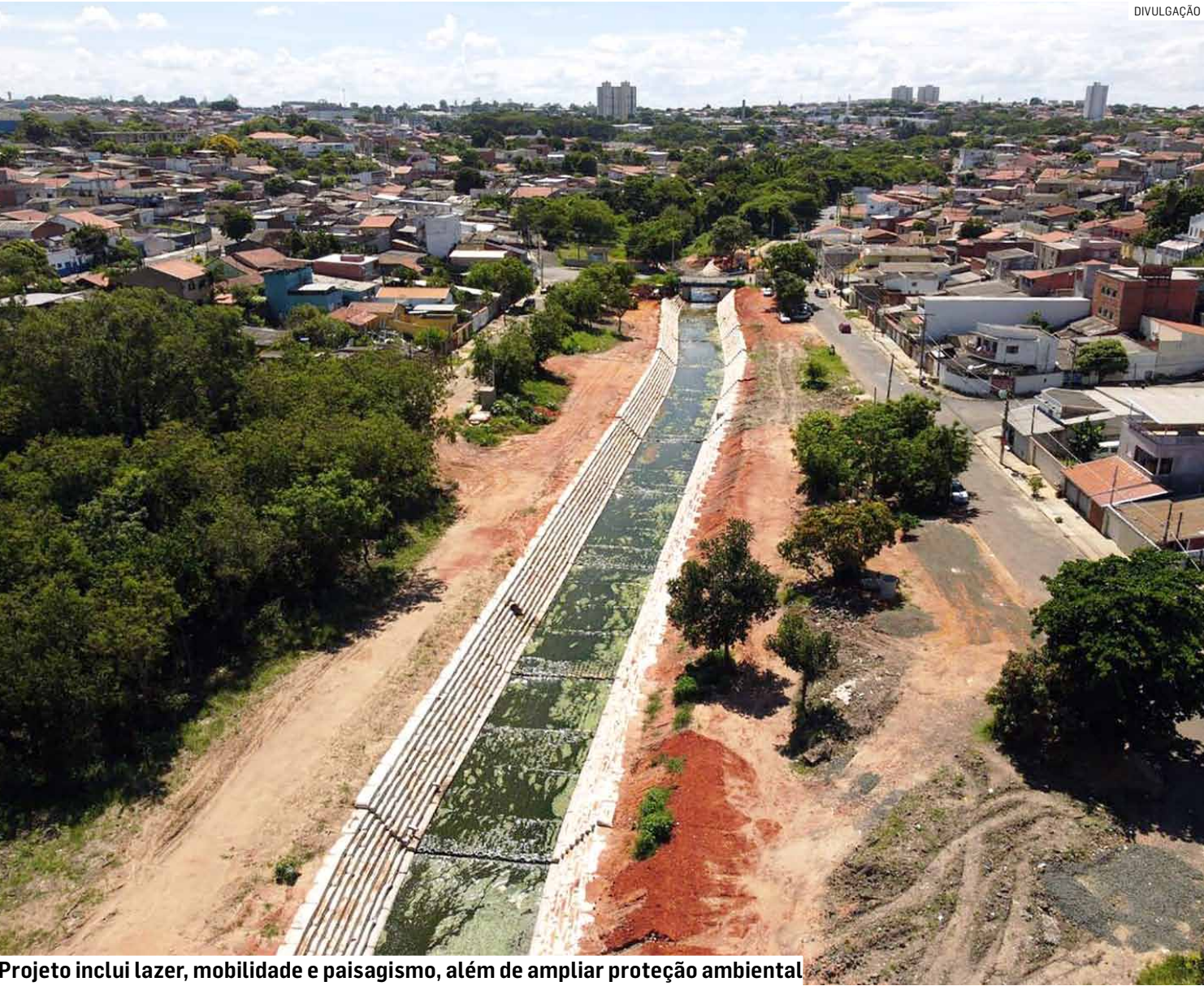
Projeto inclui lazer, mobilidade e paisagismo, além de ampliar proteção ambiental

Serviço antecede o início da obra do futuro parque socioambiental que será implantado na região pela prefeitura; trecho do ribeirão recebe revestimento em concreto e a previsão é concluir trabalho nos próximos dias, diz município