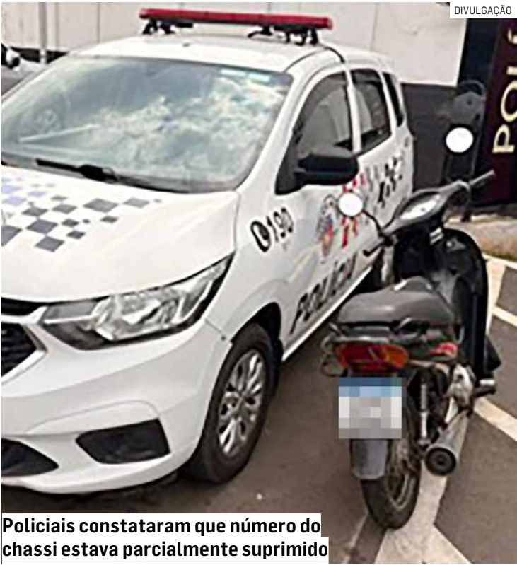
Policiais constataram que número do chassi estava parcialmente suprimido

A condutora permaneceu à disposição da Justiça, aguardando deliberação sobre eventual audiência de custódia e possíveis desdobramentos do caso.