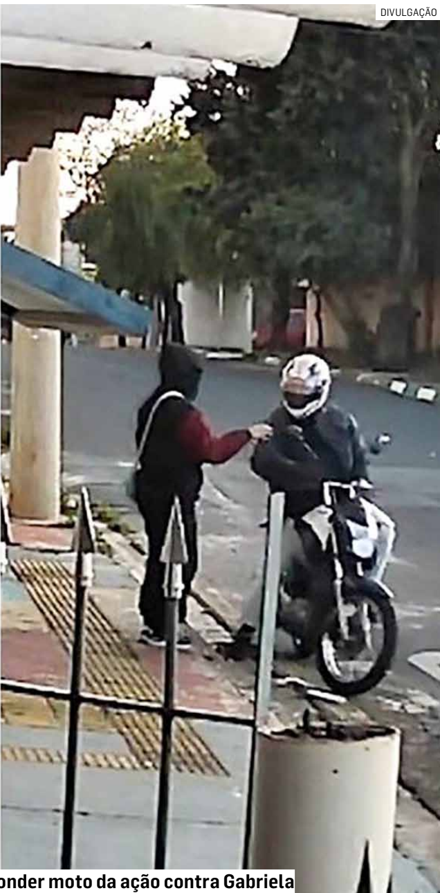
Um dos suspeitos seria o autor do disparo e o outro teria ajudado a esconder moto da ação contra Gabriela

Cézar Oliveira • HORTOLÂNDIA tribunaliberal@tribunaliberal.com.br