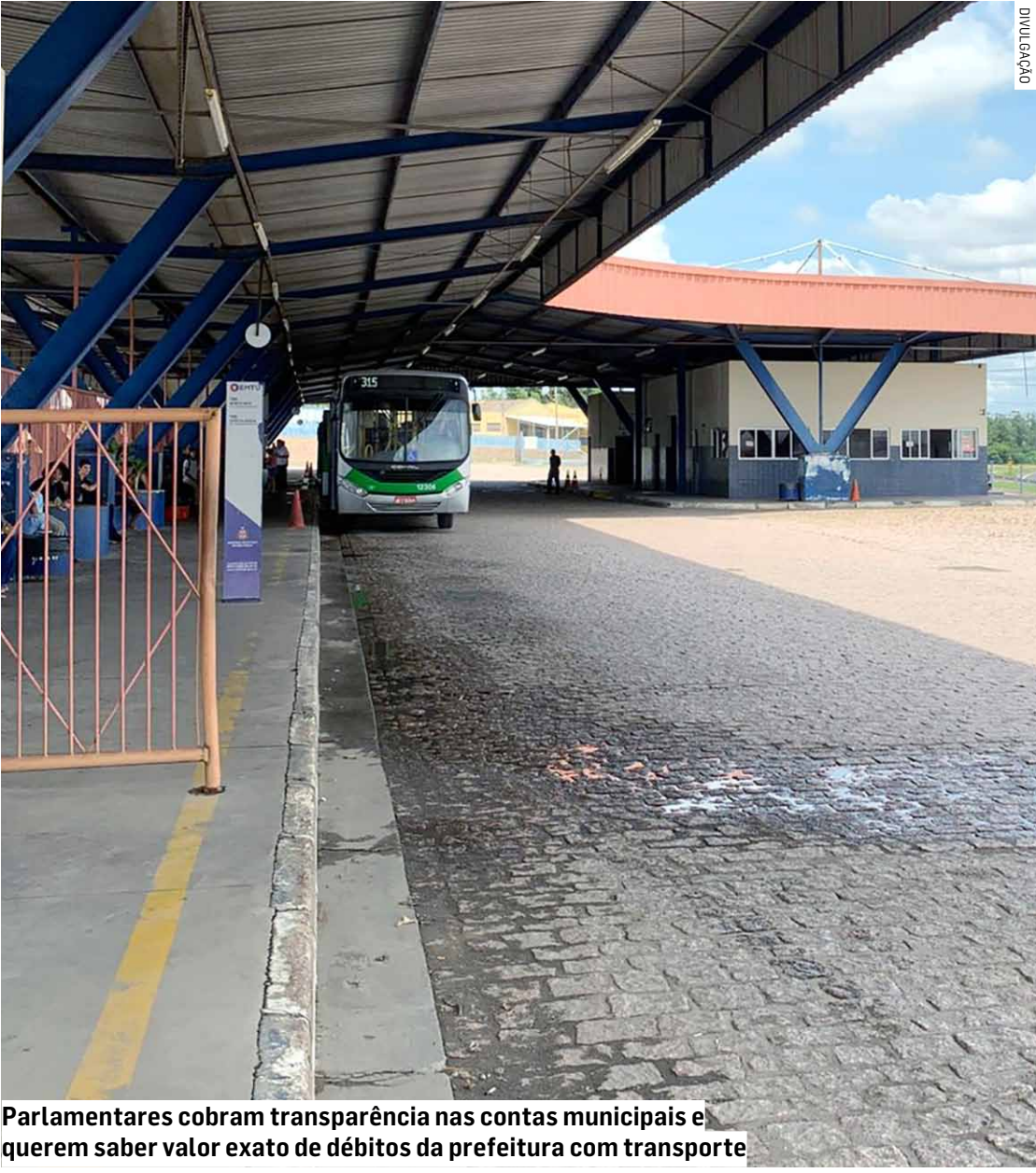
Parlamentares cobram transparência nas contas municipais e querem saber valor exato de débitos da prefeitura com transporte