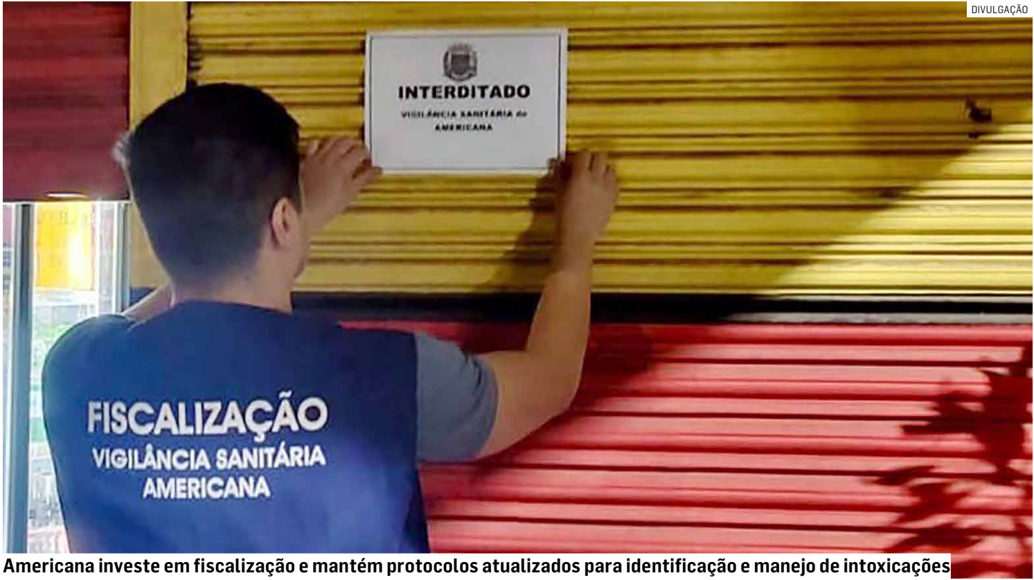
Americana investe em fiscalização e mantém protocolos atualizados para identificação e manejo de intoxicações

Não há registro de casos de intoxicação por metanol no município. As equipes seguem em alerta preventivo, com ações voltadas tanto à inspeção de pontos de venda quanto à orientação das redes pública e privada de saúde sobre os protocolos de identificação e manejo de casos suspeitos.