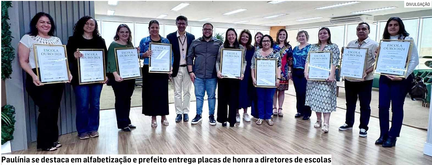
Paulínia se destaca em alfabetização e prefeito entrega placas de honra a diretores de escolas

Da Redação • PAULÍNIA tribunaliberal@tribunaliberal.com.br