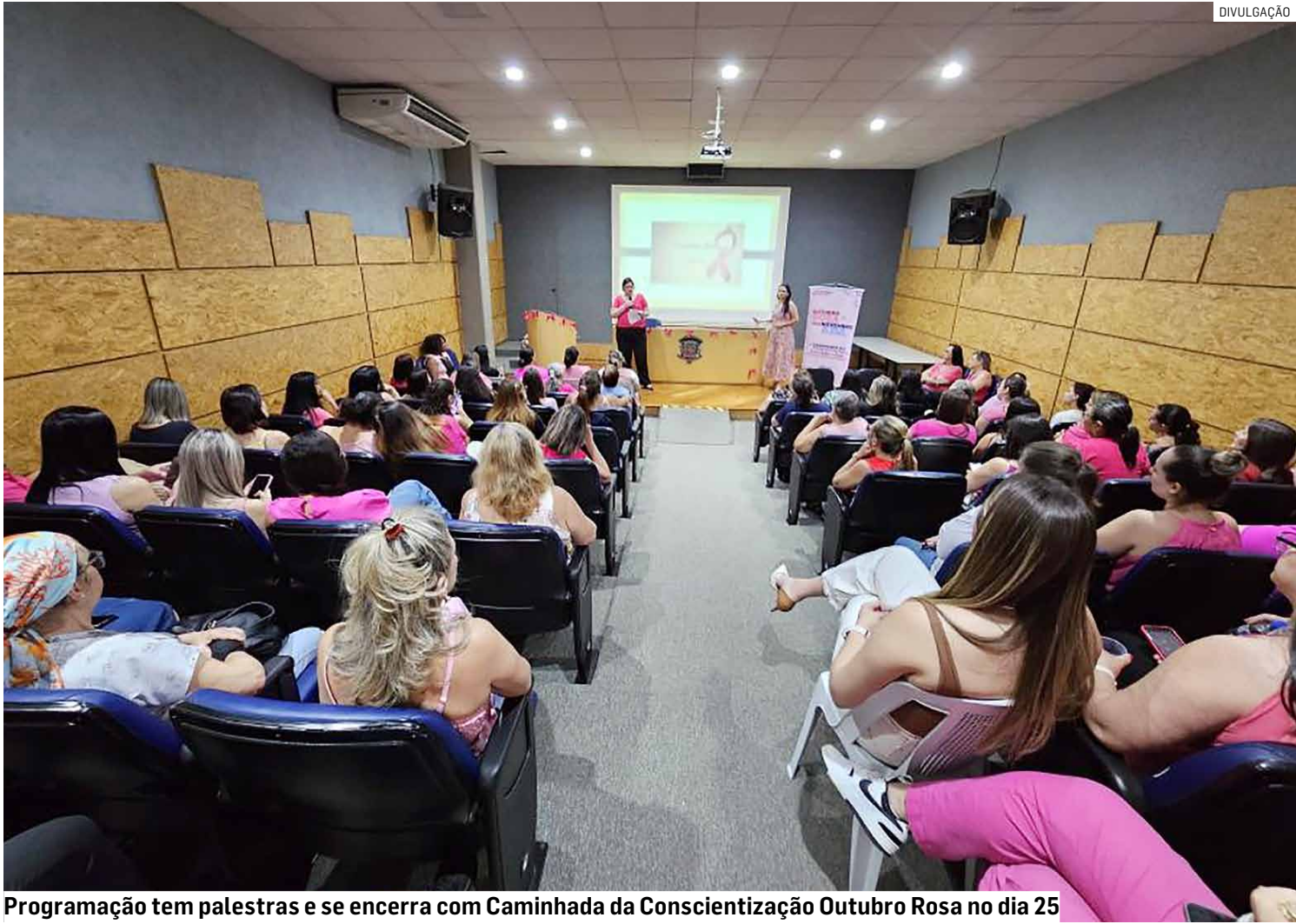
Programação tem palestras e se encerra com Caminhada da Conscientização Outubro Rosa no dia 25

As ações seguem na quinta-feira (16), às 8h, no CRESAM (Centro de Referência da Saúde da Mu-