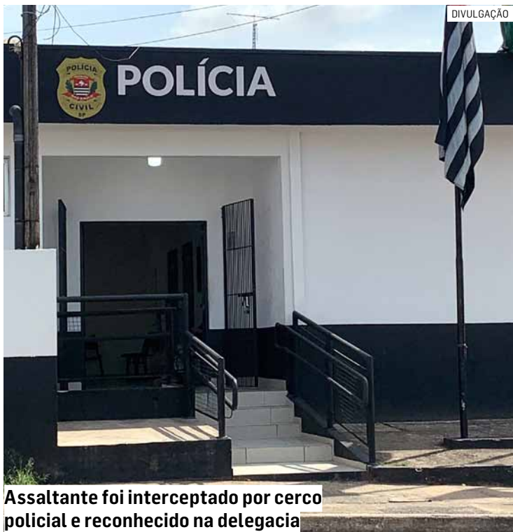
Assaltante foi interceptado por cerco policial e reconhecido na delegacia

O suspeito permaneceu preso e ficou à disposição da Justiça para audiência de custódia.