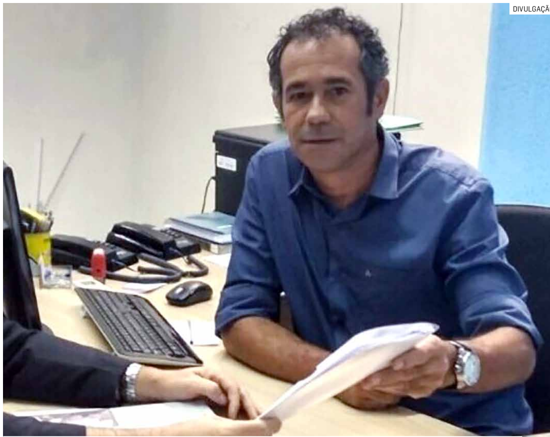
Investigação da Polícia Federal envolve suspeitas de fraude em licitação da prefeitura

De acordo com os defensores, somente após o acesso completo ao acórdão será possível realizar análise técnica dos fundamentos adotados pela Justiça Federal.