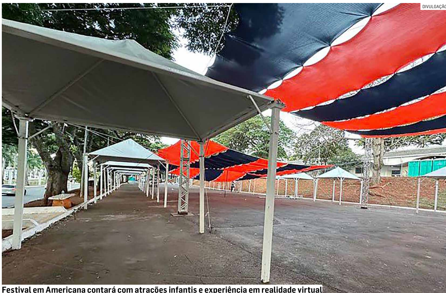
Festival em Americana contará com atrações infantis e experiência em realidade virtual

O Brasa Blue terá gastronomia de brasa e atrações musicais inéditas. Na praça de alimentação, estão confirmados estabelecimentos como Tutano Parrilla, La Boca, Pedro Spadaro, Icy Gelato e Cervejaria Kalango. O público também poderá consumir uma cerveja autoral exclusiva, desenvolvida especialmente para o evento.