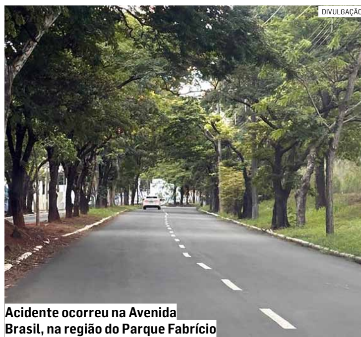
Acidente ocorreu na Avenida Brasil, na região do Parque Fabrício

Apesar do impacto, o condutor foi encontrado consciente pelas equipes de resgate. Profissionais do Samu realizaram os primeiros atendimentos ainda no local antes de encaminhá-lo ao Hospital Municipal de Nova Odessa para avaliação médica.