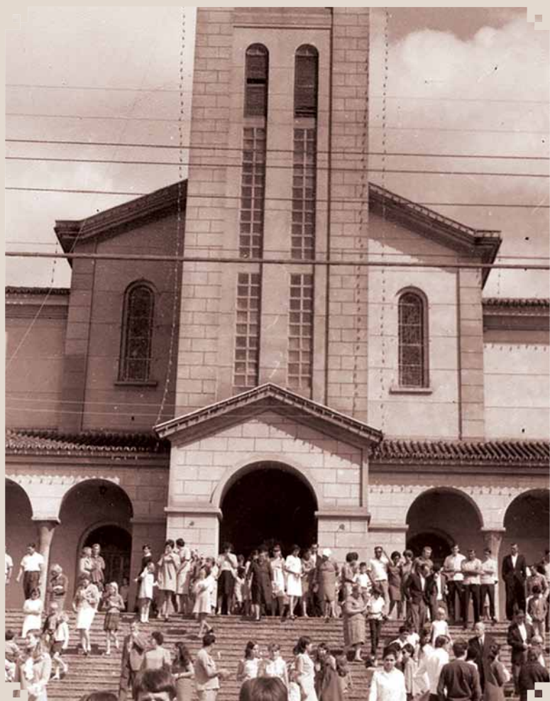
Foto da Igreja Matriz de Sant'Ana no ano de 1968. A cidade comemorava seu 100. Aniversário de fundação e o público mostrado nas escadarias saía de uma solenidade alusiva à data. A torre estava decorada com a iluminação do Centenário.