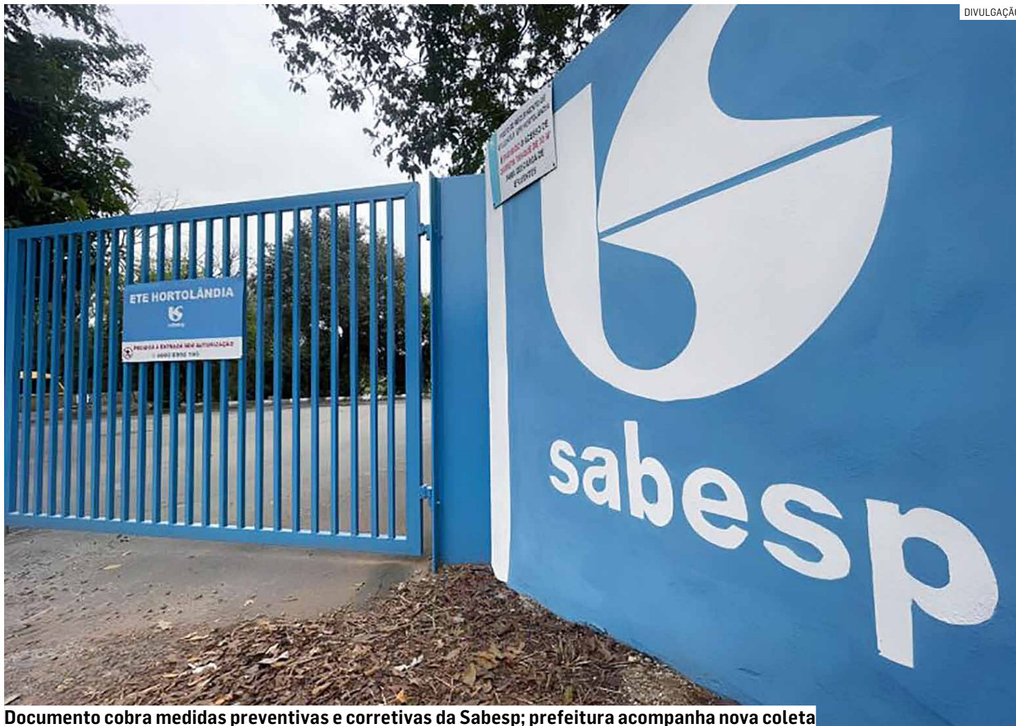
Documento cobra medidas preventivas e corretivas da Sabesp; prefeitura acompanha nova coleta

Em relatório compartilhado com membros do Comitê de Gestão de Crise criado pelo prefeito Zezé Gomes (Republicanos), a equipe da agência aponta que, apesar de não terem sido apresentados, até o momento da fiscalização, laudos laboratoriais conclusivos sobre a origem dos problemas, foi possível constatar de forma recorrente a presença de alterações sensoriais na água produzida.