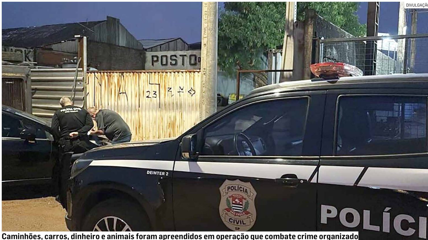
Caminhões, carros, dinheiro e animais foram apreendidos em operação que combate crime organizado

As investigações apontam que empresas dos setores de transporte, rodeio