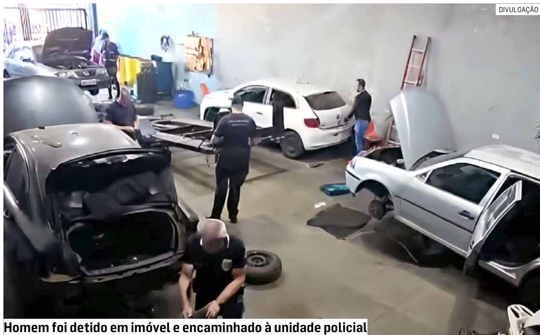
Homem foi detido em imóvel e encaminhado à unidade policial

Todo o material apreendido passará por perícia técnica, que deverá auxiliar na identificação da origem das peças e no aprofundamento das investigações. A Polícia Civil apura agora se o local fazia parte de um esquema criminoso especializado em desmanche e comercialização ilegal de componentes automotivos na região.