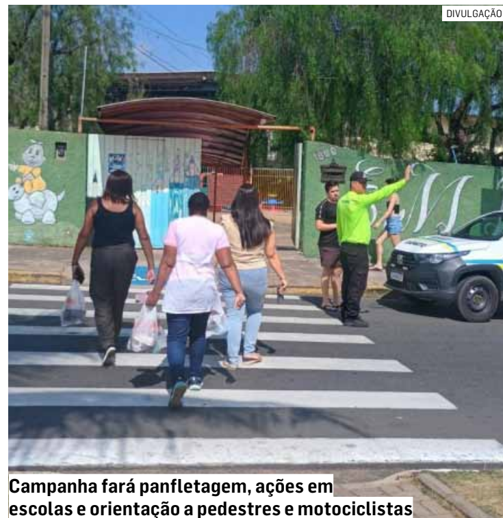
Campanha fará panfletagem, ações em escolas e orientação a pedestres e motociclistas

Durante a campanha, também haverá reforço nas orientações em pontos com maior circulação de alunos, intensificando a atenção à travessia e à segurança no entorno escolar, especialmente nos horários de entrada e saída, quando há maior fluxo de crianças.