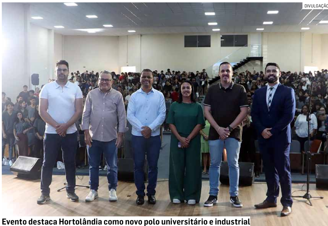
Evento destaca Hortolândia como novo polo universitário e industrial

Dos alunos presentes, a maioria já está entre os 17 e 18 anos, seguindo para a