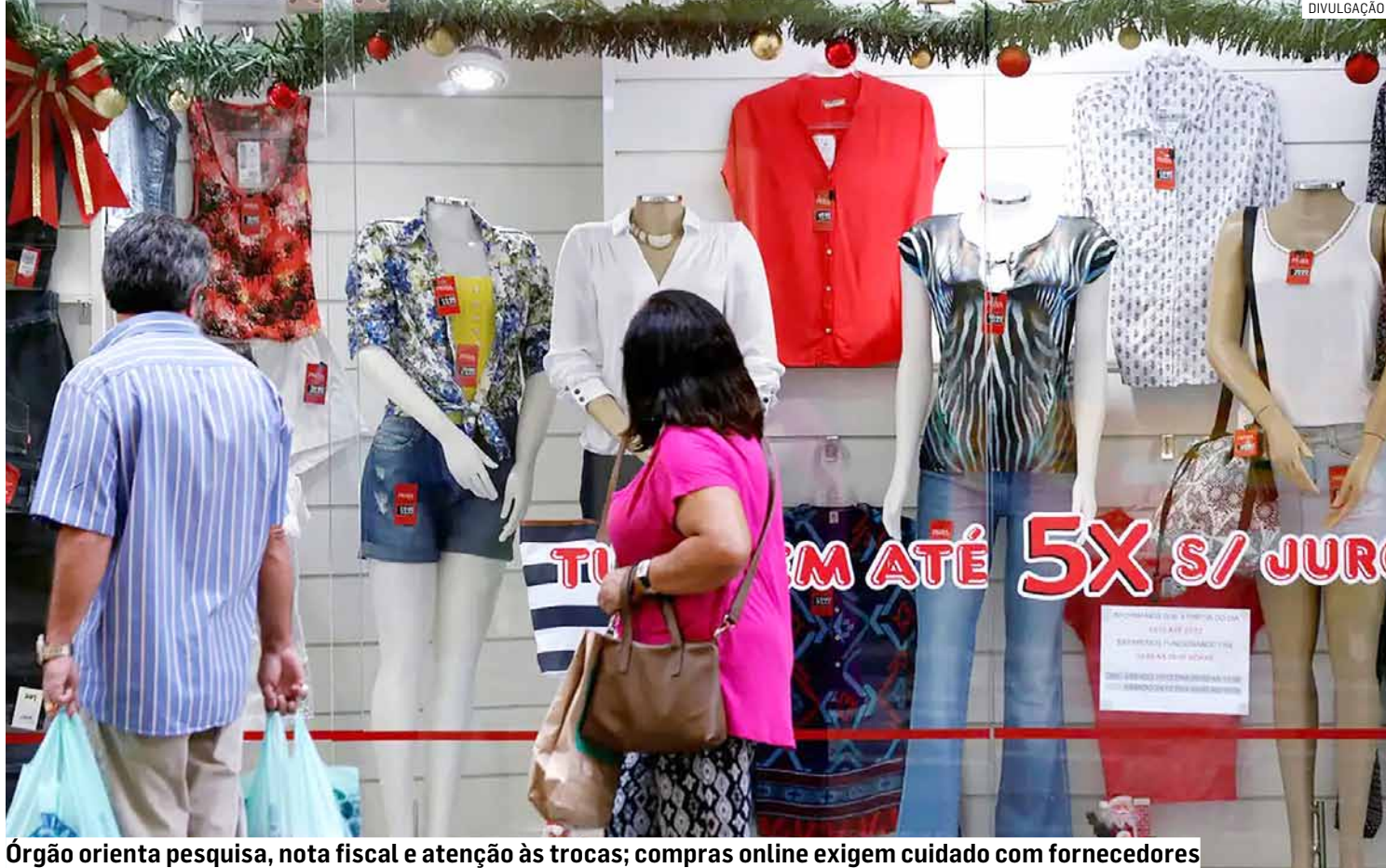
Órgão orienta pesquisa, nota fiscal e atenção às trocas; compras online exigem cuidado com fornecedores

Entre os presentes mais buscados estão perfumes, cosméticos, roupas, flores