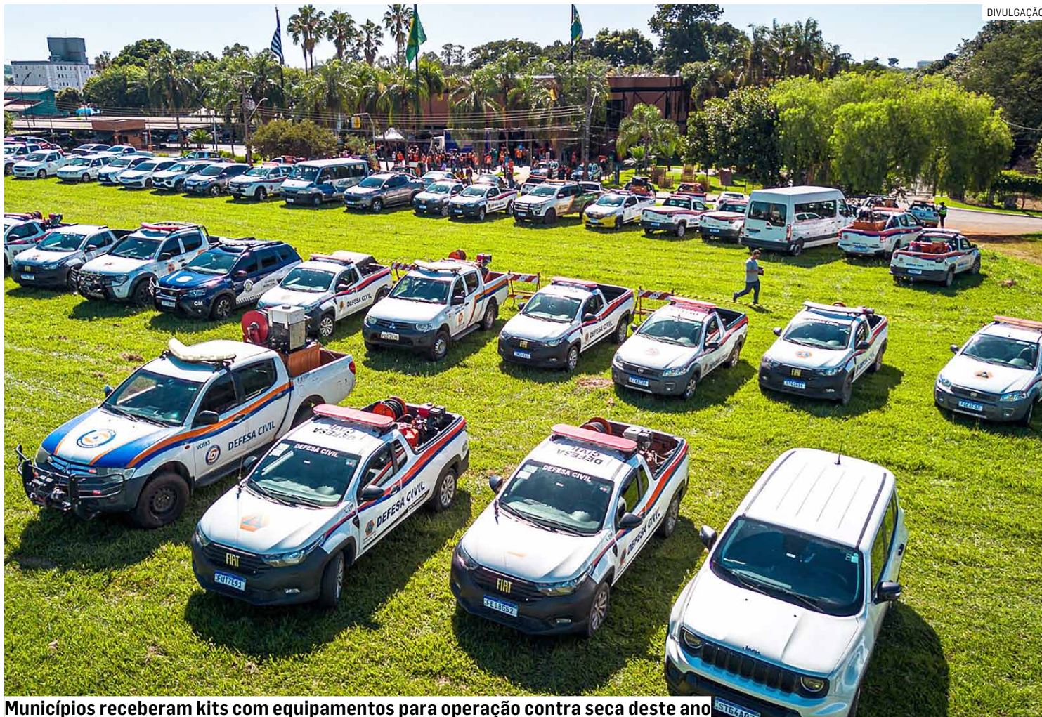
Municípios receberam kits com equipamentos para operação contra seca deste ano

“Este encontro reafirma, acima de tudo, a importância da parceria entre Estado e municípios. Trabalhar com a prevenção é sempre o melhor caminho em todas as esferas da gestão pública e Paulínia está preparada para atuar e atender nossa população da melhor forma possível”, declarou o prefeito.