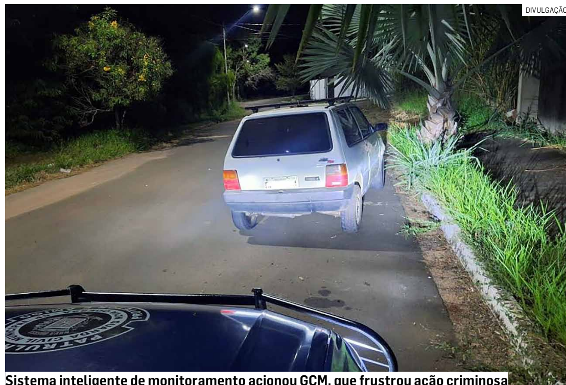
Sistema inteligente de monitoramento acionou GCM, que frustrou ação criminosa

Ao chegar no local, as equipes visualizaram um indivíduo que fugiu em di-