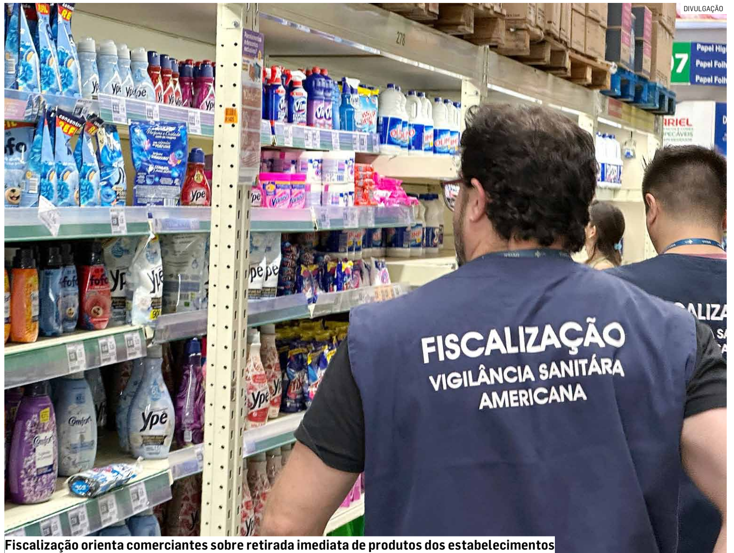
Fiscalização orienta comerciantes sobre retirada imediata de produtos dos estabelecimentos

Segundo a agência, durante a inspeção, foram constatados descumprimentos relevantes em etapas críticas do processo produtivo, o que inclui falhas nos sistemas de garantia da qualidade, produção e controle de qualidade. Os problemas identificados comprometem o atendimento aos requisitos essenciais de Boas Práticas de Fabricação (BPF) de saneantes e indicam risco à segurança sanitária dos produtos, com possibilida-