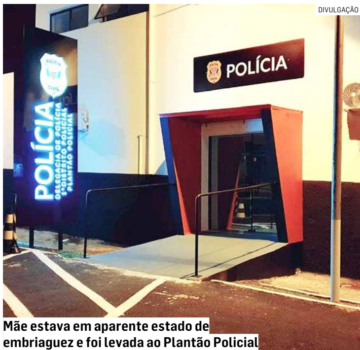
Mãe estava em aparente estado de embriaguez e foi levada ao Plantão Policial

Segundo informações da corporação, a equipe foi chamada para atender uma denúncia de agressão envolvendo criança. No local, os policiais fizeram contato com uma adolescente de 12 anos, irmã da vítima, que relatou que a mãe havia acabado de agredir fisicamente a menina. A adolescente ainda afirmou que as