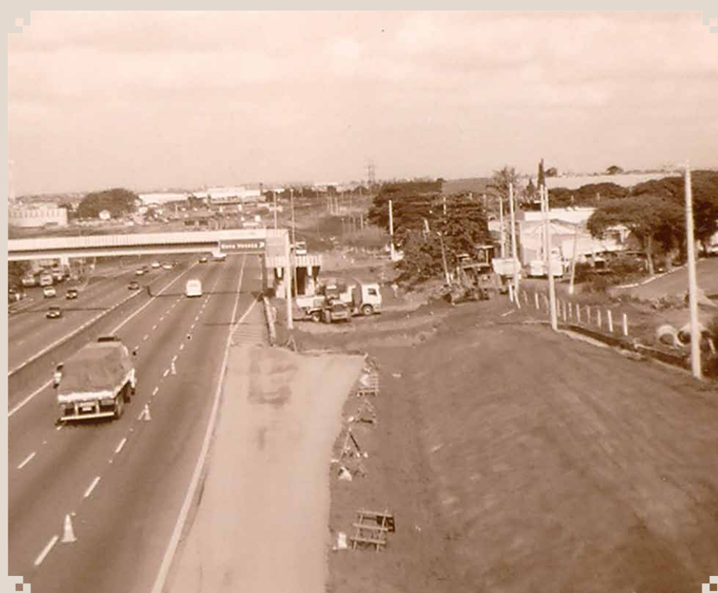
Foto do início deste século da Rodovia Anhanguera, onde se concentram as principais empresas do município. O lado direito é a entrada principal para Nova Veneza.