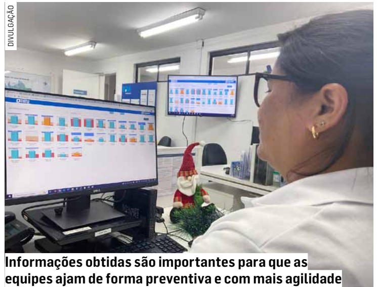
Informações obtidas são importantes para que as equipes ajam de forma preventiva e com mais agilidade

“Conseguimos ter uma visão ampla de todo o sistema e adotar medidas rápidas em caso de necessidade. Por exemplo, se o nível de um reservatório está alto, podemos direcionar uma equipe para fechar um registro e evitar que haja extravasamento