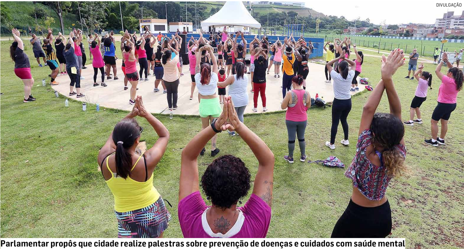
Parlamentar propôs que cidade realize palestras sobre prevenção de doenças e cuidados com saúde mental

Da Redação • PAULÍNIA tribunaliberal@tribunaliberal.com.br