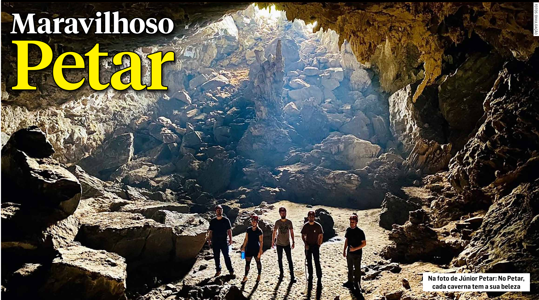
Na foto de Júnior Petar: No Petar, cada caverna tem a sua beleza

O Petar é o Parque Estadual Turístico do Alto Ribeira. Ele está localizado no extremo sul do Estado de São Paulo, entre as cidades turísticas de Apiaí e Iporanga. Os principais Núcleos de visitação são: Santana e Ouro Grosso, ambos em Iporanga. O Petar é considerado uma das Unidades de Conservação mais importantes do mundo. Abriga a maior porção de Mata Atlântica preservada do Brasil e tem mais de 300 cavernas. A Unesco reconhece como um patrimônio da humanidade. Nada mais justo. O acesso, para quem sai da capital paulistana, pode ser a rodovia Régis Bittencourt, a Castelo Branco ou Raposo Tavares. É fácil. E são doze as cavernas abertas à visitação, assim distribuídas: Santana, Água Suja, Couto, Morro Preto, Cafezal, Ouro Grosso, Alambari de Baixo, Casa de Pedra, Aroe-Jari, Peroba, Pescador e Temimina. Essas cavernas oferecem diferentes níveis de aventura e diferentes características, desde caminhadas leves até a travessia de rios e de fendas.