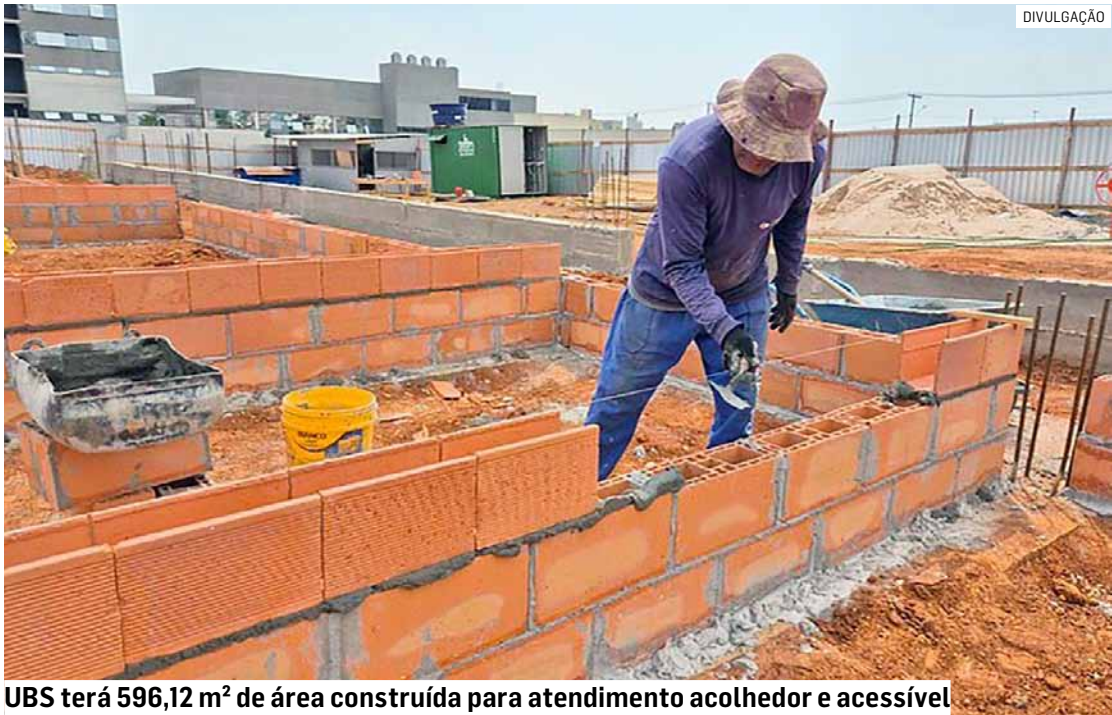
UBS terá 596,12 m² de área construída para atendimento acolhedor e acessível

Com área construída de 596,12 m², a nova UBS foi projetada para oferecer um ambiente acolhedor, funcional e acessível à população. O espaço contará com consultórios ginecológico