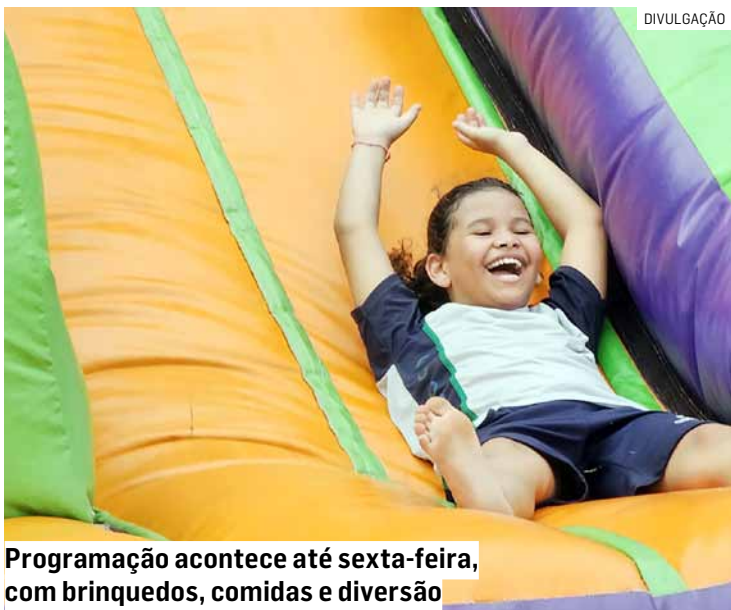
Programação acontece até sexta-feira, com brinquedos, comidas e diversão