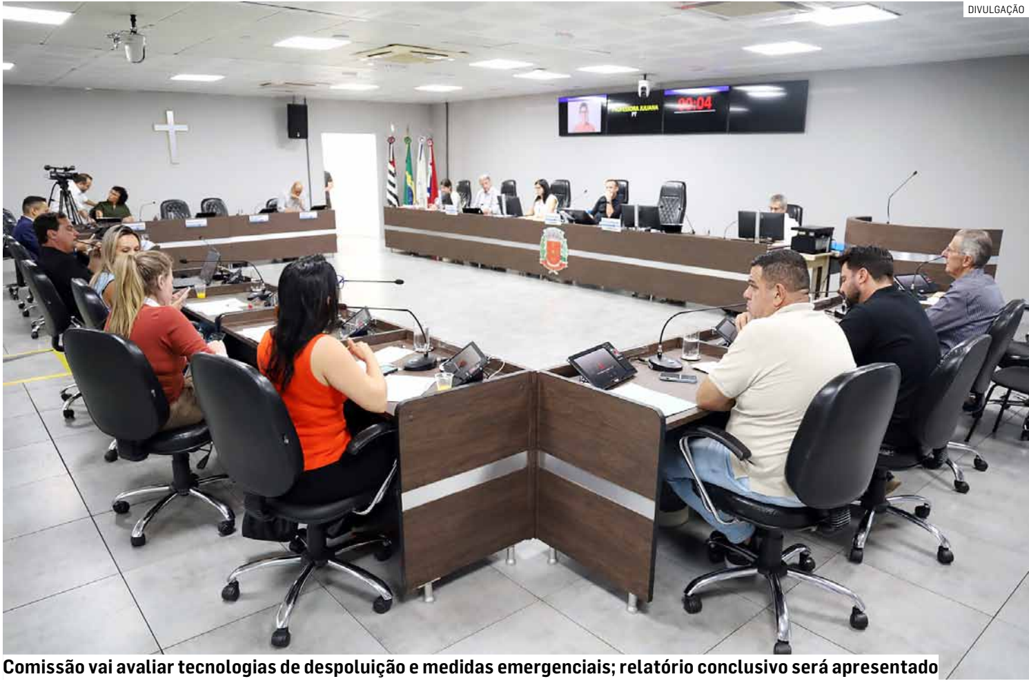
Comissão vai avaliar tecnologias de despoluição e medidas emergenciais; relatório conclusivo será apresentado

O escopo de trabalho da comissão inclui a recuperação, preservação e utilização da Represa do Salto Grande, reservatório estratégico para a região e apontado como eixo central de soluções futuras. Segundo a justificativa da proposta, o manancial possui área total de 783 km² e volume de 5.000 m³. O colegiado realizará estudos técnicos, analisará tecnologias de despoluição do corpo hídrico e articulará recursos nos âmbitos estadual e federal para acelerar intervenções. O prazo para entrega do relatório conclusivo é de 180 dias, com recomendações de curto, médio e longo prazos.