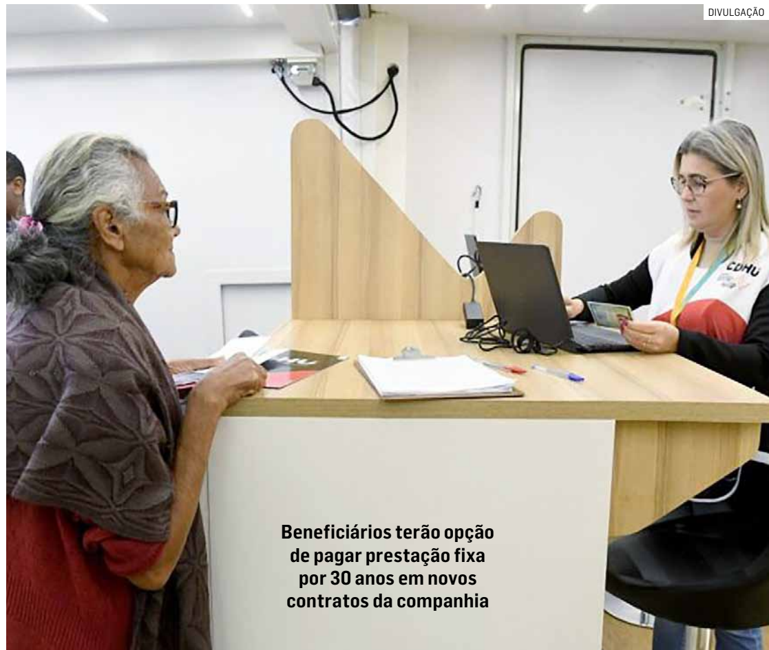
Beneficiários terão opção de pagar prestação fixa por 30 anos em novos contratos da companhia

De acordo com a CDHU, a principal vantagem do novo modelo é a previsibilidade das parcelas. Como o valor não sofre reajuste, as famílias ficam protegidas das oscilações econômicas e da inflação ao