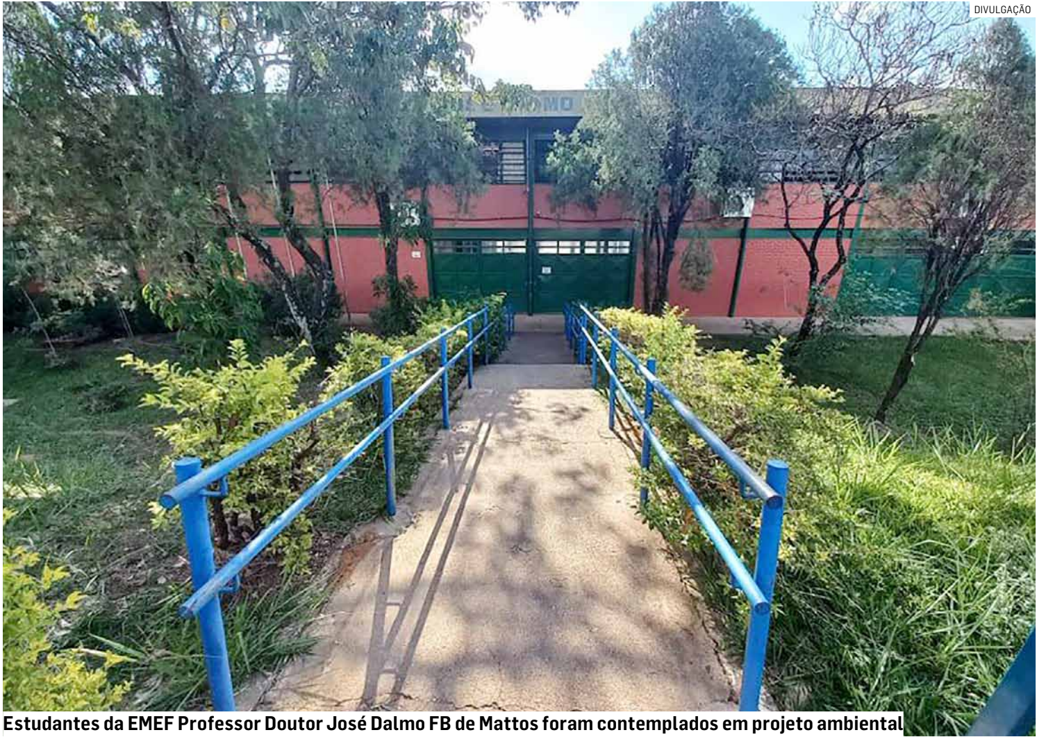
Estudantes da EMEF Professor Doutor José Dalmo FB de Mattos foram contemplados em projeto ambiental

Em um primeiro dia, pouco mais de 500 estu-