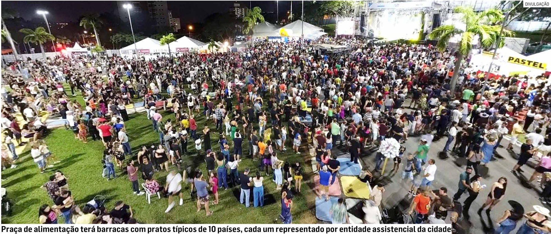
Praça de alimentação terá barracas com pratos típicos de 10 países, cada um representado por entidade assistencial da cidade

A Banda Sinfônica Municipal abre novamente a programação no segundo dia de evento, seguida pela apresentação do Clube da Melhor Idade. A noite con-