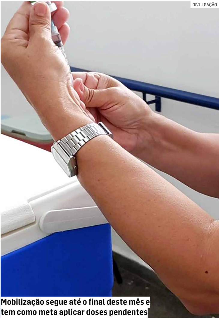
Mobilização segue até o final deste mês e tem como meta aplicar doses pendentes

Também estão sendo aplicadas doses contra o HPV para adolescentes de 15 a 19 anos que nunca se vacinaram contra a doença. A ação, chamada de “resgate”, teve início em setembro e contempla meninas e meninos nessa