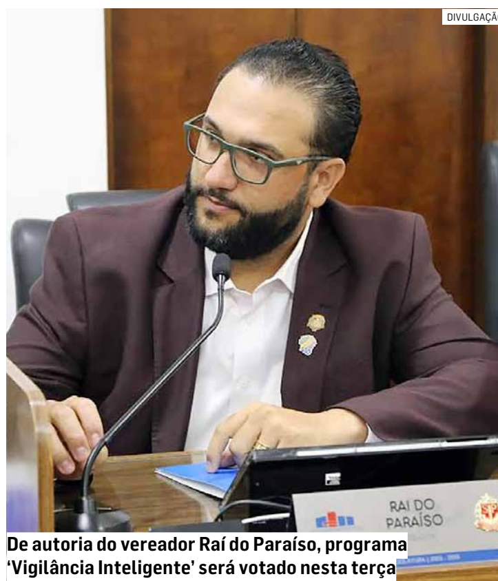
De autoria do vereador Raí do Paraíso, programa 'Vigilância Inteligente' será votado nesta terça

O texto estabelece que os drones deverão ser operados exclusivamente por agentes da Guarda Municipal devidamente treinados, com integração ao sistema de monitoramento da cidade. A viabilização do pro-