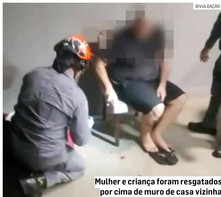
Mulher e criança foram resgatados por cima de muro de casa vizinha

César Oliveira • AMERICANA tribunaliberal@tribunaliberal.com.br