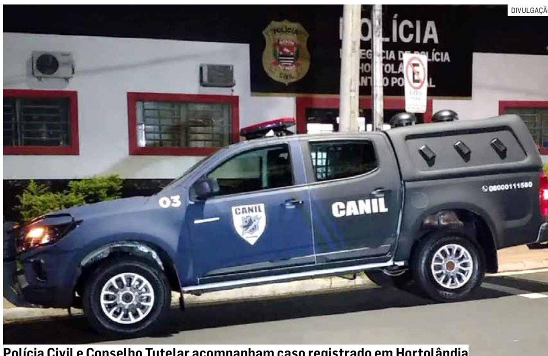
Polícia Civil e Conselho Tutelar acompanham caso registrado em Hortolândia

De acordo com o relato da mãe, os adolescentes saíram de casa na noite de sábado (4), sem informar o destino. A publica-