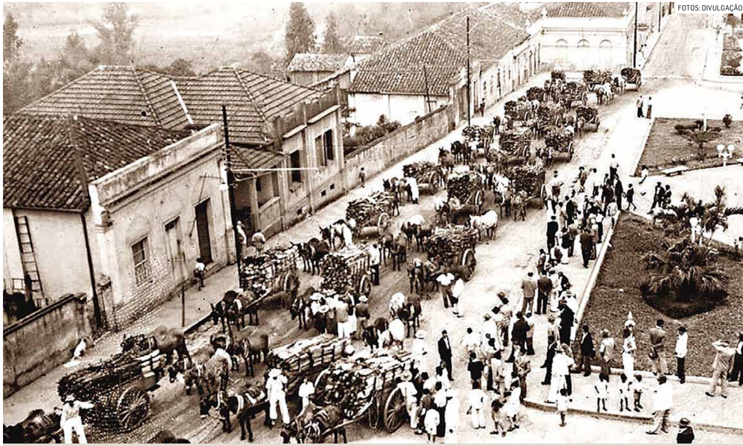
Leilão da Lenha

As tradicionais festas de São Benedito, em Monte Mor, nunca tiveram datas fixas para sua realização. Durante os anos de meados do século XX elas aconteciam durante o mês de setembro. Desemrolavam-se por três semanas consecutivas e era em louvor a São Benedito, Nossa Senhora do Patrocínio, São Sebastião e São Roque. Começavam numa sexta-feira quando era realizado um tríduo preparatório em louvor à Nossa Senhora do Patrocínio, padroeira da cidade.