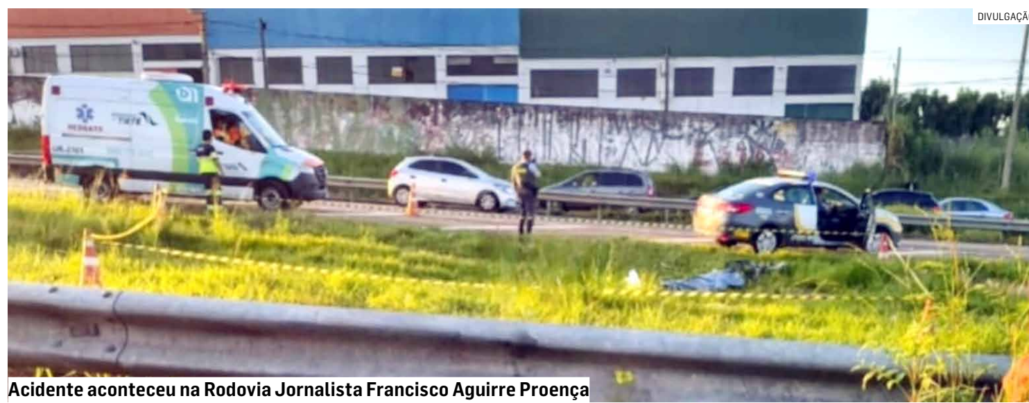
Acidente aconteceu na Rodovia Jornalista Francisco Aguirre Proença

Cézar Oliveira • HORTOLÂNDIA tribunaliberal@tribunaliberal.com.br