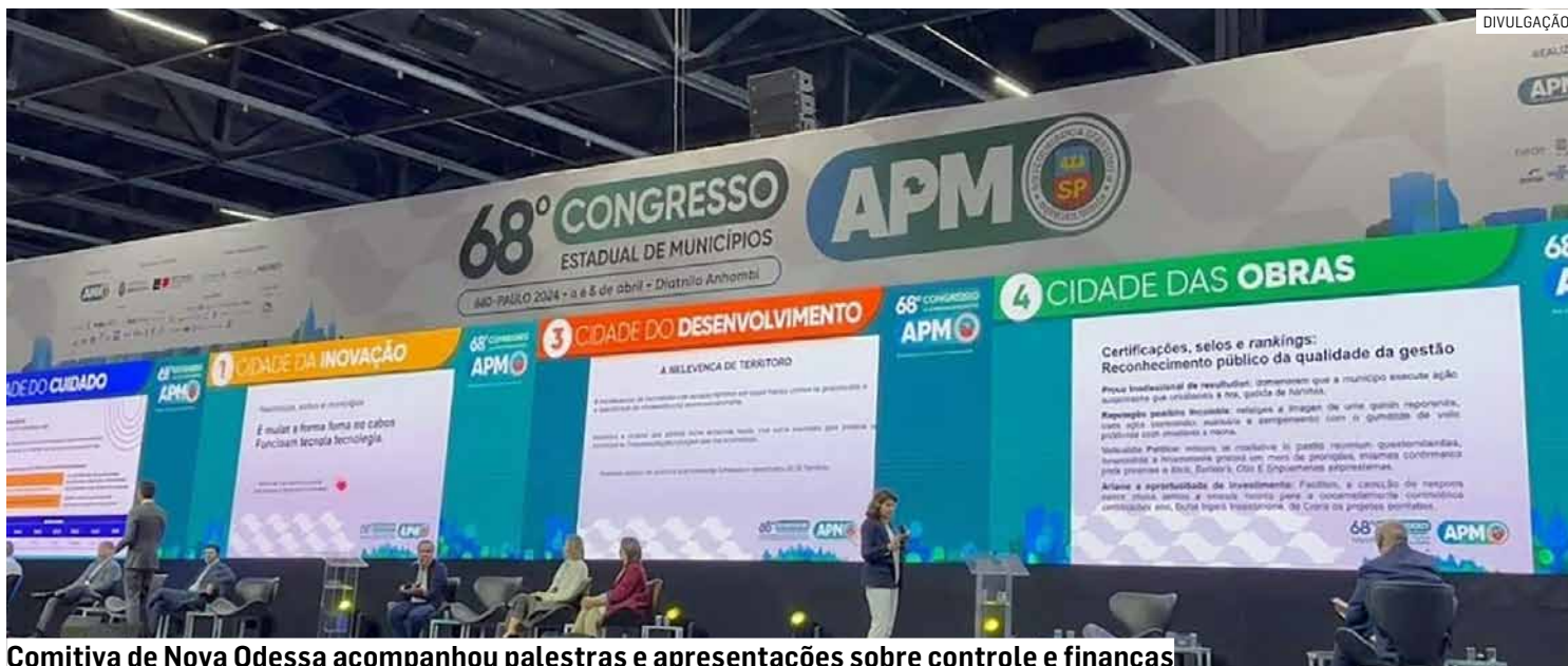
Comitiva de Nova Odessa acompanhou palestras e apresentações sobre controle e finanças

Com foco em capacitação técnica e troca de experiências em temas estratégicos para a administração