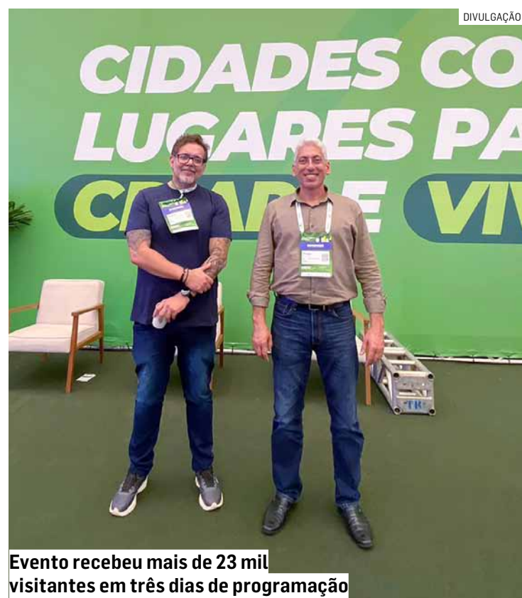
Evento recebeu mais de 23 mil visitantes em três dias de programação

Segundo a administração municipal, a troca de conhecimento proporcionada pelo evento contribui diretamente para o aprimoramento de projetos estratégicos em andamento.