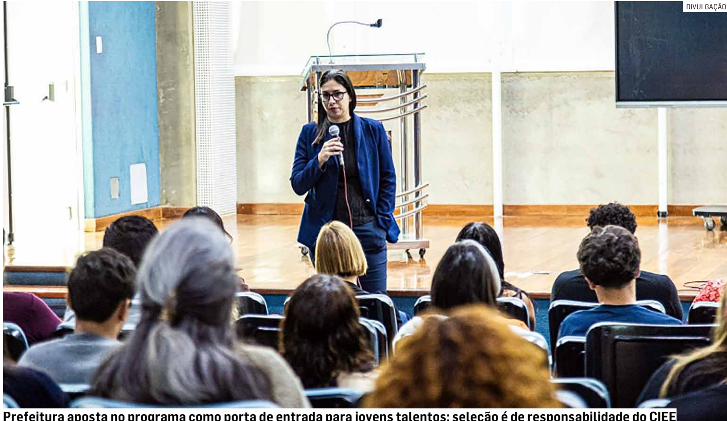
Prefeitura aposta no programa como porta de entrada para jovens talentos; seleção é de responsabilidade do CIEE

Os selecionados irão cumprir jornada de 30 horas semanais e terão direito a bolsa auxílio no valor de R$ 1.320 por mês, além de auxílio transporte de R$ 44 mensais.