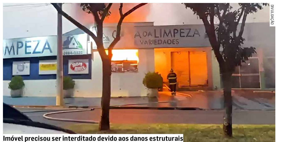
Imóvel precisou ser interditado devido aos danos estruturais

Equipes da Defesa Civil também estiveram no local para apoio e isolamento da área. Ninguém ficou ferido e o caso será investigado pela Polícia Civil.