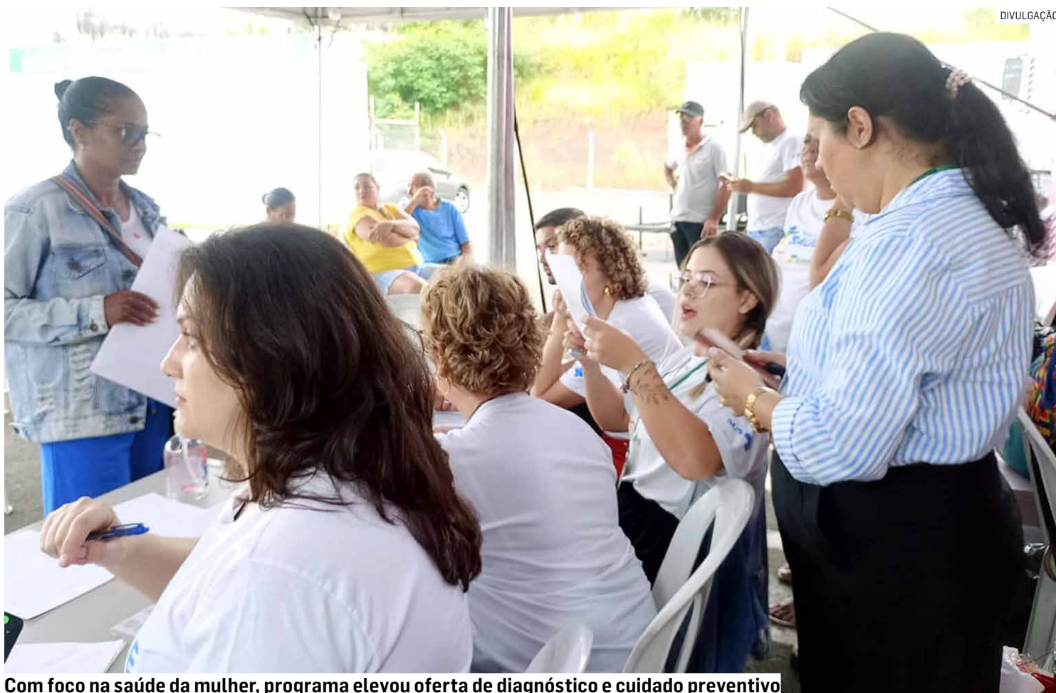
Com foco na saúde da mulher, programa elevou oferta de diagnóstico e cuidado preventivo