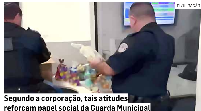
Segundo a corporação, tais atitudes reforçam papel social da Guarda Municipal

Além das doações, os agentes também interagiram com as crianças e familiares, promovendo aproximação com a comunidade e fortalecendo vínculos. Um dos destaques da noite foi o passeio de trenzinho, que garantiu diversão aos participantes e marcou a ação de forma especial. A atividade recreativa foi um dos momentos mais aguardados pelas crianças.