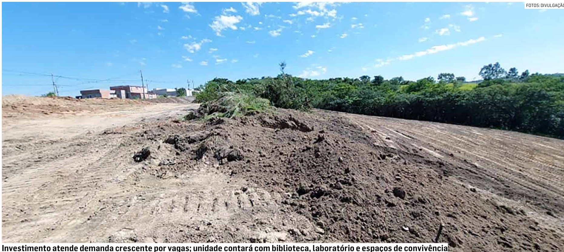
Investimento atende demanda crescente por vagas; unidade contará com biblioteca, laboratório e espaços de convivência.

A nova escola seguirá o padrão arquitetônico do FNDE e contará com 13 salas de aula, com capacidade