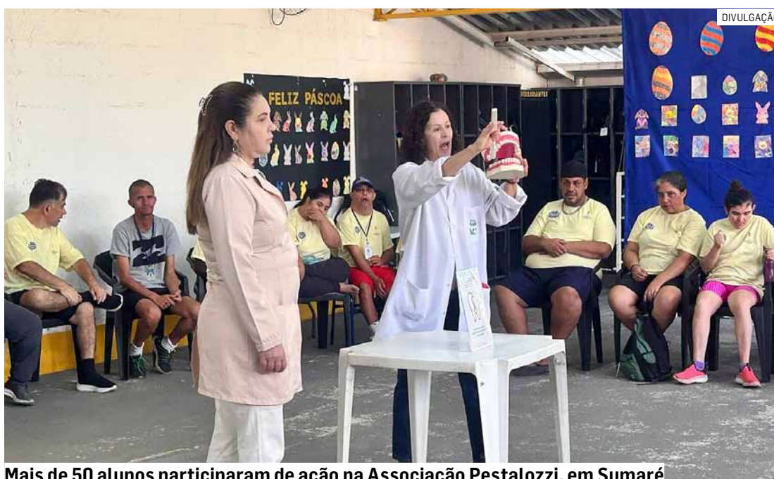
Mais de 50 alunos participaram de ação na Associação Pestalozzi, em Sumaré

Durante a atividade, os profissionais orientaram os participantes sobre a importância da higiene oral e dos cuidados diários com a boca, como a técnica