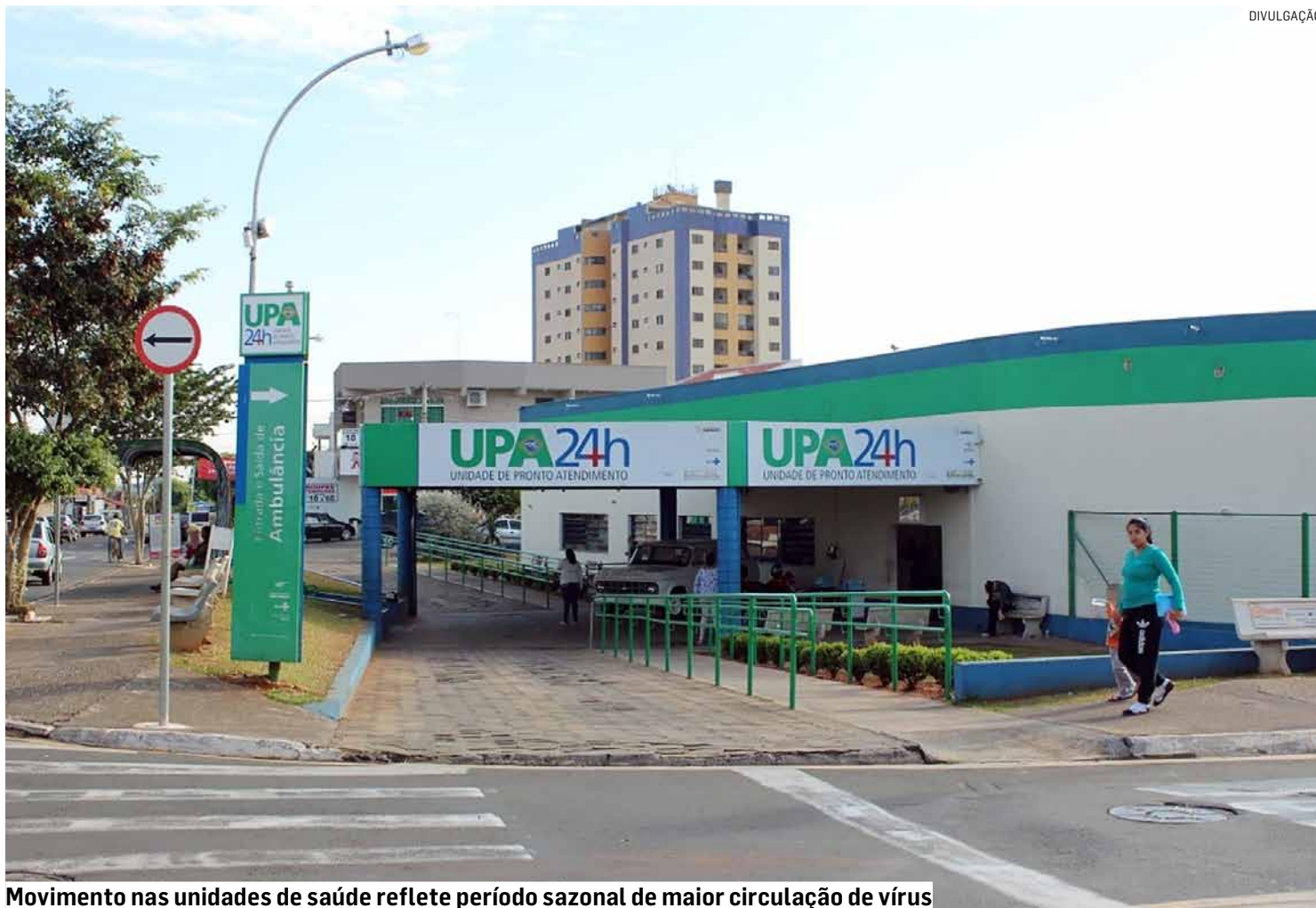
Movimento nas unidades de saúde reflete período sazonal de maior circulação de vírus

Por outro lado, a pasta destacou que, no mesmo período do ano anterior, o número de notificações suspeitas foi ainda mais alto.