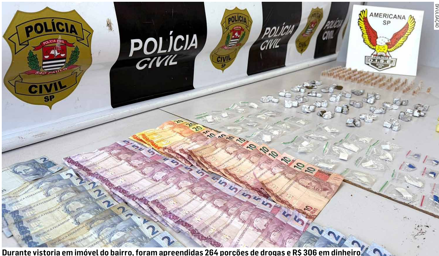
Durante vistoria em imóvel do bairro, foram apreendidas 264 porções de drogas e R$ 306 em dinheiro

Ainda de acordo com a corporação, o investigado