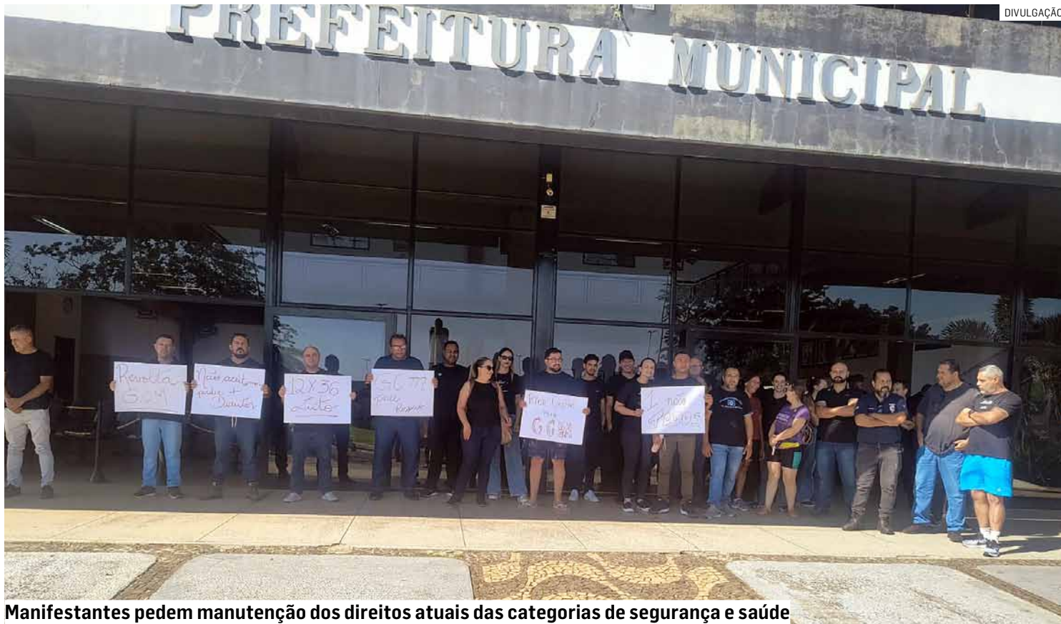
Manifestantes pedem manutenção dos direitos atuais das categorias de segurança e saúde

Patrulheiros e profissionais da área de enfermagem fizeram manifestação nesta segunda-feira (6) contestando corte de uma folga mensal na escala 12 por 36 e restrição ao pagamento de horas extras; Executivo diz que já apresentou contraproposta