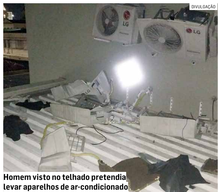
Homem visto no telhado pretendia levar aparelhos de ar-condicionado