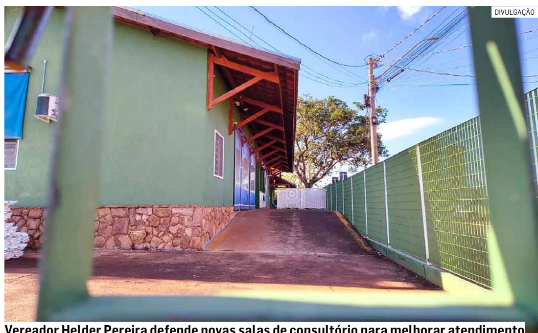
Vereador Helder Pereira defende novas salas de consultório para melhorar atendimento

Helder sugeriu também reformar e revitalizar por completo os complexos de banheiros do Parque Zeca Malavazzi, incluindo adaptações de acessibilidade às pessoas com deficiência e instalação de componentes de alta resistência contra vandalismo.