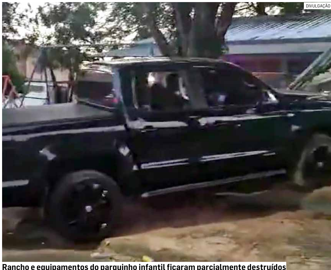
Rancho e equipamentos do parquinho infantil ficaram parcialmente destruídos

Aos agentes, o motorista relatou que teria desvia-