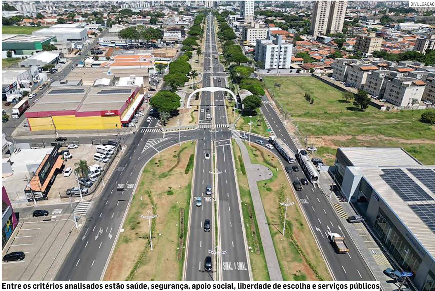
Entre os critérios analisados estão saúde, segurança, apoio social, liberdade de escolha e serviços públicos

A revista atribuiu nota 8,84 a Americana, representando um grande avanço na comparação com o ano passado, quando o município figurou na 30ª posição desse mesmo ranking, com nota 7,04. Este ano, no Estado de São Paulo, a Princesa Tecelã fica