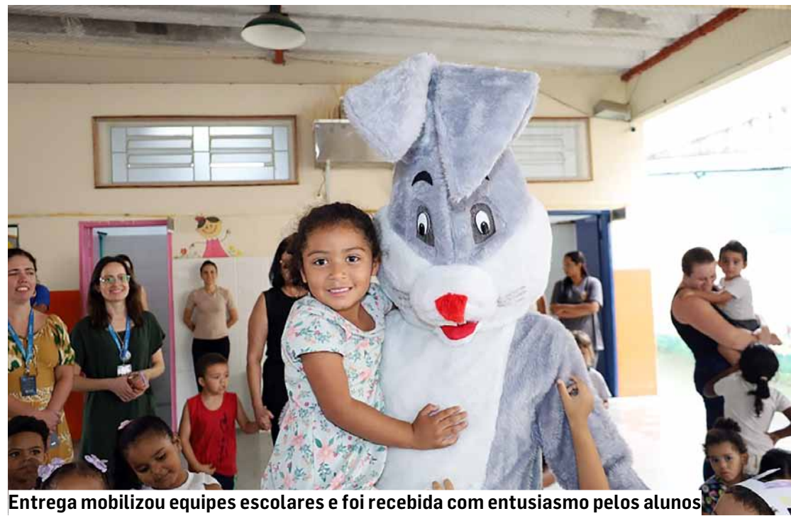
Entrega mobilizou equipes escolares e foi recebida com entusiasmo pelos alunos.

Para o governo municipal, o início da construção representa mais um avanço na área educacional. Após a conclusão, a escola de período integral se tornará referência na região do Parque São Clemente.