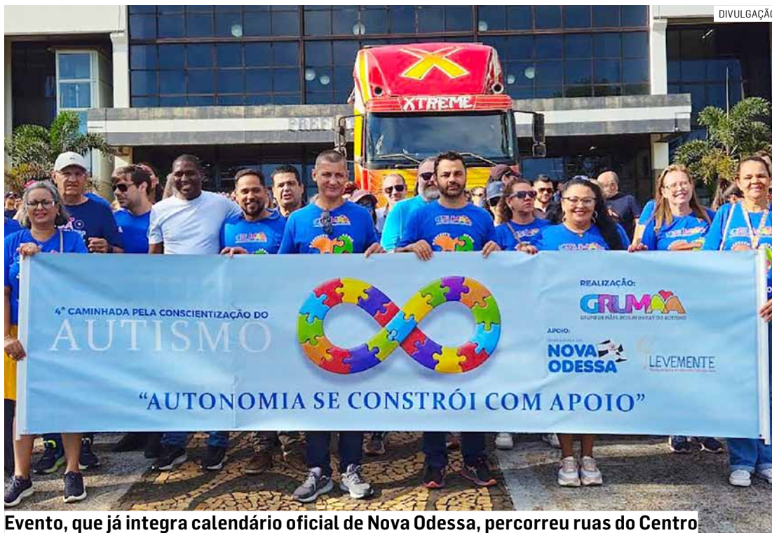
Evento, que já integra calendário oficial de Nova Odessa, percorreu ruas do Centro

A manhã de sábado (4) foi marcada por conscientização e alegria em Nova Odessa. A 4ª Caminhada pela Conscientização do Autismo reuniu famílias, crianças e apoiadores da causa em frente ao Paço Municipal, com percurso até a Praça Central José Gazzetta. O grande destaque ficou por conta da Carreta da Alegria, que acompanhou todo o trajeto e levou as crianças, muitas delas com Transtorno do Espectro Autista (TEA), para uma experiência lúdica e acolhedora.