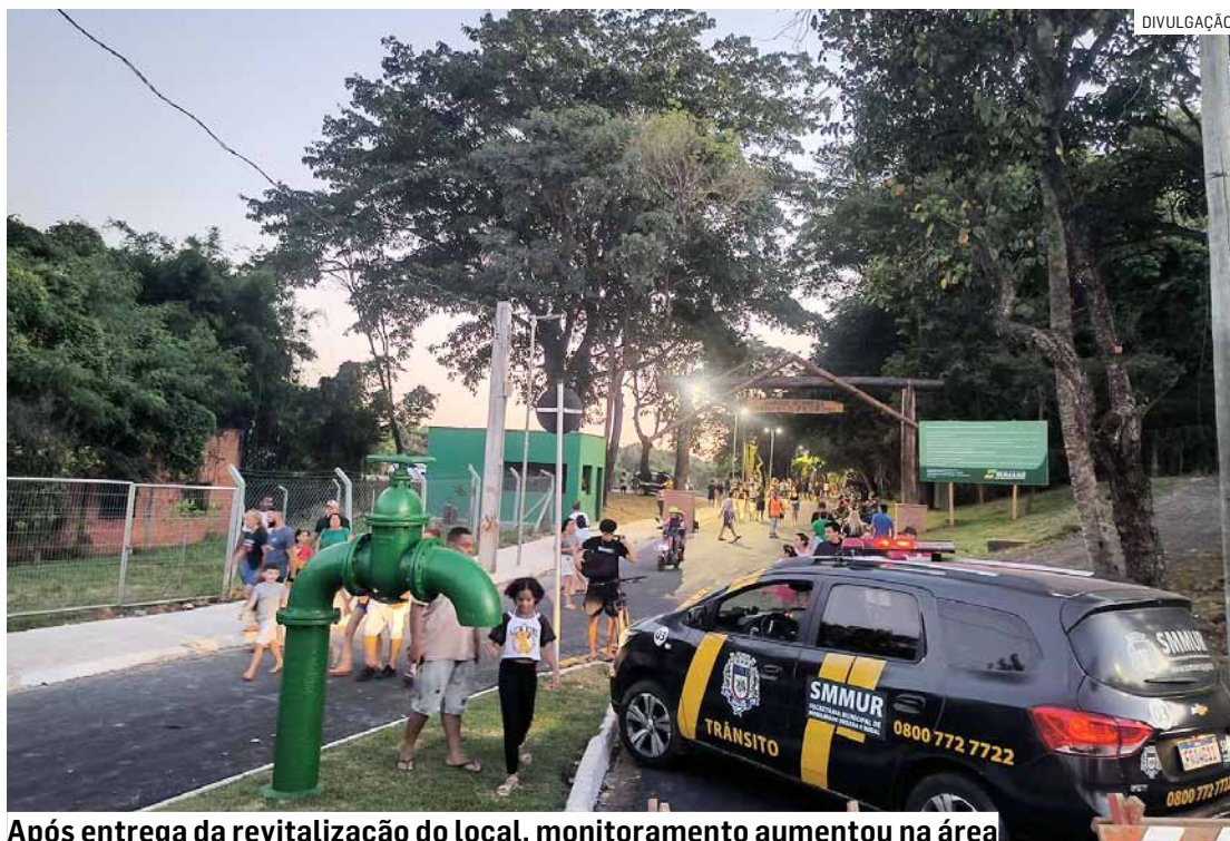
Após entrega da revitalização do local, monitoramento aumentou na área

Durante o patrulhamento, é averiguado se a população faz uso de barcos, pesca e nada nos locais, além de demais atividades que colocam em risco a integridade dos municípios. Os usuários também são orientados sobre a prá-