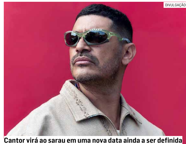
Cantor virá ao sarau em uma nova data ainda a ser definida

Este mês, o sarau Parada Poética é realizado, excepcionalmente, no CEM em razão da obra do viaduto na região da Vila Real, próximo ao Museu Municipal Estação Jacuba, local onde habitualmente é realizado o evento.