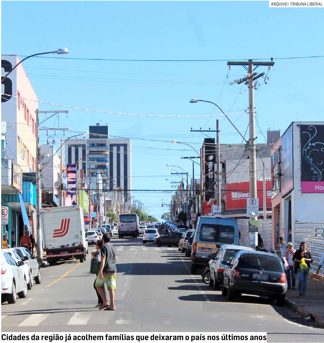
Cidades da região já acolhem famílias que deixaram o país nos últimos anos

Americana concentra maior número de moradores vindos do país vizinho, com 342 pessoas, seguida por Hortolândia, com 106 venezuelanos; maioria de estrangeiros está nas áreas urbanas, no trabalho informal e requer serviços públicos