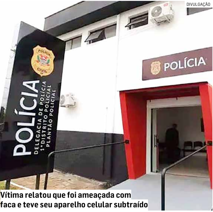
Vítima relatou que foi ameaçada com faca e teve seu aparelho celular subtraído

Diante dos fatos, o indivíduo foi conduzido ao Plantão Policial, onde a ocorrência foi registrada e ele permaneceu preso à disposição da Justiça.