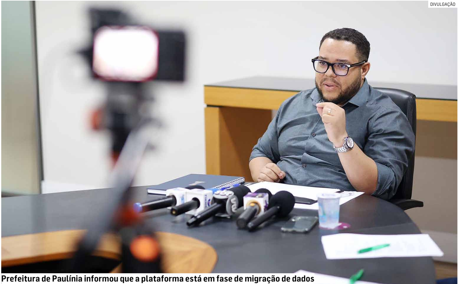
Prefeitura de Paulínia informou que a plataforma está em fase de migração de dados

A legislação estabelece que a plataforma digital deve disponibilizar in-