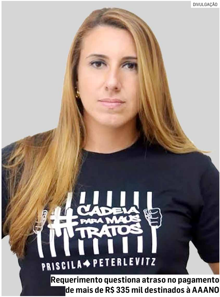
Requerimento questiona atraso no pagamento de mais de R$ 335 mil destinados à AAANO