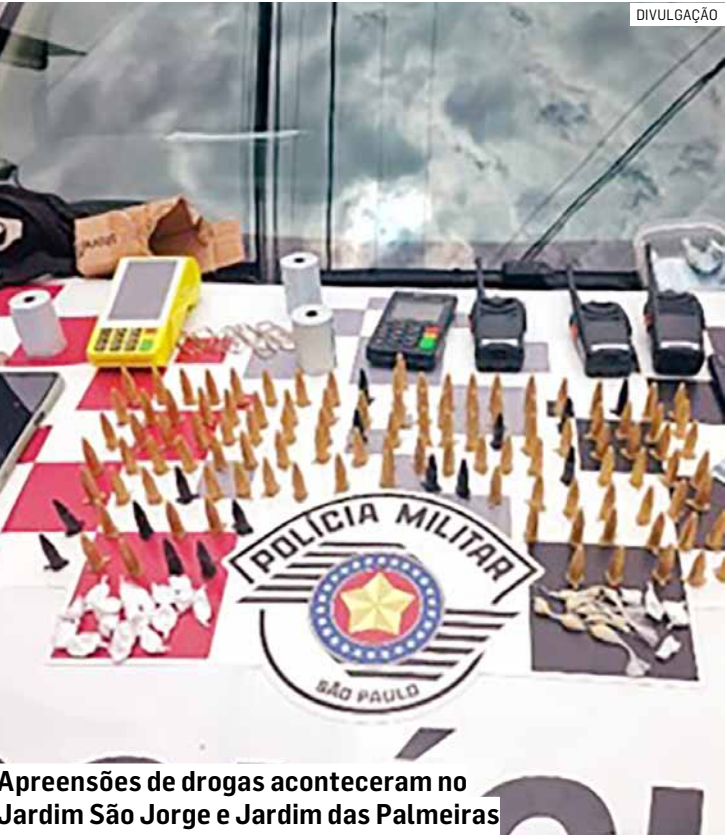
Apreensões de drogas aconteceram no Jardim São Jorge e Jardim das Palmeiras

em um banco às margens de uma área de mata. Durante a busca pessoal, foram encontradas nove porções de cocaína dentro de uma bolsa. Em diligência complementar, a equipe realizou uma varredura no local e localizou outras 18 porções da mesma substância escondidas sob o banco, totalizando cerca de 270 gramas de cocaína. O suspeito confessou a prática do tráfico e foi conduzido ao Plantão Policial, onde permaneceu preso.