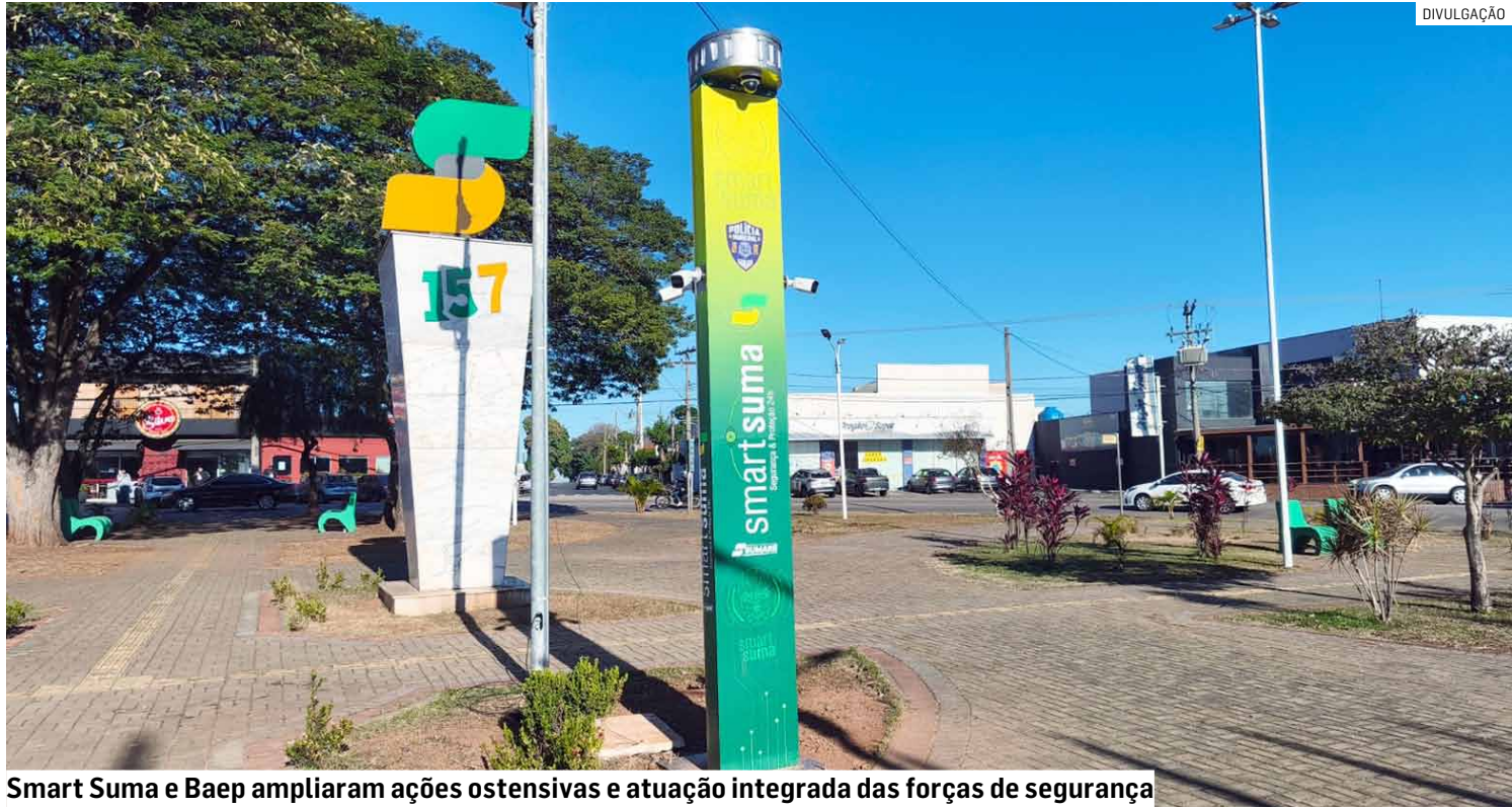
Smart Suma e Baep ampliaram ações ostensivas e atuação integrada das forças de segurança

Entre as ações que contribuíram diretamente para os resultados está a implantação do Smart Suma, sistema municipal de monitora-