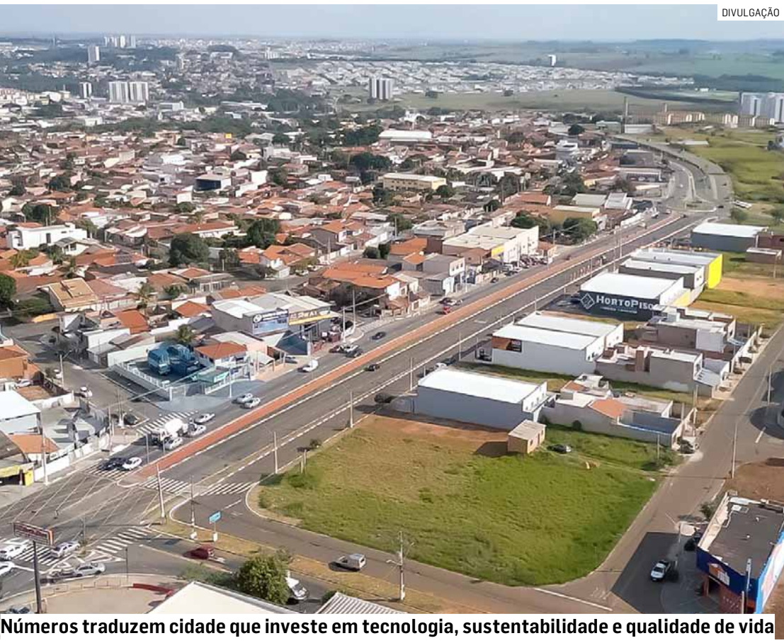
Números traduzem cidade que investe em tecnologia, sustentabilidade e qualidade de vida

Hortolândia voltou a ganhar destaque no cenário nacional ao figurar entre as Melhores Cidades do Brasil no ranking divulgado pela Revista Veja. O estudo avalia indicadores fiscais, econômicos, sociais e digitais de 2025. PÁGINA 07