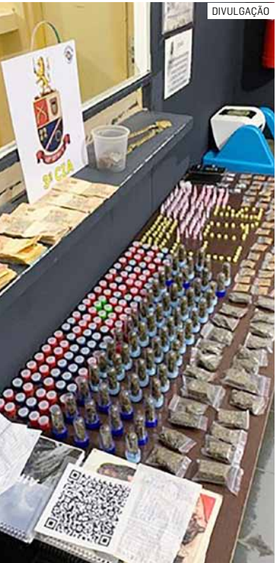
Policiais apreenderam dinheiro, celulares e anotações do tráfico

Dois homens foram presos por tráfico de drogas na noite de terça-feira (6) em um condomínio da Vila São Pedro, em Hortolândia. A ação ocorreu após denúncia anônima e tentativa de fuga dos suspeitos ao perceberem a chegada da Polícia Militar. No apartamento, os agentes apreenderam grande quantidade de drogas, mais de R$ 6 mil em dinheiro, celulares e anotações do tráfico. Também foi encontrado um QR Code usado para pagamentos. Os suspeitos foram levados ao Plantão Policial e permaneceram presos.