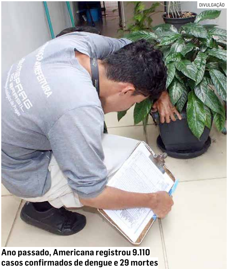
Ano passado, Americana registrou 9.110 casos confirmados de dengue e 29 mortes