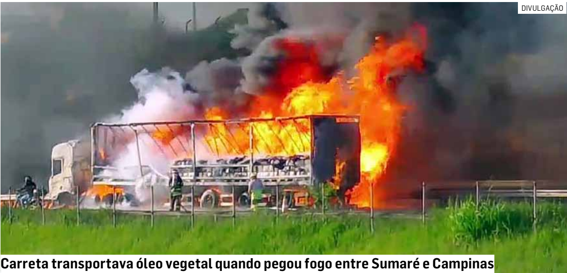
Carreta transportava óleo vegetal quando pegou fogo entre Sumaré e Campinas

Um caminhão pegou fogo na manhã desta quarta-feira (7) e provocou a interdição total da Rodovia Anhanguera (SP-330), em Sumaré, sentido capital paulista. De acordo com informações da Agência de Transportes do Estado de São Paulo (Artesp), a ocorrência foi registrada por volta das 5h39, no km 107. Por questões de segurança, a pista precisou ser completamente bloqueada às 5h40, interrompendo o fluxo de veículos. Durante o incêndio, os pneus do caminhão estouraram e houve vazamento