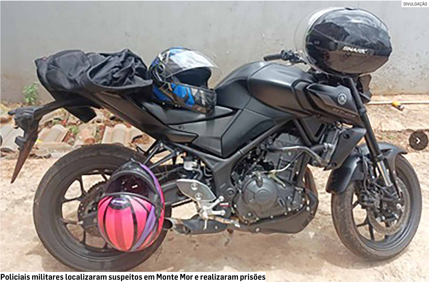
Policiais militares localizaram suspeitos em Monte Mor e realizaram prisões

Na manhã de terça-feira (6), policiais militares recuperaram duas motocicletas furtadas em uma residência localizada na Rua Olga Milan, no bairro Jardim Capuavinha, em Monte Mor. A ação teve início após informações repassadas por populares, que indicavam que os veículos estavam no interior de um imóvel na região. A equipe policial se deslocou até o endereço para averiguação da denúncia. No local, os agentes visualizaram as motocicletas dentro da residência e, após verificação, constataram que se tratavam dos mesmos furtados do pátio municipal no dia anterior. Com base nas informações obtidas, os policiais localizaram os envolvidos ainda no município. Durante a abordagem, eles confessaram a autoria do furto das motocicletas. Todos os envolvidos foram conduzidos ao Plantão Policial, onde a ocorrência foi registrada. Os suspeitos