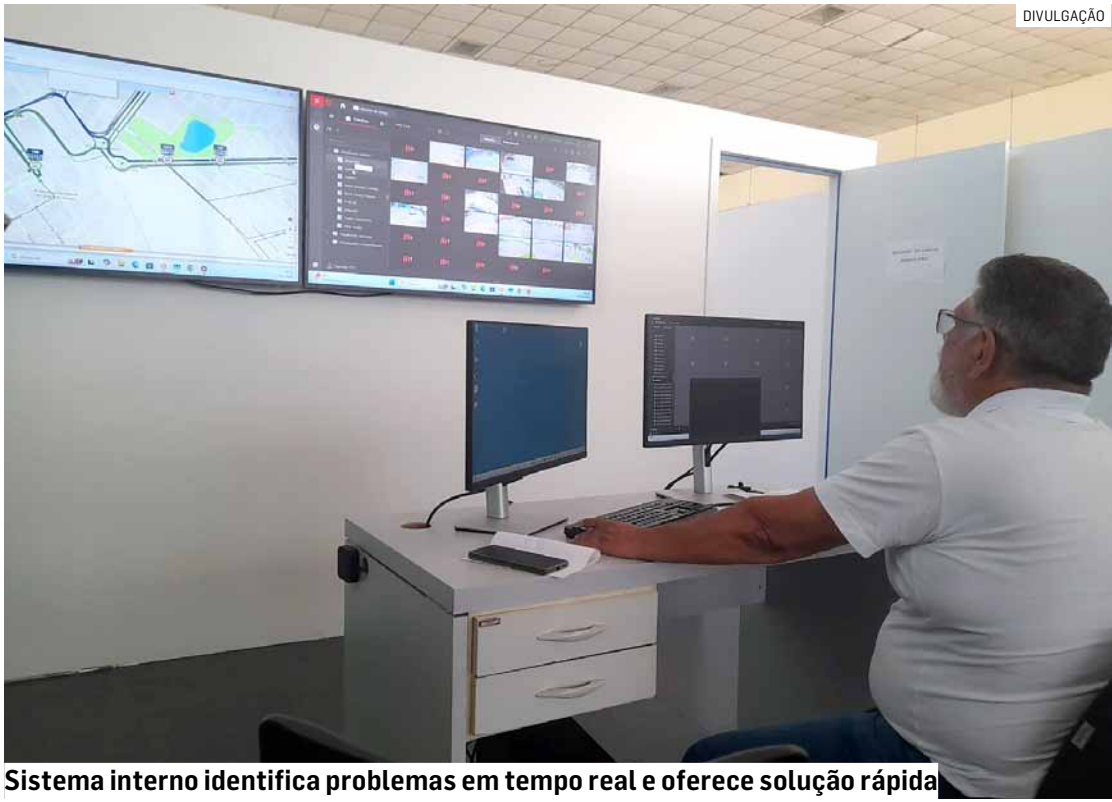
Sistema interno identifica problemas em tempo real e oferece solução rápida

O monitoramento pode ser individual, mediante a seleção de determinada li-