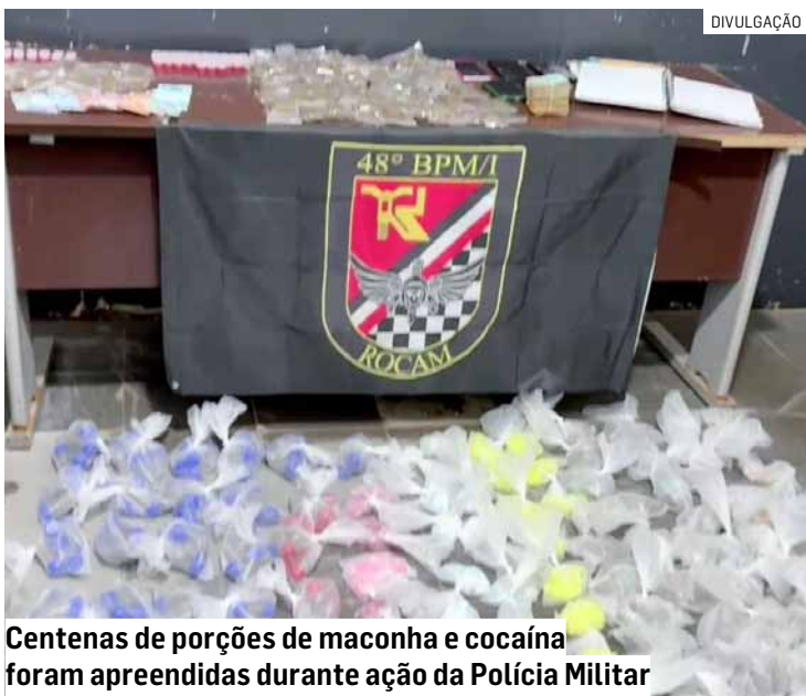
Centenas de porções de maconha e cocaína foram apreendidas durante ação da Polícia Militar

A equipe ainda abordou mais dois indivíduos que tentaram fugir pelo bloco de cor verde. Um deles também destruiu seu celular ao