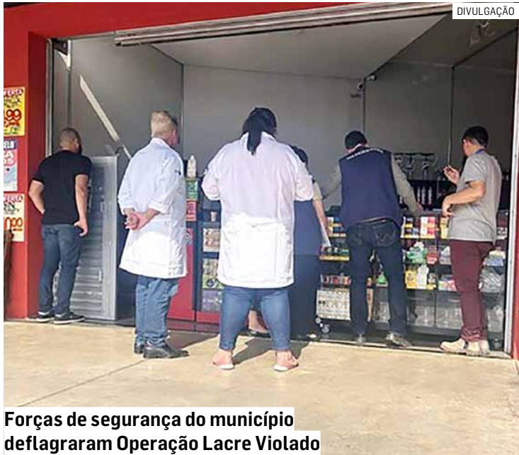
Forças de segurança do município deflagraram Operação Lacre Violado