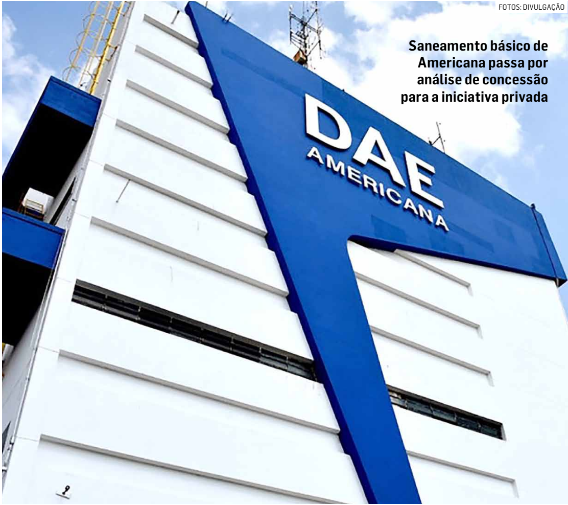
Saneamento básico de Americana passa por análise de concessão para a iniciativa privada

“Embora o custo da retribuição pecuniária não recaia diretamente sobre a Administração, essa reali-