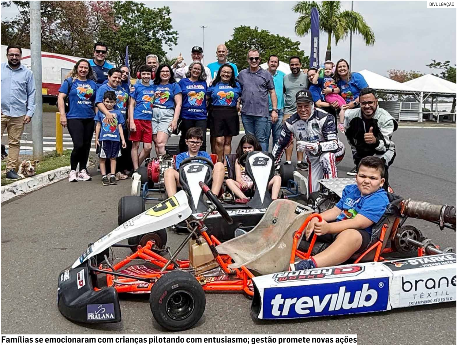
Famílias se emocionaram com crianças pilotando com entusiasmo; gestão promete novas ações

Idealizado pelo piloto Gene Fireball, o projeto já acontece em diferentes regiões do Brasil e tem como objetivo promover inclusão por meio da velocidade