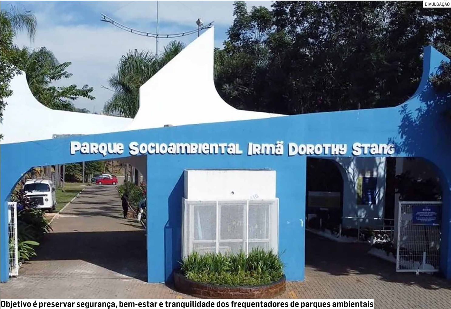
Objetivo é preservar segurança, bem-estar e tranquilidade dos frequentadores de parques ambientais

Proposta de autoria da prefeitura veta bicicletas motorizadas, ciclomotores, patinetes e monociclos elétricos nos parques da cidade sob pena de multa de R$ 237,50, dobrando na reincidência; vereadores vão votar projeto de lei