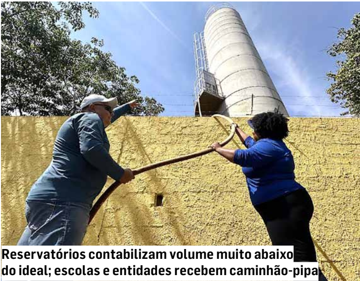
Reservatórios contabilizam volume muito abaixo do ideal; escolas e entidades recebem caminhão-pipa

“A autarquia pede a colaboração da população para que adote práticas de economia e conservação da água, utilizando o recurso de maneira consciente até que a situação se normalize com a retomada das chuvas”, informou. | Da Redação