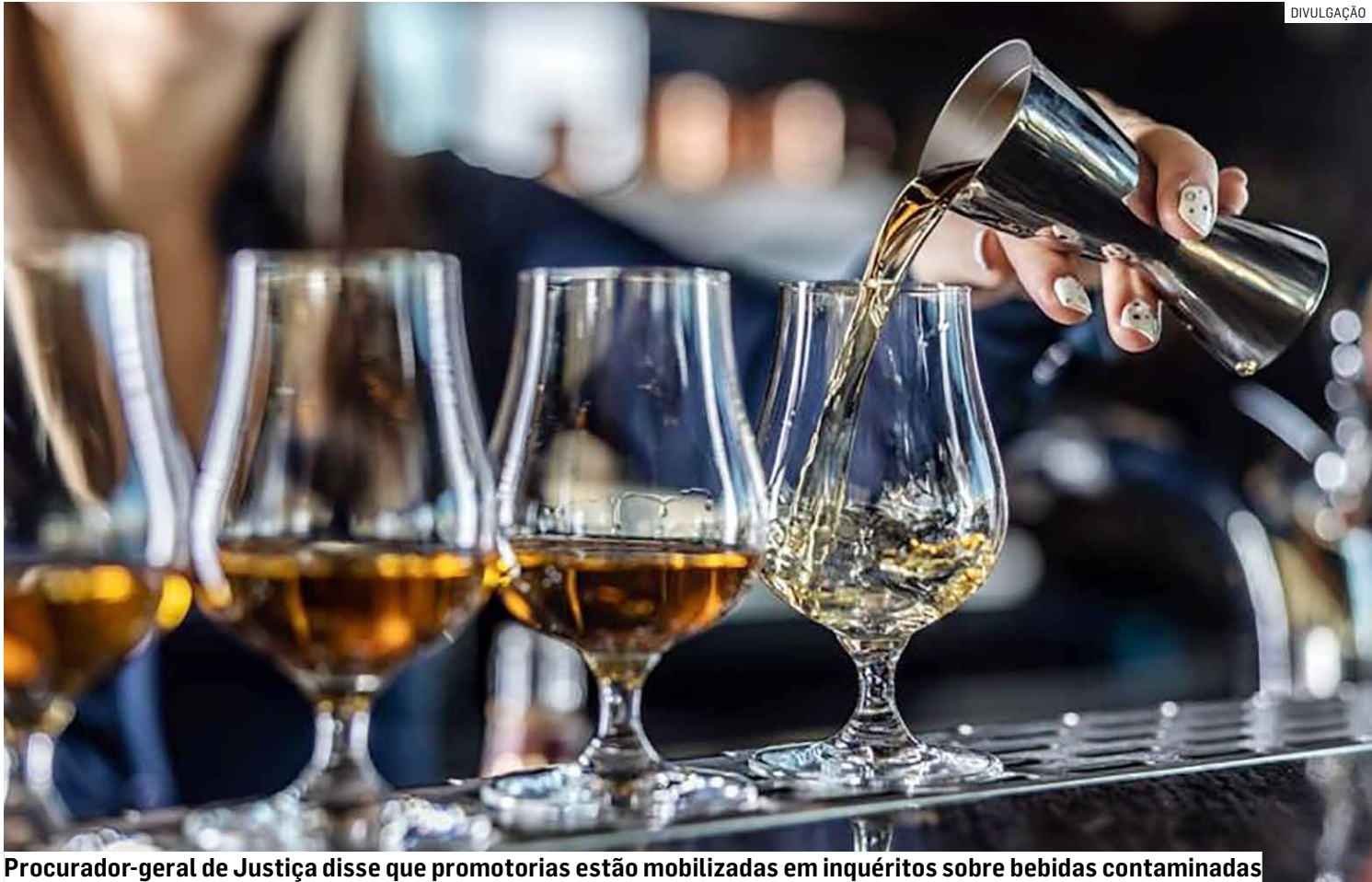
Procurador-geral de Justiça disse que promotorias estão mobilizadas em inquéritos sobre bebidas contaminadas

A descoberta de uma fábrica clandestina na terça-feira (30) em Americana, onde foram apreendidas 17,7 mil garrafas de bebidas adulteradas com indícios de falsificação, trouxe reflexos imediatos para todo o Estado, que enfrenta um crescente alerta contra intoxicações por metanol.