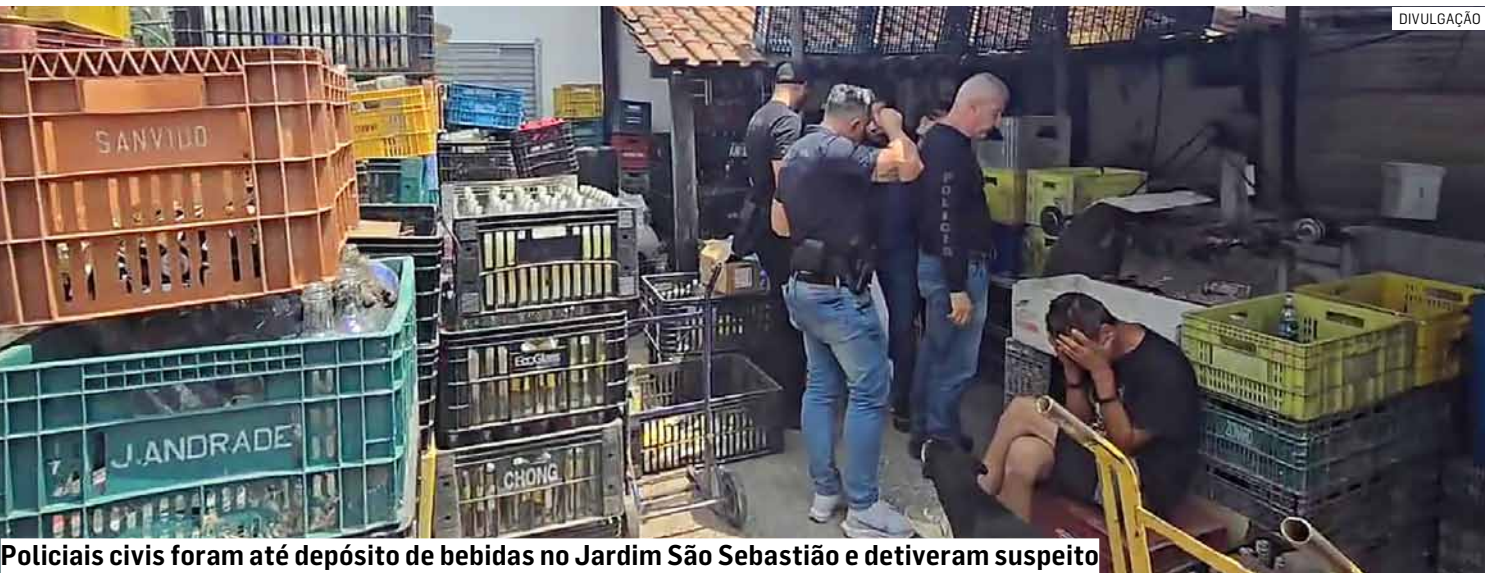
Policiais civis foram até depósito de bebidas no Jardim São Sebastião e detiveram suspeito

Localização de galpão utilizado para armazenar bebidas adulteradas em Hortolândia, somada aos casos de contaminação por metanol no Estado de São Paulo, acentua preocupação entre autoridades sanitárias e policiais