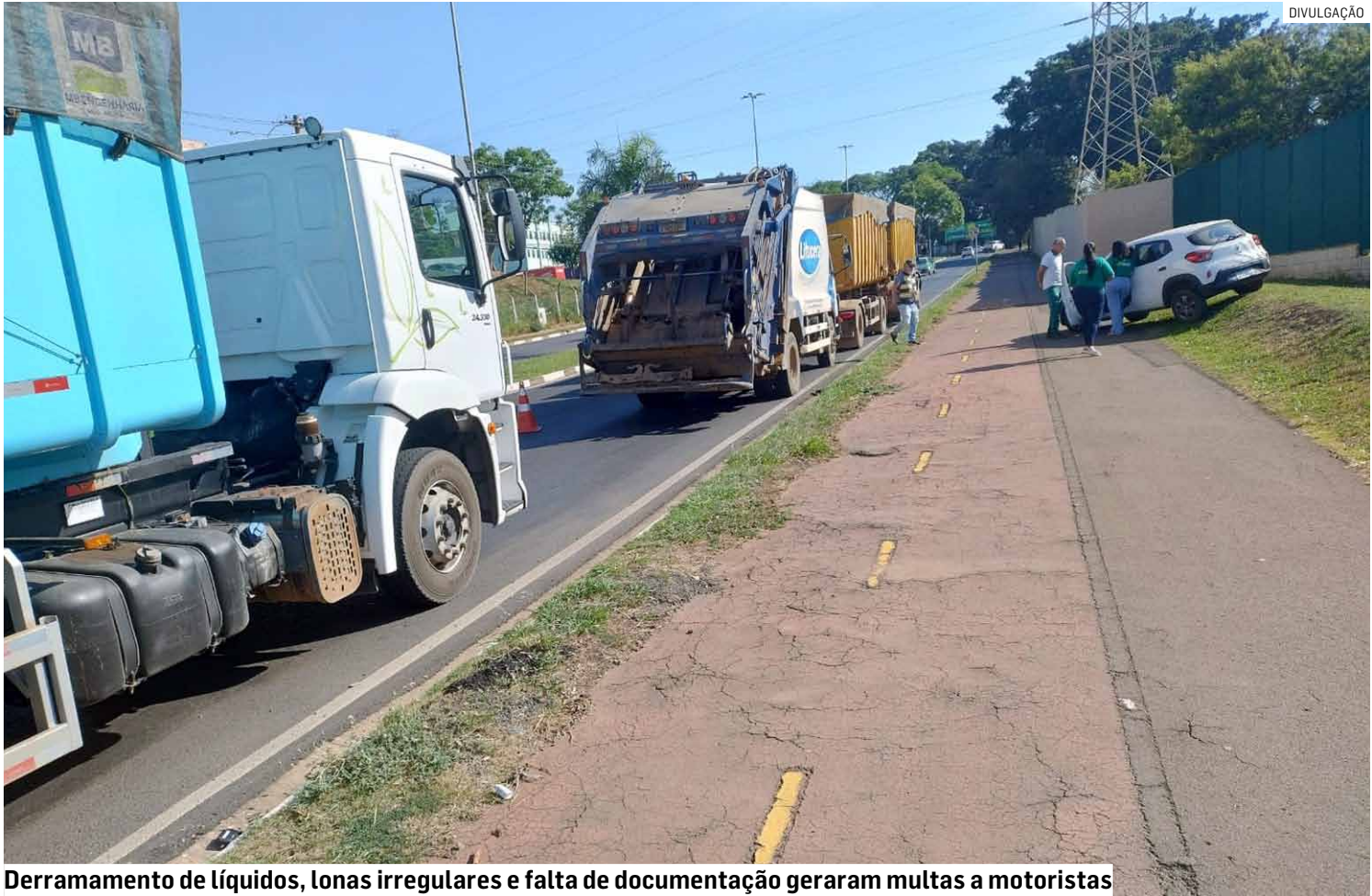
Derramamento de líquidos, lonas irregulares e falta de documentação geraram multas a motoristas

Durante a blitz, foram fiscalizados 29 veículos e 8 carretas. Deste total, 11 veículos e carretas foram autuados com base no Código de Trânsito Brasileiro (Lei nº 9.503/97) e 4 veículos receberam autuações pela Cetesb, conforme a Lei Ambiental 5.793/25. As infrações identificadas incluíram derramamento de líquidos na via, condições inadequadas das lonas de cobertura de carga, falta de