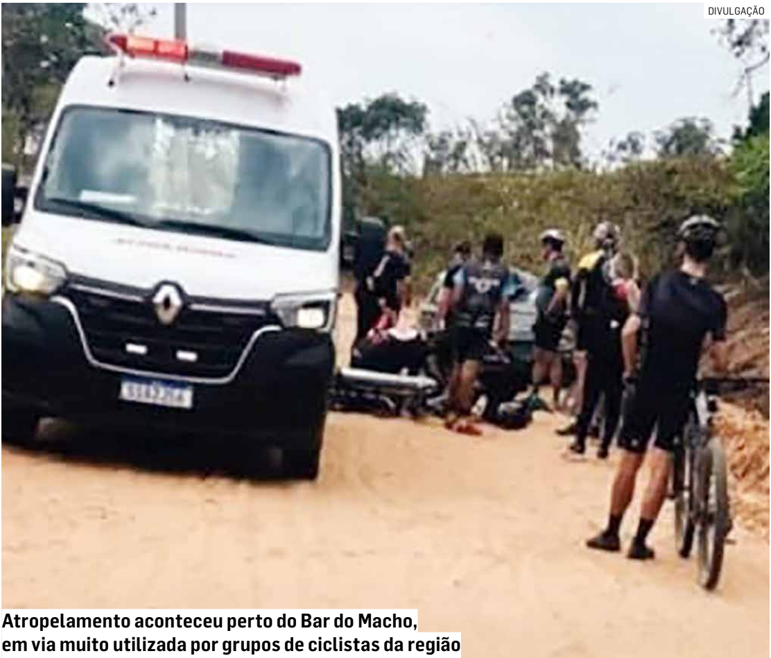
Atropelamento aconteceu perto do Bar do Macho, em via muito utilizada por grupos de ciclistas da região

A via precisou ser parcialmente interditada para o trabalho das equipes de resgate e da perícia. O veículo foi apreendido para análise técnica e exames deverão apontar se o motorista havia consumido álcool ou outras substâncias.