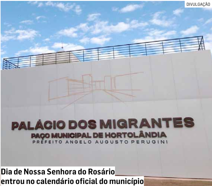
Dia de Nossa Senhora do Rosário entrou no calendário oficial do município

Já os PEVs (Pontos de Entrega Voluntária de entulho e outros materiais recicláveis) também vão manter o funcionamento normal.