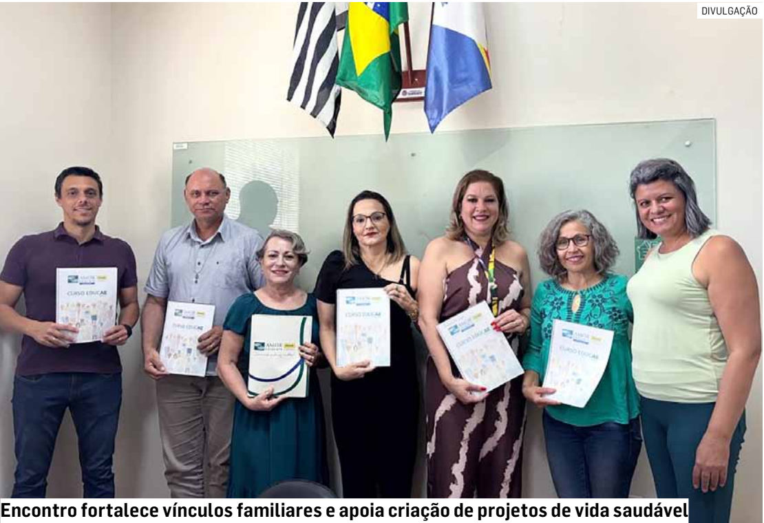
Encontro fortalece vínculos familiares e apoia criação de projetos de vida saudável