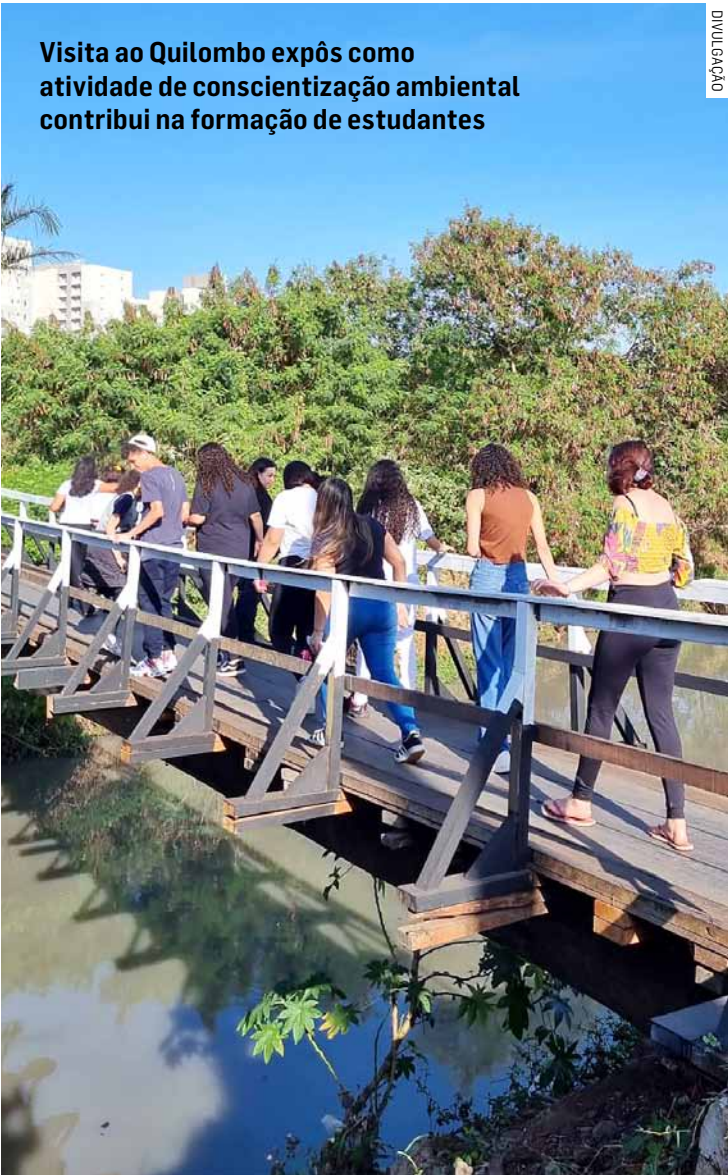
Visita ao Quilombo expôs como atividade de conscientização ambiental contribui na formação de estudantes