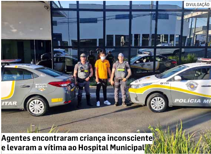
Agentes encontraram criança inconsciente e levaram a vítima ao Hospital Municipal

Cézar Oliveira • NOVA ODESSA tribunaliberal@tribunaliberal.com.br