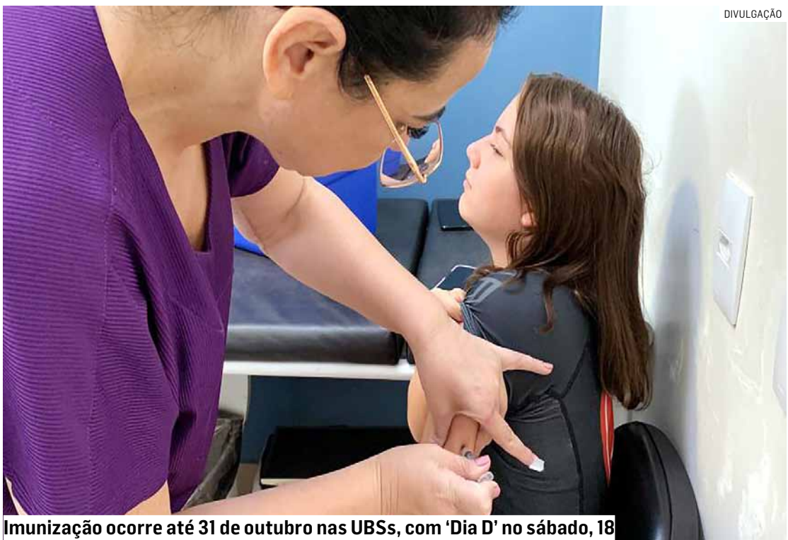
Imunização ocorre até 31 de outubro nas UBSs, com 'Dia D' no sábado, 18

‘DIA D’ Para ampliar o acesso da população, a Secretaria de Saúde realizará um sábado especial de serviços integrados no dia 18 de outubro. Nesta data, as UBSs 2, 3 e 5, no Jardim São Jorge, Jardim São