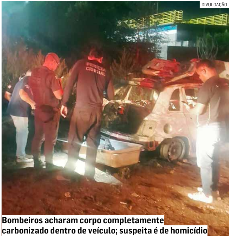
Bombeiros acharam corpo completamente carbonizado dentro de veículo; suspeita é de homicídio

O caso foi registrado no Plantão Policial de Sumaré e segue sob investigação da Polícia Civil. Até o momento, ninguém foi preso, e os investigadores aguardam os resultados dos laudos periciais.