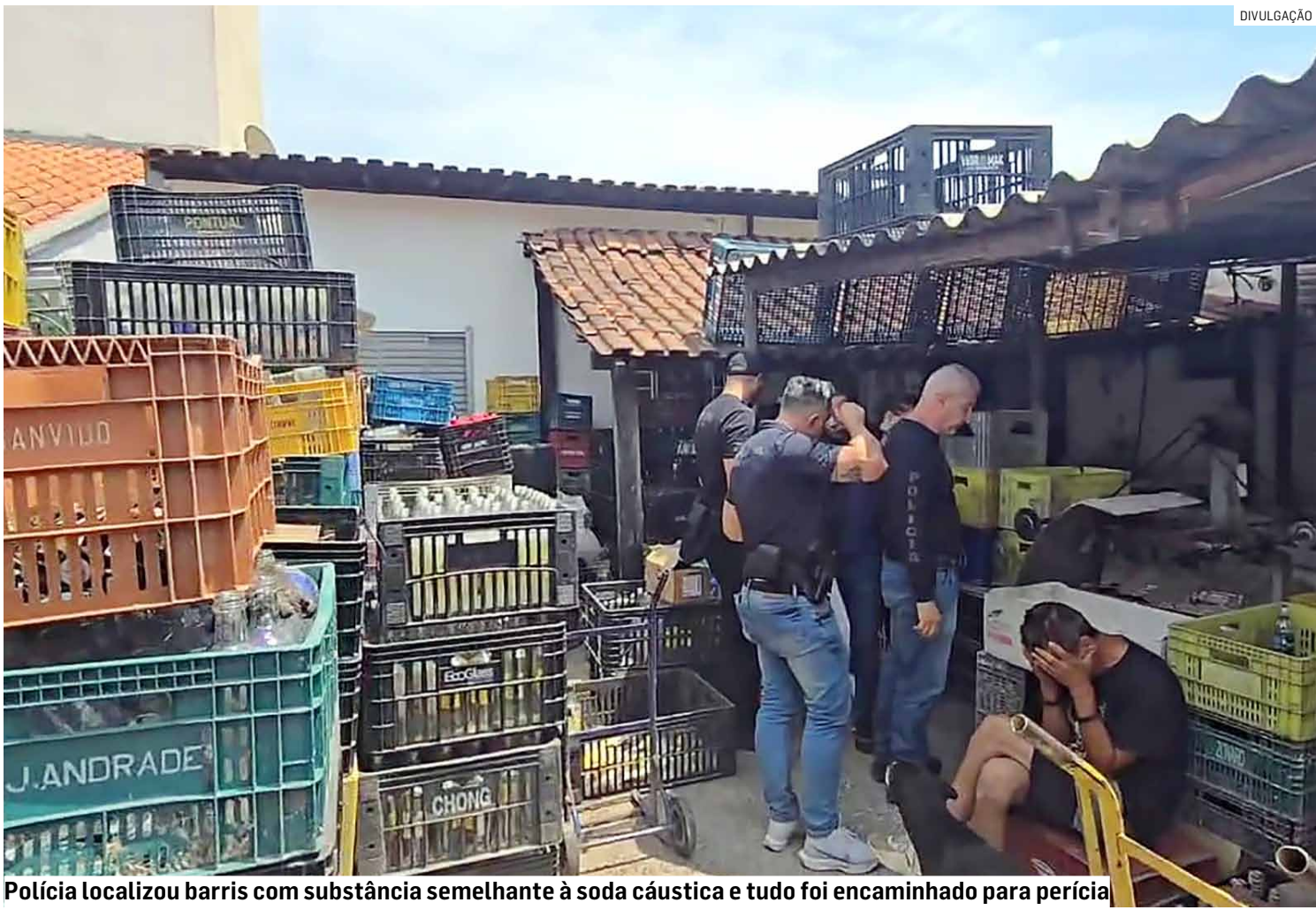
Polícia localizou barris com substância semelhante à soda cáustica e tudo foi encaminhado para perícia

Policiais civis encontraram estabelecimento no Jardim São Sebastião, usado para armazenar e distribuir garrafas de gin, whisky e vodka falsificadas; milhares de unidades estavam prontas para venda, com rótulos e tampas para adulteração