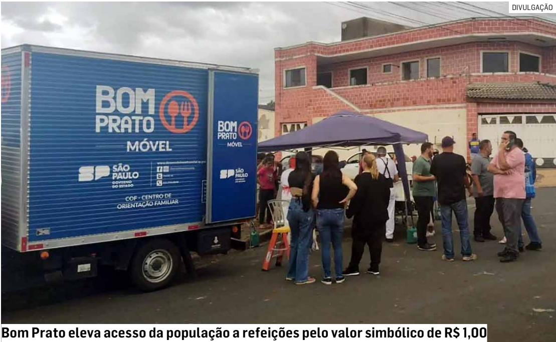
Bom Prato eleva acesso da população a refeições pelo valor simbólico de R$ 1,00

grama Bom Prato. O endereço da unidade é Rua Antonio Soares Barros, nº 9. A chegada do Bom Prato Móvel ao Matão amplia a cobertura do programa em Sumaré e complementa o atendimento já realizado pela unidade fixa do município, fortalecendo a rede de proteção social e o combate à insegurança alimentar. Além da unidade móvel, a população segue contando com o Restaurante Bom Prato Sumaré (unidade fixa), que mantém seu atendimento normal no Centro da cidade.