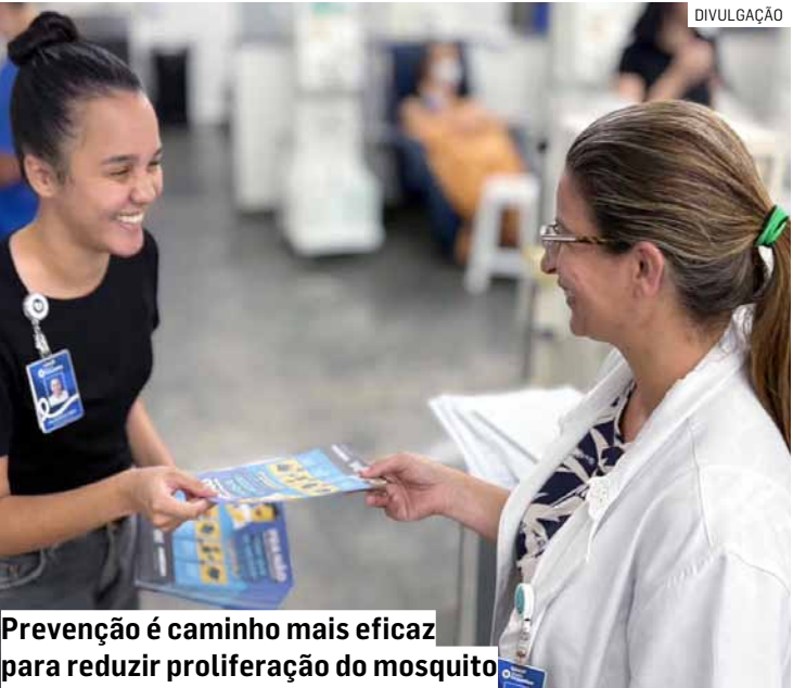
Prevenção é caminho mais eficaz para reduzir proliferação do mosquito

O Hospital Municipal Dr. Waldemar Tebaldi é administrado pelo Grupo Chavantes, por meio de gestão compartilhada com a Secretaria Municipal de Saúde.