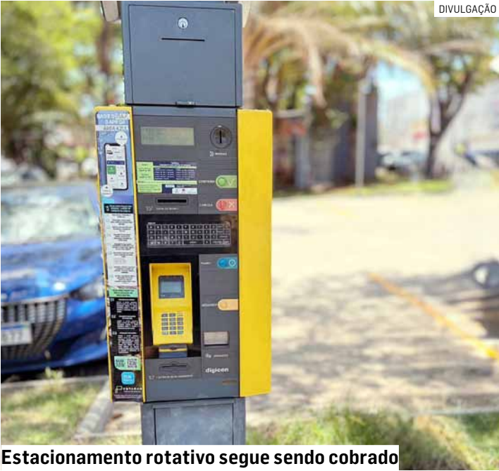
Estacionamento rotativo segue sendo cobrado

A Prefeitura de Americana aguarda decisão da Justiça sobre a ação de produção antecipada de provas contra o contrato da Área Azul, serviço de estacionamento rotativo operado pela concessionária Estapar na cidade. O objetivo da medida é permitir que um perito judicial realize a coleta técnica de provas para confirmar indícios de irregularidades apontados pela comissão de apuração instaurada pelo município. A ação foi movida pela própria prefeitura. PÁGINA 05