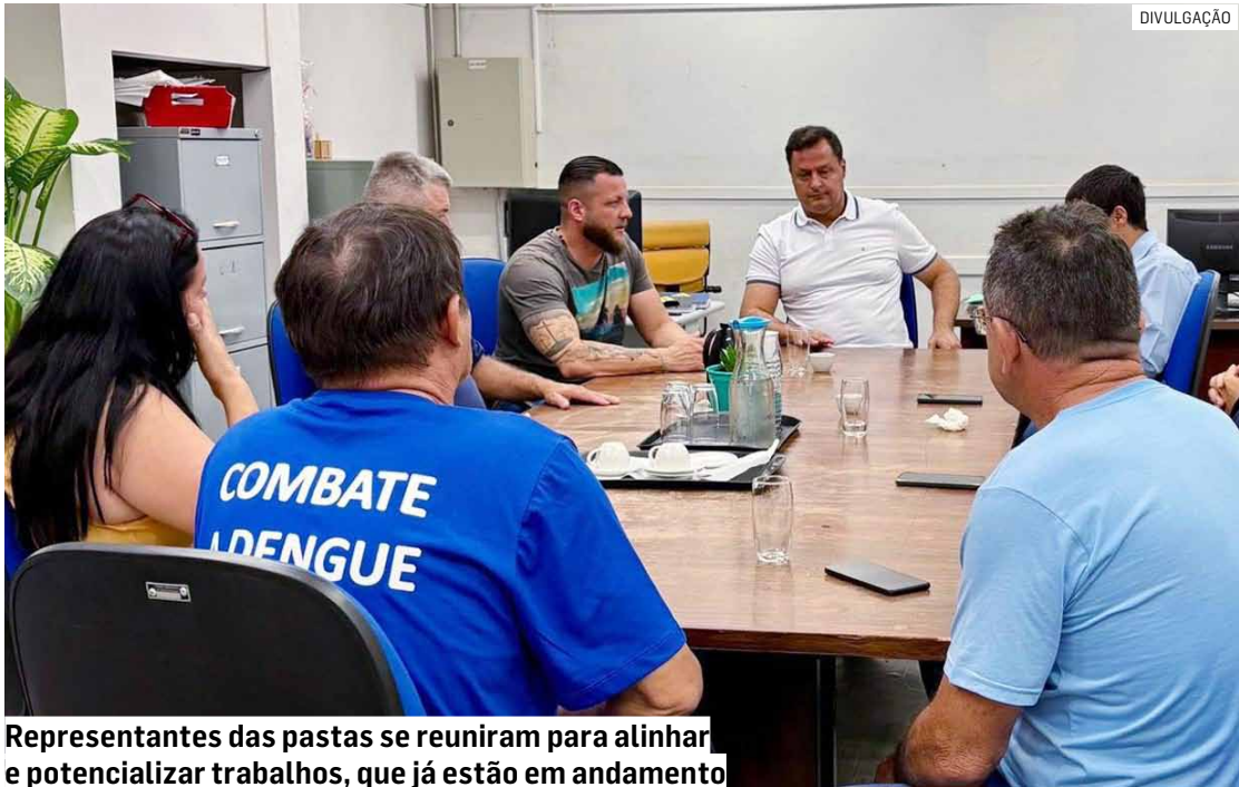
Representantes das pastas se reuniram para alinhar e potencializar trabalhos, que já estão em andamento

Nesta terça-feira (6), os representantes das pastas se reuniram para alinhar e potencializar os trabalhos, que já estão em andamento desde a última segunda-feira (5). As equipes municipais estão atuando no