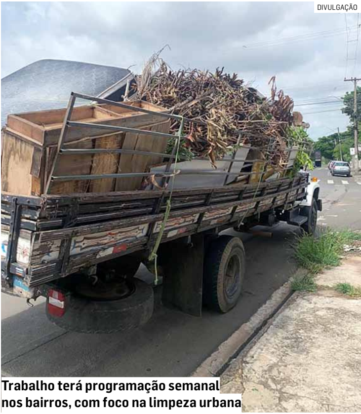
Trabalho terá programação semanal nos bairros, com foco na limpeza urbana

A Secretaria de Meio Ambiente reforça que o descarte irregular é proibido, passível de multa conforme a Lei nº 1.412/2009, com acréscimo de 100% do valor em caso de reincidência.