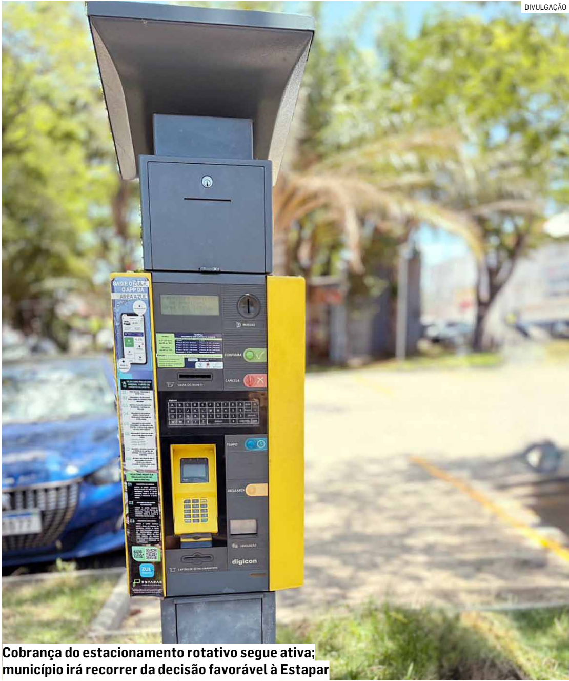
Cobrança do estacionamento rotativo segue ativa; município irá recorrer da decisão favorável à Estapar

Prefeitura mantém investigação a respeito de possíveis irregularidades no contrato e busca perícia técnica para comprovar descumprimento de acordo; suspensão do serviço foi derrubada por decisão do TJ-SP em dezembro