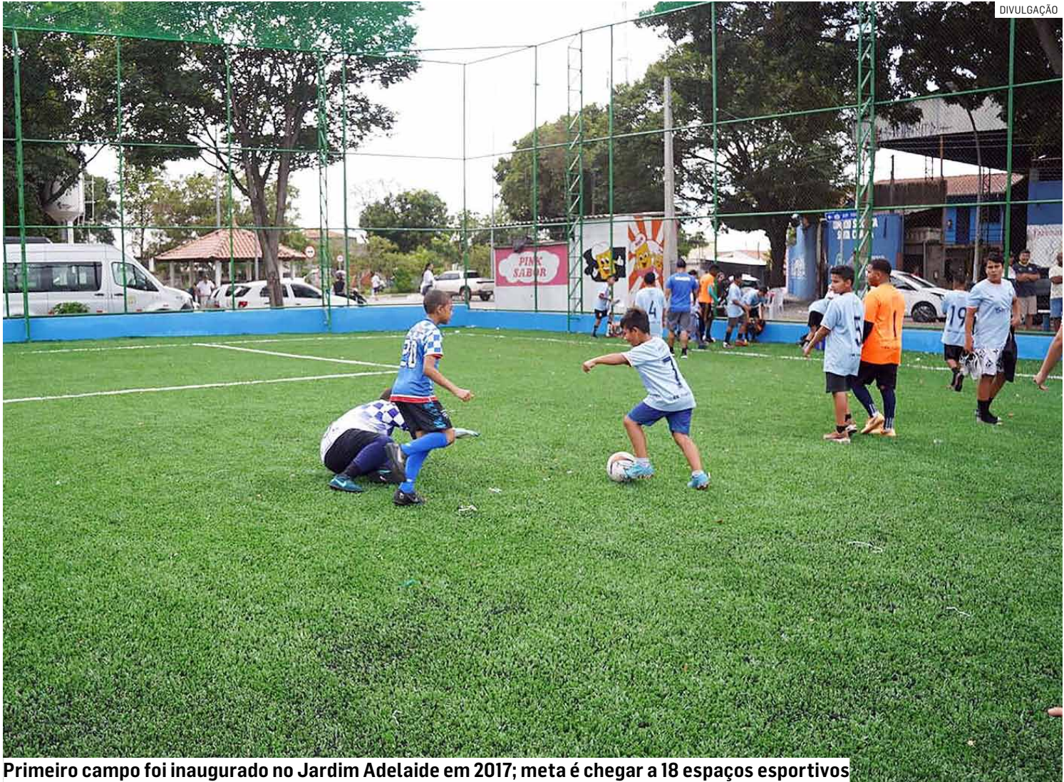
Primeiro campo foi inaugurado no Jardim Adelaide em 2017; meta é chegar a 18 espaços esportivos

“Estamos chegando próximos da meta de 18 campos como este distribuídos em toda a cidade. O esporte é uma das bases do nosso desenvolvimento inteligente e sustentável com qualidade de vida e saúde para a população. O aumento de espaços como estes, que a cidade ganha ano a ano, fortalece todo o trabalho para a comunidade esportiva, melhora as estruturas disponíveis