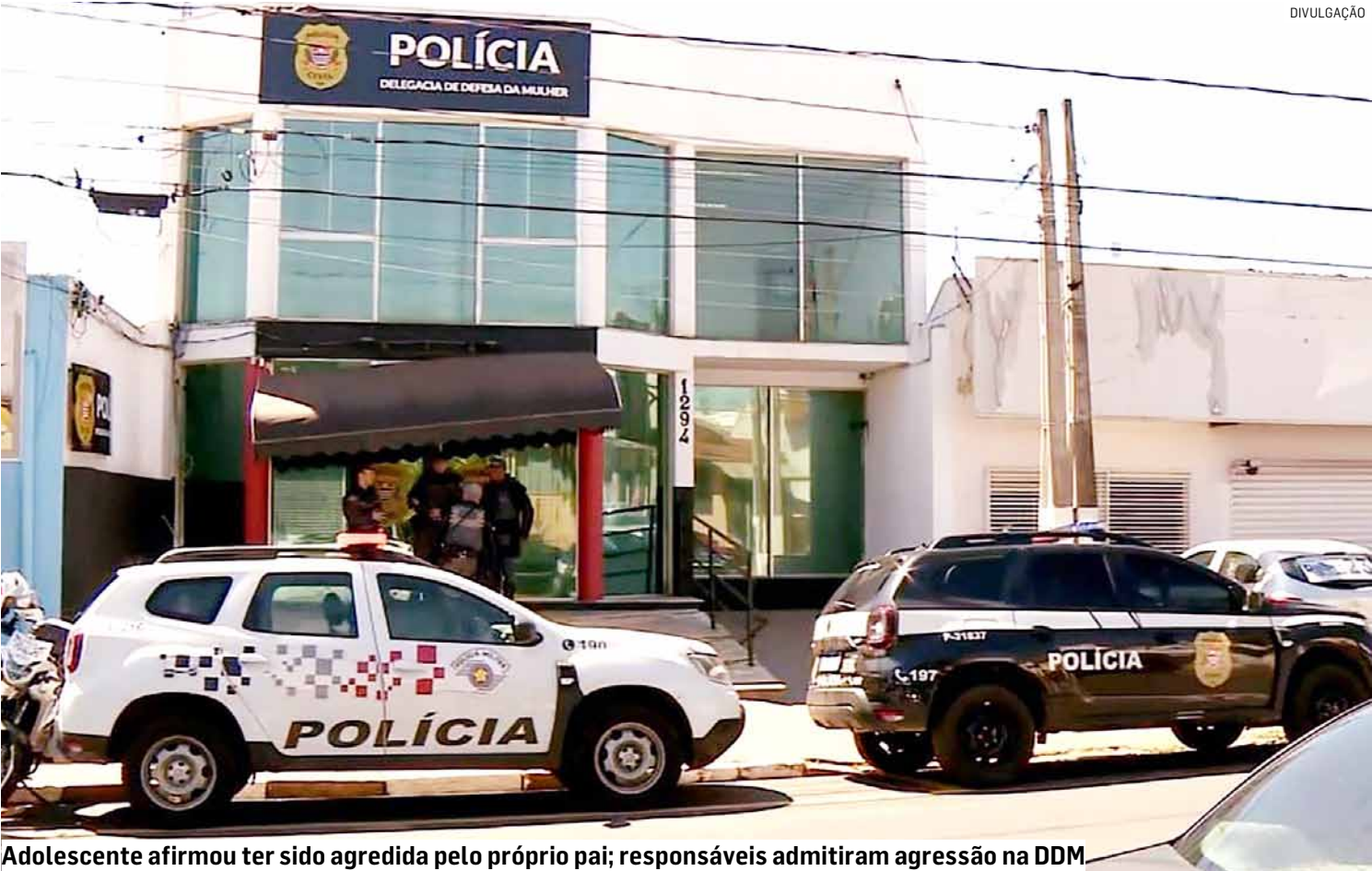
Adolescente afirmou ter sido agredida pelo próprio pai; responsáveis admitiram agressão na DDM

Denúncia foi feita por familiar e levou polícia até a residência da vítima, no Jardim Picerno; jovem enviou mensagens pedindo ajuda e relatou cintadas dentro de casa; policiais constataram lesões visíveis nos braços, nas mãos e pescoço