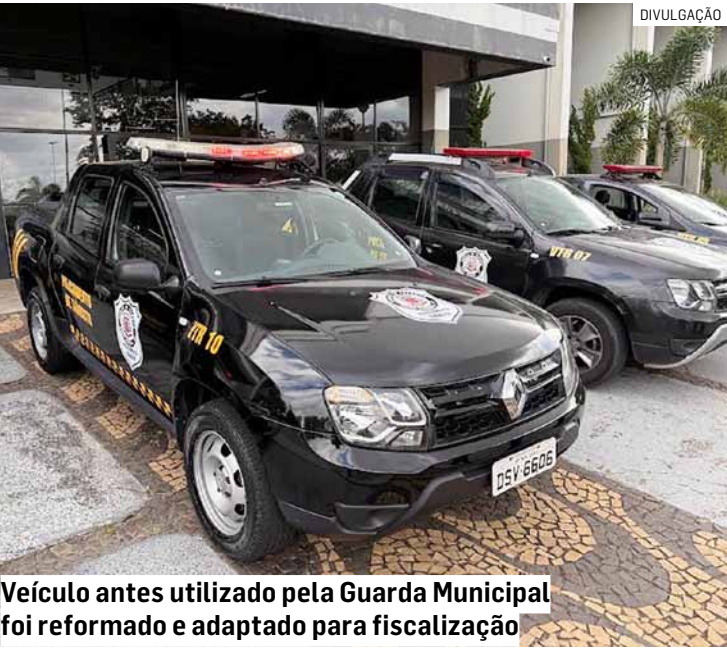
Veículo antes utilizado pela Guarda Municipal foi reformado e adaptado para fiscalização

“Os dados do Caged demonstram que Sumaré avança de forma estruturada, com políticas voltadas à qualificação profissional, ao apoio ao empreendedorismo e ao estímulo dos setores que mais geram empregos. Esses resultados são fruto de um trabalho técnico, planejado e contínuo”, afirmou.