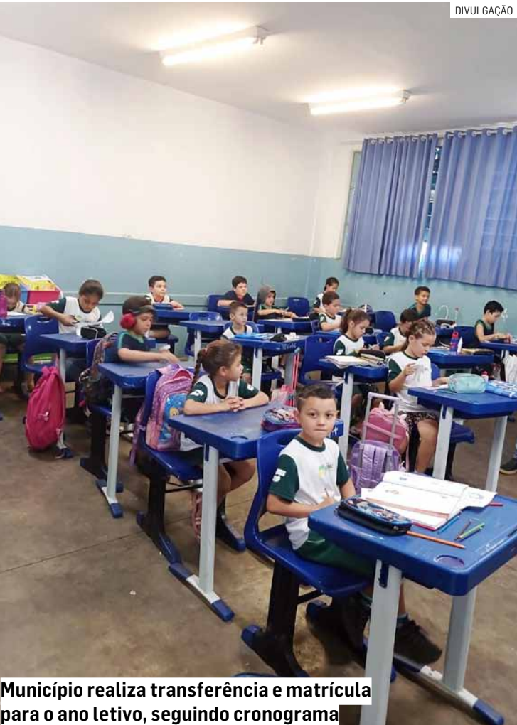
Município realiza transferência e matrícula para o ano letivo, seguindo cronograma