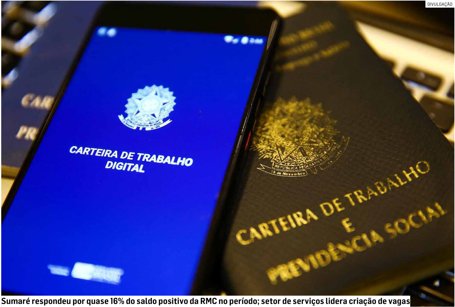
Sumaré respondeu por quase 16% do saldo positivo da RMC no período; setor de serviços lidera criação de vagas

No período de janeiro a novembro de 2025, o município contabilizou a criação de 5.262 novas vagas formais, resultado de 38.799 admissões frente a 33.537 desligamentos. Com esse saldo, Sumaré respondeu por 15,96% de todo o saldo posi-