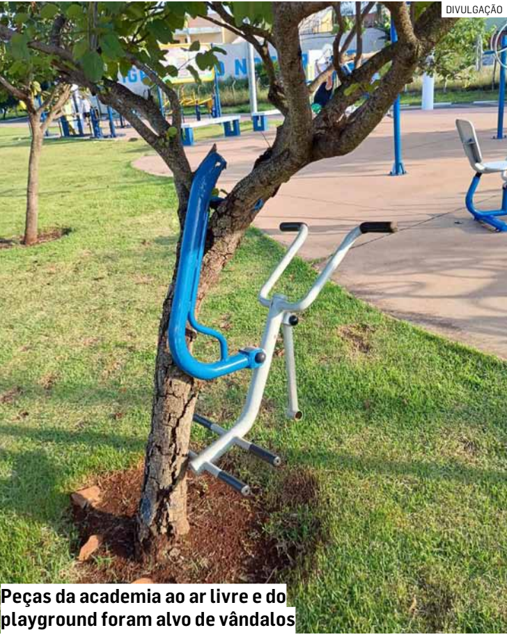
Peças da academia ao ar livre e do playground foram alvo de vândalos

da Fé, a semana também começou em Hortolândia com mutirão de poda do mato nos canteiros centrais das avenidas Anhanguera e São Francisco de Assis. O serviço também foi concluído na área verde entre os jardins São Sebastião e Interlagos e no entorno do OAPE (Observatório Ambiental Parque Escola), no Jardim Santa Clara do Lago. Já no Jardim Mirante, a área onde fica localizado o poço artesiano de água potável recebe nova pintura, contribuindo com o embelezamento do espaço.