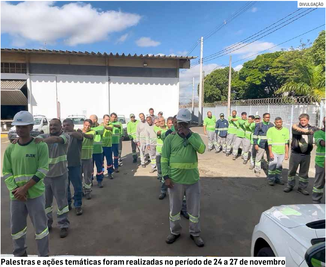
Palestras e ações temáticas foram realizadas no período de 24 a 27 de novembro

Entre os temas de destaque da semana a empresa abordou os cuidados com os pés e as mãos durante as atividades operacionais e reforçou as orientações sobre o uso adequado das ferramentas e Equipamentos de Proteção Individual (EPIs) para que os funcionários da concessionária atuem preventiva-