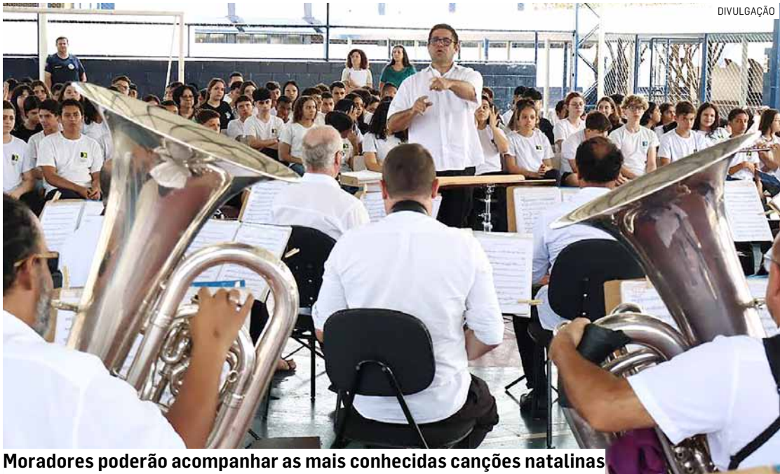
Moradores poderão acompanhar as mais conhecidas canções natalinas

“As apresentações natalinas são o ponto alto da pro-