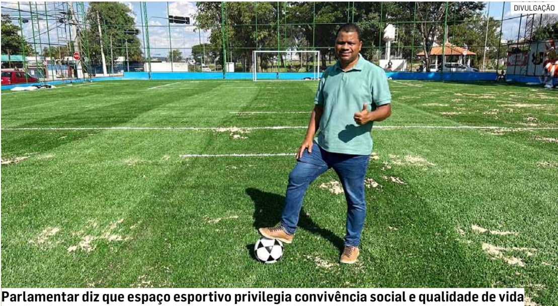
Parlamentar diz que espaço esportivo privilegia convivência social e qualidade de vida

A inauguração oficial está marcada para o dia 12 de dezembro, às 9h, com a presença de autoridades, moradores, atletas e lideranças comunitárias.