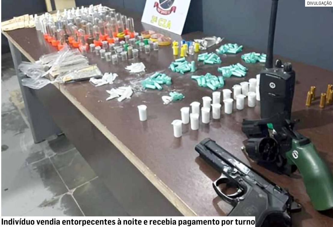
Indivíduo vendia entorpecentes à noite e recebia pagamento por turno

Questionado, o indivíduo confessou que atuava na venda de entorpecentes durante o período noturno no local, recebendo paga-