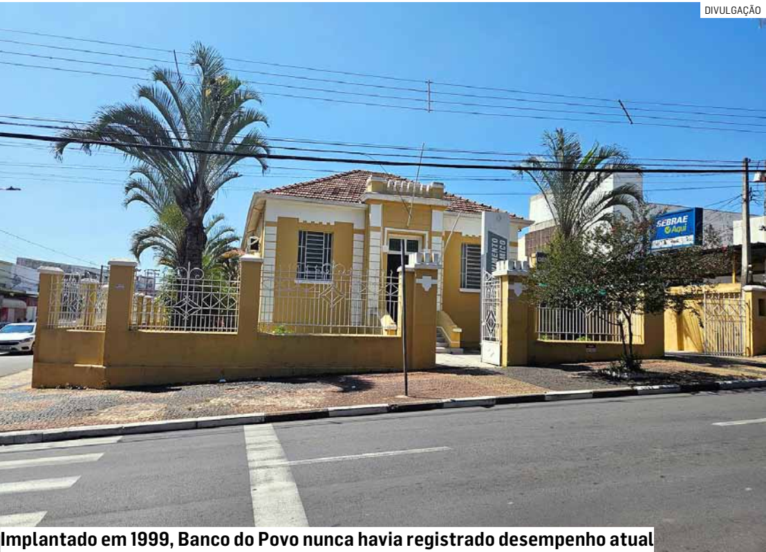
Implantado em 1999, Banco do Povo nunca havia registrado desempenho atual

Da Redação • SUMARÉ tribunaliberal@tribunaliberal.com.br