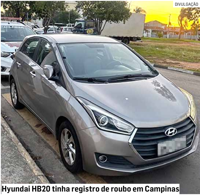
Hyundai HB20 tinha registro de roubo em Campinas

Um homem foi preso após ser encontrado dirigindo um veículo roubado na Avenida Santana, no Jardim Amanda, nesta quinta-feira (4), em Hortolândia. O alerta foi emitido pela Central de Monitoramento, que identificou a entrada de um Hyundai HB20 horas antes. Policiais localizaram o carro e abordaram o motorista, confirmando que o veículo tinha registro de roubo em Campinas.