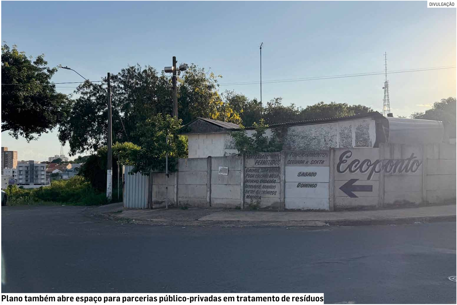
Plano também abre espaço para parcerias público-privadas em tratamento de resíduos

O plano também prevê serviço de coleta mecanizada de recicláveis, além de metas específicas para mecanização da coleta de lixo domiciliar, varrição de vias e roçagem de áreas verdes. No curto prazo, o