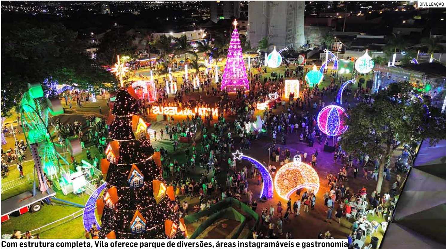
Com estrutura completa, Vila oferece parque de diversões, áreas instagramáveis e gastronomia