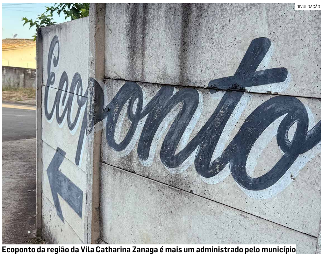
Ecoponto da região da Vila Catharina Zanaga é mais um administrado pelo município