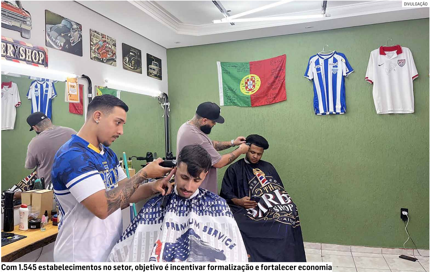
Com 1.545 estabelecimentos no setor, objetivo é incentivar formalização e fortalecer economia

Durante as visitas, os agentes irão conversar, orientar e dar informações aos comerciantes e empreendedores sobre os ser-