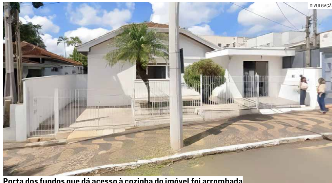
Porta dos fundos que dá acesso à cozinha do imóvel foi arrombada

Entre os itens levados estão um computador, um telefone celular da mar-