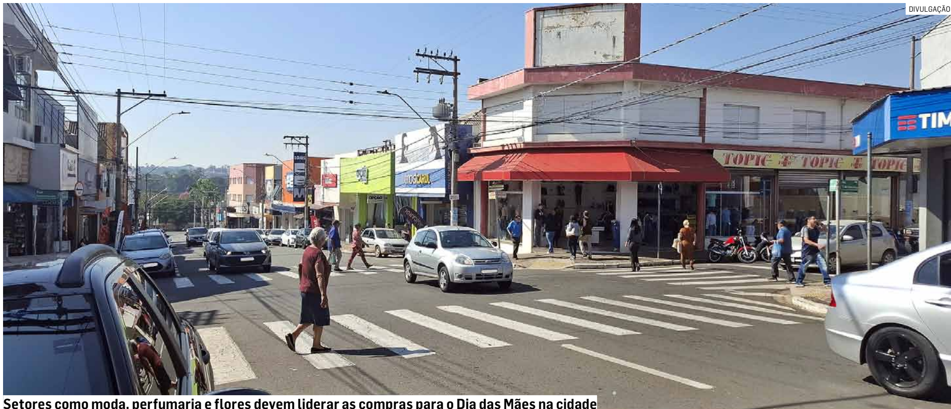
Setores como moda, perfumaria e flores devem liderar as compras para o Dia das Mães na cidade