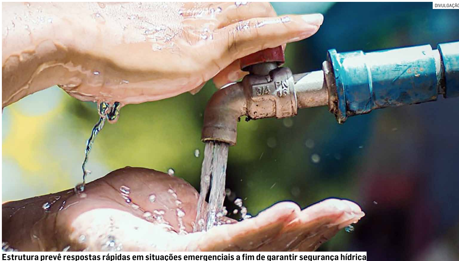
Estrutura prevê respostas rápidas em situações emergenciais a fim de garantir segurança hídrica

A criação do grupo ocorre após uma série de reclamações de moradores sobre mudanças no odor, sabor e coloração da água,