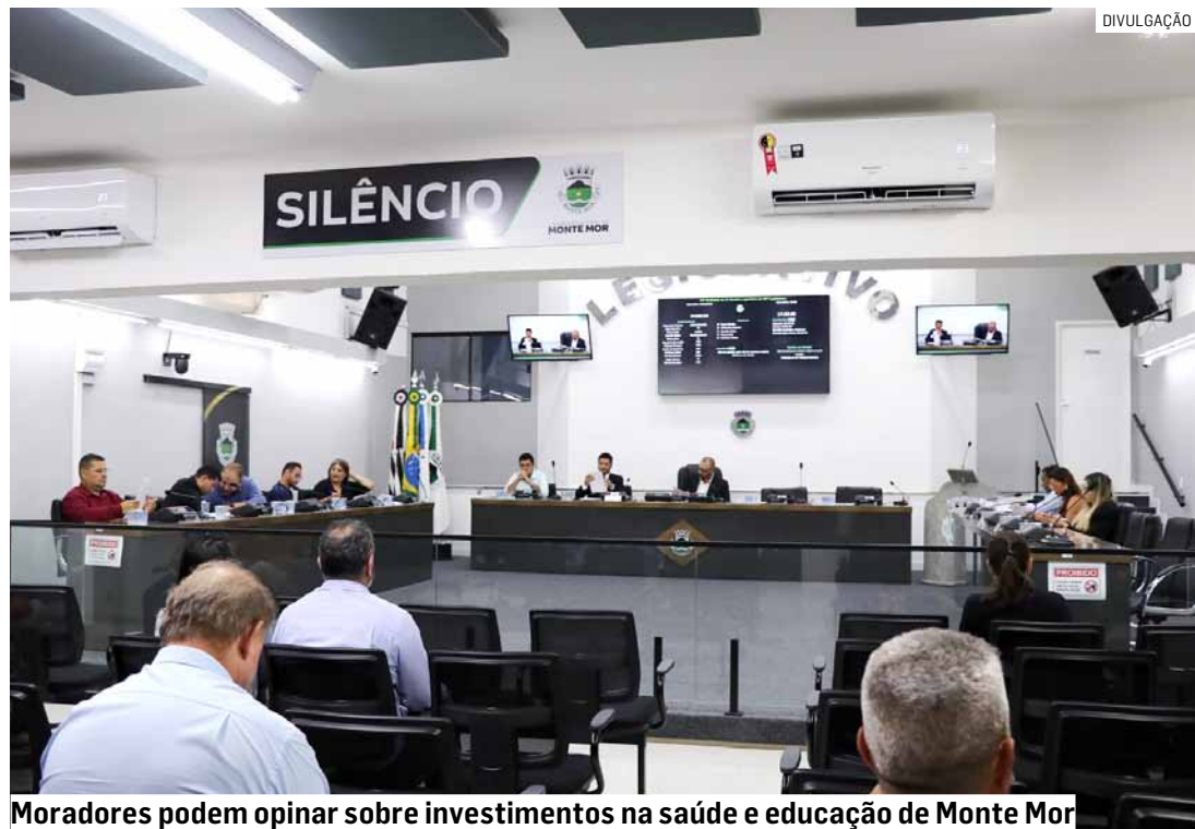
Moradores podem opinar sobre investimentos na saúde e educação de Monte Mor

A LDO é uma das principais peças do planejamento público e serve de base para a elaboração da Lei Orçamentária Anual (LOA), que define os gastos e investimentos do município para o ano seguinte.