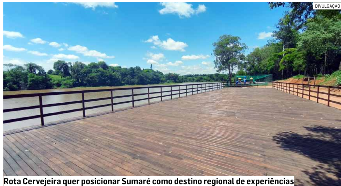
Rota Cervejeira quer posicionar Sumaré como destino regional de experiências

Da Redação • SUMARÉ tribunaliberal@tribunaliberal.com.br