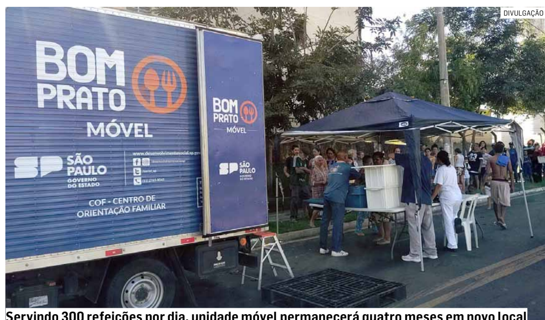
Servindo 300 refeições por dia, unidade móvel permanecerá quatro meses em novo local

Da Redação • SUMARÉ tribunaliberal@tribunaliberal.com.br