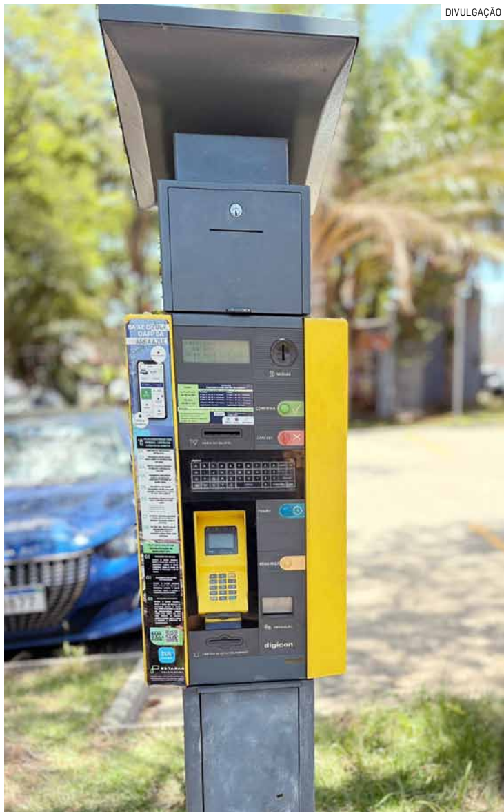
Prefeitura moveu ação contra Estapar apontando possíveis irregularidades na operação da Área Azul

Medida tem objetivo de avaliar a operação do estacionamento rotativo na cidade e esclarecer pontos questionados pela prefeitura em ação judicial; serviço da Área Azul continuará sendo operado pela Estapar em Americana por enquanto