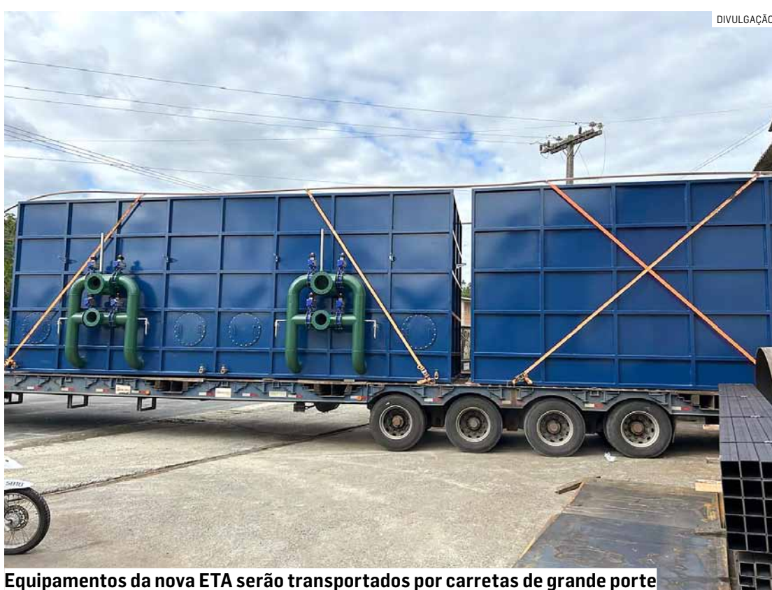
Equipamentos da nova ETA serão transportados por carretas de grande porte

A carreta com os equipamentos deve chegar ao município por volta das 10h, com parada programada na região do Portal Princesa Tecelã, no trecho central