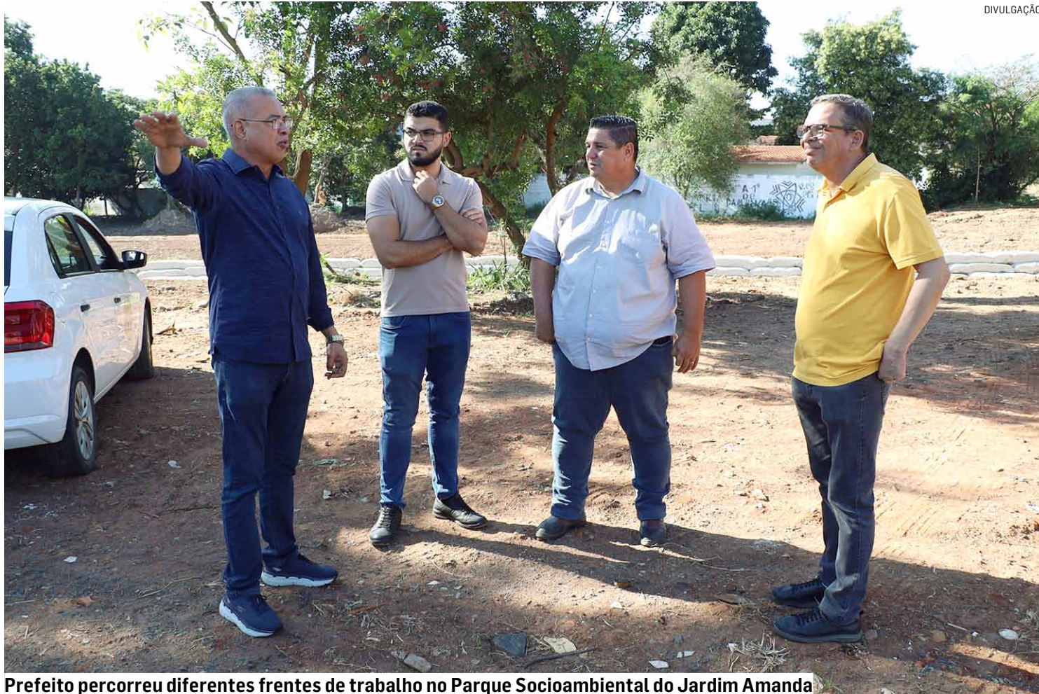
Prefeito percorreu diferentes frentes de trabalho no Parque Socioambiental do Jardim Amanda

Um dos principais pontos vistoriados foi o chamado “campo da mina”, espaço tradicional do bairro que passa por uma revitalização completa. O local ganha novo gramado, vestiários modernos e estrutura