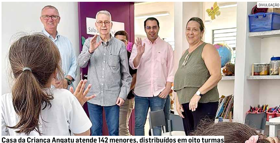
Casa da Criança Angatu atende 142 menores, distribuídos em oito turmas

Da Redação • AMERICANA tribunaliberal@tribunaliberal.com.br