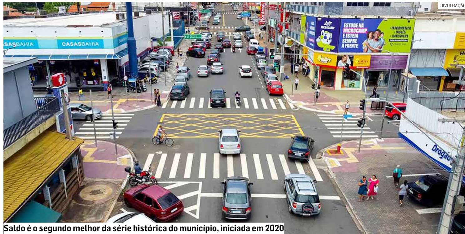
Saldo é o segundo melhor da série histórica do município, iniciada em 2020

Da Redação • HORTOLÂNDIA tribunaliberal@tribunaliberal.com.br