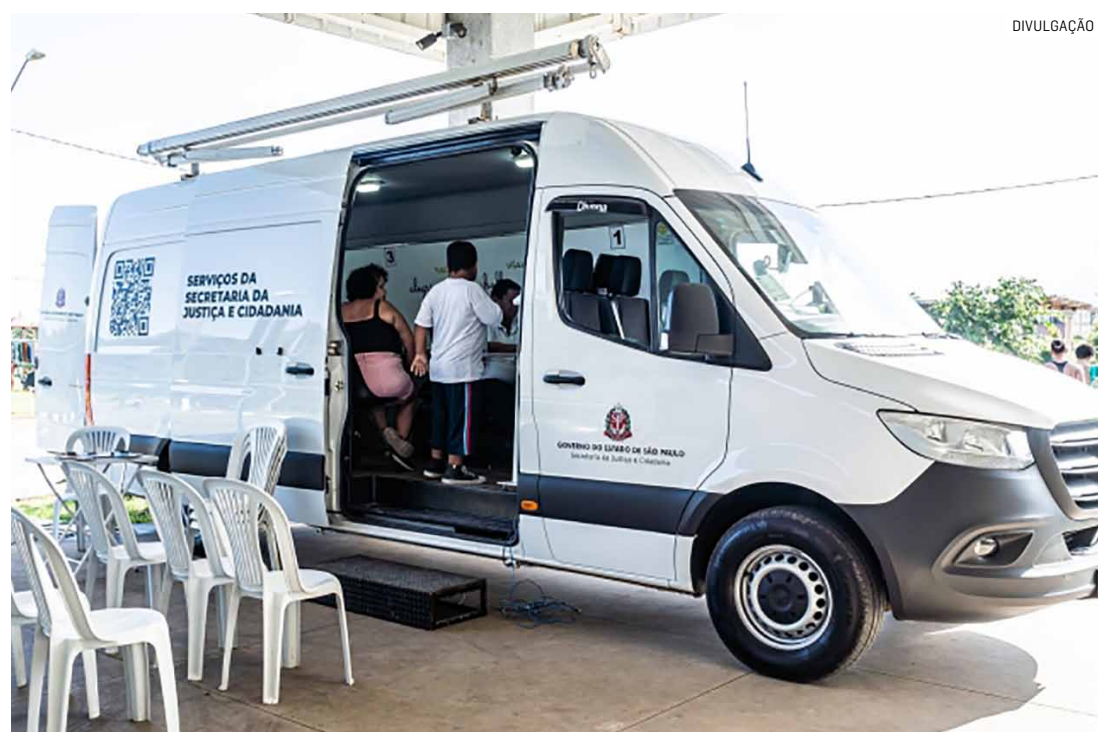
Trabalho acontecerá em frente à Prefeitura Municipal e ao lado do CRAS Paulista

Da Redação • MONTE MOR tribunaliberal@tribunaliberal.com.br