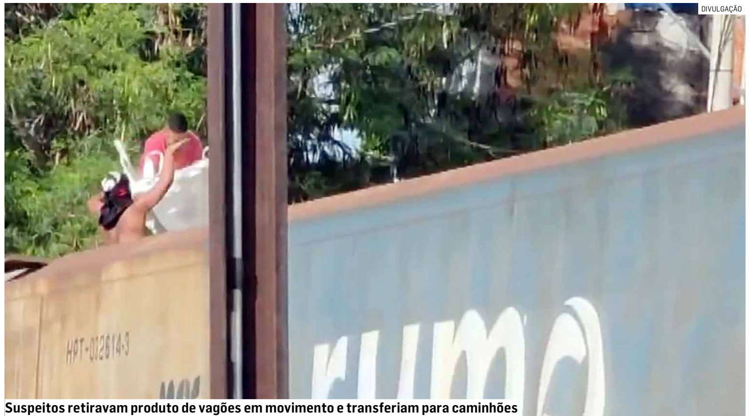
Suspeitos retiravam produto de vagões em movimento e transferiam para caminhões

De acordo com as investigações, o grupo atuava de maneira recorrente, aproveitando o deslocamento dos trens para cometer os crimes. Os suspeitos subiam nos vagões, mesmo em movimento, e retiravam a carga, que posteriormente era transferida para caminhões utilizados no transporte clandestino do produto.