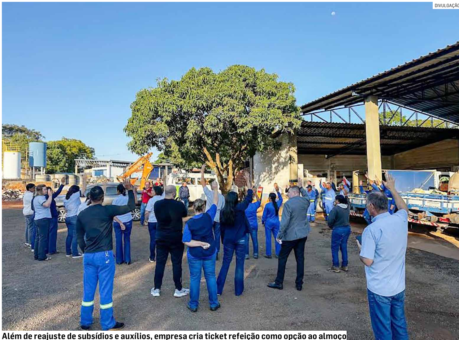
Além de reajuste de subsídios e auxílios, empresa cria ticket refeição como opção ao almoço

Outros itens foram reajustados no mesmo índice dos salários (5%): subsídio do plano médico de R$ 121,28; subsídio do plano odontológico de R$ 66,41; subsídio de óculos de grau, lentes de contato e consulta de R$ 262,79; subsídio de material escolar de R$