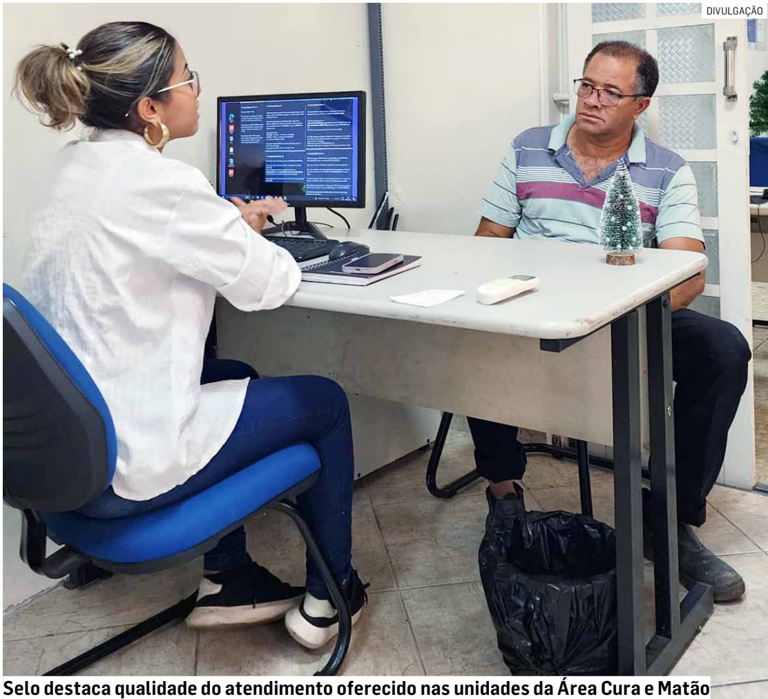
Selo destaca qualidade do atendimento oferecido nas unidades da Área Cura e Matão

“Esse reconhecimento mostra que Sumaré está no caminho certo, investindo em políticas públicas eficientes, em parcerias sólidas e em um atendimento de qualidade para quem gera emprego e renda. O Sebrae Aqui é uma ferramenta fundamental para apoiar nossos empreendedores e promover o desenvolvimento econômico da cidade”, destacou.