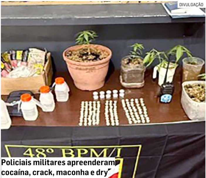
48° BPM/I Policiais militares apreenderam cocaína, crack, maconha e dry

Os dois suspeitos foram encaminhados ao Plantão Policial de Sumaré, onde a ocorrência foi registrada. Ambos permaneceram à disposição da Justiça.