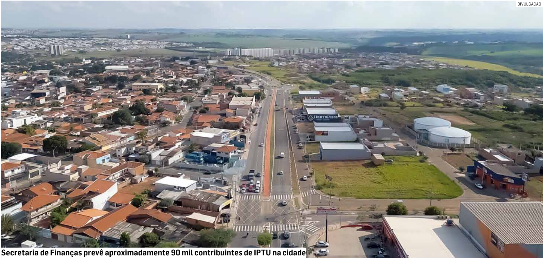
Secretaria de Finanças prevê aproximadamente 90 mil contribuintes de IPTU na cidade

Já os contribuintes em atraso podem regularizar a situação aderindo ao REFIS (Programa de Recuperação Fiscal) que, neste ano, foi prorrogado até o dia 31 de março. Dúvidas sobre o programa podem ser esclarecidas pelo WhatsApp (19) 992888400. O atendimento deve ser marcado de maneira online neste link: facilhortolandia.sp.gov.br .