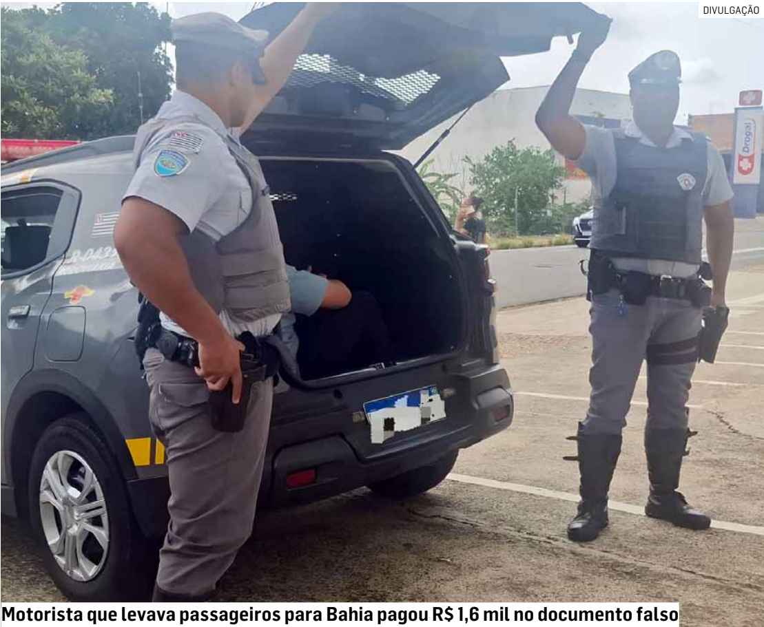
Motorista que levava passageiros para Bahia pagou R$ 1,6 mil no documento falso

No entanto, ao apresentar a CNH em formato digital por meio do celular, o motorista levantou suspeitas. Após consulta aos sistemas oficiais, os policiais constataram que o documento apresentado não era autêntico.