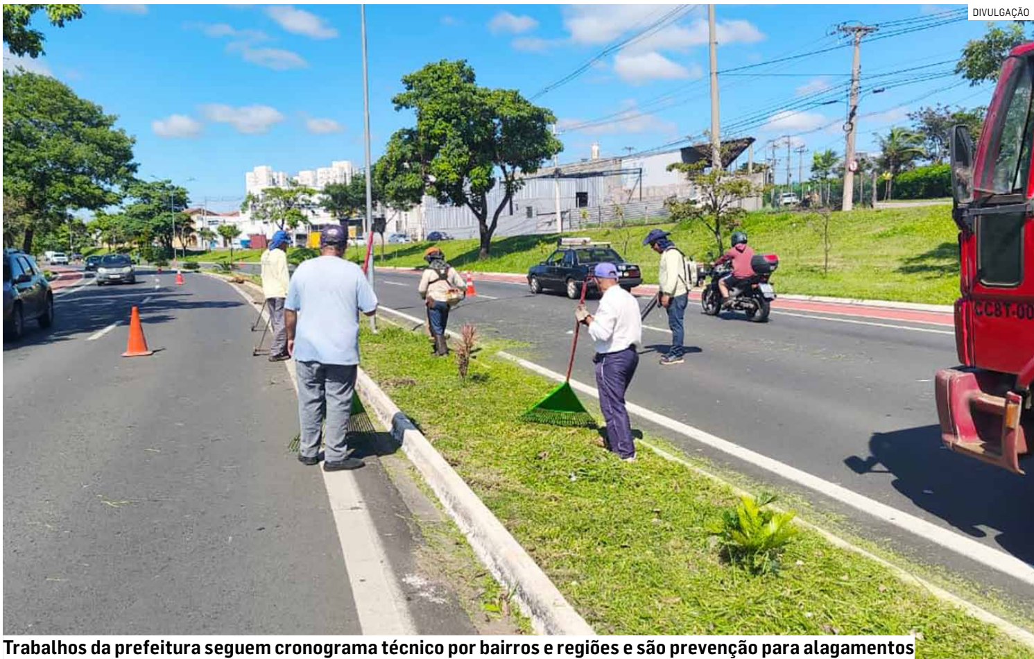
Trabalhos da prefeitura seguem cronograma técnico por bairros e regiões e são prevenção para alagamentos

Entre os principais serviços executados estão a roçagem de áreas públicas e canteiros, limpeza de ruas, praças e pontos de descarte irregular, além da poda de árvores, que contribui para a melhoria da iluminação pública e a prevenção de riscos à população. A operação também contempla a recuperação das estradas vicinais rurais, assegurando melhores condições de tráfego e favorecendo o escoamento da produção agrícola.