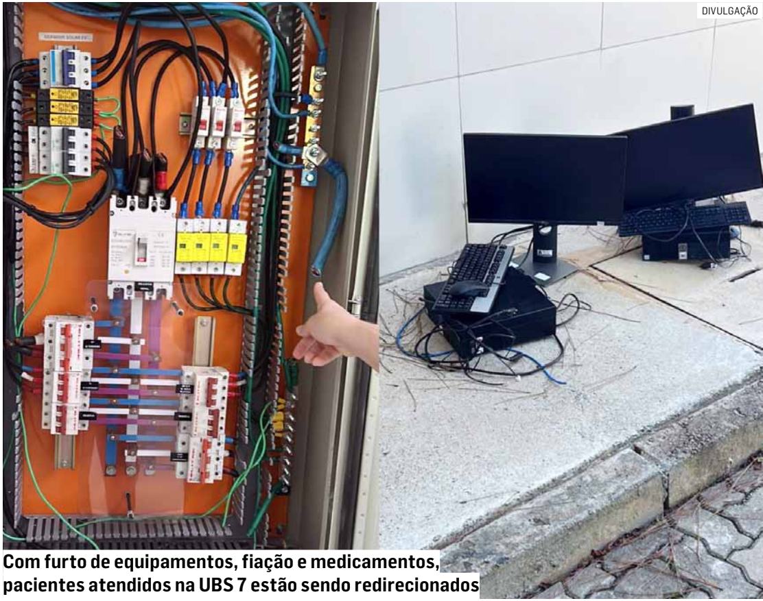
Com furto de equipamentos, fiação e medicamentos, pacientes atendidos na UBS 7 estão sendo redirecionados

A Unidade Básica de Saúde 7, localizada no Jardim Nossa Senhora de Fátima, em Nova Odessa, foi alvo de invasão e furto. Servidores que chegaram para trabalhar por volta das 6h30 desta segunda-feira (5) encontraram o prédio violado, com a porta da farmácia arrombada e diversos equipamentos e materiais levados. Segundo a prefeitura, foram furtados computadores, uma televisão, telefones, medicamentos, além de fiação e cabos de energia elétrica. A ação criminosa também provocou danos na parte elétrica da unidade, comprometendo a infraestrutura e o funcionamento do espaço.