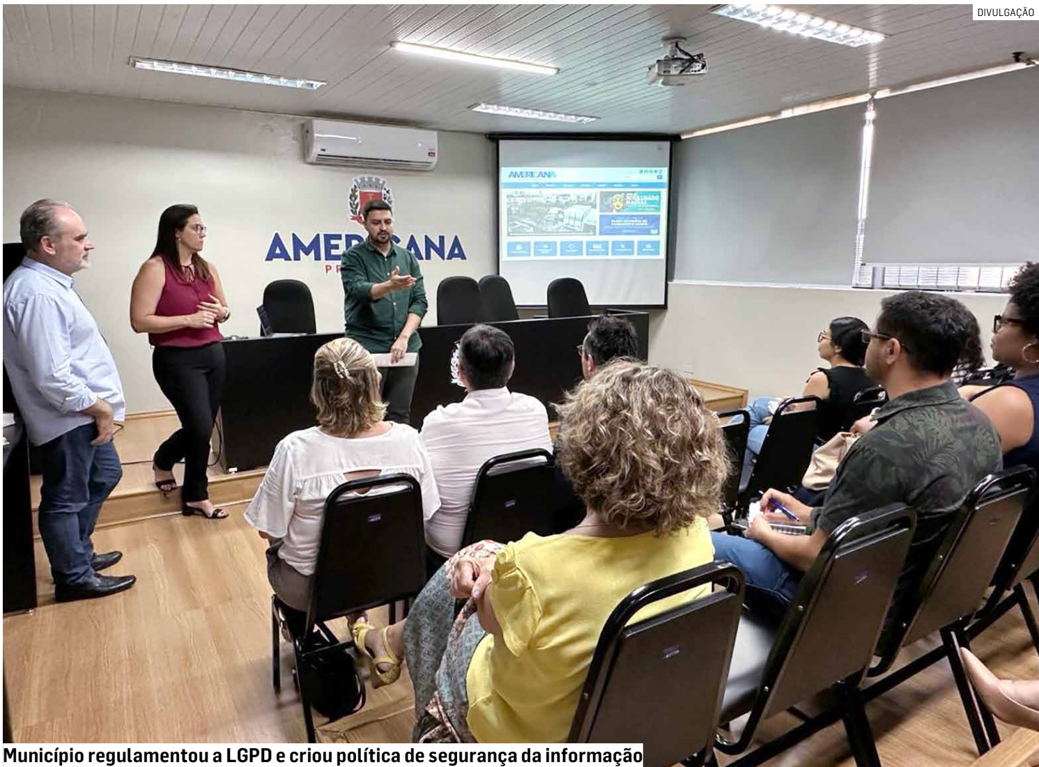
Município regulamentou a LGPD e criou política de segurança da informação

Entre as principais ações está a elaboração e publicação do Plano Diretor de Tecnologia da Informação (PDTI), marco fundamental para direcionar as ações e investimentos da prefeitura nos próximos quatro anos. O documento, resultado de um amplo processo de participação intersecretarial, reuniu servidores e gestores de todos os órgãos municipais em diversas reuniões e debates, garantindo que o plano esteja alinhado às reais necessidades da administração