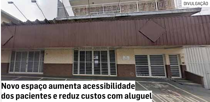
Novo espaço aumenta acessibilidade dos pacientes e reduz custos com aluguel