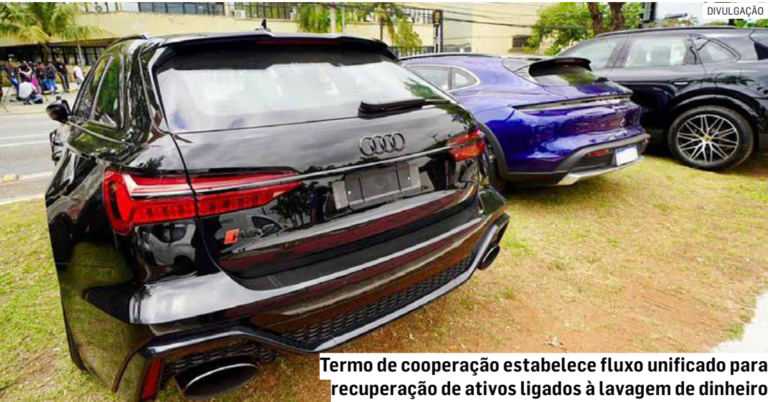
Termo de cooperação estabelece fluxo unificado para recuperação de ativos ligados à lavagem de dinheiro

Estado de São Paulo e do Núcleo de Recuperação de Ativos da Polícia Civil no acompanhamento de leilões judiciais e na fiscalização da regularidade dos procedimentos de alienação antecipada. TRANSPARÊNCIA E CONTROLE O termo estabelece mecanismos de transparência e controle, com auditoria permanente dos valores destinados ao Fisp, fiscalização interna da Secretaria de Segurança Pública e acompanhamento pelo Tribunal de Contas do Estado (TCE). Relatórios anuais circunstanciados deverão ser apresentados ao Judiciário, detalhando a aplicação dos recursos em políticas públicas de segurança. Com vigência de 60 meses, o acordo busca fortalecer a cooperação institucional, padronizar a gestão dos ativos apreendidos e ampliar a efetividade da persecução penal, atacando diretamente o financiamento do crime organizado e revertendo os recursos ilícitos em benefício da população paulista.