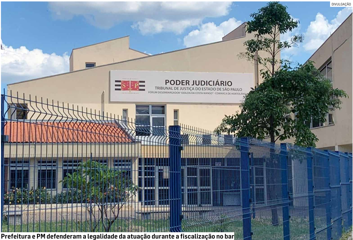
Prefeitura e PM defenderam a legalidade da atuação durante a fiscalização no bar

A 1ª Vara Cível de Hortolândia decidiu extinguir, sem julgamento do mérito, o mandado de segurança impetrado por um bar e cervejaria após a própria parte autora solicitar a desistência da ação. O caso tratava de uma disputa envolvendo a atuação da Polícia Militar e da Prefeitura de Hortolândia durante uma fiscalização realizada em agosto passado, na região do Jardim das Paineiras. O processo foi analisado pelo juiz Rafael Imbrunito Flores, que homologou o pedido de desistência apresentado pelo estabelecimento e determinou o arquivamento dos autos. Segundo a inicial, o bar alegava operar regularmente, com alvarás e licenças em dia. No dia 2 de agosto de 2025, por volta das 21h, o local foi abordado por policiais militares sob acusação de perturba-