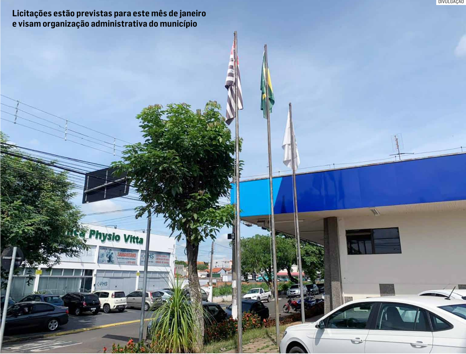
Licitações estão previstas para este mês de janeiro e visam organização administrativa do município

Já o segundo edital trata da Concorrência Presencial 04/2025, cujo objetivo é a contratação de uma instituição financeira para o processamento e gerenciamento dos créditos da folha de pagamento dos servidores municipais de Monte Mor.