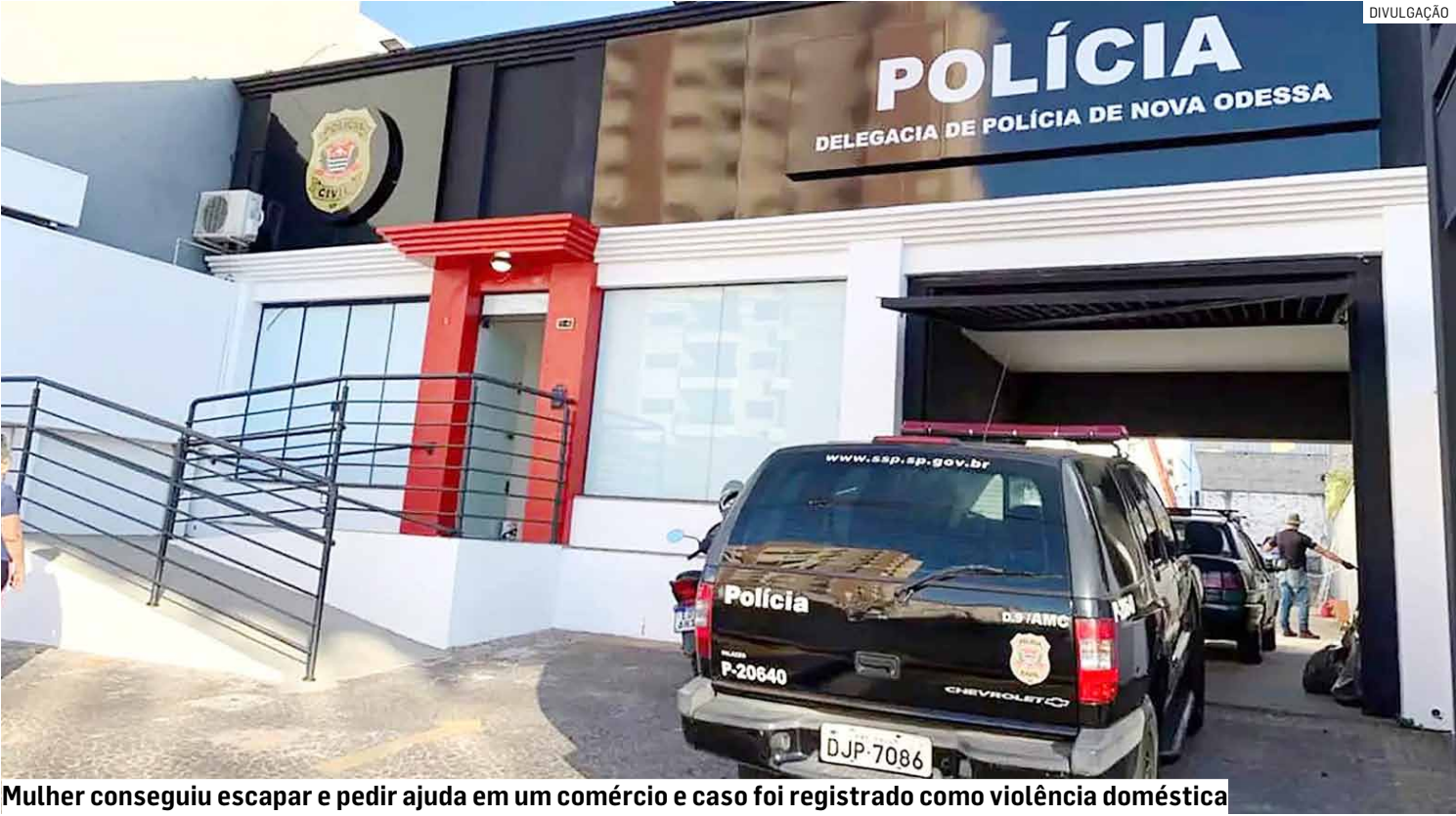
Mulher conseguiu escapar e pedir ajuda em um comércio e caso foi registrado como violência doméstica

Ainda segundo o registro policial, o homem desferiu um soco no rosto da vítima e a puxou pelos cabelos, arrastando-a para dentro do veículo. Em seguida, ele deixou o lo-