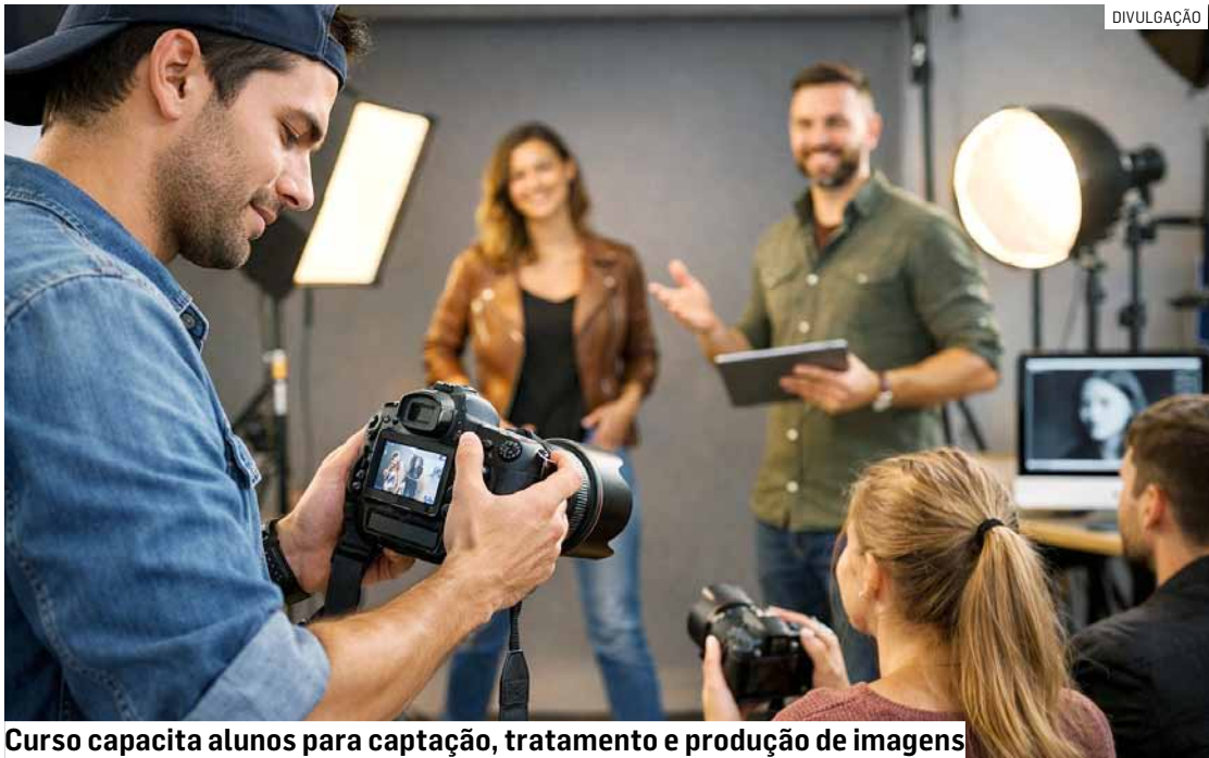
Curso capacita alunos para captação, tratamento e produção de imagens

Ainda, segundo a pesquisa, com o avanço do comércio eletrônico e das plataformas digitais, áreas como fotografia para e-commerce, produção de conteúdo para redes sociais, além de casamentos e eventos,