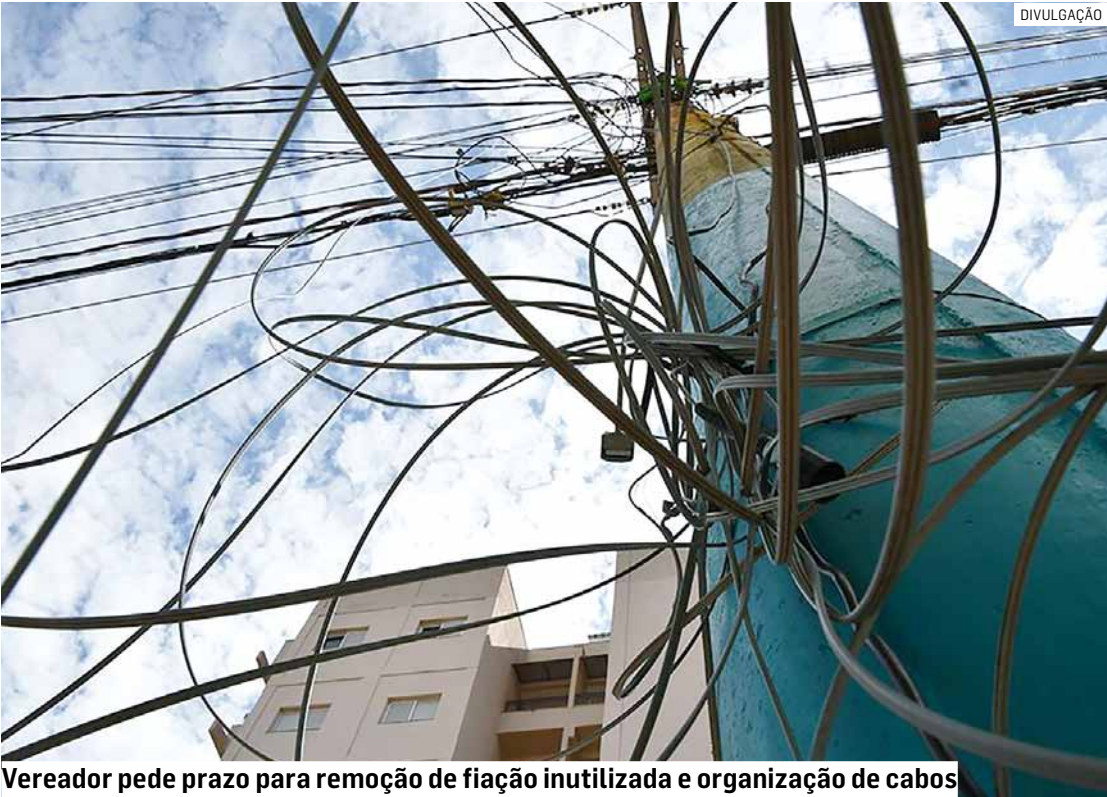
Vereador pede prazo para remoção de fiação inutilizada e organização de cabos

13 milhões. As intervenções incluem serviços de pintura, troca de telhas, revisão das redes elétrica e hidráulica, reparos em pisos, correção de trincas e outras melhorias estruturais, com o objetivo de garantir ambientes mais seguros para alunos e profissionais da educação. De acordo com o prefeito Danilo Barros (PL), o investimento tem impacto direto no processo de aprendizagem. Entre as unidades contempladas está a EMESFM Vitor Szczepanski e Souza e Silva, alvo de adequações para que os alunos possam retornar ao prédio de origem, interditado no começo de 2025 devido a risco estrutural. As ações estão sendo executadas de forma integrada pelas secretarias de Obras e de Educação. Parte dos serviços será realizada durante o recesso letivo, estratégia adotada para reduzir transtornos às atividades escolares e preservar o calendário de 2026, segundo a prefeitura.