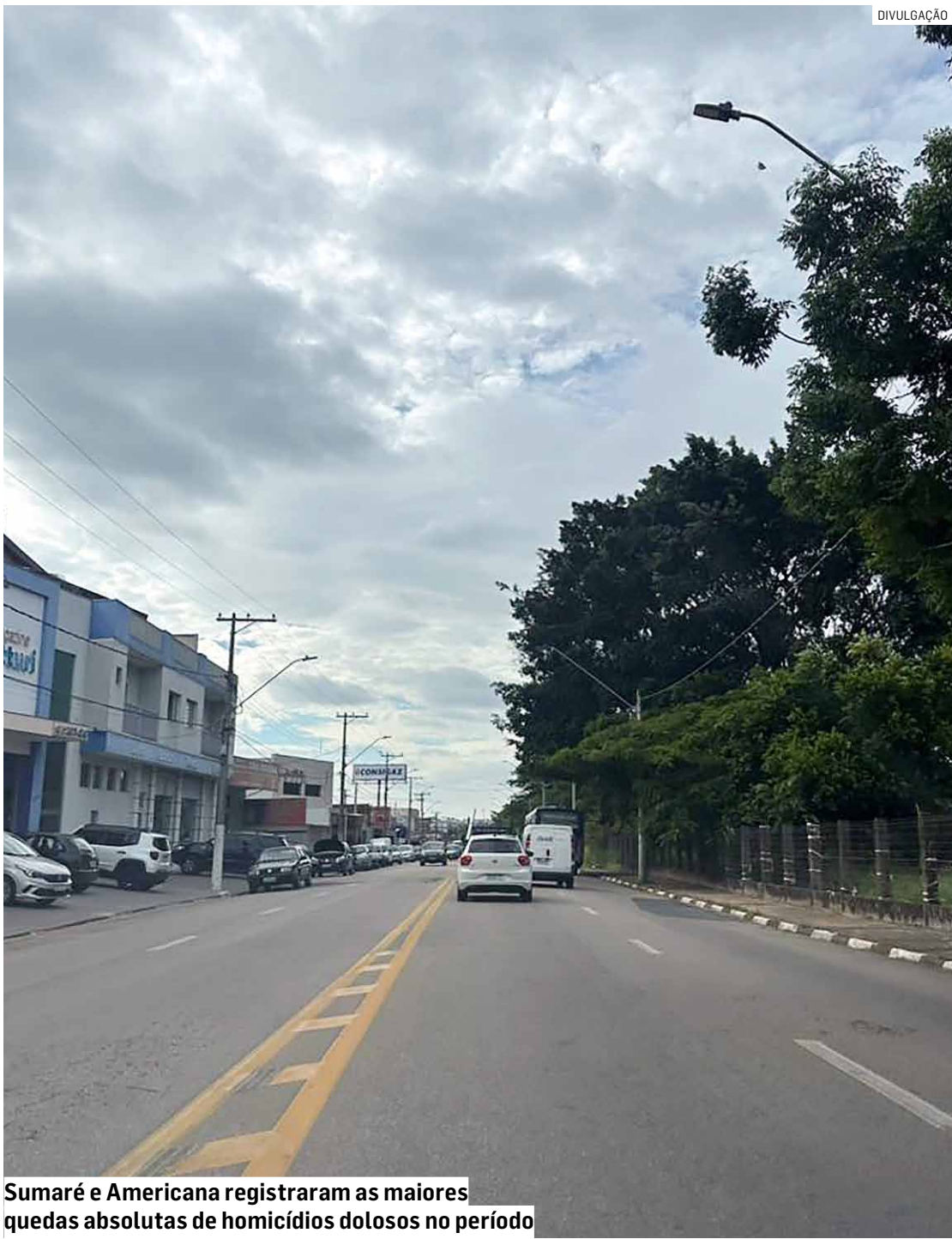
Sumaré e Americana registraram as maiores quedas absolutas de homicídios dolosos no período

Estatísticas oficiais mostram queda da violência letal entre as cidades de Americana, Hortolândia, Monte Mor, Nova Odessa, Sumaré e Paulínia; assassinatos caíram de 72 para 51 casos entre janeiro e novembro; latrocínios diminuíram