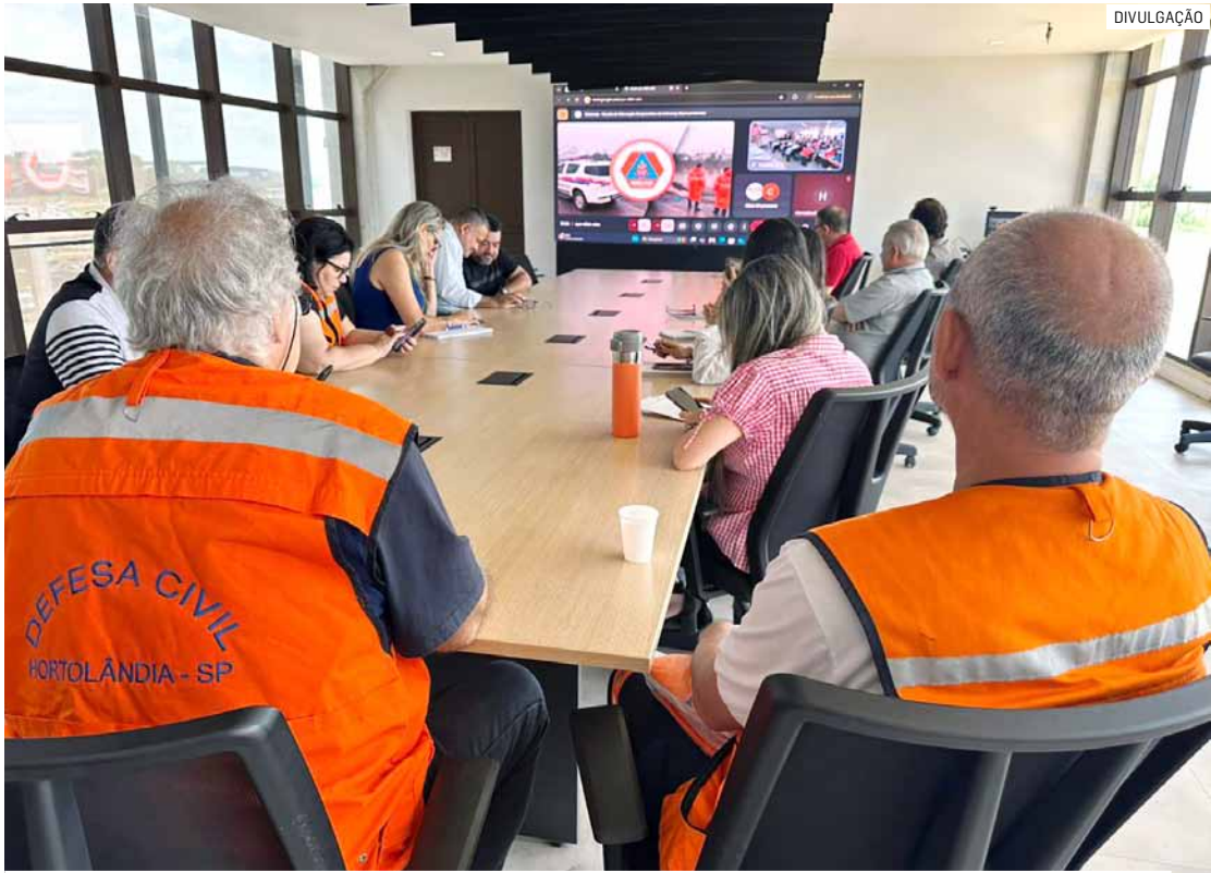
Centro de Operação de Emergência da Defesa Civil Municipal fica no Gabinete do Prefeito

O novo Radar Meteorológico foi adquirido pelos municípios da RMC (Região Metropolitana de