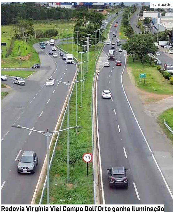
Rodovia Virgínia Viel Campo Dall'Orto ganha iluminação

Revitalização na via de entrada de Sumaré avança com verba própria