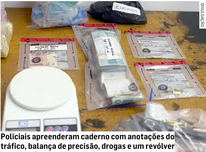
Policiais apreenderam caderno com anotações do tráfico, balança de precisão, drogas e um revólver

Morreu o homem de 43 anos que trocou tiros na tarde desta quarta-feira (3) com policiais do 10º Baep (Batalhão de Ações Especiais de Polícia), em Sumaré. A equipe recebeu, por volta do meio-dia, a informação de que um motociclista estaria abastecendo um ponto de tráfico no Jardim Santa Terezinha, região de Nova Veneza. Ao chegarem ao local, os policiais localizaram dois homens em uma moto com as características descritas e deram ordem de parada, que não foi obedecida. Durante a tentativa de abordagem, o garupa desceu da motocicleta e fugiu a pé, enquanto o condutor conseguiu escapar e não foi