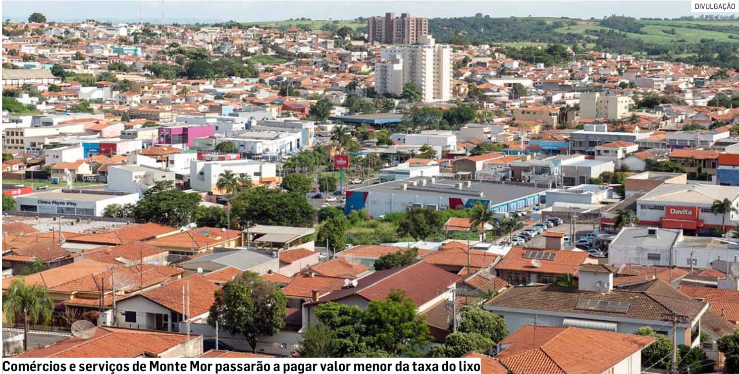
Comércios e serviços de Monte Mor passarão a pagar valor menor da taxa do lixo

Revogação aprovada em sessão extraordinária tira acréscimos de 50% a 60% cobrados desde 2008; mudança no Código Tributário beneficia lojas, serviços e indústrias, reduzindo carga do setor produtivo