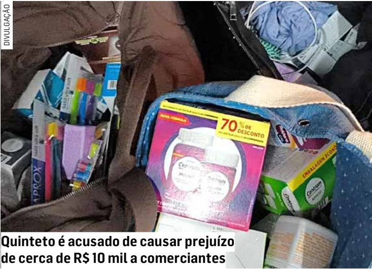
Quinteto é acusado de causar prejuízo de cerca de R$ 10 mil a comerciantes

Ao perceber que o automóvel circulava por vias que concentram grande número de drogarias, a Gama intensificou o patrulhamento. Em seguida, os agentes realizaram a abordagem. No interior do veículo, foram encontrados medicamentos, produtos de beleza e itens de higiene. Os materiais coincidiam com mercadorias furtadas em diversos estabelecimentos. Funcionários de cinco farmácias foram encaminhados à Delegacia de Polícia e reconheceram parte dos produtos apreendidos. Segundo a Gama, câmeras de segurança registraram a atuação do grupo.