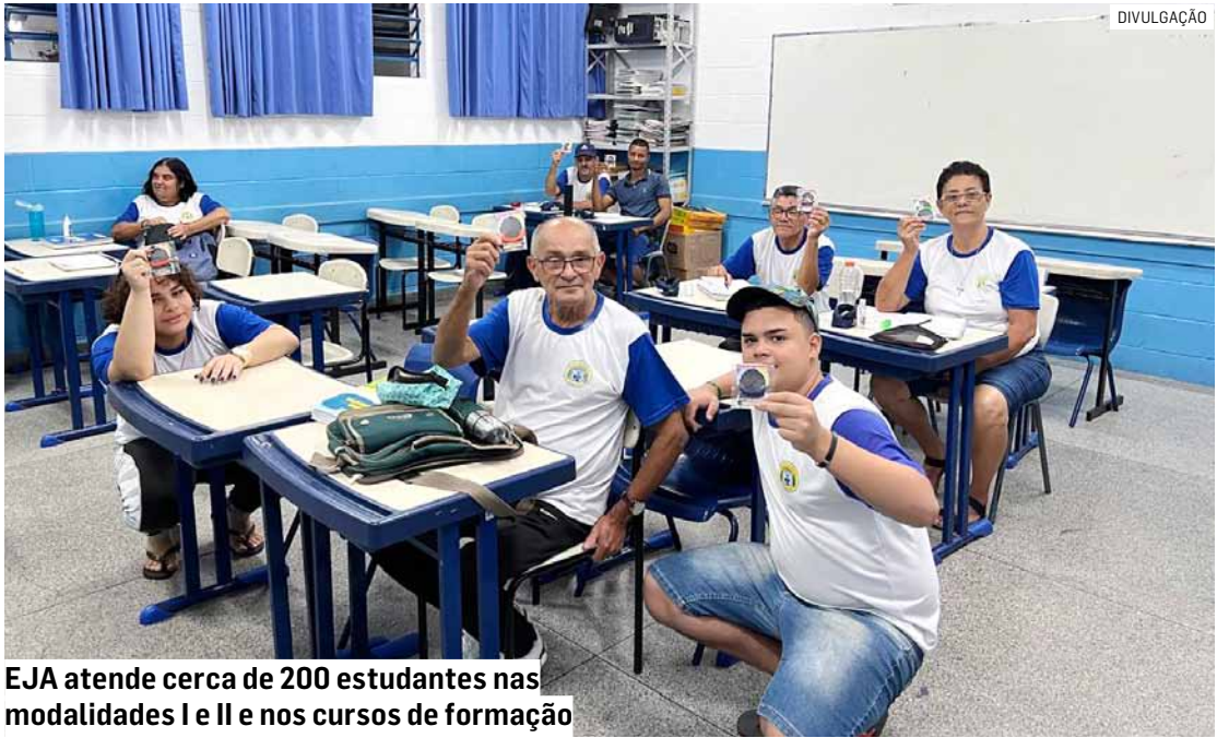
EJA atende cerca de 200 estudantes nas modalidades I e II e nos cursos de formação

A EJA é destinada a jovens a partir de 15 anos e adultos que desejam retomar os estudos e concluir o Ensino Fundamental. Ao todo, são oferecidas mais de 500 vagas, distribuídas nas quatro escolas que funcionam como polos da EJA. A formação contempla as