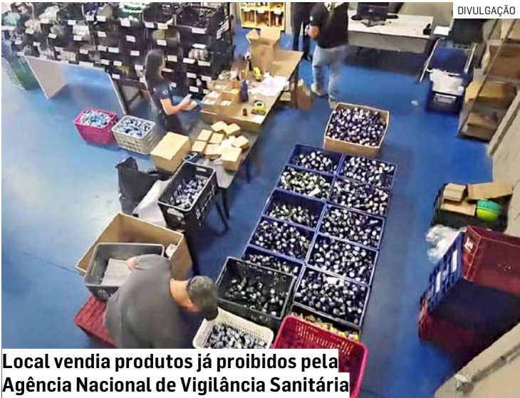
Local vendia produtos já proibidos pela Agência Nacional de Vigilância Sanitária

O responsável legal pelo estabelecimento foi conduzido à Delegacia de Polícia