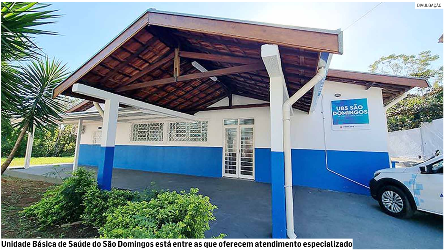
Unidade Básica de Saúde do São Domingos está entre as que oferecem atendimento especializado

Segundo o relatório da pasta, 13 Unidades Básicas de Saúde mantêm ginecologistas em atividade — entre elas Mathiensen, Vila Galo, Cariobinha, Praia Azul, São José, São Vito, Boer, São Domingos, Gramado, Parque das Nações, Dona Rosa, Jardim São Paulo e Ipiranga. Ao todo, 12 profissionais se revezam nas agendas, cujos ho-