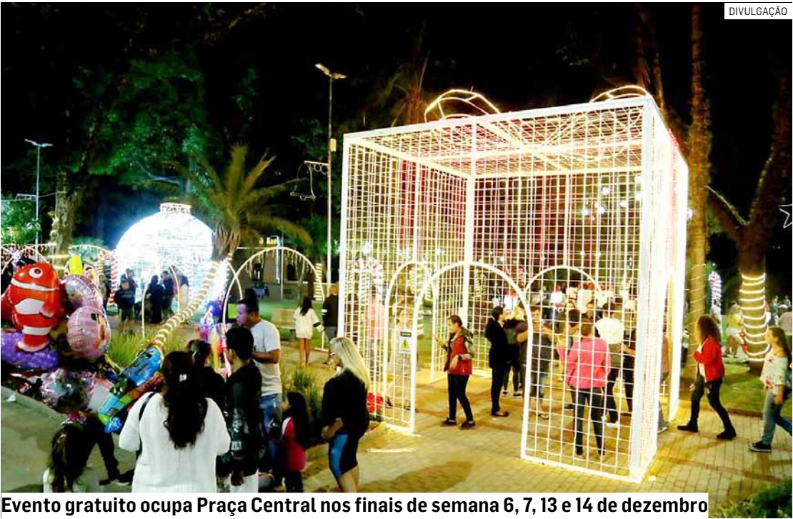
Evento gratuito ocupa Praça Central nos finais de semana 6, 7, 13 e 14 de dezembro

Da Redação • NOVA ODESSA tribunaliberal@tribunaliberal.com.br