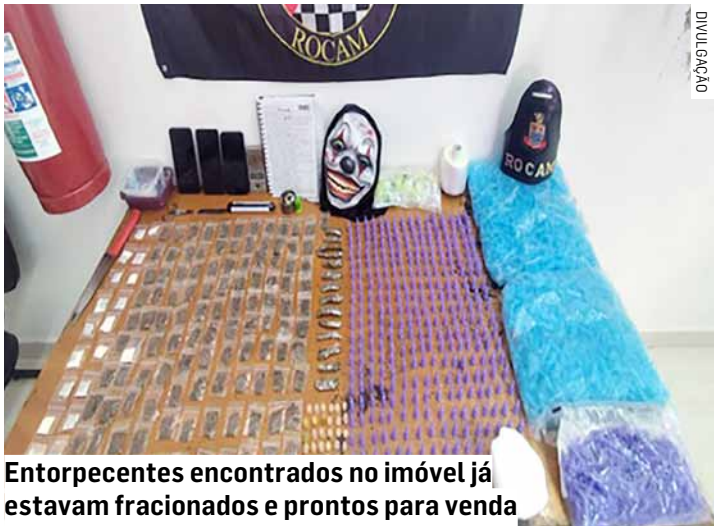
Entorpecentes encontrados no imóvel já estavam fracionados e prontos para venda

A Polícia Militar apreendeu diversas porções de entorpecentes nesta quarta-feira (3) após patrulhamento na Avenida Emílio Bosco, no Jardim Morumbi, em Sumaré. A ocorrência teve início quando a equipe avistou três homens em frente ao portão de um condomínio residencial. Ao perceberem a aproximação das viaturas, os suspeitos correram em direções distintas. Um deles, que carregava uma mochila, foi seguido pelos policiais até o interior de um dos blocos do condomínio. Durante o acompanhamento, os agentes notaram dois indivíduos saindo de um apartamento, de onde vinha um forte odor de maconha.