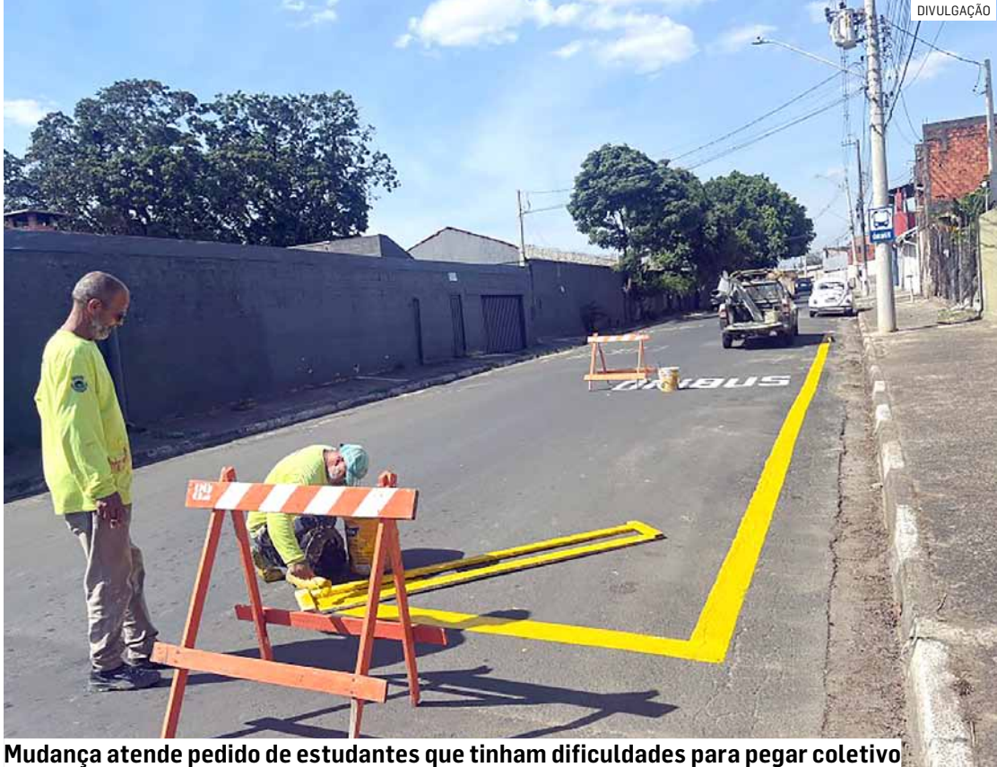
Mudança atende pedido de estudantes que tinham dificuldades para pegar coletivo

O objetivo da mudança é ajudar os alunos que estudam no período noturno e reclamavam de dificulda-