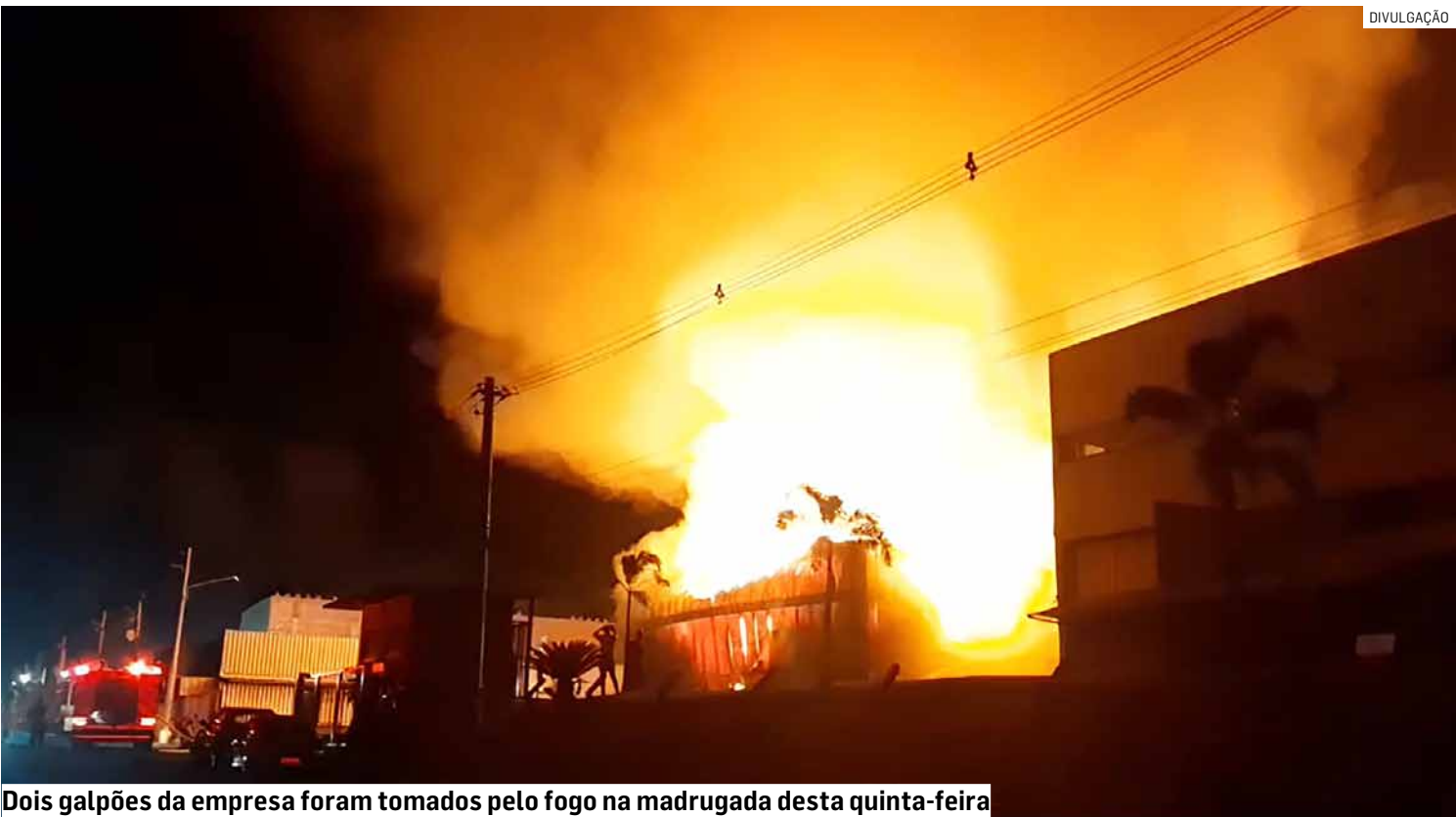
Dois galpões da empresa foram tomados pelo fogo na madrugada desta quinta-feira

trabalha com materiais como celulose, papel e plástico, utilizados na fabricação de tapetes higiênicos para animais. Por causa dos insumos presentes no local, o combate ao incêndio exigiu atenção especial. Segundo o tenente Pedro Henrique Costa Bernardo, os tapetes têm alta capacidade de absorção, semelhante à de fraldas, o que impede que a água chegue rapidamente ao foco do fogo. O bombeiro explicou que, devido a essa característica, foi necessário remover manualmente grandes volumes de material