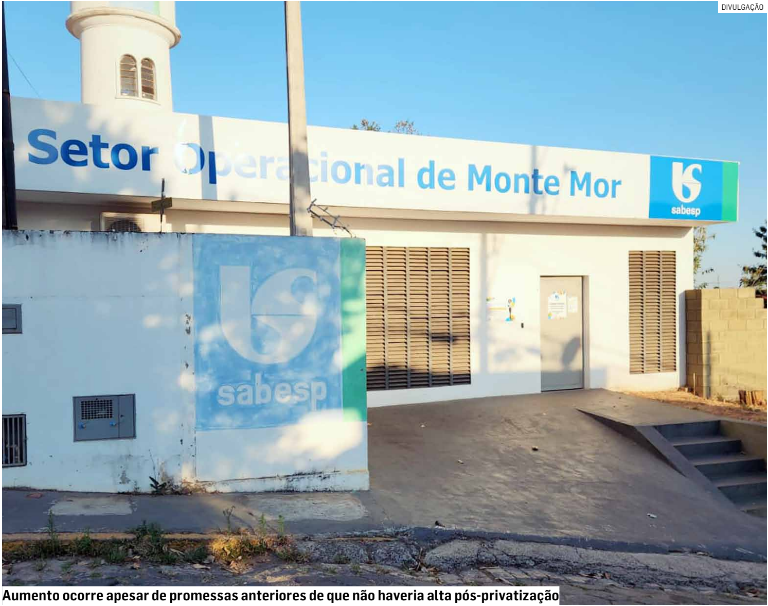
Aumento ocorre apesar de promessas anteriores de que não haveria alta pós-privatização

Antes da privatização, o governo estadual havia afirmado que o valor das tarifas não aumentaria para os consumidores. Posteriormente, durante o processo de venda da companhia, o discurso mudou: o governo passou a defender que os reajustes seguiriam um “índice