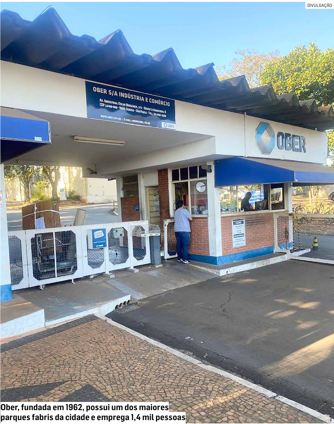
Ober, fundada em 1962, possui um dos maiores parques fabris da cidade e emprega 1,4 mil pessoas

A companhia atua na fabricação de não tecidos agulhados a partir de fibras naturais, mistas e sintéticas, suprindo diversos setores – como automotivo, geosintéticos para obras de engenharia civil, calçadista, moveleiro, filtração industrial, limpeza institucional e o segmento de cama, mesa e banho. A empresa também enfatiza compromisso com a sustentabilidade, afirmando reprocessar um volume de resíduos equivalente a 420 milhões de garrafas PET por ano, que entram na linha de produção como matéria-prima. Ao longo de mais de seis décadas, a Ober é fornecedora no mercado interno e no Mercosul, com produtos presentes em todo o território nacional. A companhia destaca que emprega aproximadamente 1.400 colaboradores diretos, além de gerar milhares de empregos indiretos e manter uma rede de parceiros e fornecedores que depende do funcionamento regular da fábrica em Nova Odessa. A crise, porém, foi se aprofundando nos últimos anos. Segundo a exposição feita à Justiça, a companhia até chegou a registrar um ciclo de crescimento durante a pandemia de Covid-19. Entre 2020, 2021 e 2022, a receita operacional líquida avançou 18,3%, 38,2% e 12,3%, respectivamente, impulsionada sobretudo pela redução das importações vindas da Chi-