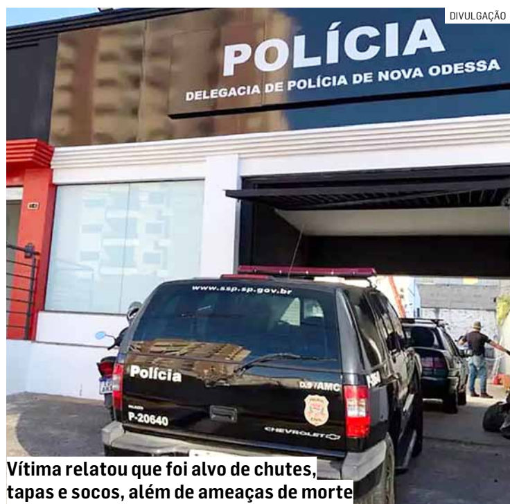
Vítima relatou que foi alvo de chutes, tapas e socos, além de ameaças de morte