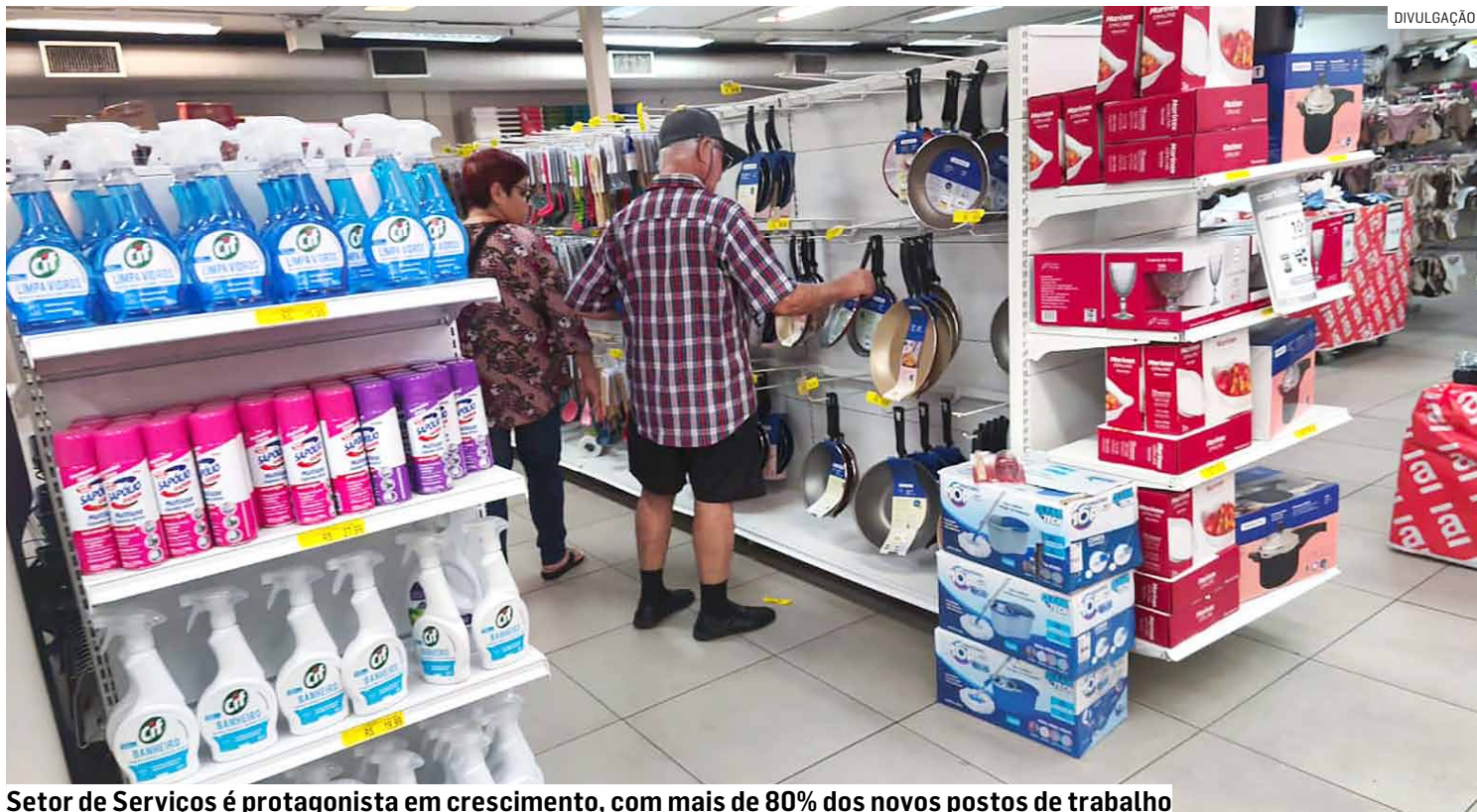
Setor de Serviços é protagonista em crescimento, com mais de 80% dos novos postos de trabalho

Outro dado do relatório técnico elaborado pelo De-