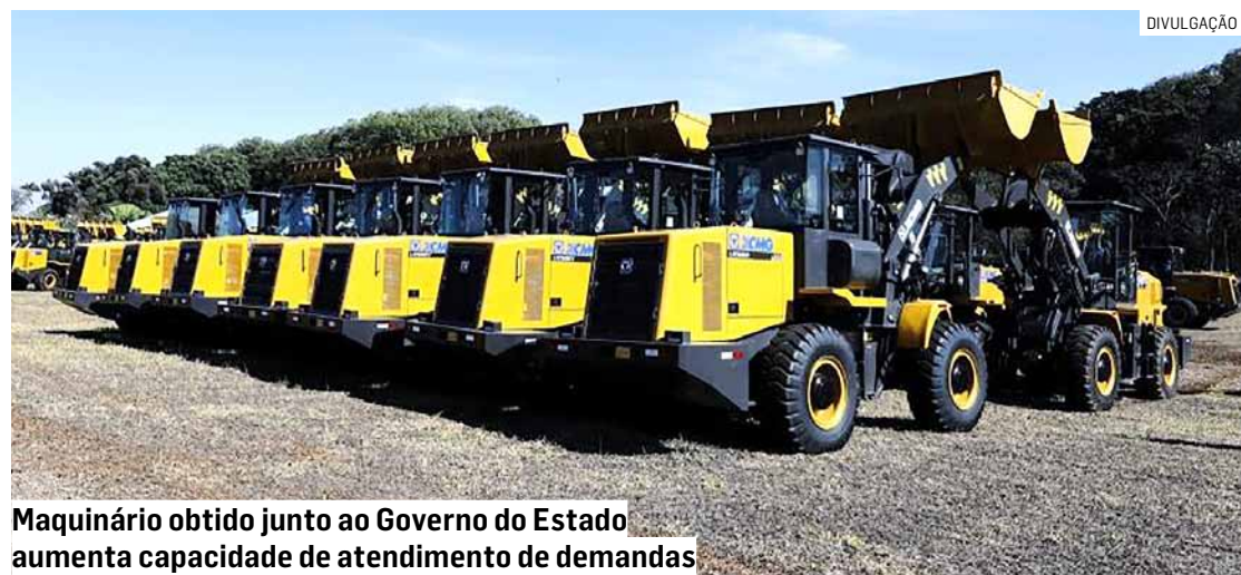
Maquinário obtido junto ao Governo do Estado aumenta capacidade de atendimento de demandas

Para a Prefeitura de Monte Mor, o recebimento desta máquina reforça o diálogo institucional com o governo estadual para garantir recursos para o avanço da cidade. A continuidade dos processos de formalização e aquisição da motoniveladora já estão em andamento.