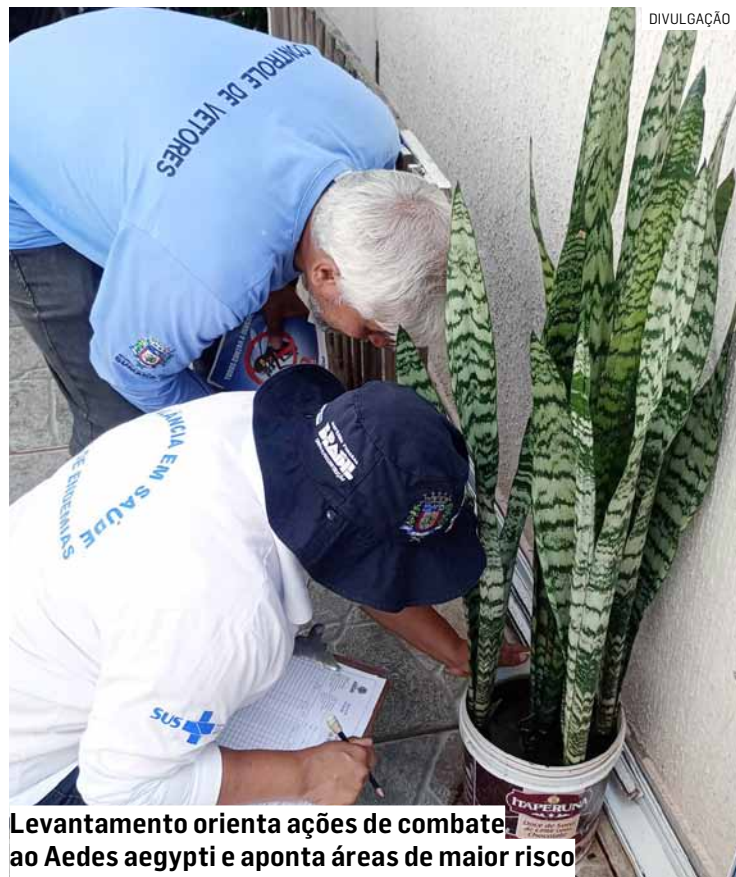
Levantamento orienta ações de combate ao Aedes aegypti e aponta áreas de maior risco