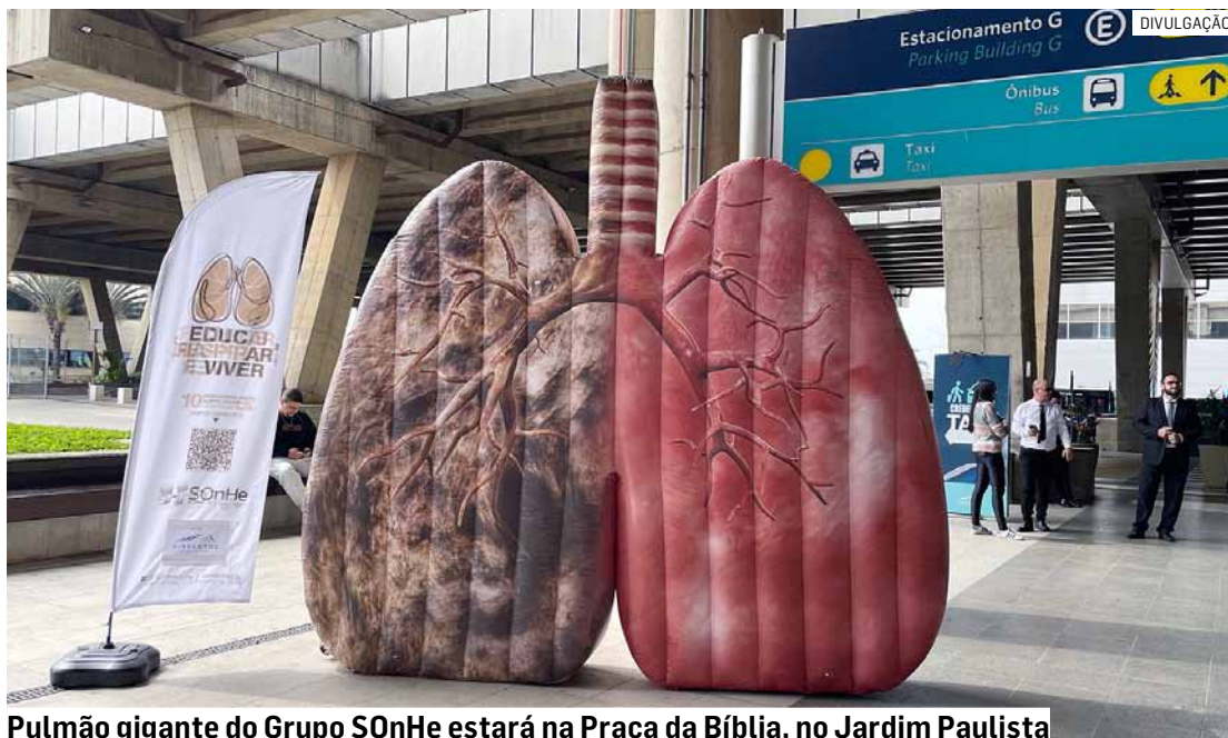
Pulmão gigante do Grupo SOnHe estará na Praça da Bíblia, no Jardim Paulista

De forma lúdica e interativa, a estrutura permite ao público visualizar os efeitos causados pelo cigarro e tem como objetivo conscientizar de forma didática e impactante sobre os riscos do tabagismo e a importância da prevenção.