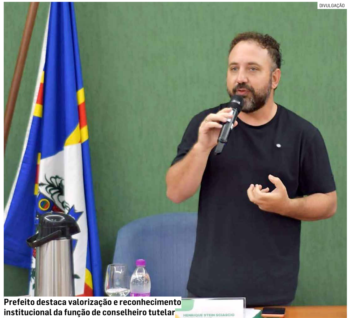
Prefeito destaca valorização e reconhecimento institucional da função de conselheiro tutelar

Com a mudança, a expectativa da administração municipal é fortalecer as políticas públicas voltadas à infância e juventude, ampliando a capacidade de atendimento e a eficiência das ações realizadas pelos conselhos tutelares no município.