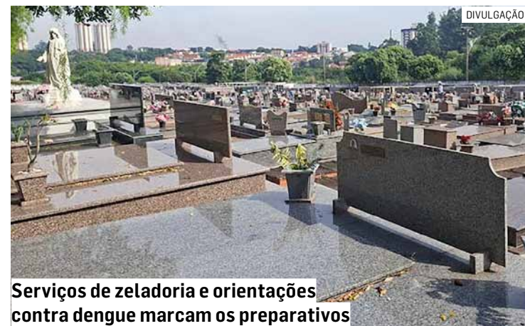
Serviços de zeladoria e orientações contra dengue marcam os preparativos

Para garantir a receptividade dos visitantes, uma equipe de oito servidores foi destacada durante toda a semana que antecede a data para realizar serviços de limpeza geral, roçagem