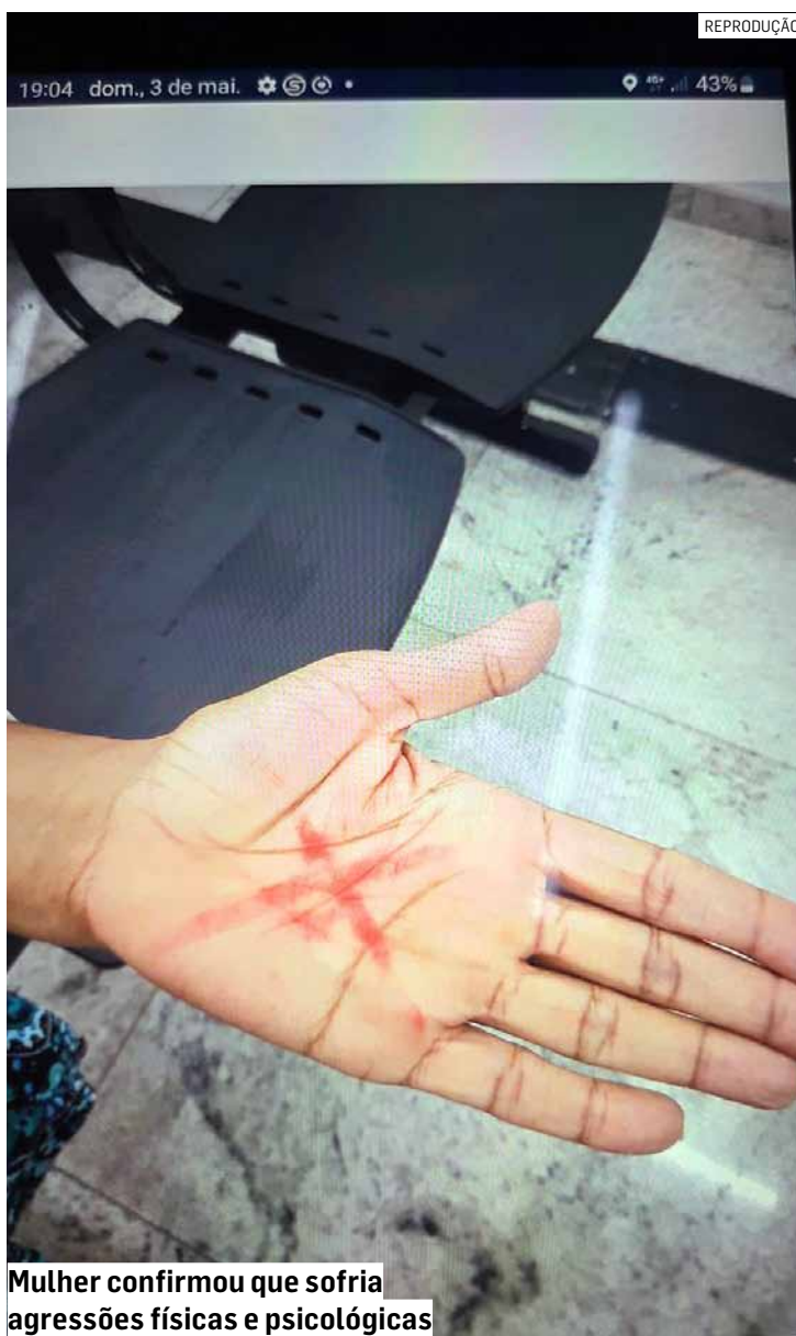
Mulher confirmou que sofria agressões físicas e psicológicas

A vítima foi encaminhada para atendimento médico e recebeu os cuidados necessários. O caso foi apresentado à autoridade policial de plantão, que determinou a prisão do agressor. O homem permanece detido e à disposição da Justiça.