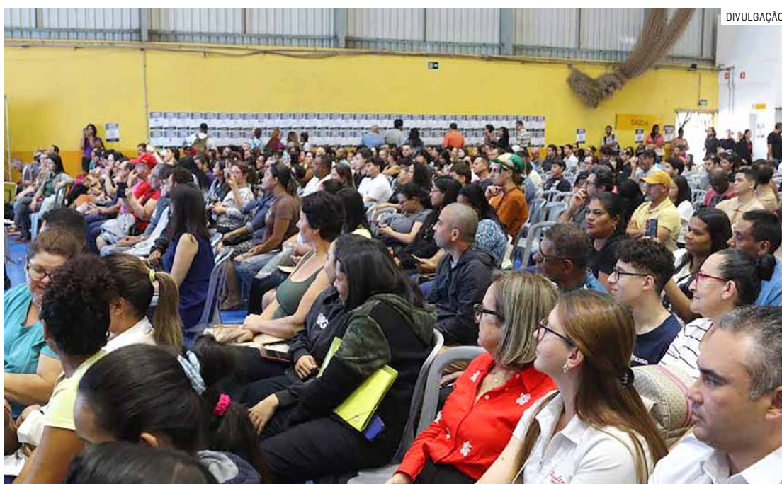
Previsão é de 2.000 vagas oferecidas pelas 59 empresas participantes da ação na Câmara

De acordo com a Secretaria de Desenvolvimento Econômico, Trabalho, Turismo e Inovação, o feirão já tem confirmadas 59 empresas, que juntas devem