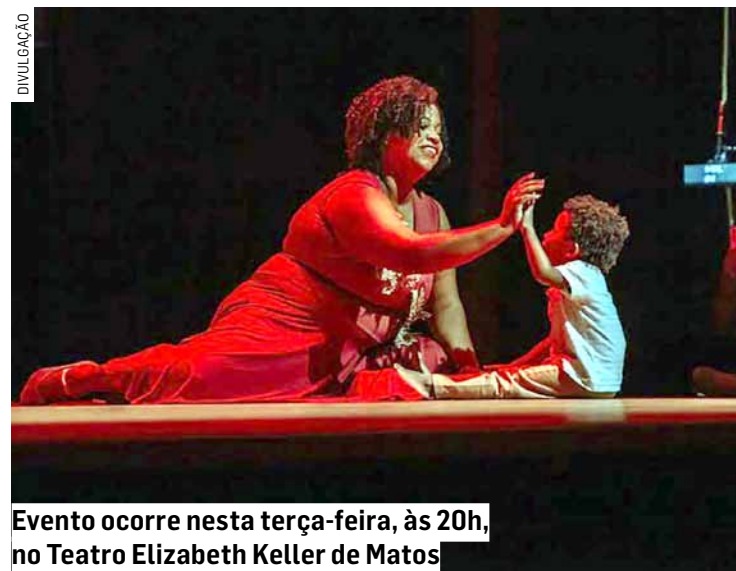
Evento ocorre nesta terça-feira, às 20h, no Teatro Elizabeth Keller de Matos