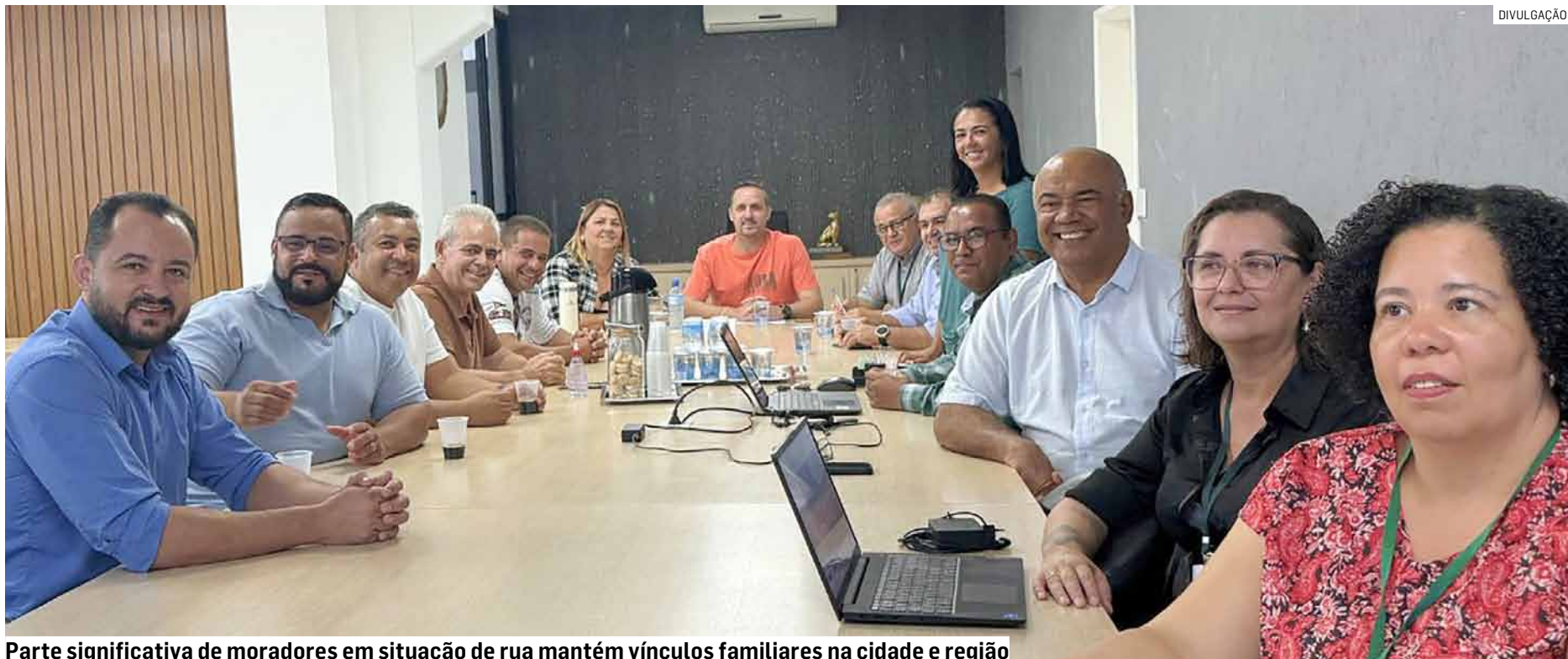
Parte significativa de moradores em situação de rua mantém vínculos familiares na cidade e região

atenção é a saúde mental desse grupo — entre os entrevistados, 32 de 82 relataram pensamentos suicidas, mostrando a complexidade do problema e a necessidade de ações integradas.