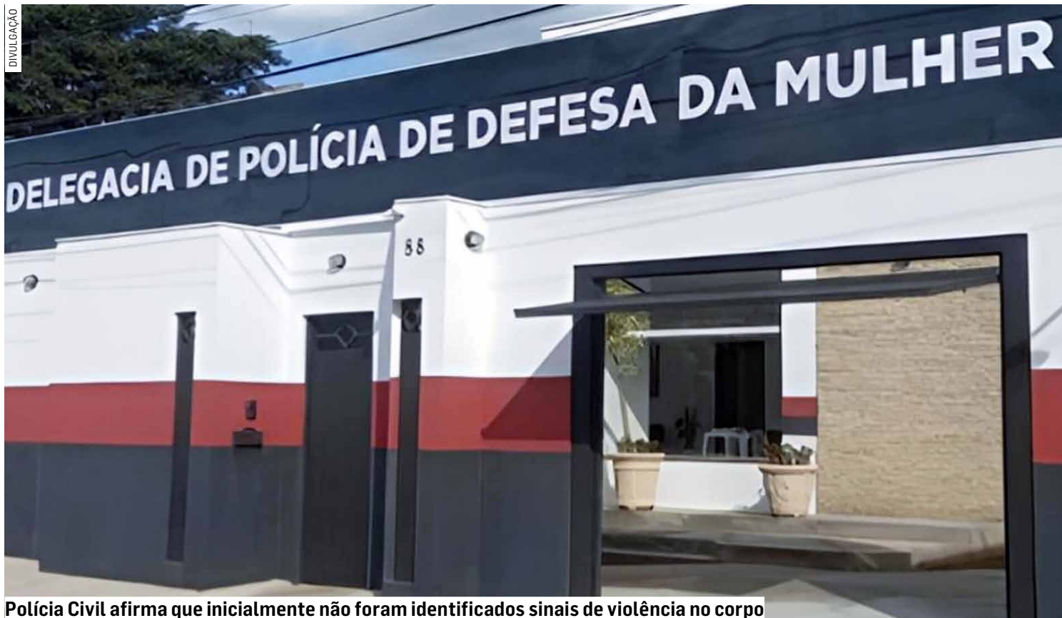
Polícia Civil afirma que inicialmente não foram identificados sinais de violência no corpo

As informações preliminares apontam que não foram identificados sinais aparentes de vio-