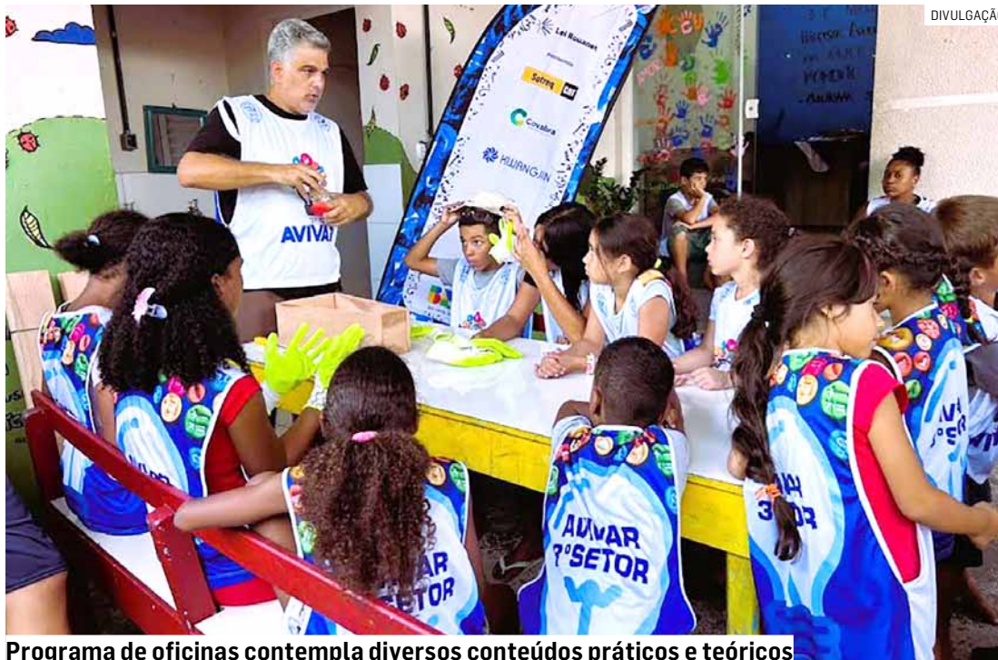
Programa de oficinas contempla diversos conteúdos práticos e teóricos

A estratégia também é contribuir para a conscientização ambiental dos participantes e de seus familiares através da arte. Para isso, o projeto viabiliza acesso gratuito às oficinas semanais em que os participantes aprendem a produzir seu próprio instrumento musical a partir de