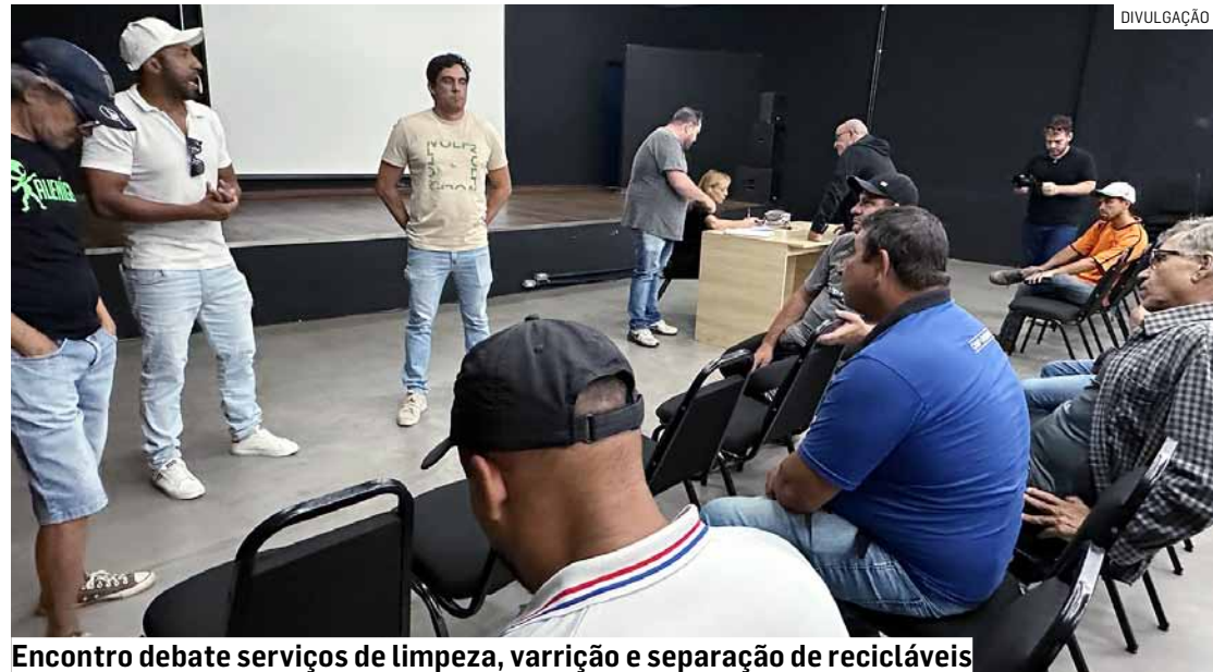
Encontro debate serviços de limpeza, varrição e separação de recicláveis