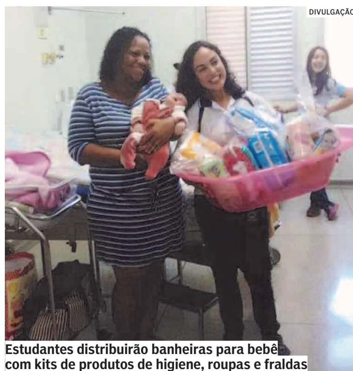
Estudantes distribuirão banheiras para bebê com kits de produtos de higiene, roupas e fraldas

De acordo com a instituição particular de ensino, a atividade faz parte do aprendizado que os alunos têm sobre cidadania e prática de ação social. Serão distribuídos cerca de 40 kits. Os estudantes também distribuirão os kits para pacientes gestantes e puérperas com consulta agendada nos dias das visitas.