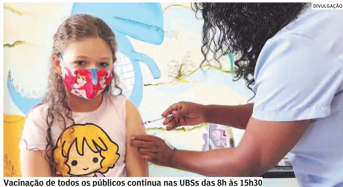
Vacinação de todos os públicos continua nas UBSs das 8h às 15h30

Da Redação | HORTOLÂNDIA tribunaliberal@tribunaliberal.com.br