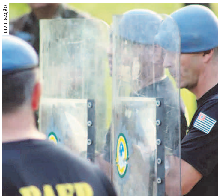
Policiais já fizeram treinamento de roubos a carros-fortes

Mês passado, os policiais do Baep também participaram de treinamento em situações de atendimento rápido a policiais feridos em confronto, na sede do batalhão, e o treinamento avançado de atendimento pré-hospitalar tático.