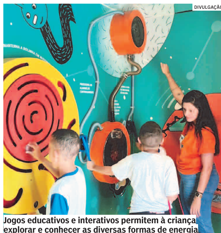
Jogos educativos e interativos permitem à criança explorar e conhecer as diversas formas de energia