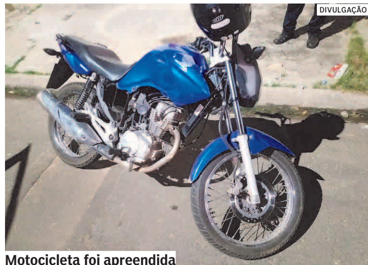
Motocicleta foi apreendida