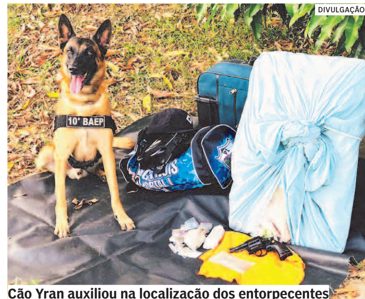
Cão Yran auxiliou na localização dos entorpecentes

O passageiro foi encaminhado ao Plantão Policial, onde foi autuado em flagrante pela acusação de tráfico de drogas e porte ilegal de arma.