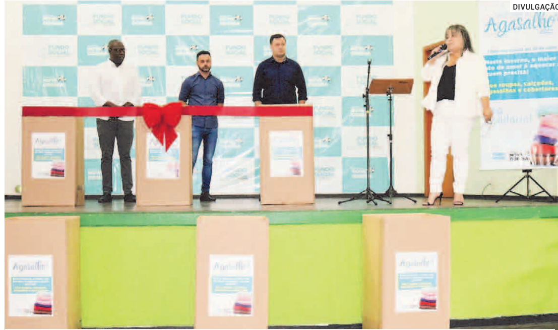
Em seu primeiro discurso oficial, nova presidente ressaltou que a missão do Fundo Social é transformar vidas com autonomia e dignidade por meio de oficinas de geração de renda

“Esse espaço físico é uma casa de portas abertas para a nossa comunidade. Temos vários cursos e atividades ofertadas aos moradores: artesanato,