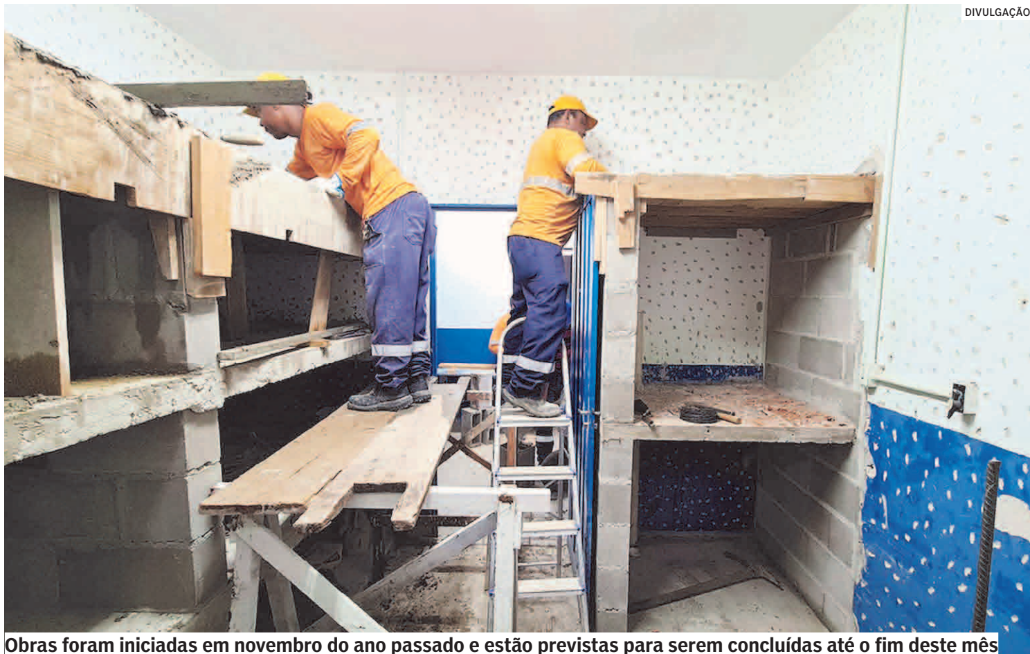
Obras foram iniciadas em novembro do ano passado e estão previstas para serem concluídas até o fim deste mês

nicipal tem se empenhado em implementar políticas públicas relacionadas à causa animal. Dentre as principais metas está a readequação da estrutura do Departamento de Proteção e Bem-Estar Animal (DPBEA). A