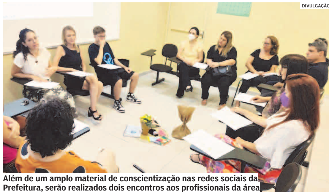
Além de um amplo material de conscientização nas redes sociais da Prefeitura, serão realizados dois encontros aos profissionais da área

“O objetivo das ações que desenvolveremos durante todo o mês de maio é buscar a sensibilização e o comprometimento da sociedade sobre as questões que envolvem o abuso e exploração sexual de crianças e adolescentes. O foco principal é o cuidado, a proteção e atendimento