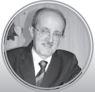
Francisco Antonio de Toledo