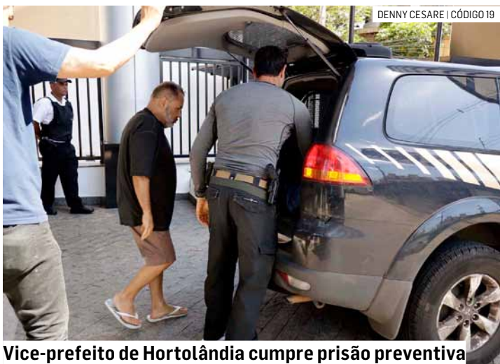
Vice-prefeito de Hortolândia cumpre prisão preventiva

O vice-prefeito de Hortolândia, Carlos Augusto César, o Cafu César (PSB), foi transferido para o Centro de Detenção Provisória (CDP) de Guarulhos, em São Paulo. A transferência ocorre em meio à prisão preventiva contra o agente político. O CDP de Guarulhos é uma das maiores unidades prisionais provisórias do Estado. Cafu está preso desde o dia 12 de novembro, suspeito de participar de um esquema