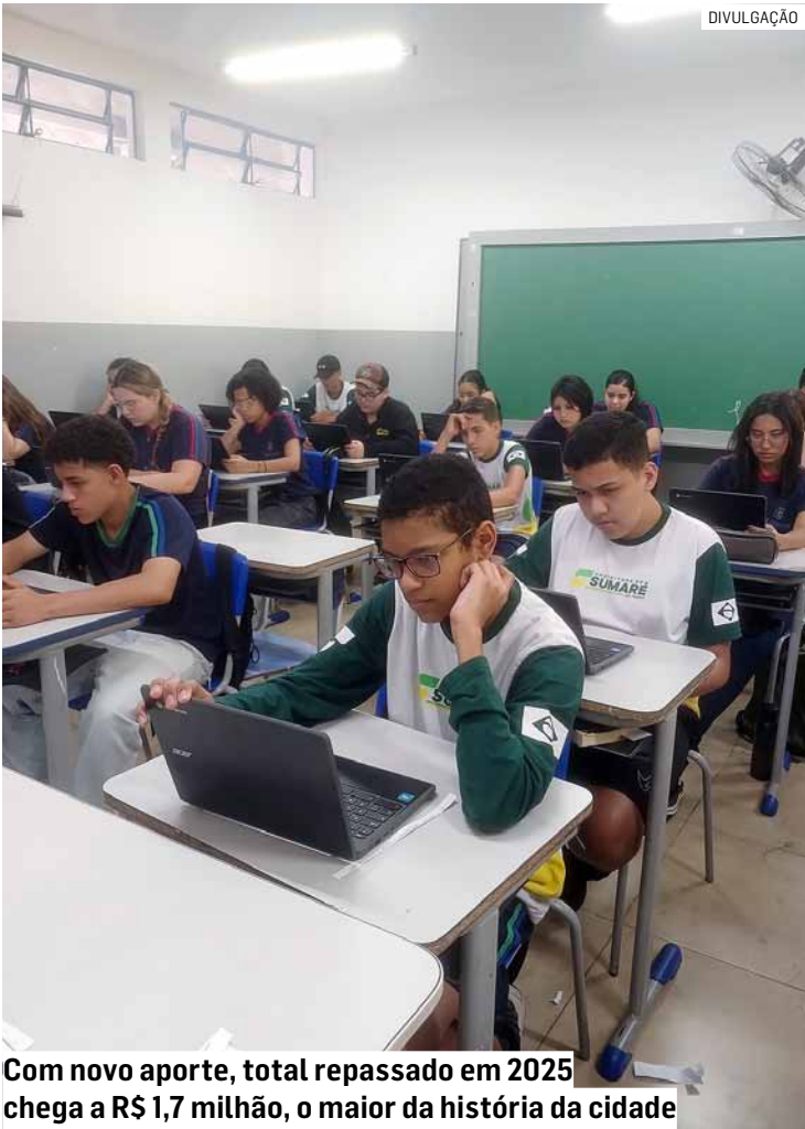
Com novo aporte, total repassado em 2025 chega a R$ 1,7 milhão, o maior da história da cidade

Na prática, o repasse extraordinário permitirá que as APMs atuem com maior agilidade em situações emergenciais e necessidades cotidianas, garantindo melhores condições de uso dos espaços, apoio às ações pedagógicas e mais segurança e conforto para estudantes, profissionais da educação e famílias.