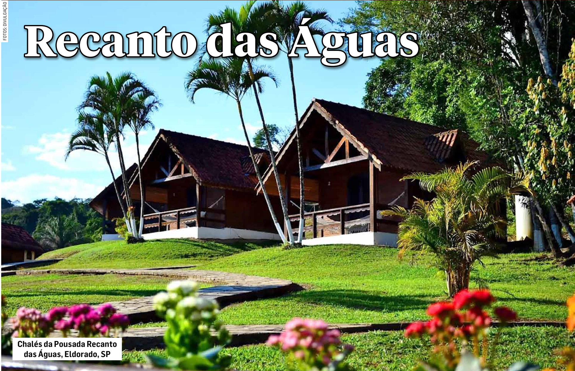
Chalés da Pousada Recanto das Águas, Eldorado, SP

Eis uma Pousada Ecológica, encravada em pura Mata Atlântica, no município de Eldorado, a exatos 224 km da capital paulistana e a 208 km de Curitiba. É ligada ao centro de Eldorado por estrada asfaltada. Seu nome: Recanto das Águas. Está situada numa área de 242 mil m2, oferecendo um conforto diferenciado em seus 16 chalés bem construídos. Os chalés são feitos com madeira de lei, e um deles em alvenaria, todos primando pelo conforto, além de ser um estabelecimento com excelente atendimento.