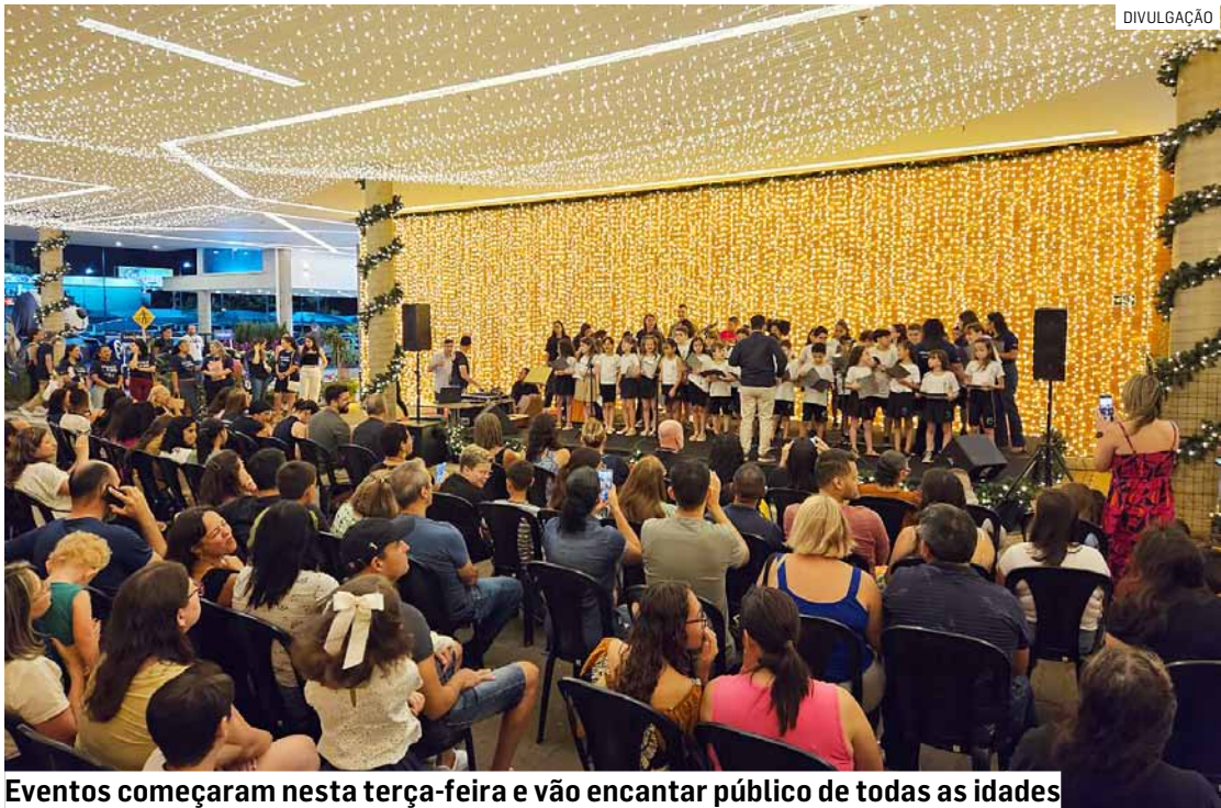
Eventos começaram nesta terça-feira e vão encantar público de todas as idades

As apresentações reforçam a programação especial que o Shopping ParkCity Sumaré preparou para receber as famílias neste final de ano. Com uma decoração lúdica e com referências circenses, o empen-