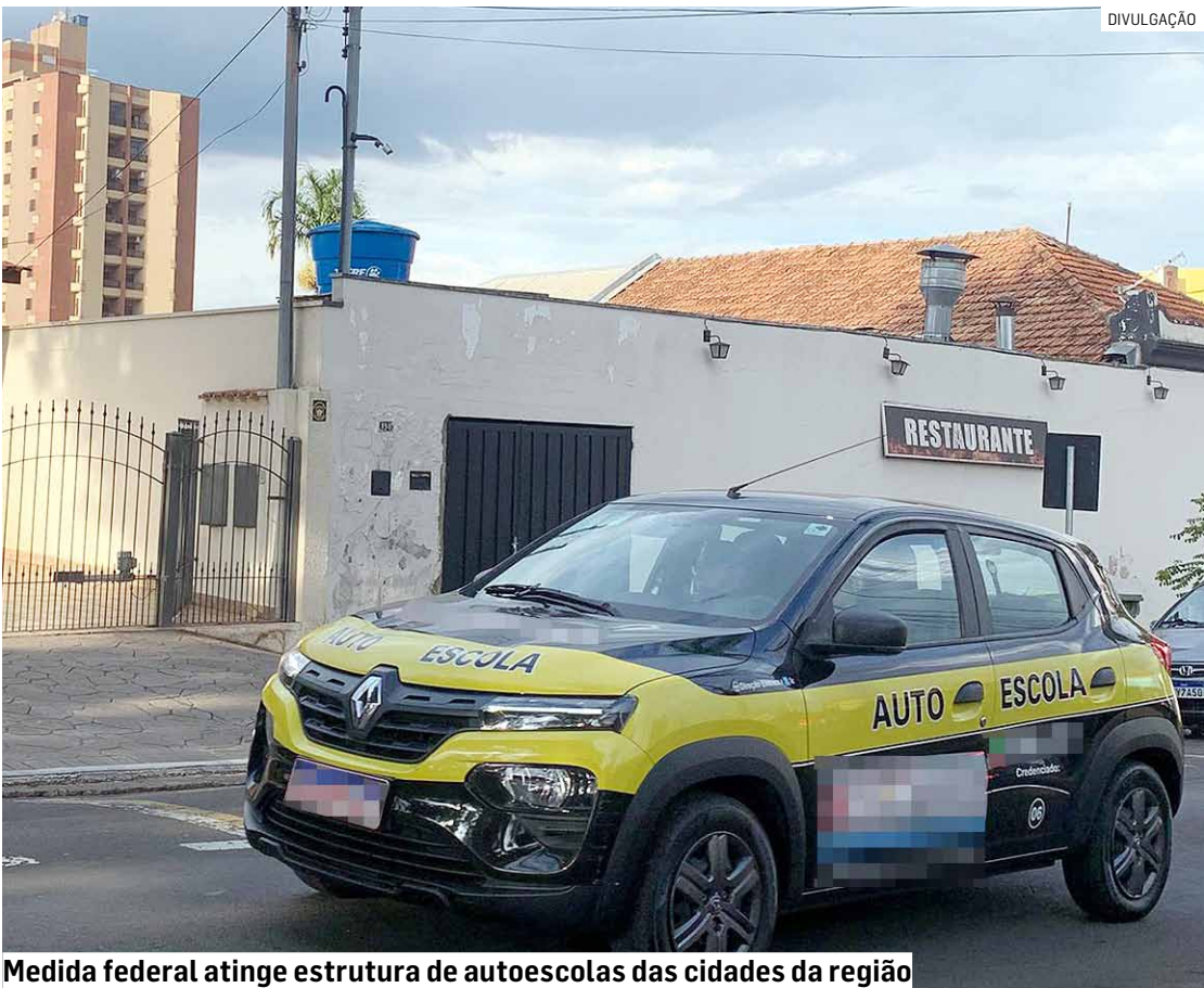
Medida federal atinge estrutura de autoescolas das cidades da região

A aprovação da resolução do Contran que elimina a exigência de aulas obrigatórias em autoescolas já causa demissões e forte impacto nas cidades da região. Mais de 4 mil trabalhadores foram dispensados na região de Campinas e 63 CFCs devem ser afetados em Sumaré, Hortolândia, Paulínia, Monte Mor, Americana e Nova Odessa. Quatro CFCs de Sumaré fecharam as portas. PÁGINA 05