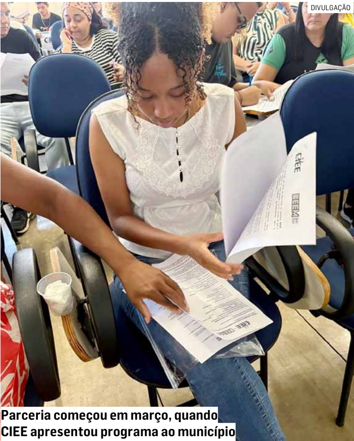
Parceria começou em março, quando CIEE apresentou programa ao município

adesão ao BEEM e na formação da primeira turma de estagiários. Durante o encontro, os estudantes receberam orientações sobre o funcionamento do programa, as áreas de atuação na administração pública e as responsabilidades relacionadas ao estágio. A proposta do BEEM é oferecer vivência profissional, fortalecer o aprendizado e incentivar a permanência na educação básica. O prefeito Henrique do Paraíso (Republicanos) reafirmou a importância do projeto. “Investir nos jovens é investir no futuro de Sumaré. O BEEM permite que os estudantes conheçam o ambiente de trabalho e desenvolvam novas habilidades”.