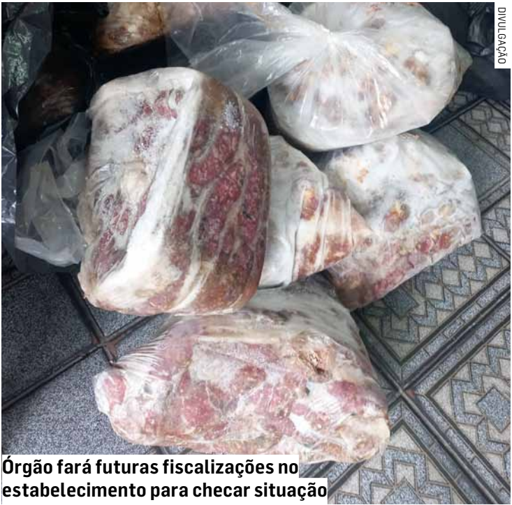
Órgão fará futuras fiscalizações no estabelecimento para checar situação

Apesar das irregularidades relacionadas aos produtos, o estabelecimento apresentava boas condições estruturais, motivo pelo qual não houve interdição. O proprietário responderá a processos administrativos, e novas fiscalizações serão realizadas para verificar o cumprimento das normas sanitárias.