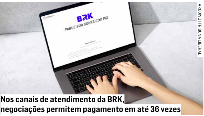
Nos canais de atendimento da BRK, negociações permitem pagamento em até 36 vezes

“Os clientes BRK podem avaliar as melhores condições de pagamento de acordo com sua realidade financeira”, complementa o coordenador.