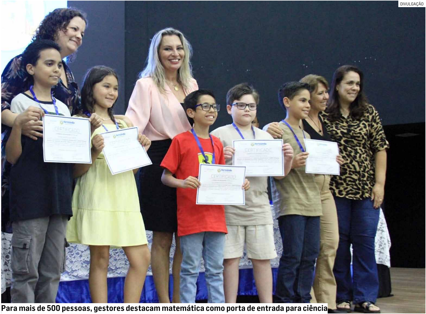
Para mais de 500 pessoas, gestores destacam matemática como porta de entrada para ciência

O evento reuniu mais de 500 pessoas, entre estudantes, familiares, profissionais da educação e autoridades, do Executivo e do Legislativo. A mesa de honra do evento contou com a participação da