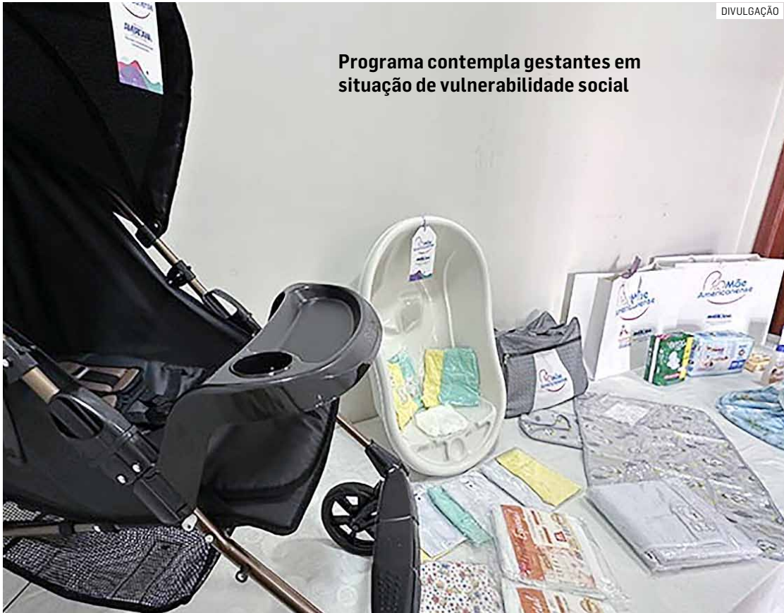
Programa contempla gestantes em situação de vulnerabilidade social

Os requisitos para participar são: estar entre a 14ª e a 22ª semana de gestação; estar em acompanhamento pré-natal; residir em Americana há pelo menos um ano; ter renda familiar per capita de até meio salário mínimo; e estar inscrita no Cadastro Único.