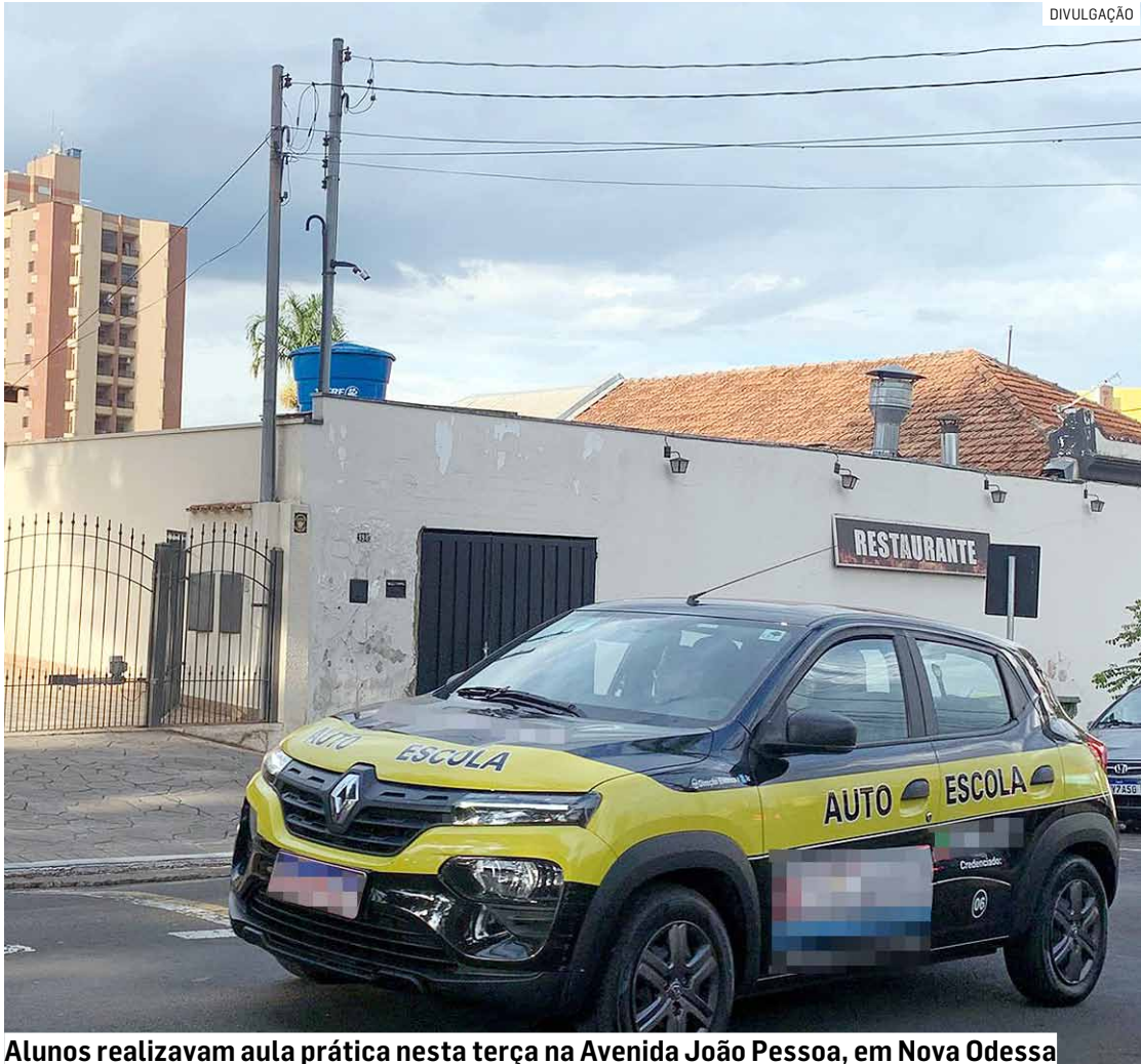
Alunos realizavam aula prática nesta terça na Avenida João Pessoa, em Nova Odessa

Diante da queda brusca na demanda por serviços tradicionais, a associação negocia com sindicatos alternativas para tentar preservar empregos e evitar o que chamou de “colapso total”. Esse número de demitidos pode aumentar, será um colapso total. As au-