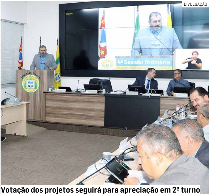
Votação dos projetos seguirá para apreciação em 2º turno

rá com mais de R$ 467 milhões para qualificar o ensino e manter escolas, creches e programas pedagógicos; Urbanismo e infraestrutura, com mais de R$ 300 milhões destinados a obras públicas, melhorias viárias e manutenção da cidade; e Assistência Social, que terá mais de R$ 52 milhões para programas voltados às famílias em situação de vulnerabilidade.