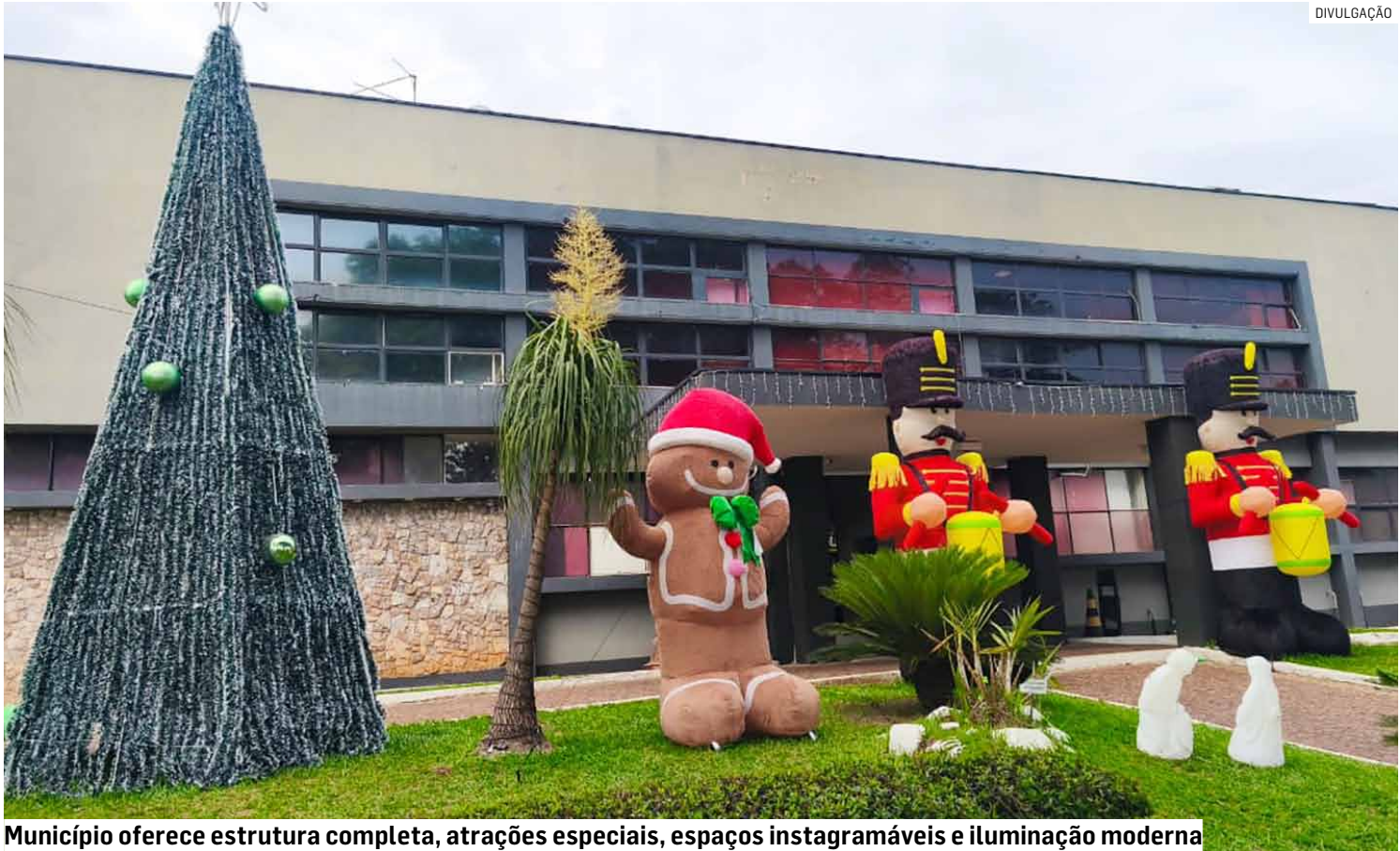
Município oferece estrutura completa, atrações especiais, espaços instagramáveis e iluminação moderna

Mais do que uma festa, o “Natal para Jesus” busca resgatar a verdadeira mensagem desta época: a celebração da chegada d’Aquele que é o Caminho, a Verdade e a Vida. A iniciativa se consolida como um mar-