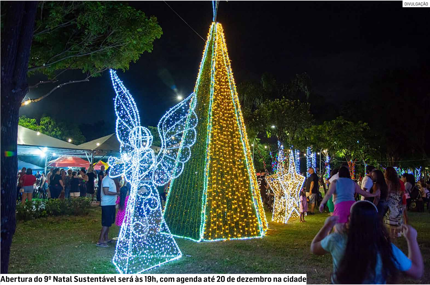
Abertura do 9º Natal Sustentável será às 19h, com agenda até 20 de dezembro na cidade

Hortolândia se prepara para viver o clima mágico das festas de fim de ano com o início, nesta sexta-feira (5), da programação oficial de Natal organizada pela prefeitura. Os eventos, gratuitos e com classificação livre, incluem decoração temática, apresentações culturais, visita do Papai Noel, chuva de neve artificial e uma extensa agenda musical que promete encantar moradores de todas as idades. Neste ano, os festejos acontecerão em três espaços públicos: o Parque Socioambiental Irmã Dorothy Stang, no Jardim Nossa Senhora de Fátima; o Observatório Ambiental Parque Escola, no Jardim Santa Clara do Lago II; e o Museu Municipal Estação Jacuba, na Vila São Francisco. A abertura do 9º Natal Sustentável no Parque Irmã Dorothy Stang será às 19h desta sexta, dando início a uma programação que segue até o dia 20