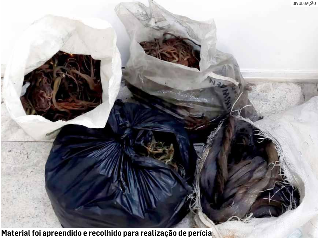
Material foi apreendido e recolhido para realização de perícia