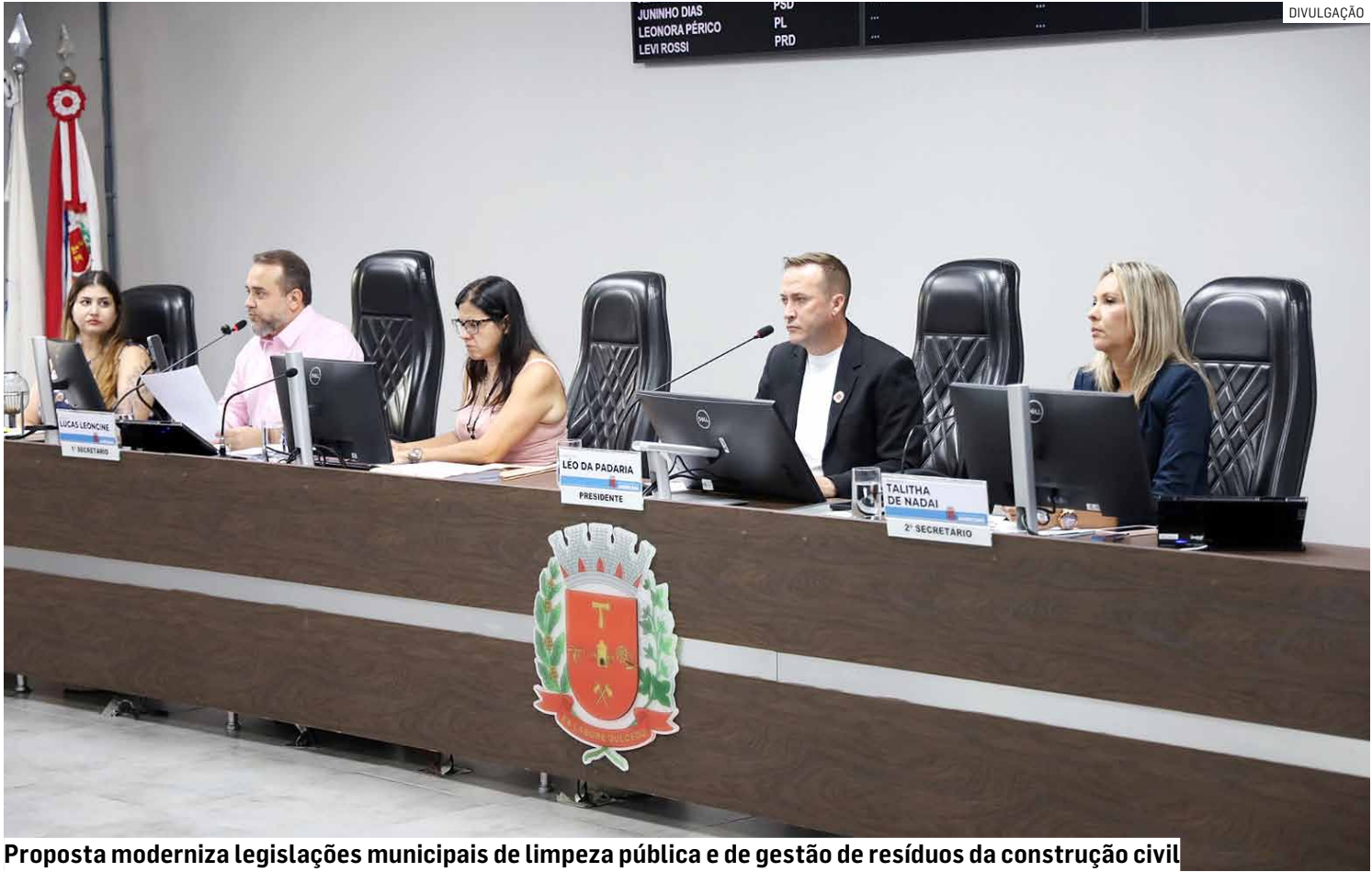
Proposta moderniza legislações municipais de limpeza pública e de gestão de resíduos da construção civil