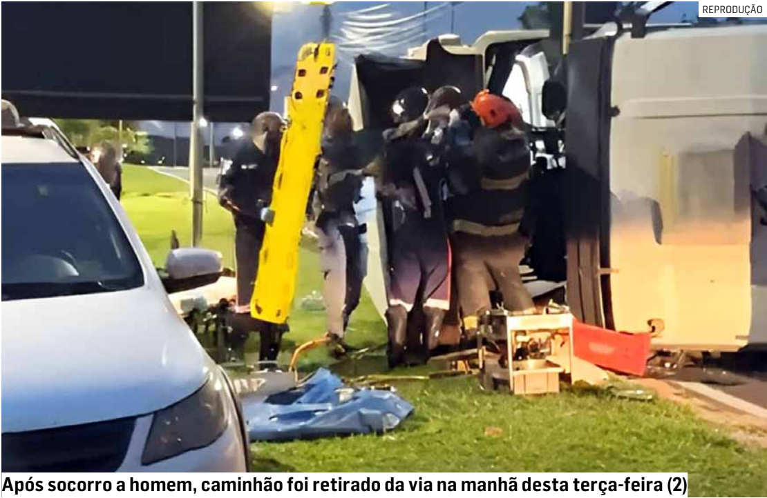
Após socorro a homem, caminhão foi retirado da via na manhã desta terça-feira (2)

tado de saúde do motorista. O acidente ocorreu em uma via localizada na área industrial da cidade, o que mobilizou equipes de apoio e gerou atenção no trânsito da região. O caminhão permaneceu tombado no local até a manhã desta terça-feira (2), quando foi removido.