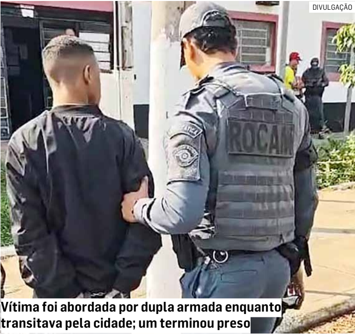
Vítima foi abordada por dupla armada enquanto transitava pela cidade; um terminou preso