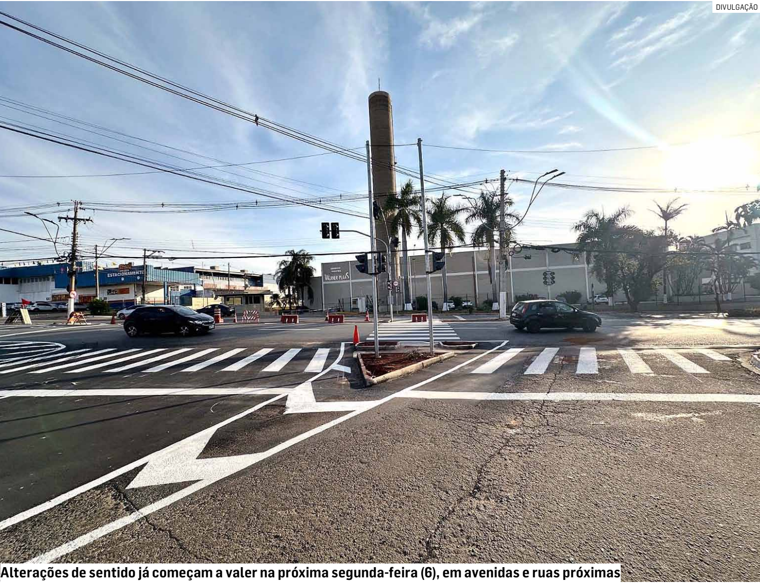
Alterações de sentido já começam a valer na próxima segunda-feira (6), em avenidas e ruas próximas

Município iniciou série de intervenções na região da Avenida Nossa Senhora de Fátima a fim de ampliar fluidez e proporcionar mais segurança no trânsito, com novos semáforos, recapeamento, pavimentação e remodelação de vias