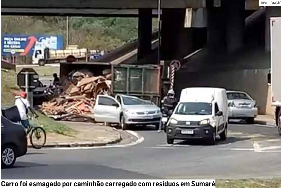
Carro foi esmagado por caminhão carregado com resíduos em Sumaré

A caçamba do caminhão praticamente esmagou o