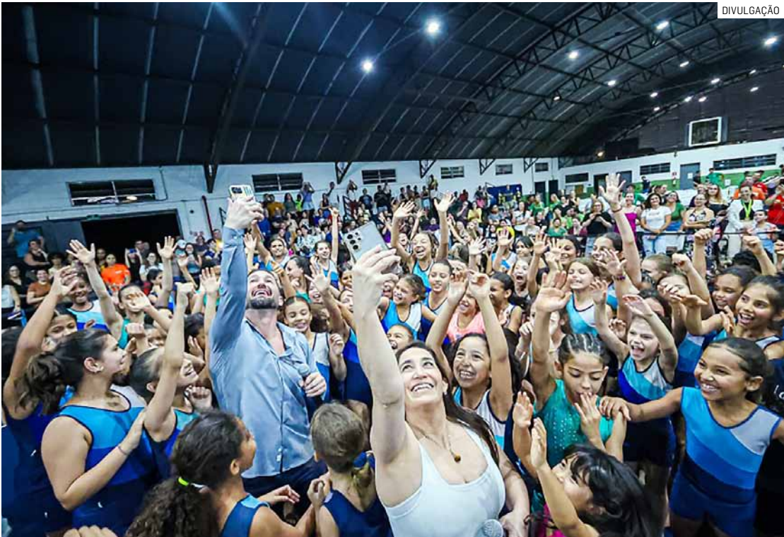
Ex-atletas tiraram dúvidas e fizeram demonstrações do que já apresentaram pelo mundo