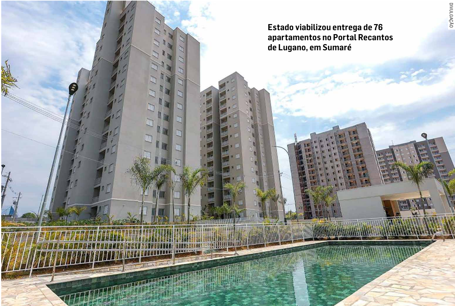
Estado viabilizou entrega de 76 apartamentos no Portal Recantos de Lugano, em Sumaré

Cada família recebeu, por meio de CCI, até R$ 13 mil para a compra do pri-