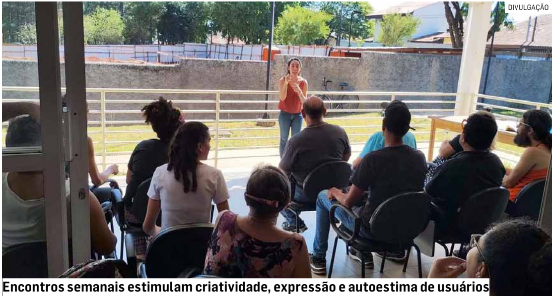
Encontros semanais estimulam criatividade, expressão e autoestima de usuários

ticas. A proposta tem como finalidade estimular a criatividade, favorecer a expressão dos participantes e fortalecer vínculos, utilizando a arte como ferramenta de promoção da saúde mental. Nesta semana, o