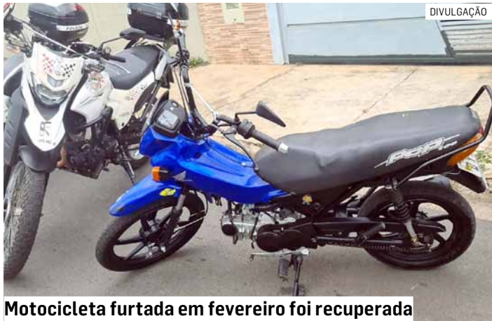
Motocicleta furtada em fevereiro foi recuperada

litar, o suspeito demonstrou nervosismo ao avistar as viaturas e foi abordado. Nada de ilícito foi encontrado com ele, mas, ao consultar a motocicleta que conduzia, os agentes constataram que o veículo havia sido furtado em 10 de fevereiro de 2025.