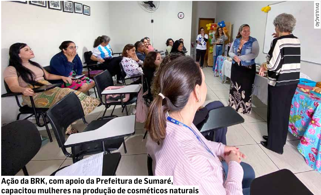
Ação da BRK, com apoio da Prefeitura de Sumaré, capacitou mulheres na produção de cosméticos naturais

Desde o lançamento em agosto, 20 mulheres participaram da iniciativa, que teve como foco a capacitação para a produção artesanal de cosméticos naturais, aliando sustentabilidade, economia criativa e geração de ren-