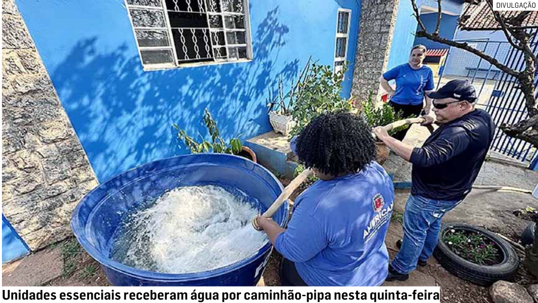
Unidades essenciais receberam água por caminhão-pipa nesta quinta-feira

O Departamento de Água e Esgoto (DAE) de Americana intensificou nesta quinta-feira (2) o atendimento emergencial com caminhões-pipa para instituições essenciais do município, diante da estiagem prolongada e da baixa qualidade da água captada no Rio Piracicaba. Foram abastecidos o Hospital Municipal Dr. Waldemar Tebaldi, na Vila Nossa Senhora de Fátima, o Lar dos Velhinhos São Vicente de Paulo, no bairro São Domingos, além de escolas e entidades sociais em diferentes regiões da cidade.