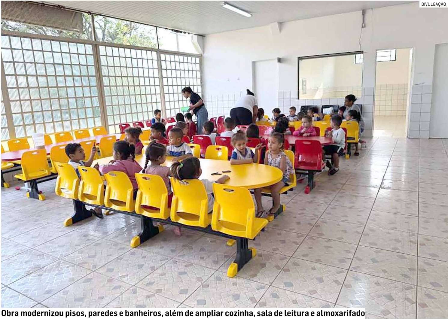
Obra modernizou pisos, paredes e banheiros, além de ampliar cozinha, sala de leitura e almoxarifado

Iniciada em julho de 2022, a obra trouxe melhorias significativas. A estrutura recebeu novos pisos em cerâmica, revestimento nas paredes e adequações nos banheiros. A unidade também foi ampliada, com a construção de uma nova sala de leitura, a expansão da área útil da cozinha e a criação de um almoxarifado. O prédio que abriga as turmas de berçário também passou por melhorias.