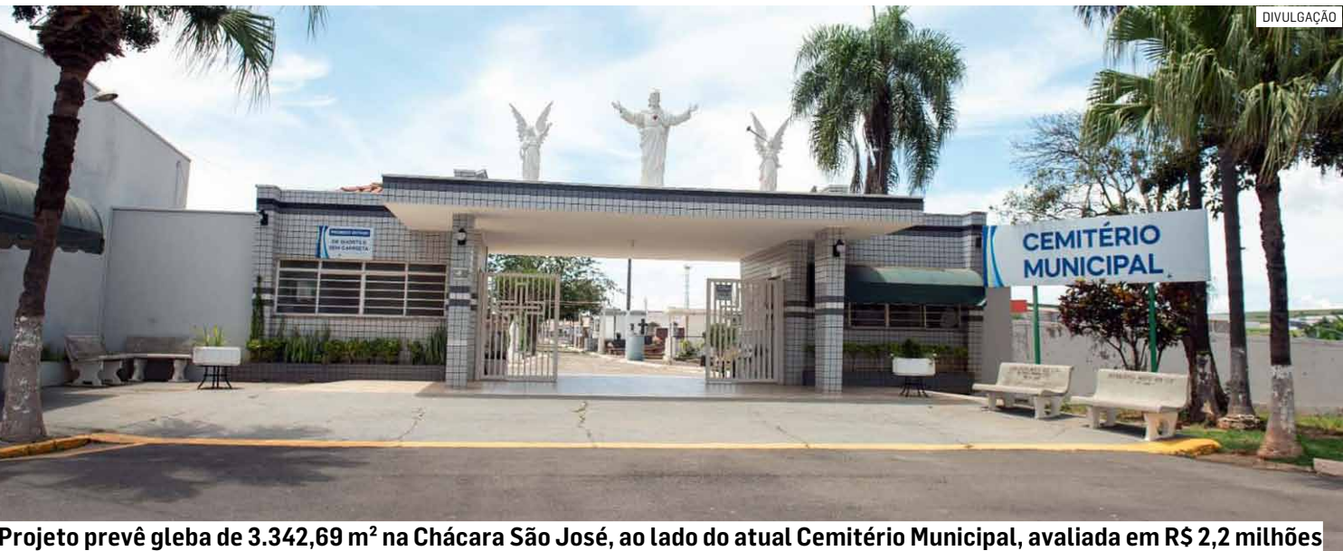
Projeto prevê gleba de 3.342,69 m² na Chácara São José, ao lado do atual Cemitério Municipal, avaliada em R$ 2,2 milhões

Procuradoria da Câmara deu parecer favorável ao projeto de lei que autoriza permuta de áreas de R$ 2,2 milhões para ampliar capacidade de sepultamentos no Cemitério Municipal, já em fase crítica A Procuradoria Jurídica da Câmara de Monte Mor considerou legal projeto de lei do prefeito Murilo Rinaldo (PP) que autoriza a permuta de um terreno público por área particular ao lado do Cemitério Municipal. O objetivo é ampliar a capacidade de sepultamentos, hoje no limite. O parecer destaca que a operação atende à legislação, com avaliação prévia e justa compensação. O terreno público tem valor estimado em R$ 2,28 milhões, enquanto a área particular foi avaliada em R$ 2,27 milhões. PÁGINA 05