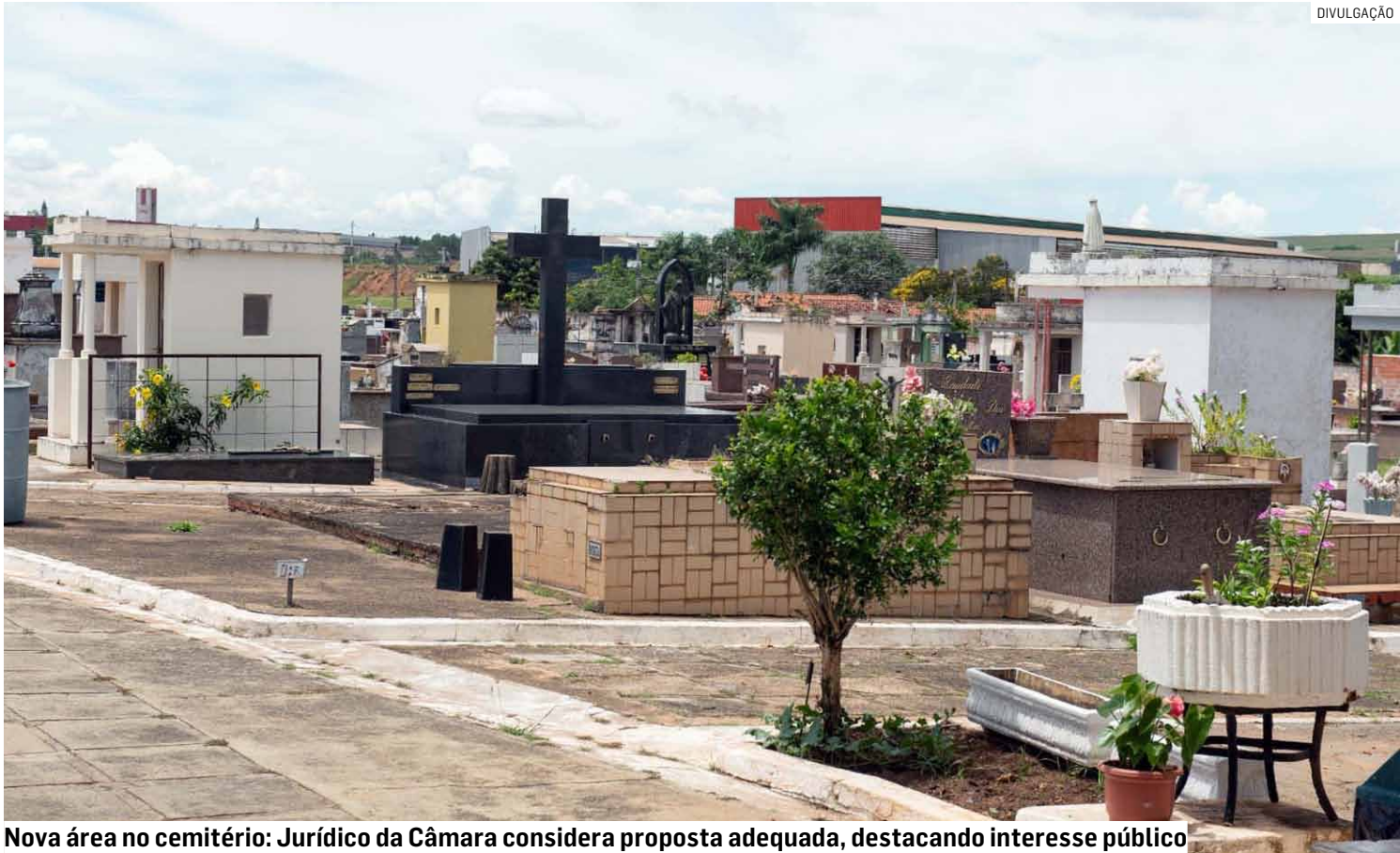
Nova área no cemitério: Jurídico da Câmara considera proposta adequada, destacando interesse público