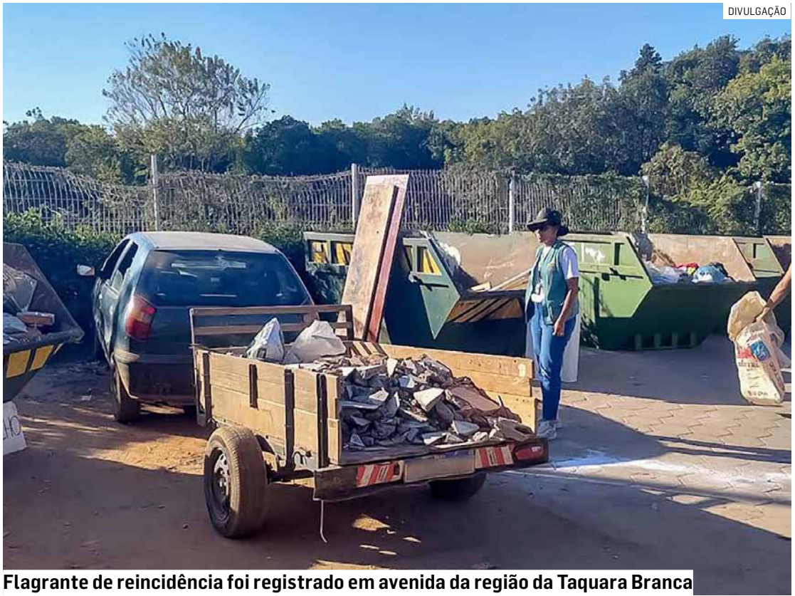
Flagrante de reincidência foi registrado em avenida da região da Taquara Branca

Segundo registrado no auto de infração e notificação de multa, o motoris-