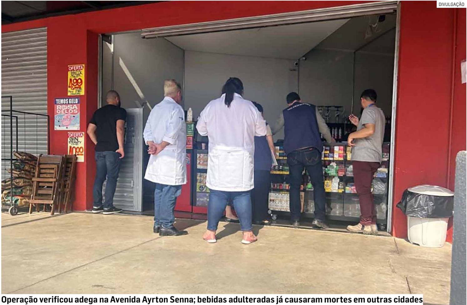
Operação verificou adega na Avenida Ayrton Senna; bebidas adulteradas já causaram mortes em outras cidades

A fiscalização realizada em Monte Mor foi desencadeada após o registro, em outras cidades, de casos de intoxicação e morte relacionados ao consumo de bebidas alcoólicas com metanol. A Operação Lacre Vio-