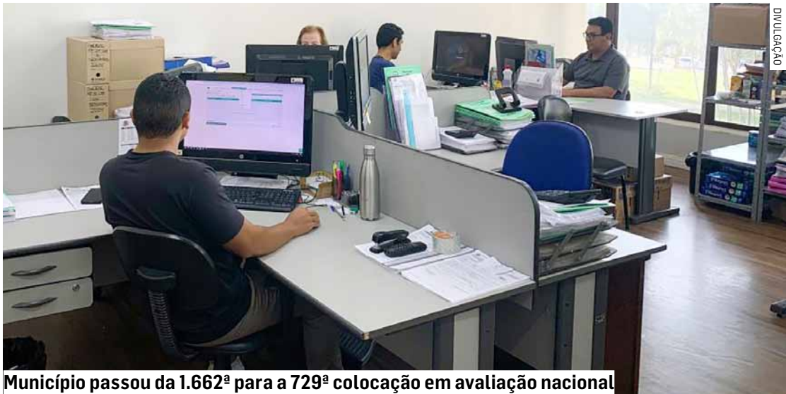
Município passou da 1.662ª para a 729ª colocação em avaliação nacional