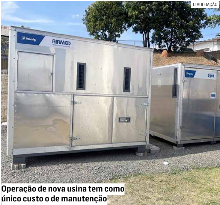
Operação de nova usina tem como único custo o de manutenção