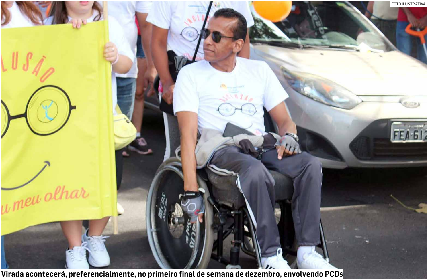
Virada acontecerá, preferencialmente, no primeiro final de semana de dezembro, envolvendo PCDs

Entre as atividades previstas estão caminhada inclusiva, circo e fitness adaptados, jogos, ar-