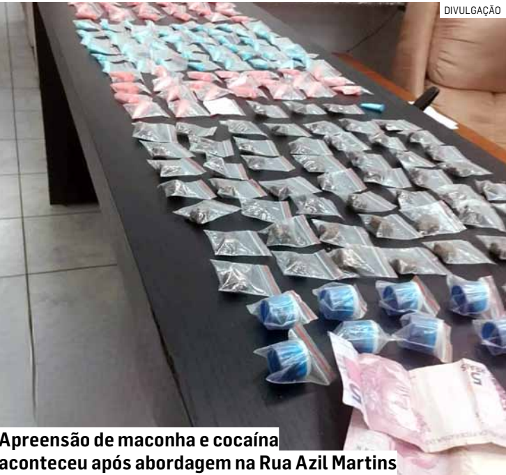
Apreensão de maconha e cocaína aconteceu após abordagem na Rua Azil Martins

O adolescente e o material recolhido foram conduzidos até a Delegacia de Polícia de Nova Odessa. O delegado de plantão determinou a elaboração do boletim de ocorrência, bem como a apreensão das drogas, do dinheiro e do celular, que passarão por perícia técnica. O jovem foi entregue ao responsável legal.