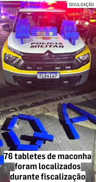
76 tabletes de maconha foram localizados durante fiscalização

A Polícia Militar Rodoviária prendeu em flagrante, na noite desta segunda-feira (1º), um casal suspeito de tráfico de drogas durante fiscalização na Rodovia Anhanguera (SP-330), em Nova Odessa. A ocorrência foi registrada no quilômetro 117, na praça de pedágio, onde os policiais abordaram um veículo Chevrolet Onix após o condutor tentar realizar uma manobra em marcha à ré. No momento da abordagem, os agentes constataram que o motorista não possuía Carteira Nacional de Habilitação (CNH). Durante a vistoria no interior do automóvel, foi encontrada uma caixa de papelão no banco traseiro contendo 76 tabletes de maconha, que juntos somaram 43,501 quilos da droga. A passageira do veículo confirmou aos policiais que tinha conhecimento