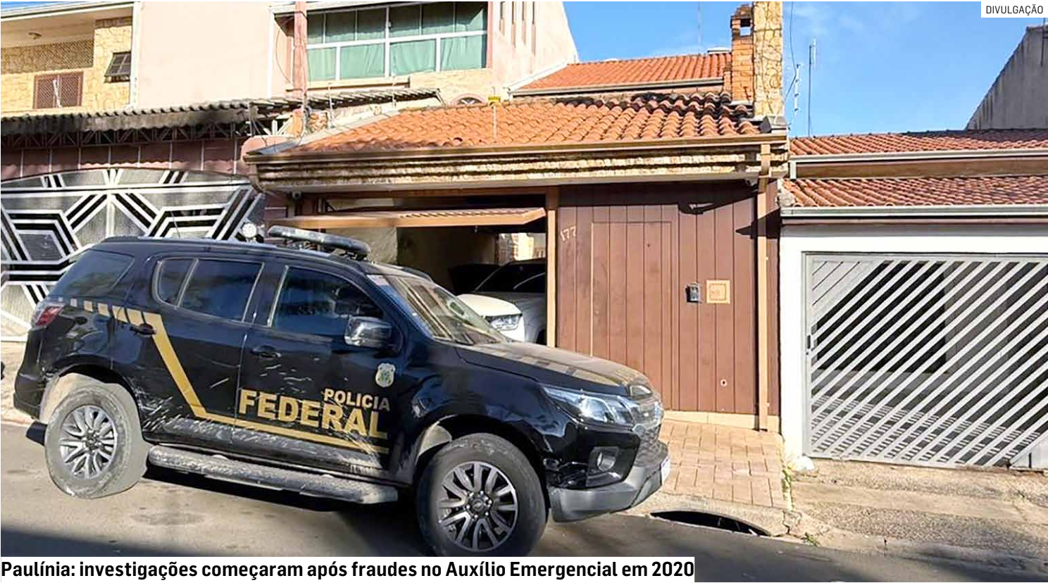
Paulínia: investigações começaram após fraudes no Auxílio Emergencial em 2020

A Polícia Federal realizou, nesta terça-feira (2), uma operação contra fraudes cibernéticas, estelionato e lavagem de dinheiro no interior de São Paulo e no Maranhão. Um dos alvos foi a cidade de Paulínia. Batizada de “Lauandi”, a ação cumpriu 17 mandados de busca e apreensão em Sorocaba, Votorantim, Ibiúna, Paulínia, Marília, Peruíbe e em Imperatriz (MA). Durante o cumprimento das ordens judiciais, foram apreendidos celulares, documentos, veículos, dinheiro em espécie, cartões bancários e outros materiais utilizados na falsificação de documentos. Além disso, houve o bloqueio de contas bancárias, sequestro de bens móveis e imóveis e custódia de criptoativos.