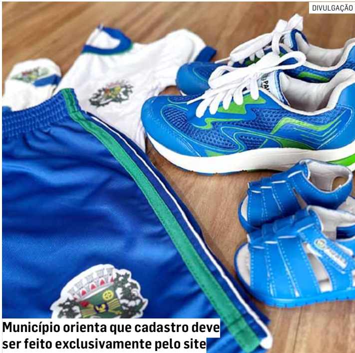
Município orienta que cadastro deve ser feito exclusivamente pelo site

O benefício contempla todos os estudantes matriculados nas unidades municipais, incluindo creches, Proeb, Emeis, escolas de Ensino Fundamen-