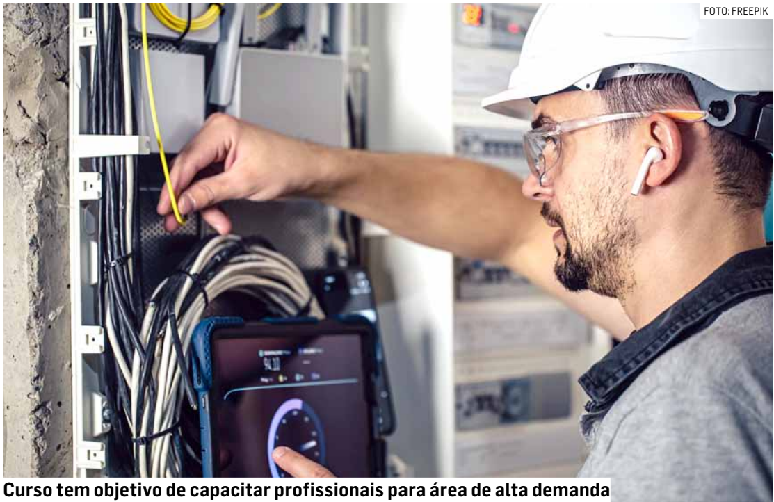
Curso tem objetivo de capacitar profissionais para área de alta demanda