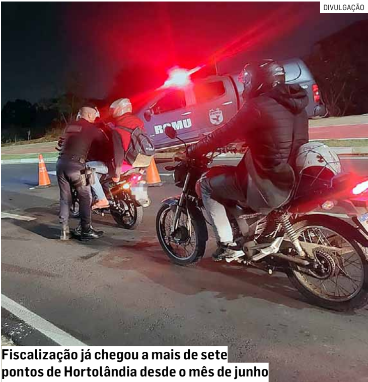
Fiscalização já chegou a mais de sete pontos de Hortolândia desde o mês de junho