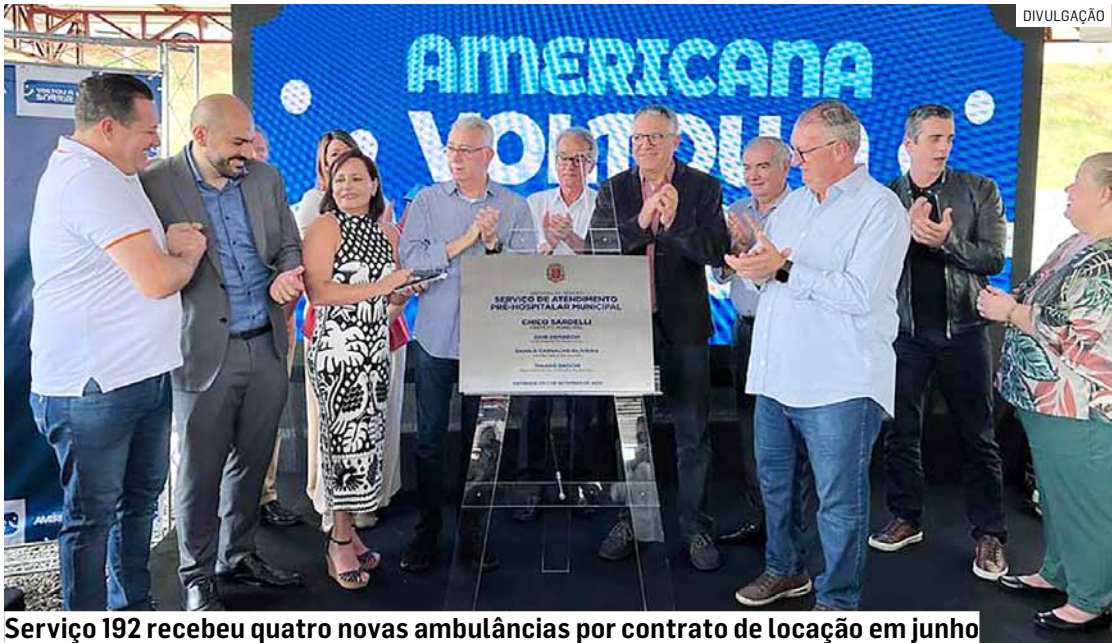
Serviço 192 recebeu quatro novas ambulâncias por contrato de locação em junho

As obras de modernização do prédio incluíram muro perimetral, revisão do telhado e da rede elé-