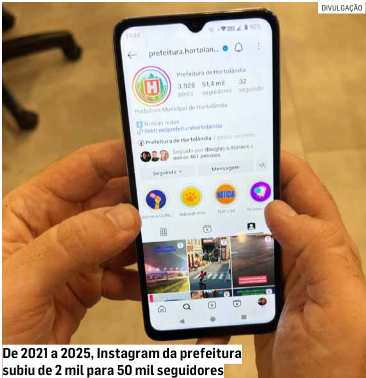
De 2021 a 2025, Instagram da prefeitura subiu de 2 mil para 50 mil seguidores

Em 2021, quando passou a publicar mais postagens, o Instagram oficial da prefeitura não contava nem com 2 mil seguidores. Já em 2025, com a marca de 50 mil pessoas alcançada, a diretora do Departamento de Publicidades Institucionais da Prefeitura de Hortolândia comemora o alcance da rede social. “A maior faixa de usuários