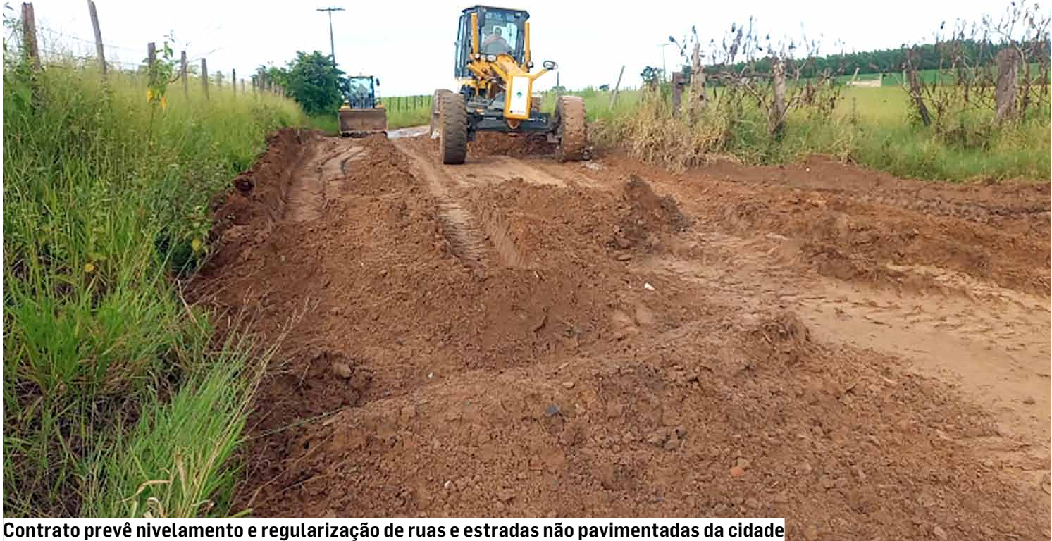
Contrato prevê nivelamento e regularização de ruas e estradas não pavimentadas da cidade

O nivelamento do solo tem como meta corrigir irregularidades, reduzir riscos de acidentes e melho-