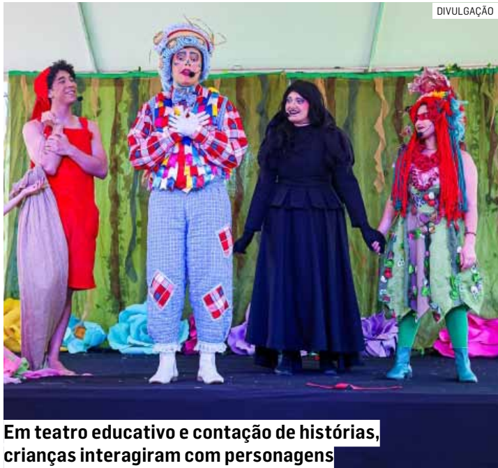
Em teatro educativo e contação de histórias, crianças interagiram com personagens

Por meio de um teatro educativo com contação de histórias e pockets