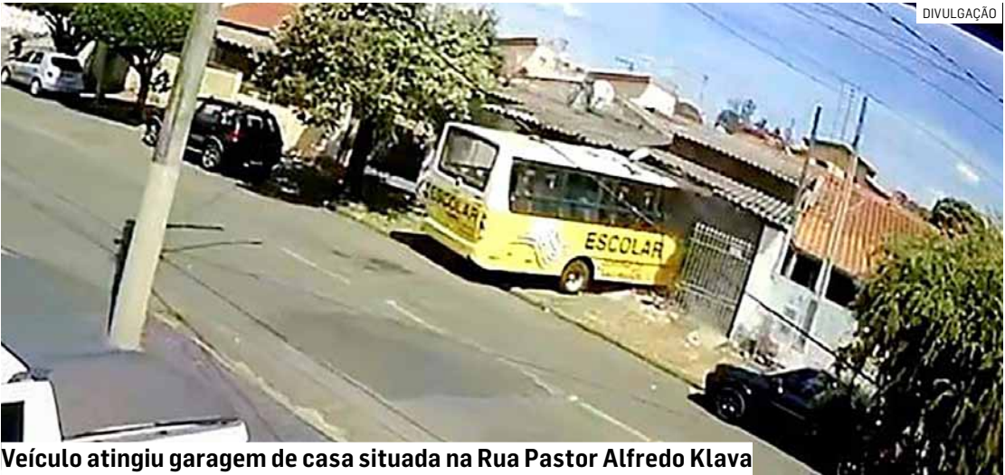
Veículo atingiu garagem de casa situada na Rua Pastor Alfredo Klava

Um ônibus da Prefeitura de Nova Odessa, utilizado no transporte de servidores das secretarias de Obras e Meio Ambiente, invadiu uma residência localizada na Rua Pastor Alfredo Klava após o motorista, de 51 anos, sofrer um mal súbito ao volante. O acidente ocorreu na manhã desta terça-feira (2), no bairro Mathilde Berzin. Além da casa, o ônibus atingiu um carro estacionado. Não houve feridos. De acordo com informações, o coletivo transportava apenas o condutor e um funcionário. Ao perder o controle da direção, o veículo avançou sobre o imóvel, provocando grande impacto. Apesar do estrondo, ninguém que estava dentro da casa se feriu. A Polícia Militar foi acionada e registrou a ocorrência.