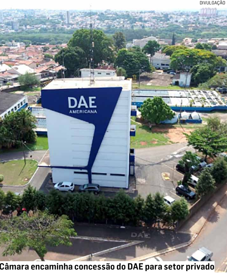
Câmara encaminha concessão do DAE para setor privado