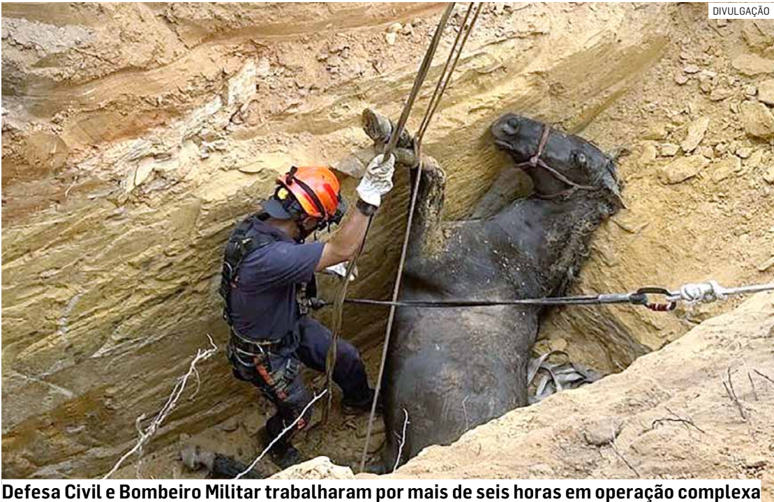
Defesa Civil e Bombeiro Militar trabalharam por mais de seis horas em operação complexa