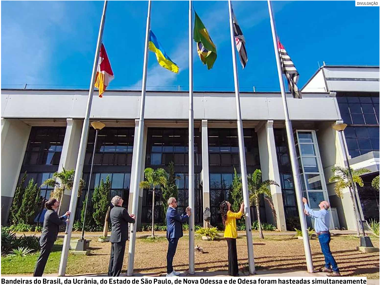
Bandeiras do Brasil, da Ucrânia, do Estado de São Paulo, de Nova Odessa e de Odesa foram hasteadas simultaneamente

A iniciativa também contou com a participação especial do cônsul