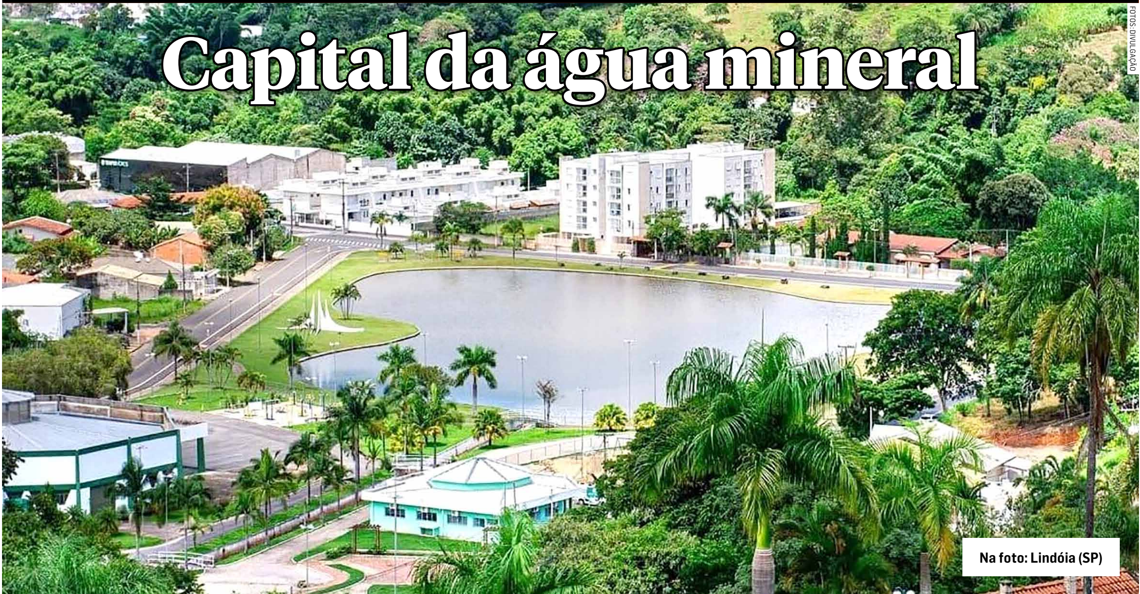
Na foto: Lindóia (SP)

Quarenta por cento de toda água mineral consumida no Brasil é procedente da pequena cidade de Lindóia, a 156 km da capital, através de 9 diferentes rótulos. Fundada em 1899, somente foi emancipada em 1965. Por iniciativa do Lions Clube, uma enorme “Garrafona de Água Mineral” é um marco em homenagem aos seus emancipadores, monumento muito fotografado por visitantes. A atual cidade de Lindóia era apenas um distrito da cidade de Águas de Lindóia, tendo sido desmembrada por Lei Estadual de 1964 e instalada no ano seguinte.