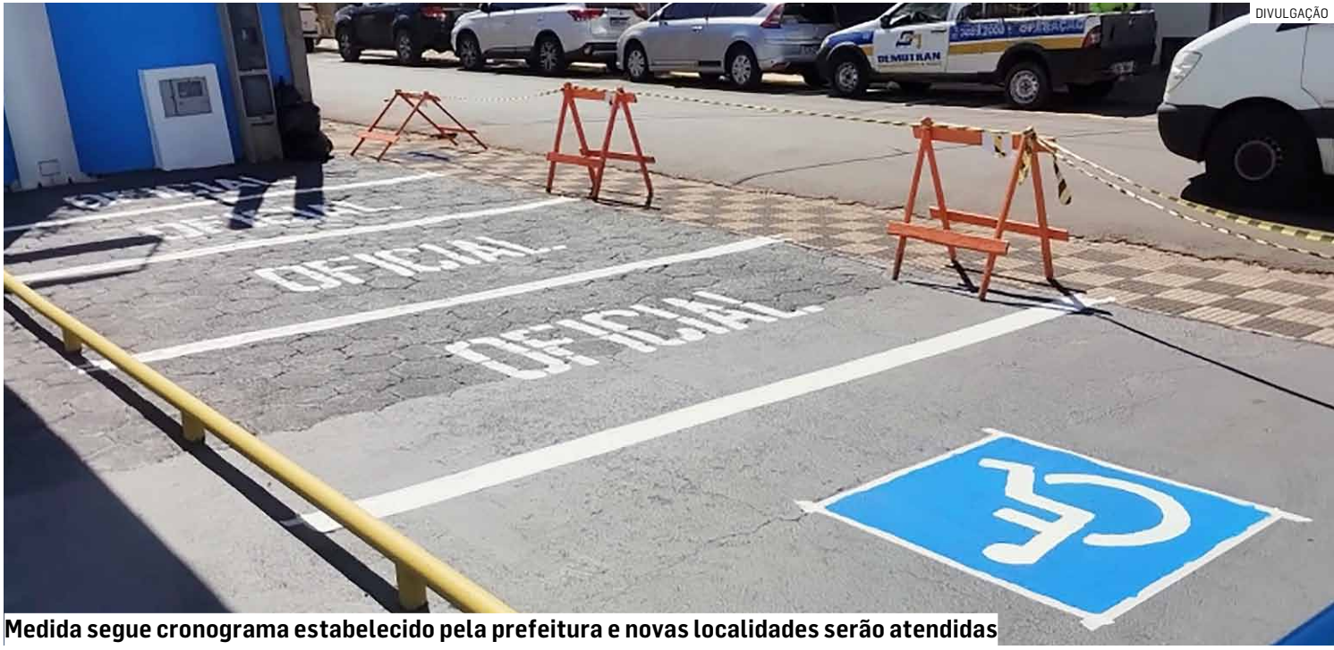
Medida segue cronograma estabelecido pela prefeitura e novas localidades serão atendidas

De acordo com a Secretaria, a nova pintura segue um cronograma pré-definido pela prefeitura e em breve contemplará outros bairros de Monte Mor.