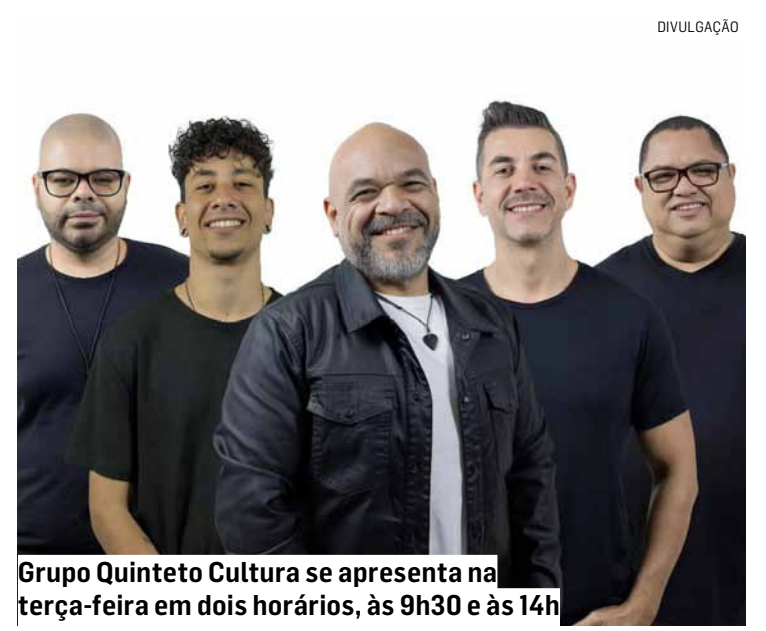
Grupo Quinteto Cultura se apresenta na terça-feira em dois horários, às 9h30 e às 14h

A Prefeitura de Hortolândia realiza a Semana Cultural todo mês. O objetivo é democratizar o acesso da população a shows e espetáculos artísticos. A proposta é reunir numa mesma semana os diversos eventos que o município promovia em dias diferentes de um mesmo mês. Em março deste ano, a Semana Cultural teve o festival Vozes da MPB, que contou com os shows de Maria Gadú, Chico César, Tiago Iorc e Fernando Quesada.