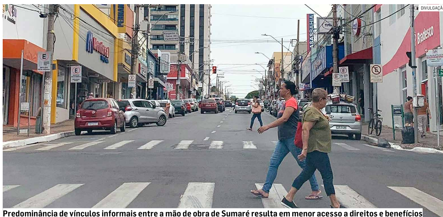
Predominância de vínculos informais entre a mão de obra de Sumaré resulta em menor acesso a direitos e benefícios

Cidade apresenta uma das menores taxas de desemprego da RMC, alto nível de ocupação e geração constante de vagas, mas convive com informais acima da média regional, apontando fragilidade nas relações de trabalho