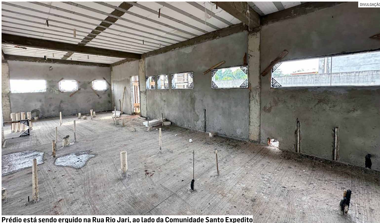
Prédio está sendo erguido na Rua Rio Jari, ao lado da Comunidade Santo Expedito

Com 596,12 m 2 de área construída, a unidade foi planejada para garantir atendimento integral e humanizado em um espaço amplo, moderno, acessível e sustentável. O projeto inclui consultórios médicos, ginecológicos e odontológicos; salas multiprofissionais; setores de vacinação, medicação, curati-