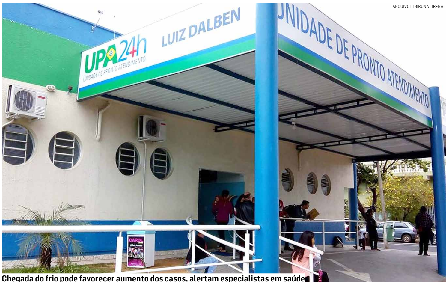
Chegada do frio pode favorecer aumento dos casos, alertam especialistas em saúde

Hortolândia lidera em número de confirmações em 2026 entre as três cidades de maior população da área de cobertura do Tribuna Liberal , com dez ocorrências. Nenhuma