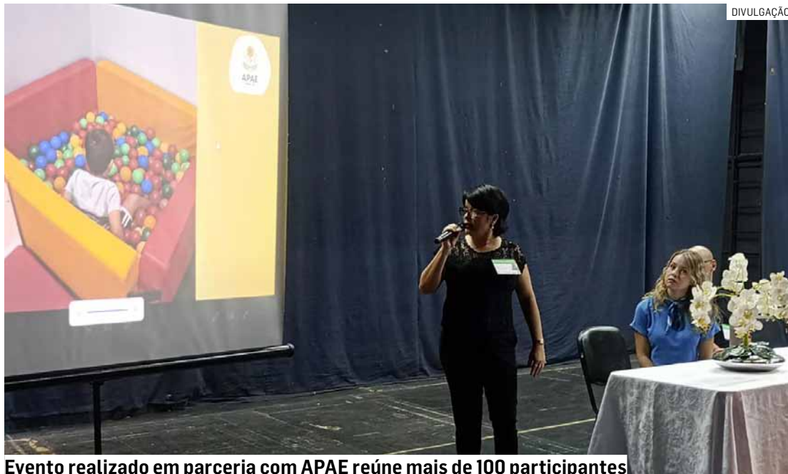
Evento realizado em parceria com APAE reúne mais de 100 participantes

A programação ocorreu com palestras e debates sobre temas essenciais para o atendimento às pessoas com TEA. Entre os assuntos abordados, estiveram os marcos do desenvolvimento na reabilitação infantil, o diagnós-