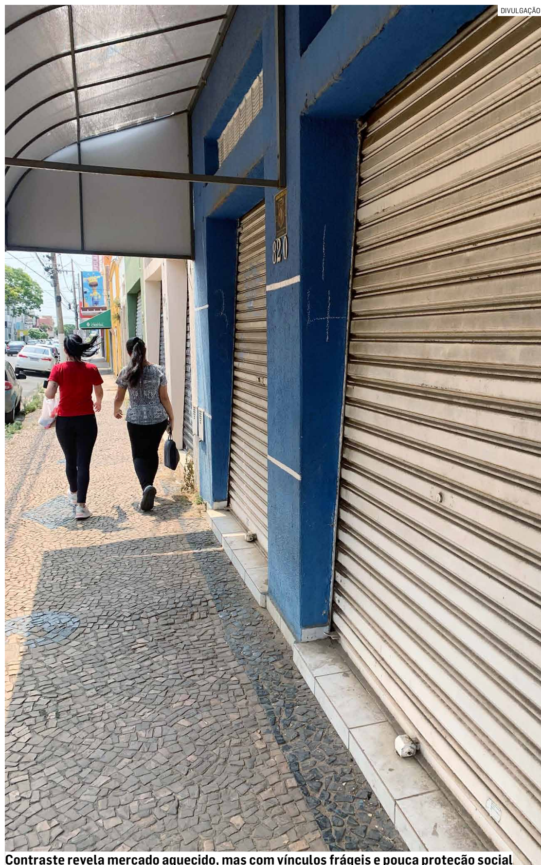
Contraste revela mercado aquecido, mas com vínculos frágeis e pouca proteção social

Apesar dos avanços na geração de empregos, o município reconhece que a informalidade ainda representa um desafio. Por isso, as ações seguem sendo ampliadas.