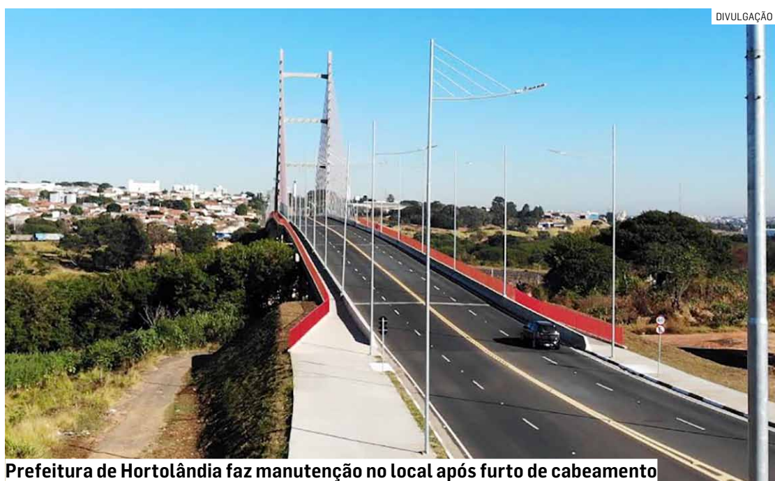
Prefeitura de Hortolândia faz manutenção no local após furto de cabeamento

No sentido contrário, para quem sai de Hortolândia e quer acessar a rodovia, a alternativa é a utilização da Avenida da Emancipação, até o trevo da EMS.