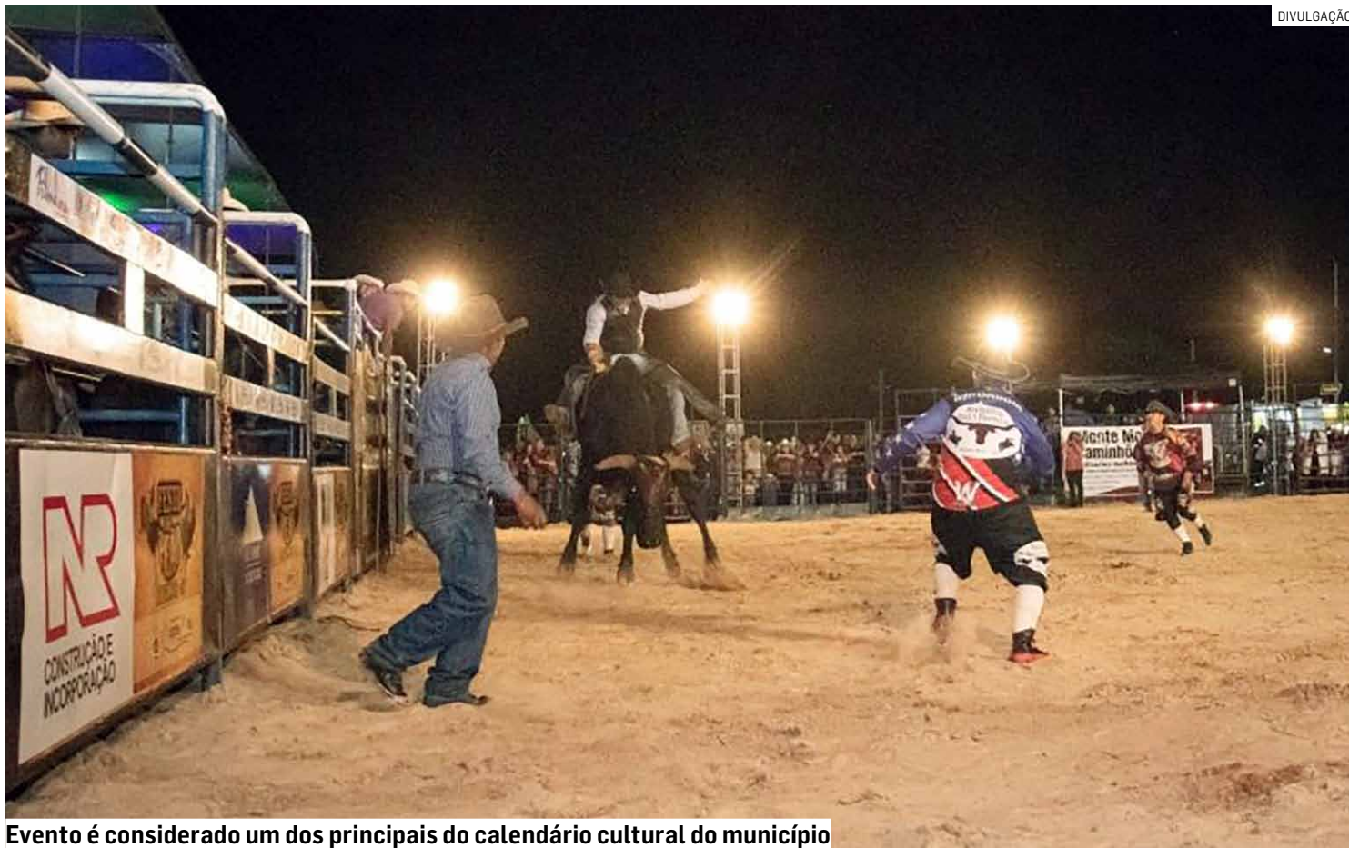
Evento é considerado um dos principais do calendário cultural do município

O processo faz parte do chamamento cujo objetivo é a celebração de um Termo de Ocupação com empresa especializada na realização de eventos. A contratação prevê a organização, promoção e exploração da Festa do Peão de Monte Mor,