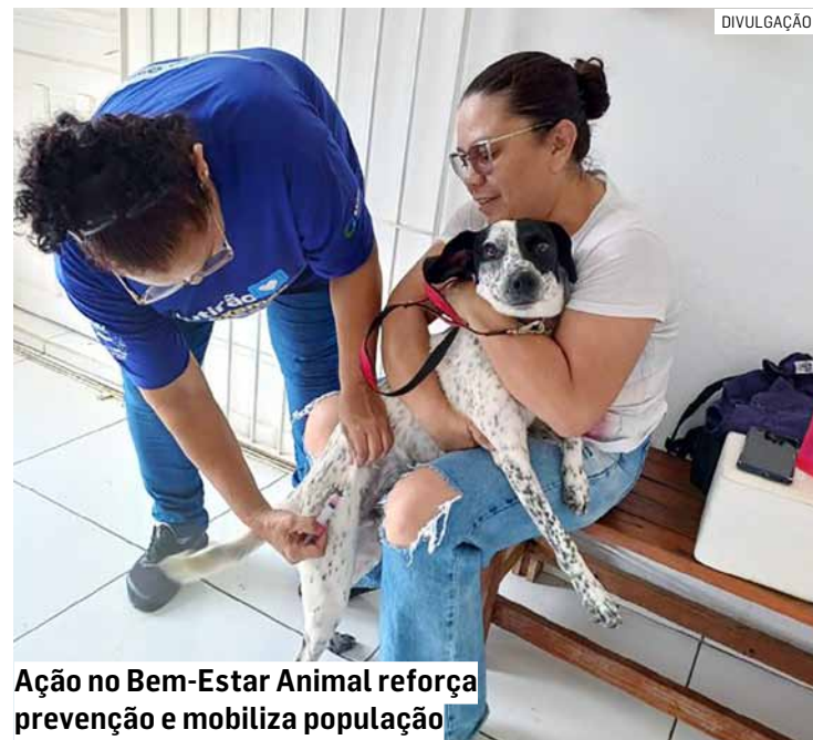
Ação no Bem-Estar Animal reforça prevenção e mobiliza população

A orientação é que os tutores compareçam dentro do horário estabelecido e levem seus animais de forma segura, utilizando coleiras, guias ou caixas de transporte, garantindo um atendimento tranquilo e seguro.