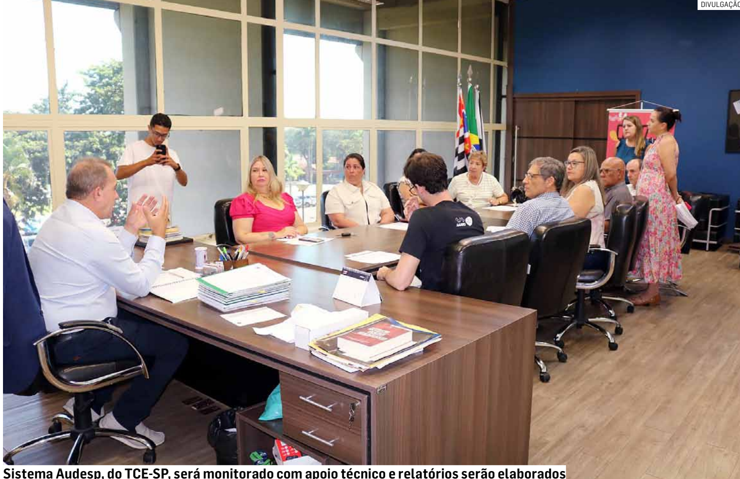
Sistema Audesp, do TCE-SP, será monitorado com apoio técnico e relatórios serão elaborados

Entre as atribuições estão o acompanhamento da execução física e financeira dos convênios, a orien-