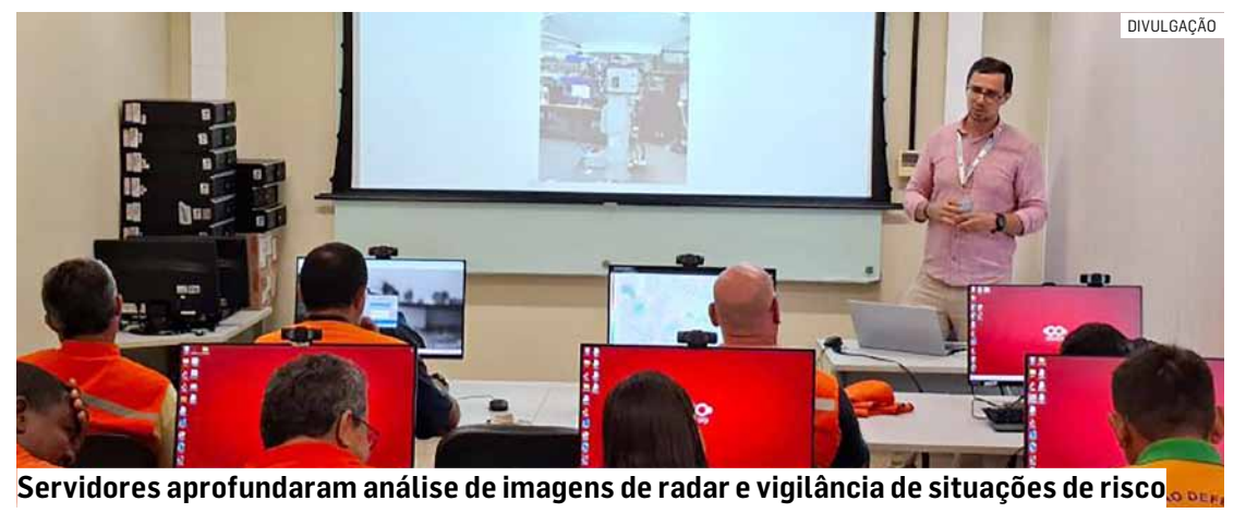
Servidores aprofundaram análise de imagens de radar e vigilância de situações de risco

A ação reforça a importância da integração entre as atividades de pesquisa da Unicamp e gestão pública, contribuindo para a prevenção de desastres e a proteção da população, segundo a prefeitura.