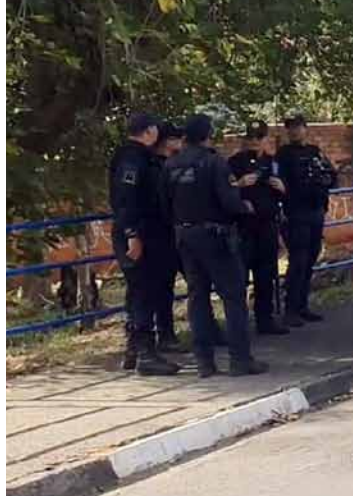
Análise de provas digitais, operação interestadual e ataques virtuais mantêm apurações vivas