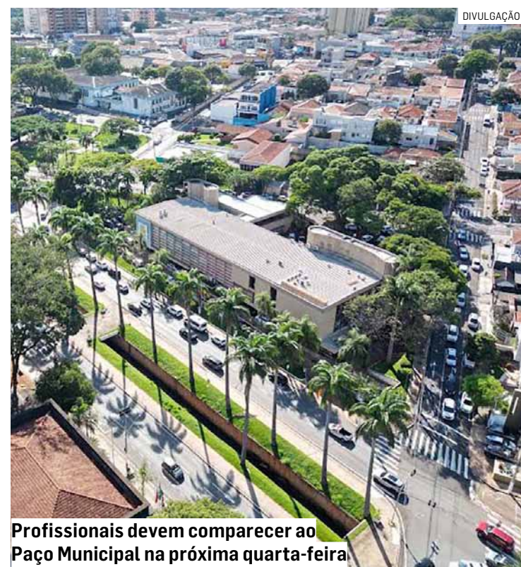
Profissionais devem comparecer ao Paço Municipal na próxima quarta-feira