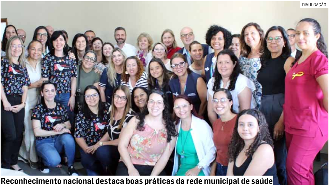
Reconhecimento nacional destaca boas práticas da rede municipal de saúde

A certificação é concedida aos municípios que demonstram avanços significativos nas ações de prevenção, diagnóstico, tratamento e acompanhamento das gestantes e bebês, garantindo uma resposta efetiva às infecções (HIV, sífilis e hepatites) de transmissão vertical, ou seja, de mãe