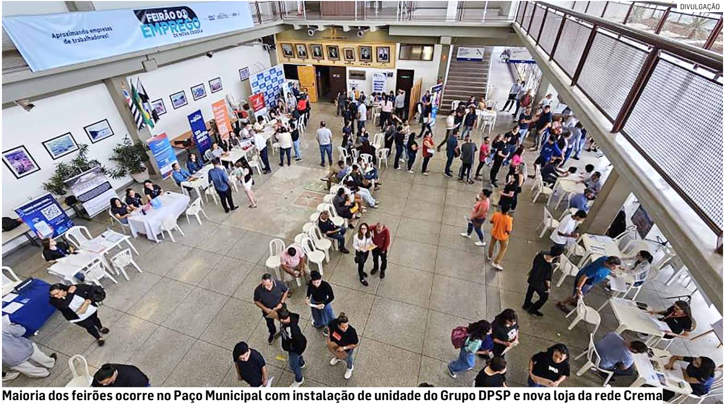
Maioria dos feirões ocorre no Paço Municipal com instalação de unidade do Grupo DPSP e nova loja da rede Crema

O Centro de Distribuição do Grupo DPSP, proprietário das Drogarias Pacheco e São Paulo, inaugurado neste ano em Nova Odessa, também realizará um Feirão do Empre-