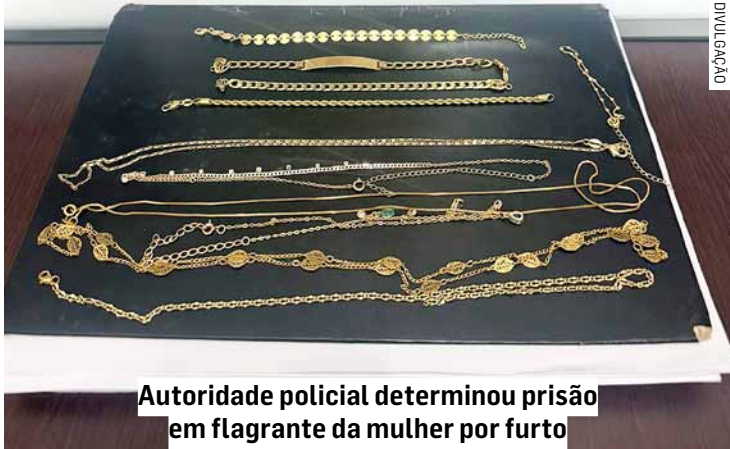
Autoridade policial determinou prisão em flagrante da mulher por furto

De acordo com a corporação, a investigação teve início após uma moradora do Condomínio Residencial Trípoli relatar o desaparecimento frequente de