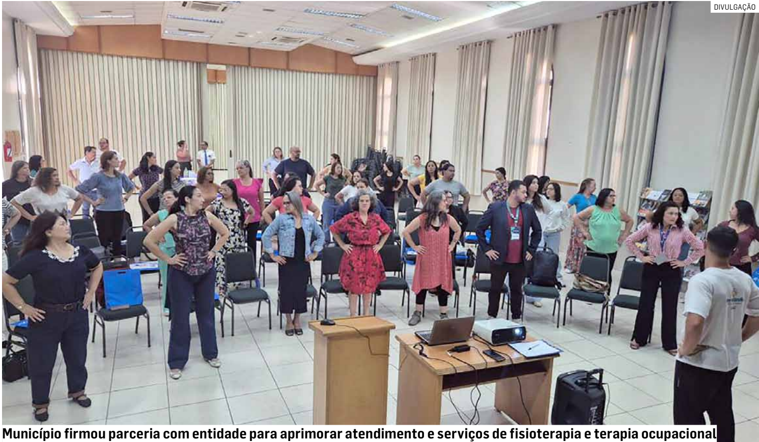
Município firmou parceria com entidade para aprimorar atendimento e serviços de fisioterapia e terapia ocupacional