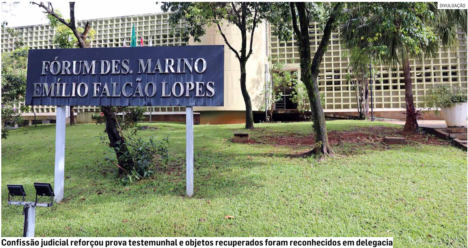
Confissão judicial reforçou prova testemunhal e objetos recuperados foram reconhecidos em delegacia

Segundo o caso, o homem e comparsas chegaram em um carro branco, desceram armados e obrigaram o morador — um idoso — juntamente com sua esposa, filha, genro e