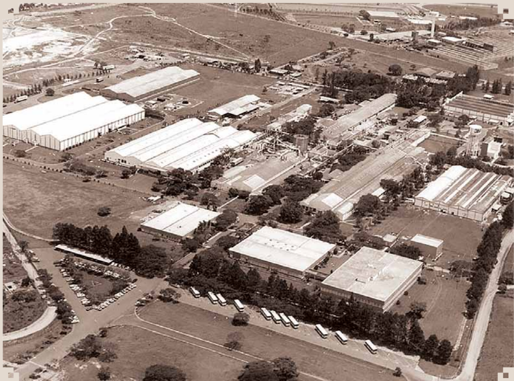
Foto aérea da 3M do Brasil, a primeira multinacional a se instalar em Sumaré, na década de 1940. Localizada às margens da Rodovia Anhanguera, ainda hoje é uma das empresas que mais contribuem para a Receita da Prefeitura e na oferta de empregos. Mais acima, à direita, as instalações da antiga empresa B.F. Goodrich, que fabricava pneus.