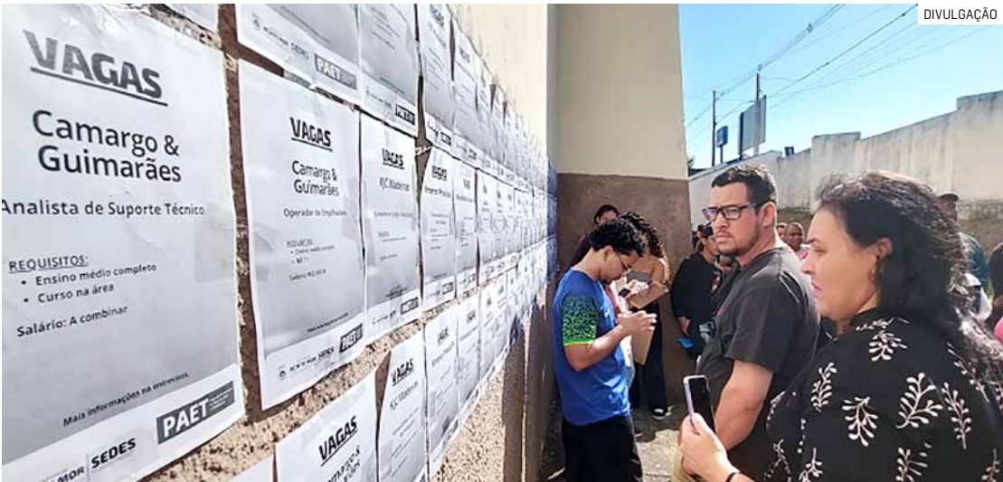
Poder Executivo diz que cada emprego criado representa uma família com 'mais segurança'

P.S.: eu fiquei com o coração sangrando quando testemunhei o escorpião cometendo suicídio dentro do frasco de vidro com álcool.