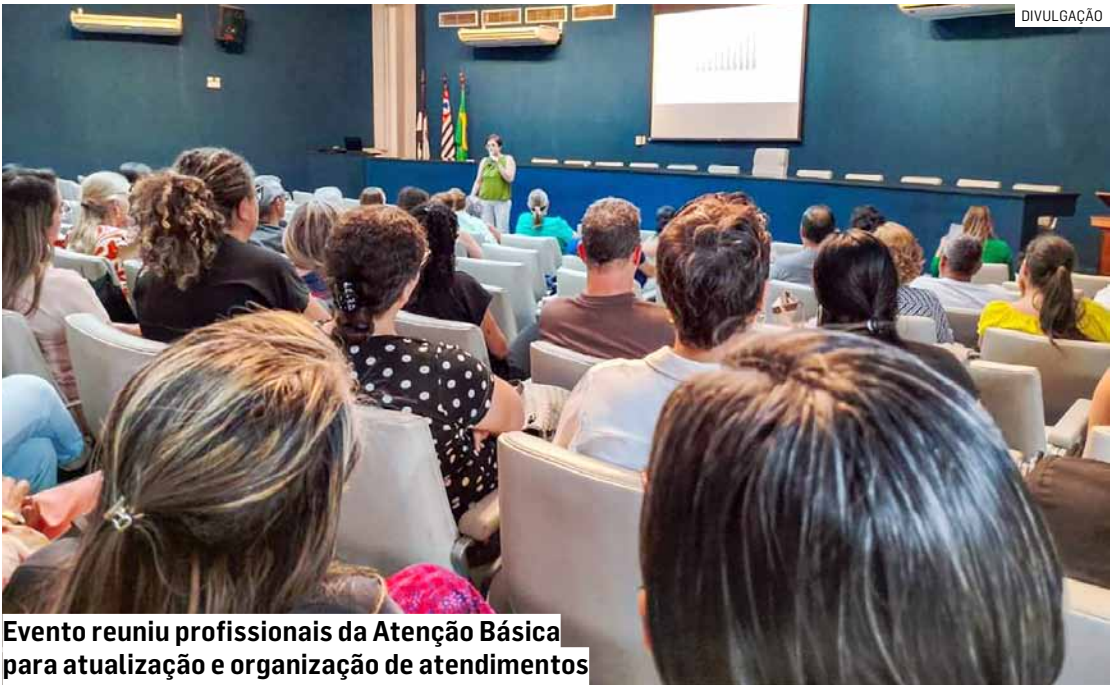
Evento reuniu profissionais da Atenção Básica para atualização e organização de atendimentos

O diagnóstico pode ser feito por meio do teste rápido gratuito oferecido pelo SUS, com resultado disponível em até 30 minutos. O exame é simples, seguro e tão confiável quanto os testes laboratoriais.