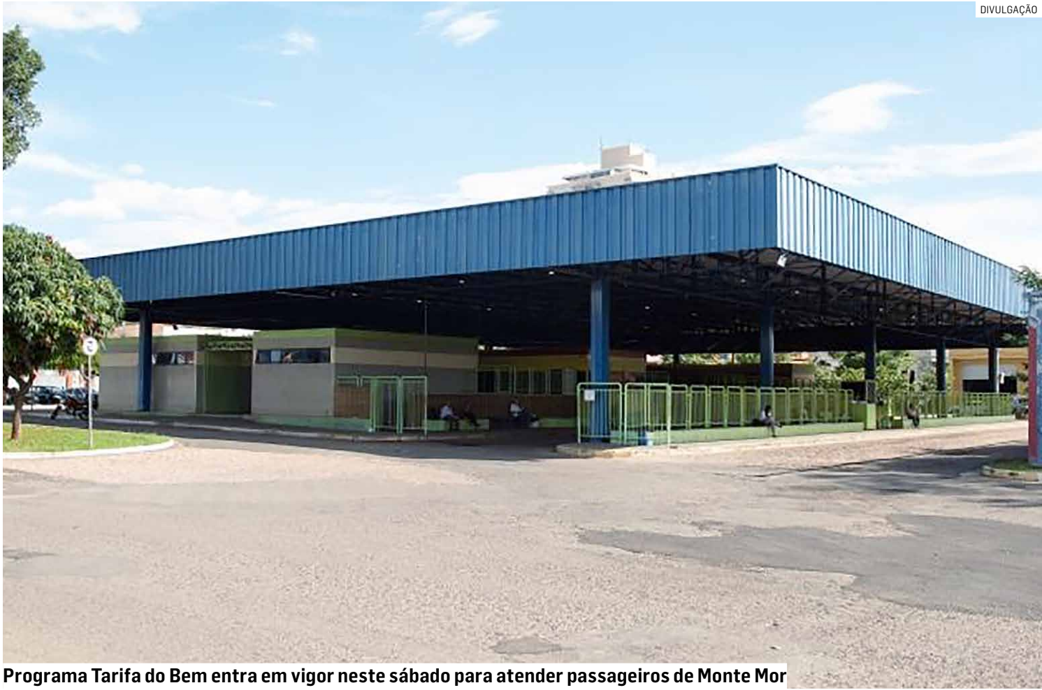
Programa Tarifa do Bem entra em vigor neste sábado para atender passageiros de Monte Mor

De acordo com a administração municipal, a Tarifa do Bem (isenção) será concedida a pessoas com 60 anos ou mais; Pessoas Com Deficiência (PCDs);