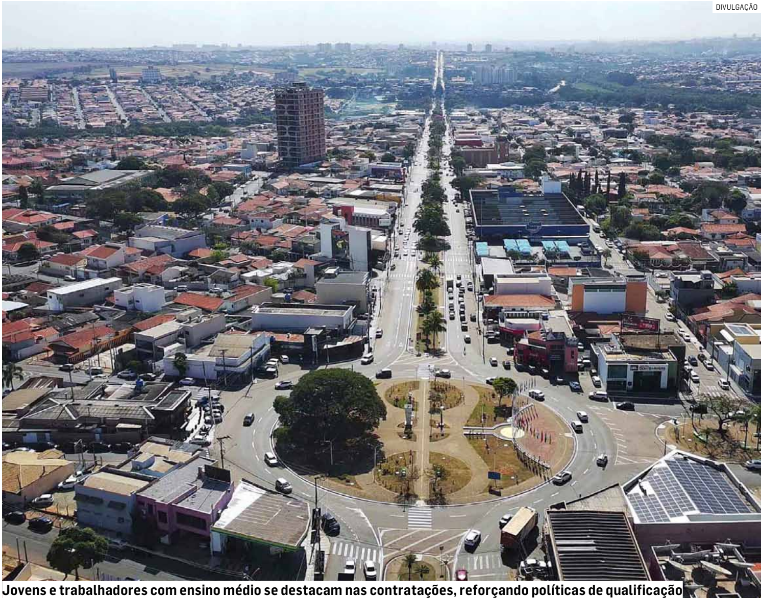
Jovens e trabalhadores com ensino médio se destacam nas contratações, reforçando políticas de qualificação

O setor de serviços foi o principal motor da geração