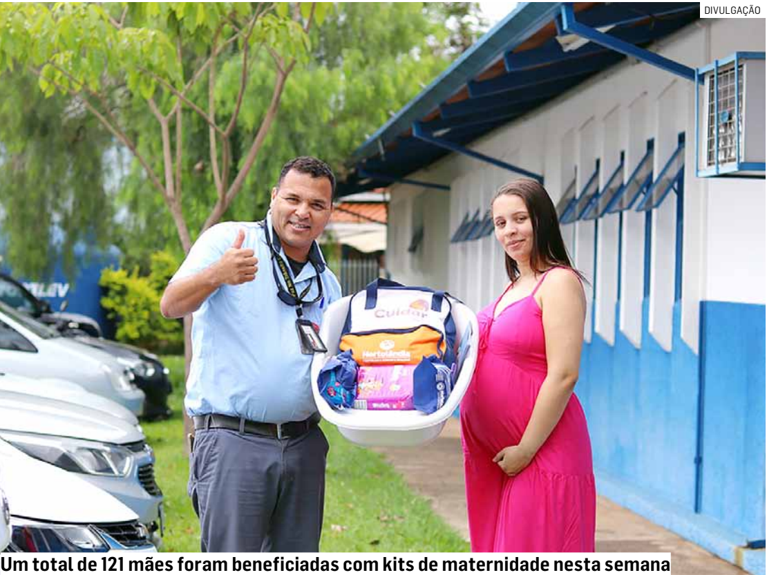
Um total de 121 mães foram beneficiadas com kits de maternidade nesta semana