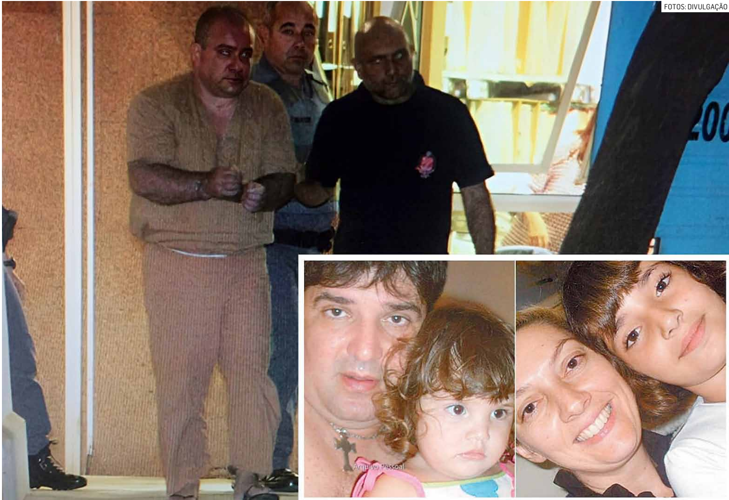
Homem foi condenado por executar empresário, esposa e estrangular as duas filhas do casal

A juíza Camila Paiva Portero, responsável pela Vara de Execuções Criminais que acompanhava o caso, determinou a solicitação da certidão de óbito para formalizar a extinção da pena. O caso encerra, no papel, a história de um dos crimes mais bárbaros já registrados na re-