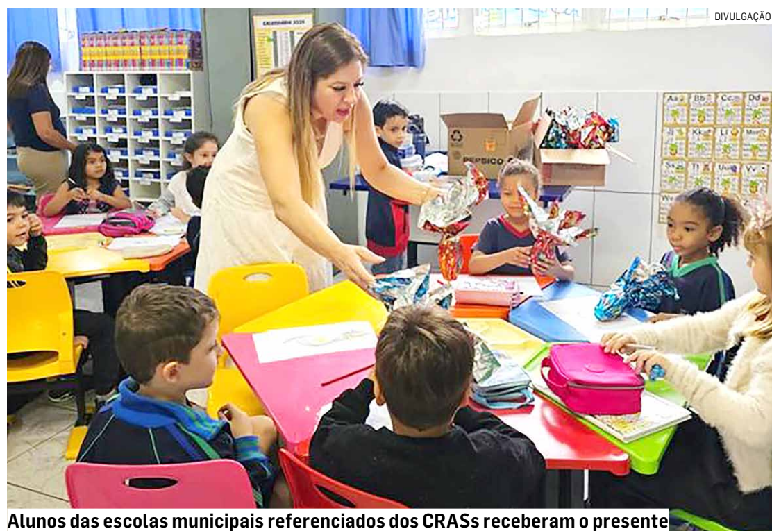
Alunos das escolas municipais referenciados dos CRASs receberam o presente

Da Redação • SUMARÉ tribunaliberal@tribunaliberal.com.br