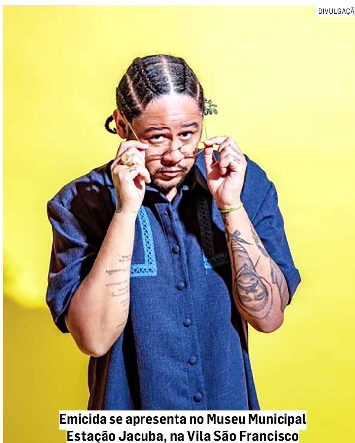
Emicida se apresenta no Museu Municipal Estação Jacuba, na Vila São Francisco