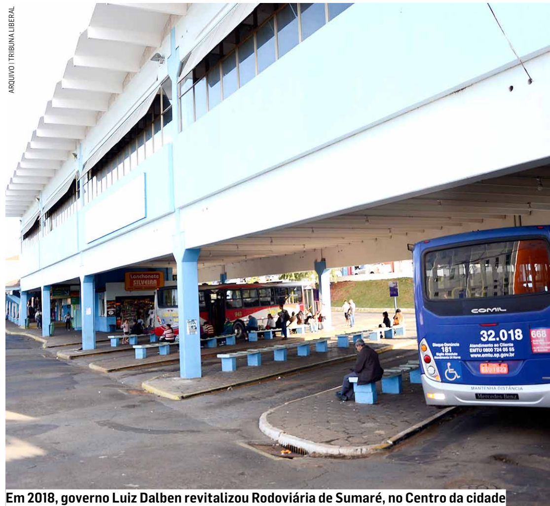
Em 2018, governo Luiz Dalben revitalizou Rodoviária de Sumaré, no Centro da cidade

Com prédio antigo no Centro da cidade, município projeta nova estrutura para usuários do transporte público na Avenida da Amizade, altura da pista de skate; obra ocorre mediante renovação da concessão da Viação Ouro Verde