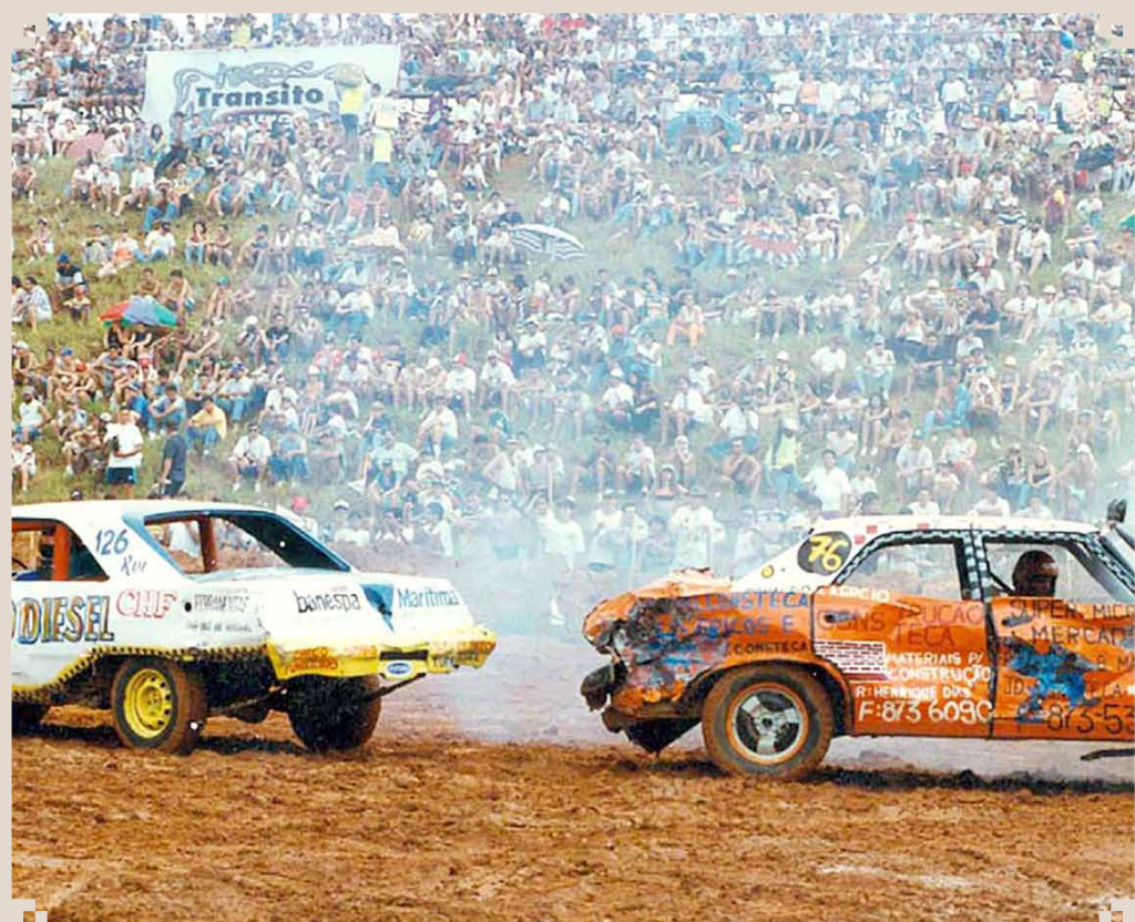
Foto dos anos 1990, do tradicional evento sumareense, o Demolicar. Nessa oportunidade estava sendo realizado dentro do Horto Florestal de Sumaré. Notem o grande público presente. O Demolicar passou a ser um acontecimento regional de grande repercussão.