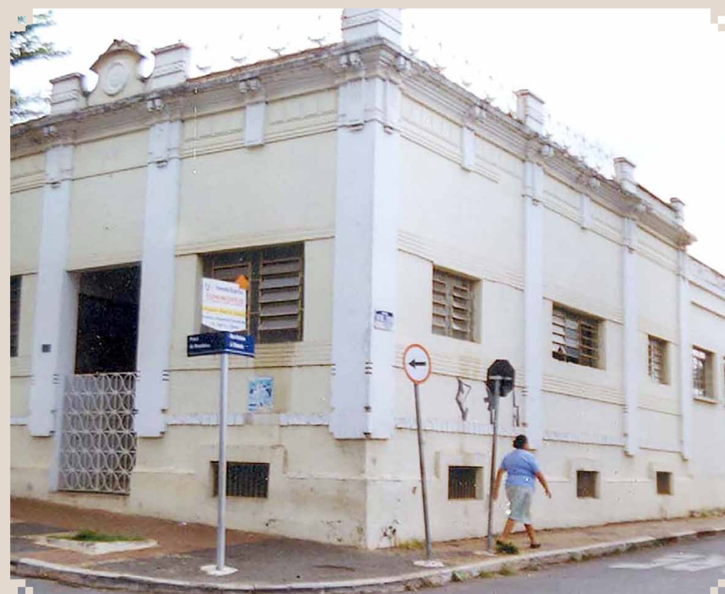
Foto dos anos 1990 do Centro de Memória "Thomaz Didona", localizado na Praça da República n. 102. Na década seguinte seria restaurado pela empresa Logística Sumaré, do Grupo HONDA. Hoje é administrado, sob convênio, pela Associação Pró-Memória de Sumaré.