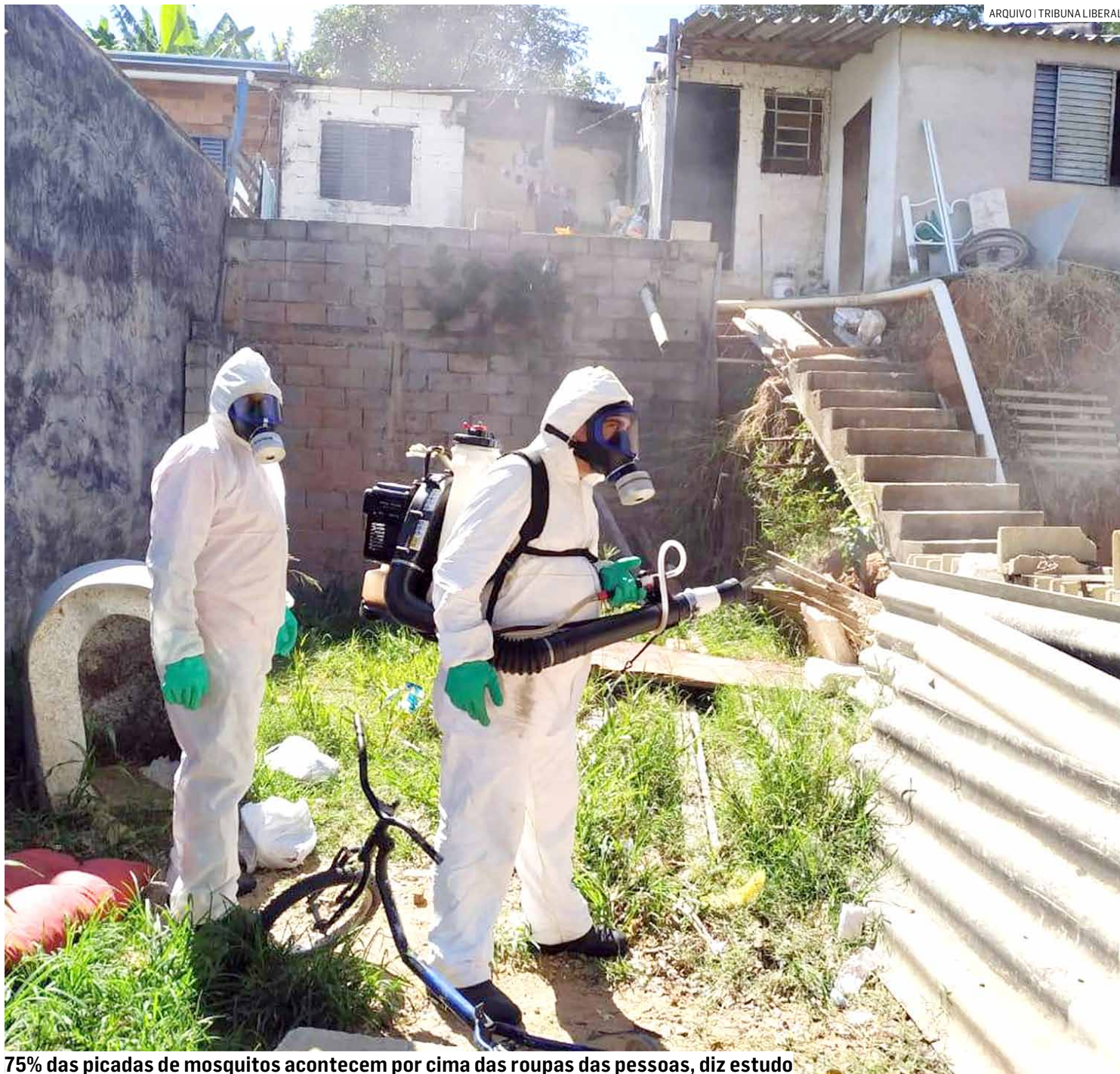
75% das picadas de mosquitos acontecem por cima das roupas das pessoas, diz estudo

A maioria das pessoas não sabe, mas segundo um estudo publicado pela Medical and Veterinary Entomology, em Londres, cerca de 75% das picadas de mosquitos acontecem por cima das roupas, o que torna aplicação de repelente nos tecidos uma necessidade na proteção contra a doença. O que atrai os insetos é uma combinação de vários fatores como sinais químicos, odores de suor e dióxido de carbono, calor e sinais visuais. “Para desenvolver o novo produto, inspiramo-nos numa tecnologia que já é usada há mais de 30 anos pelo Exército dos Estados Unidos, em atividades na selva. Ele é