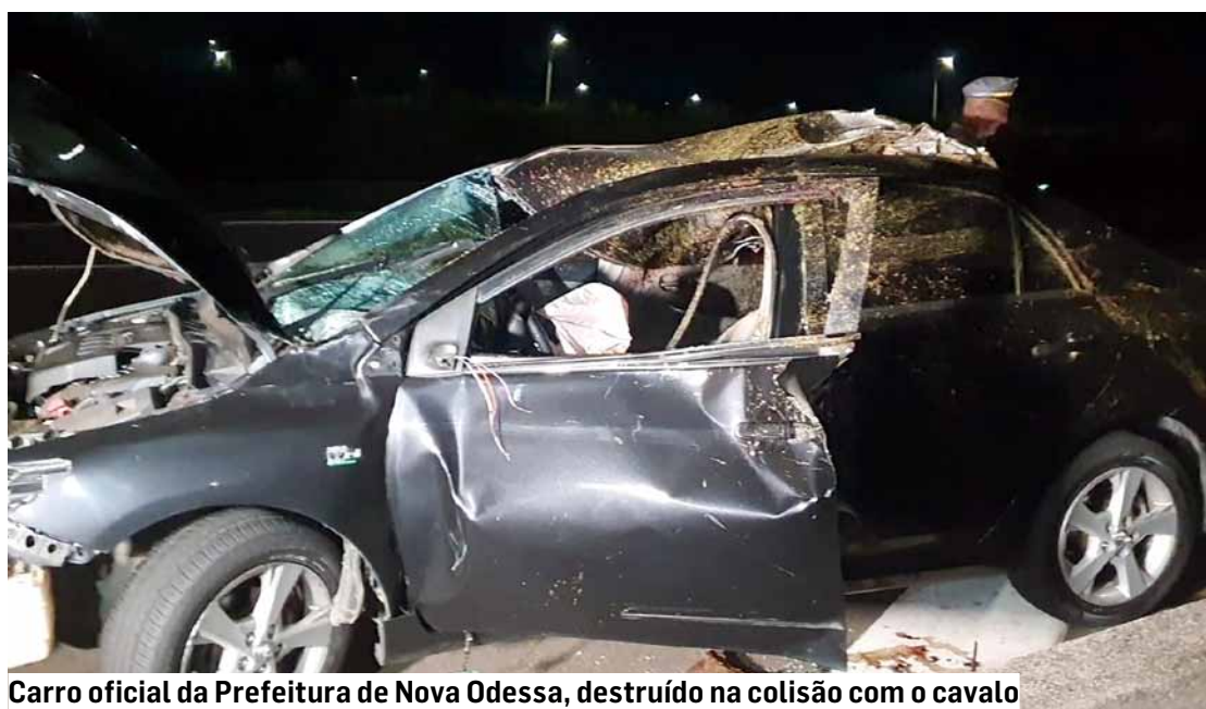
Carro oficial da Prefeitura de Nova Odessa, destruído na colisão com o cavalo

À concessionária cabe a fiscalização ininterrupta do trecho concedido e a organização de campanhas educativas, junto à população linceira.