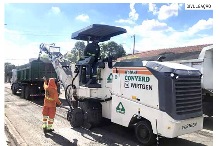
Serviço foi iniciado nesta segunda-feira (25/03) na rua José Caineili, no Jardim Campos Verdes

Ainda de acordo com a diretora, a previsão é que o recape seja realizado em 30 dias. Vale ressaltar que o serviço é suspenso em caso de chuva. As 17 vias que vão receber o recapeamento foram escolhidas por estarem com o asfalto já desgastado e por fazerem parte do itinerário de linhas de ônibus. Após o recape, estão previstos os trabalhos de regularização dos PVs (poços de visita), que são os bueiros, e a execução da pintura da sinalização de trânsito.