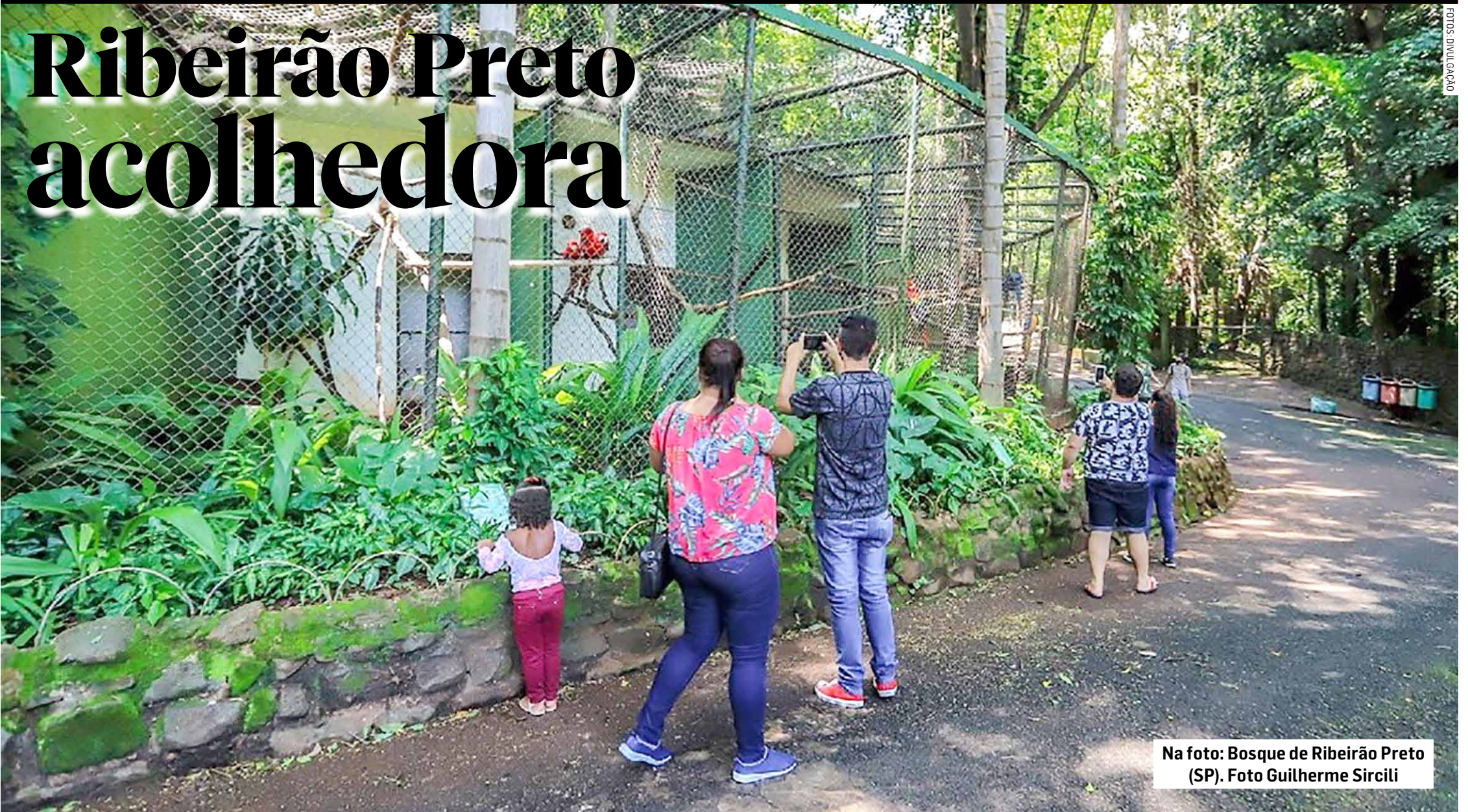
Na foto: Bosque de Ribeirão Preto (SP).

A cidade de Ribeirão Preto, fundada em 1856, dista exatamente 315 km da capital por estradas excelentes. Cidade sede da região com mais de 700 mil habitantes. A comanda da prefeitura está no chamado Palácio Rio Branco, de 1917, hoje convenientemente reformado. A cidade se destaca em pesquisas, educação, saúde, cultura e turismo de negócios. Até há pouco tempo, não conseguiam aprovação no Grupo Técnico de Análise das cidades Estâncias ou de Interesse Turísticos, mas graças à administração atual tudo se regularizou e a sua aprovação técnica já foi para a Assembleia Legislativa.