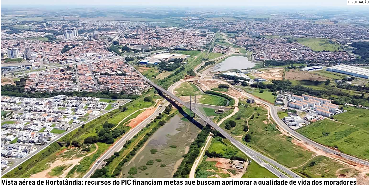
Vista aérea de Hortolândia: recursos do PIC financiam metas que buscam aprimorar a qualidade de vida dos moradores

O Jardim Nossa Senhora Auxiliadora vai ganhar uma nova creche, assim como o bairro Chácaras Recreio Alvorada, contemplado com a construção da EEI (Escola de Educação Infantil) David Miguel Linardi Pereira e a Vila Real Continuação, onde foi construída a EEI Professora Andréa Cristina dos Santos. Além disso, será realizada a ampliação das salas e a refor-