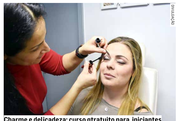
Charme e delicadeza: curso gratuito para iniciantes

Durante a formação profissionalizante, os alunos serão habilitados para identificar os diferentes tipos de rosto, aplicando técnicas de visagismo de acordo com a largura, simetria e gosto pessoal de cada cliente.