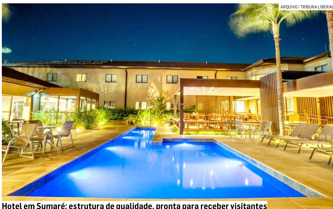
Hotel em Sumaré: estrutura de qualidade, pronta para receber visitantes

O setor de eventos corporativos representa cer-