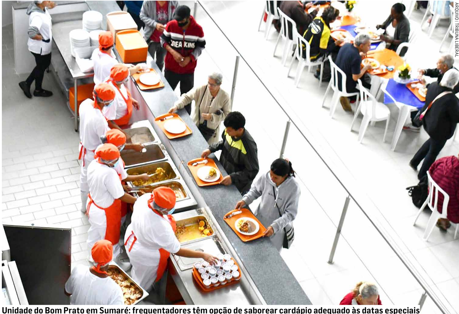
Unidade do Bom Prato em Sumaré: frequentadores têm opção de saborear cardápio adequado às datas especiais

Essa será a primeira vez que todas as unidades fixas da rede de restaurantes do programa popular do