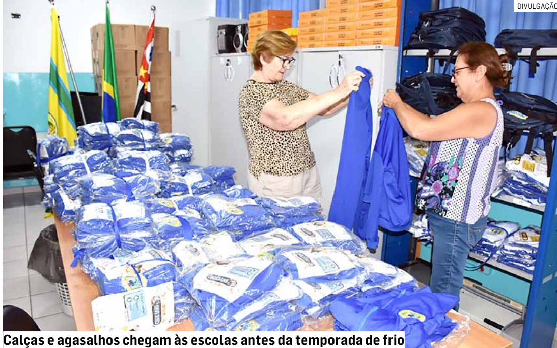
Calças e agasalhos chegam às escolas antes da temporada de frio

“O uniforme é uma importante ferramenta pedagógica e também de segurança para identificar as crianças. Desde o ano passado, viemos nos organizando a pedido do prefeito para que todos os uniformes fossem entregues no tempo certo. Já entregamos