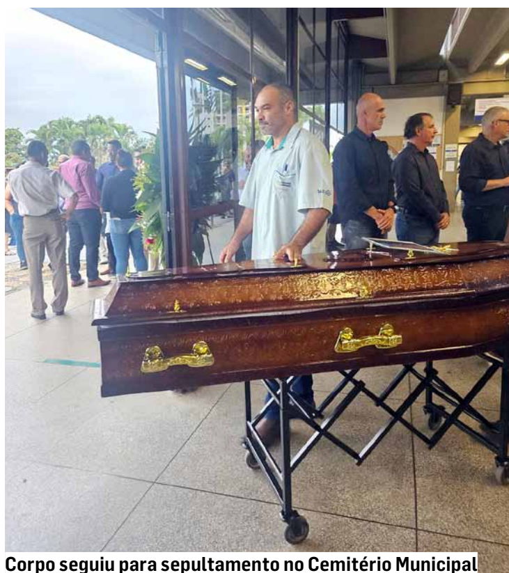
Corpo seguiu para sepultamento no Cemitério Municipal

dois deles invadiram a pista. As batidas em série envolveram quatro veículos.