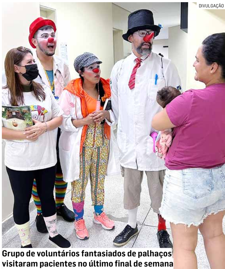
Grupo de voluntários fantasiados de palhaços visitaram pacientes no último final de semana