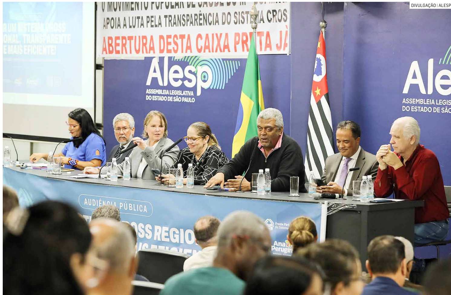
Audiência pública no Auditório da ALESP: deputada no centro do debate por maiores investimentos do Estado no setor

“Qualquer lógica de regulação não pode prescindir de querer bancar sistematicamente os princí-