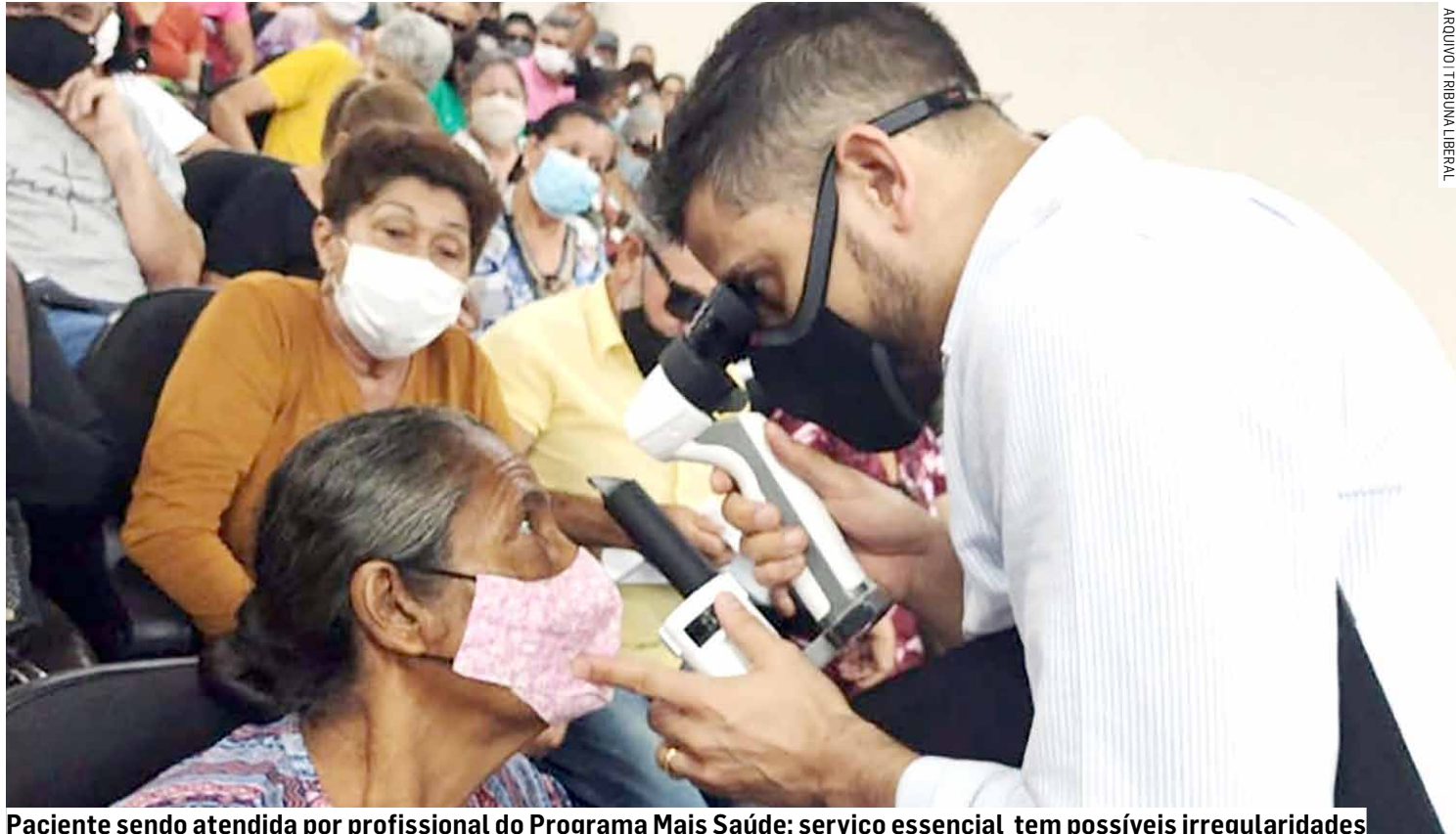
Paciente sendo atendida por profissional do Programa Mais Saúde: serviço essencial tem possíveis irregularidades