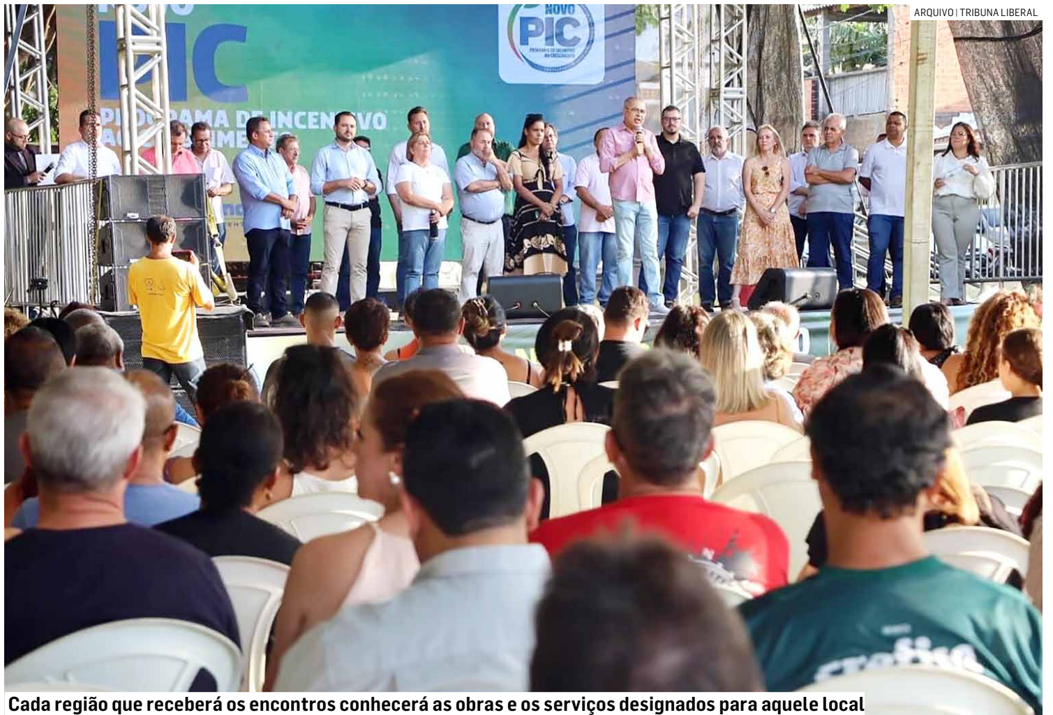
Cada região que receberá os encontros conhecerá as obras e os serviços designados para aquele local

De acordo com a Secretaria de Governo, cada região que receberá os encontros conhecerá as obras e os serviços designados para aquele local, facilitando a compreensão da população sobre o que representa esta nova etapa do PIC. Nesta quarta-feira, por exemplo, serão apresentadas as diretrizes de obras como o Viaduto do Jardim Nova Europa, o novo Paço Municipal, o Centro de Eventos sob a Ponte da Esperança (estaiada), as ligações da avenida Panaíno aos jardins Nova Europa e Sumarezinho, além das praças da "Cidadania" e a futura praça que estará localizada ao lado do novo Paço Municipal. Também serão apresentados, digitalmente, os projetos dos três novos parques socioambientais e de duas unidades de ensino para a região.