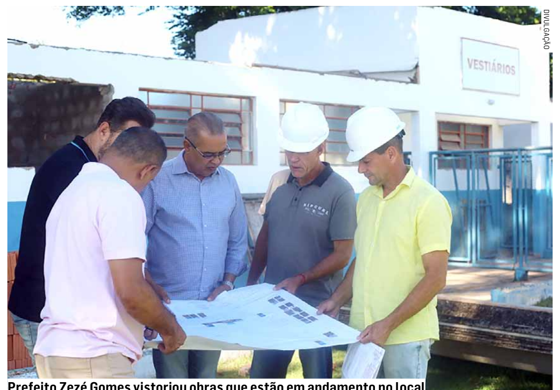
Prefeito Zezé Gomes vistoriou obras que estão em andamento no local