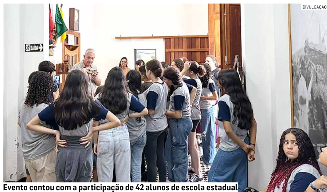
Evento contou com a participação de 42 alunos de escola estadual

Da Redação • HORTOLÂNDIA tribunaliberal@tribunaliberal.com.br