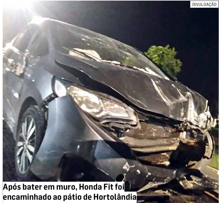
Após bater em muro, Honda Fit foi encaminhado ao pátio de Hortolândia

César Oliveira • HORTOLÂNDIA tribunaliberal@tribunaliberal.com.br