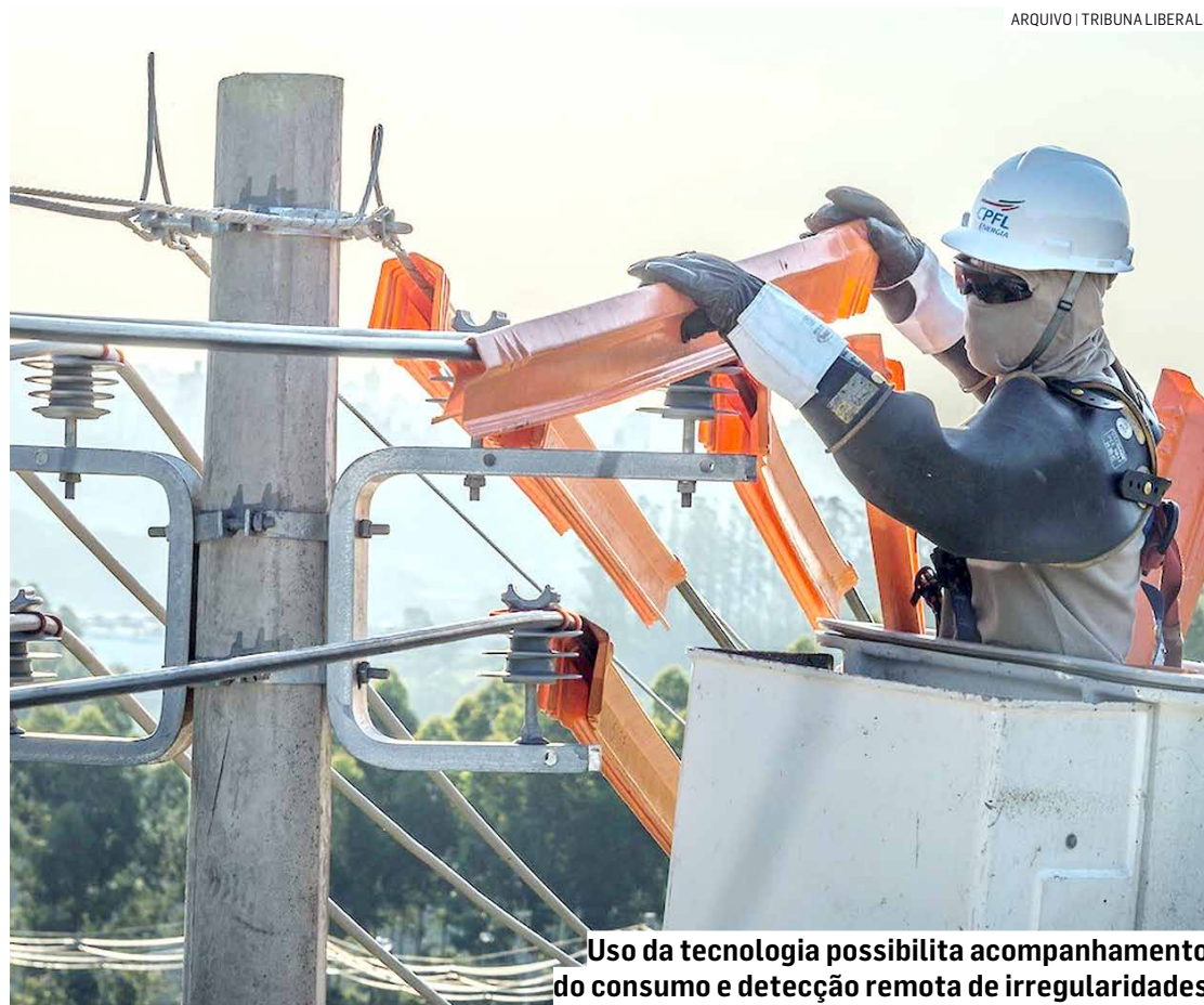
Uso da tecnologia possibilita acompanhamento do consumo e detecção remota de irregularidades

“Outra tecnologia que empregamos no combate às fraudes é a blindagem das medições, inclusive nos grandes clientes, como indústrias e comércios. Os medidores com essa tecnologia são acessíveis apenas aos técnicos da empresa e proporcionam acompanhamento do consumo em tempo real, permitindo que a leitura e faturamento sejam realizados à distância. Só em 2023 blindamos