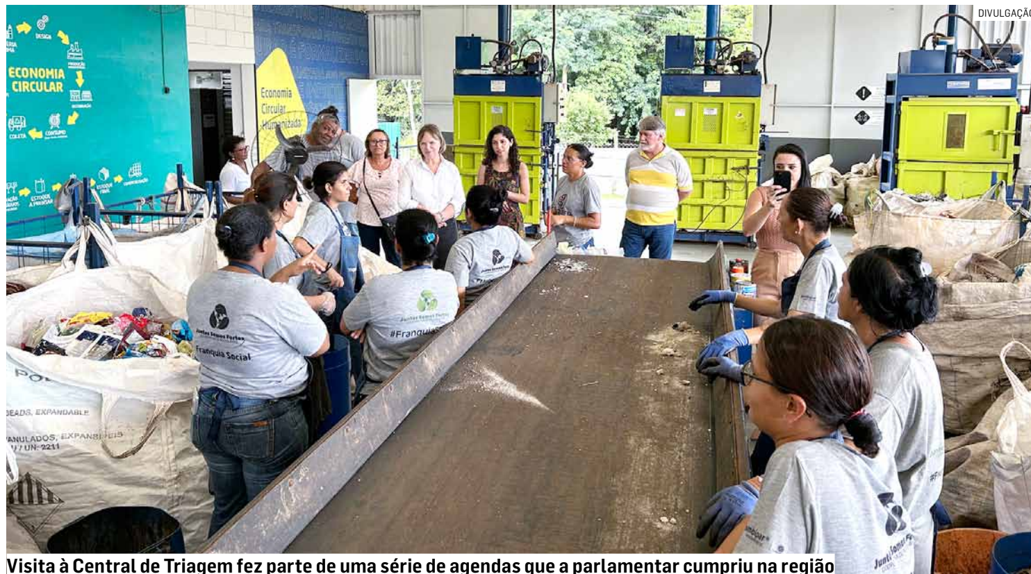
Visita à Central de Triagem fez parte de uma série de agendas que a parlamentar cumpriu na região

Da Redação • REGIÃO tribunaliberal@tribunaliberal.com.br