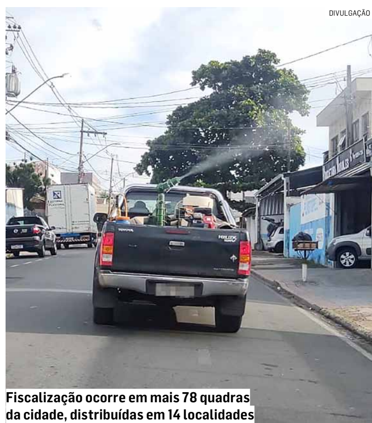
Fiscalização ocorre em mais 78 quadras da cidade, distribuídas em 14 localidades