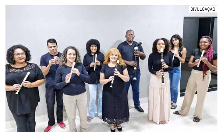
Projeto é desenvolvido por grupo de 12 flautistas

Data: (17/03) Horário: 16h Local: Teatro Elizabeth Keller de Matos (Unidade Cultural Arlindo Zadi) Endereço: Rua Graciliano Ramos, 280, Jd. Amanda