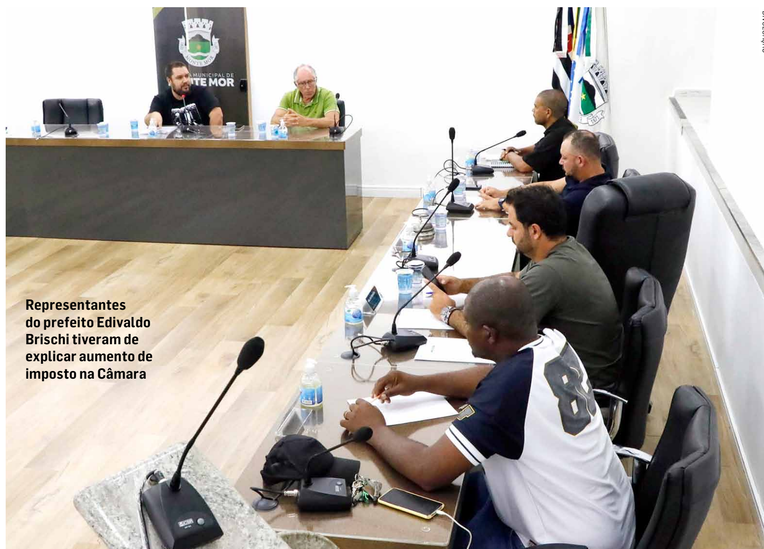
Representantes do prefeito Edivaldo Brischí tiveram de explicar aumento de imposto na Câmara

Representantes da Administração participaram de reunião e parlamentares falaram em 'cobrança injusta' e destacaram precariedade dos serviços públicos