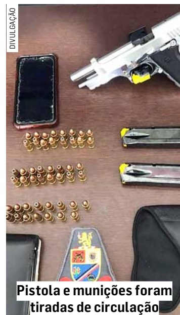
Pistola e munições foram tiradas de circulação

Uma policial feminina fez busca pessoal na bolsa da mulher do indiciado e localizou 2 carregadores de 9mm. Ao ser questionada sobre o armamento, ela informou que não