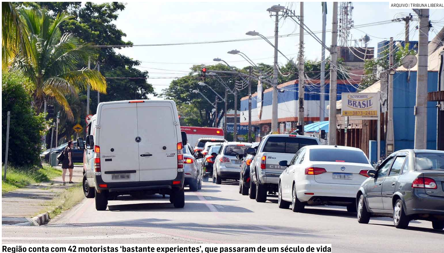
Região conta com 42 motoristas 'bastante experientes', que passaram de um século de vida

A validade da habilitação varia de acordo com a