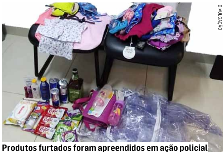
Produtos furtados foram apreendidos em ação policial

Em revista pessoal, a PM localizou um alicate entre os seios de uma delas, e informou a equipe que utilizava a ferramenta para cor-