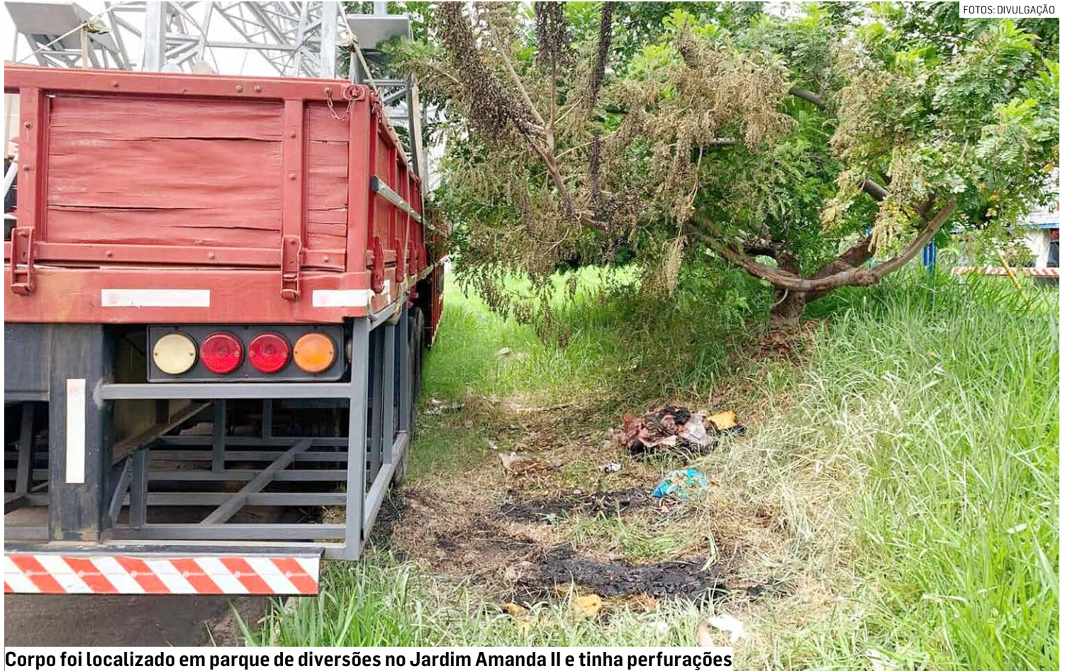
Corpo foi localizado em parque de diversões no Jardim Amanda II e tinha perfurações

A ocorrência foi registrada no Plantão Policial de Hortolândia. A polícia investiga o caso e busca identificar os autores pela morte do homem, além da motivação do crime.