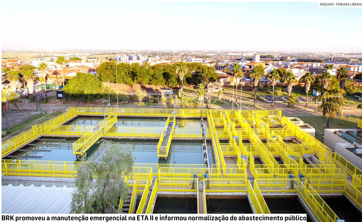
BRK promoveu a manutenção emergencial na ETA II e informou normalização do abastecimento público

A BRK, concessionária responsável pelos serviços de água e esgoto em Sumaré, atuou desde as primeiras horas da manhã da sexta-feira (23) na retomada do abastecimento das regiões de Nova Veneza, Matão e Área Cura após uma manutenção emergencial realizada na Es-