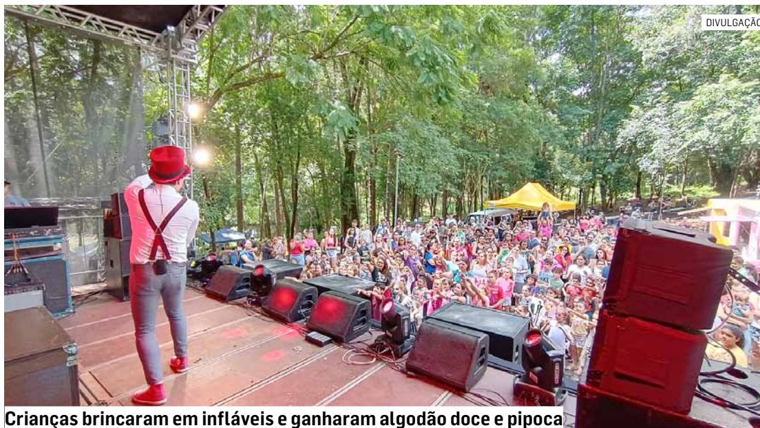
Crianças brincaram em infláveis e ganharam algodão doce e pipoca

Durante o evento, foi feito o lançamento do Pro-