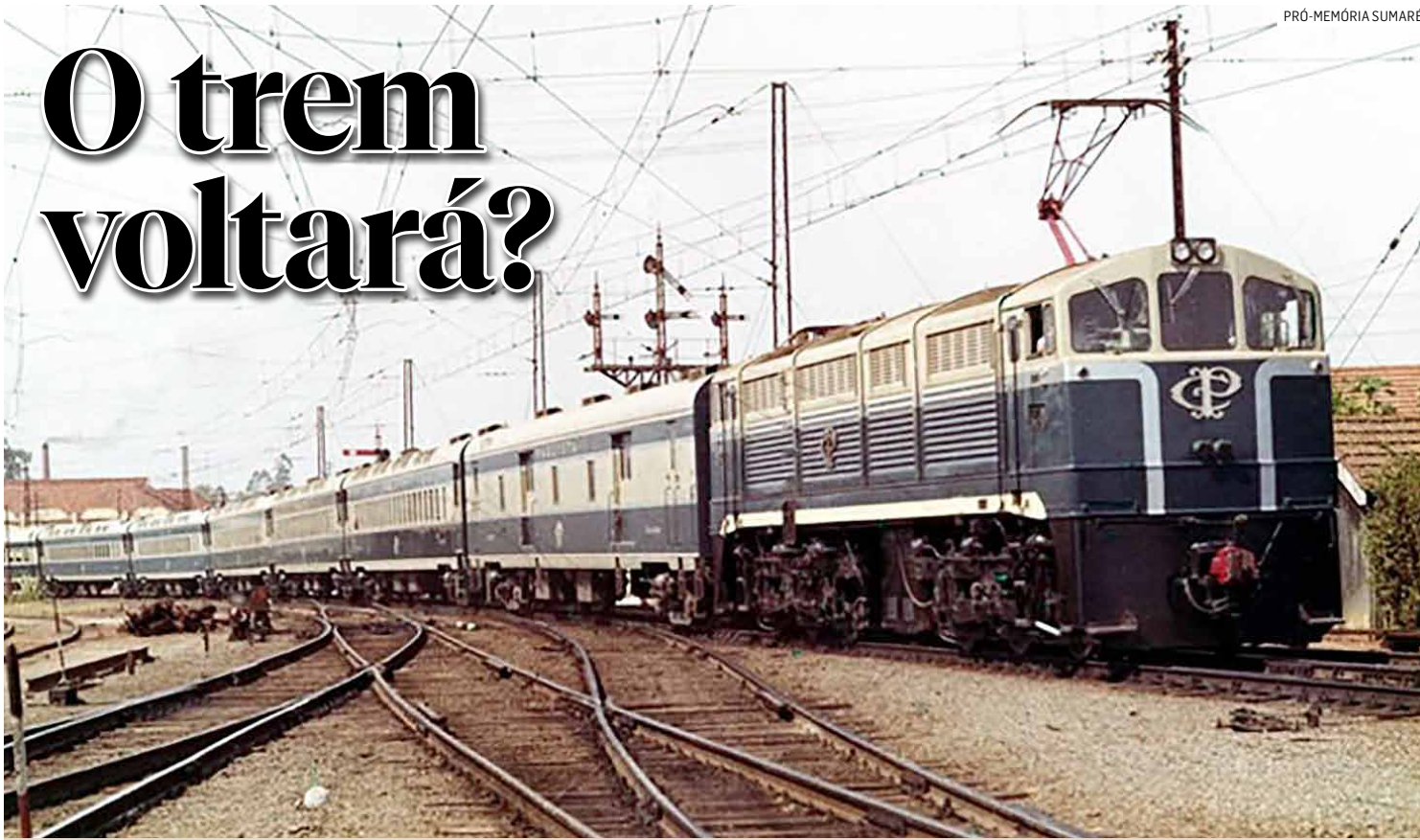
Trem de Passageiros da Cia. Paulista