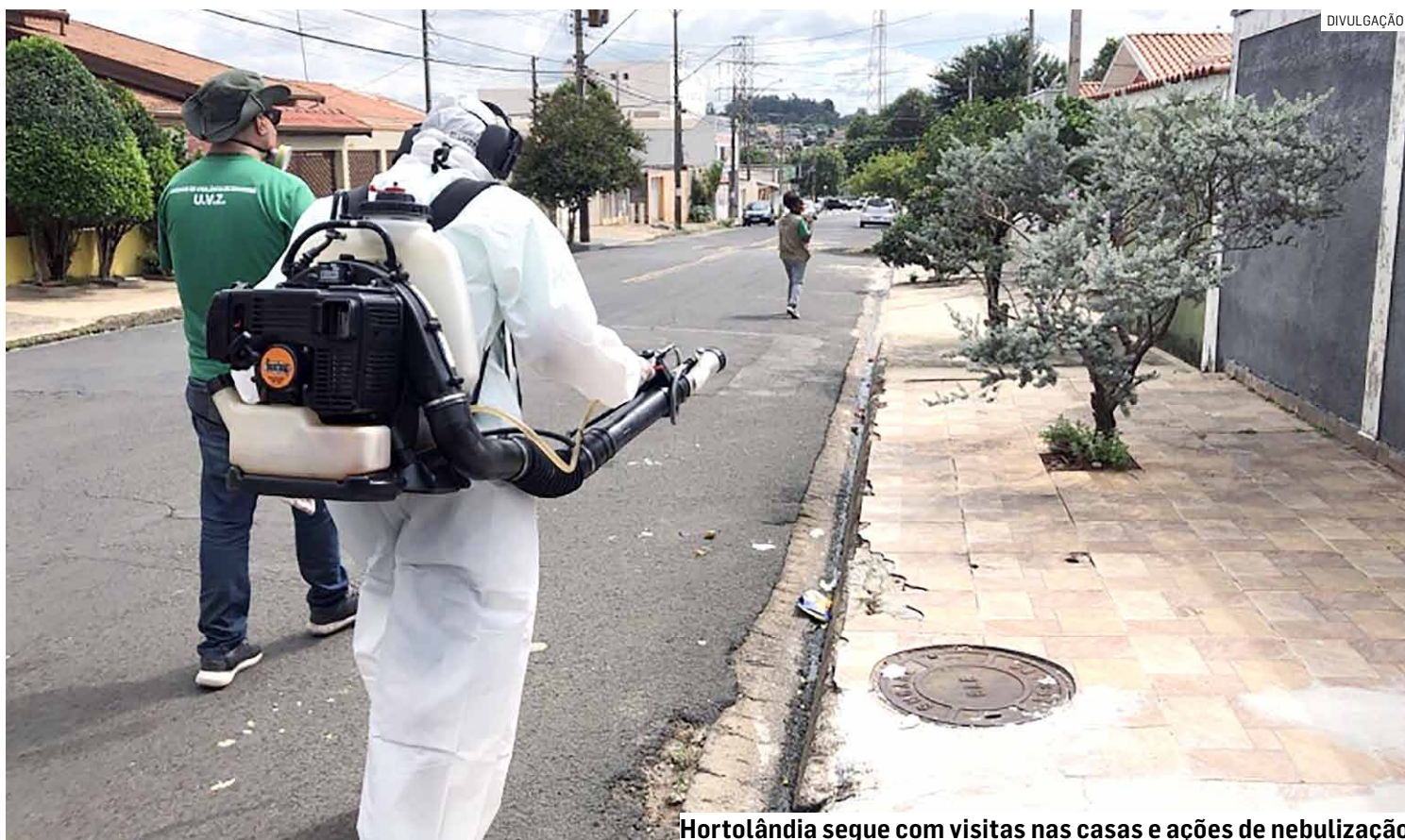
Hortolândia segue com visitas nas casas e ações de nebulização

Nesta semana, a Prefeitura realizou nova busca ativa e nebulização em diferentes regiões da cidade. Vaso sanitário desativado e lata usada de tinta. Estes são alguns objetos, com água acumulada dentro, em que os agentes da Prefeitura já encontraram larvas do Aedes aegypti nas visitas casa a casa. A busca ativa em imóveis residenciais é uma das ações que a Administração Municipal realiza continuamente para combater