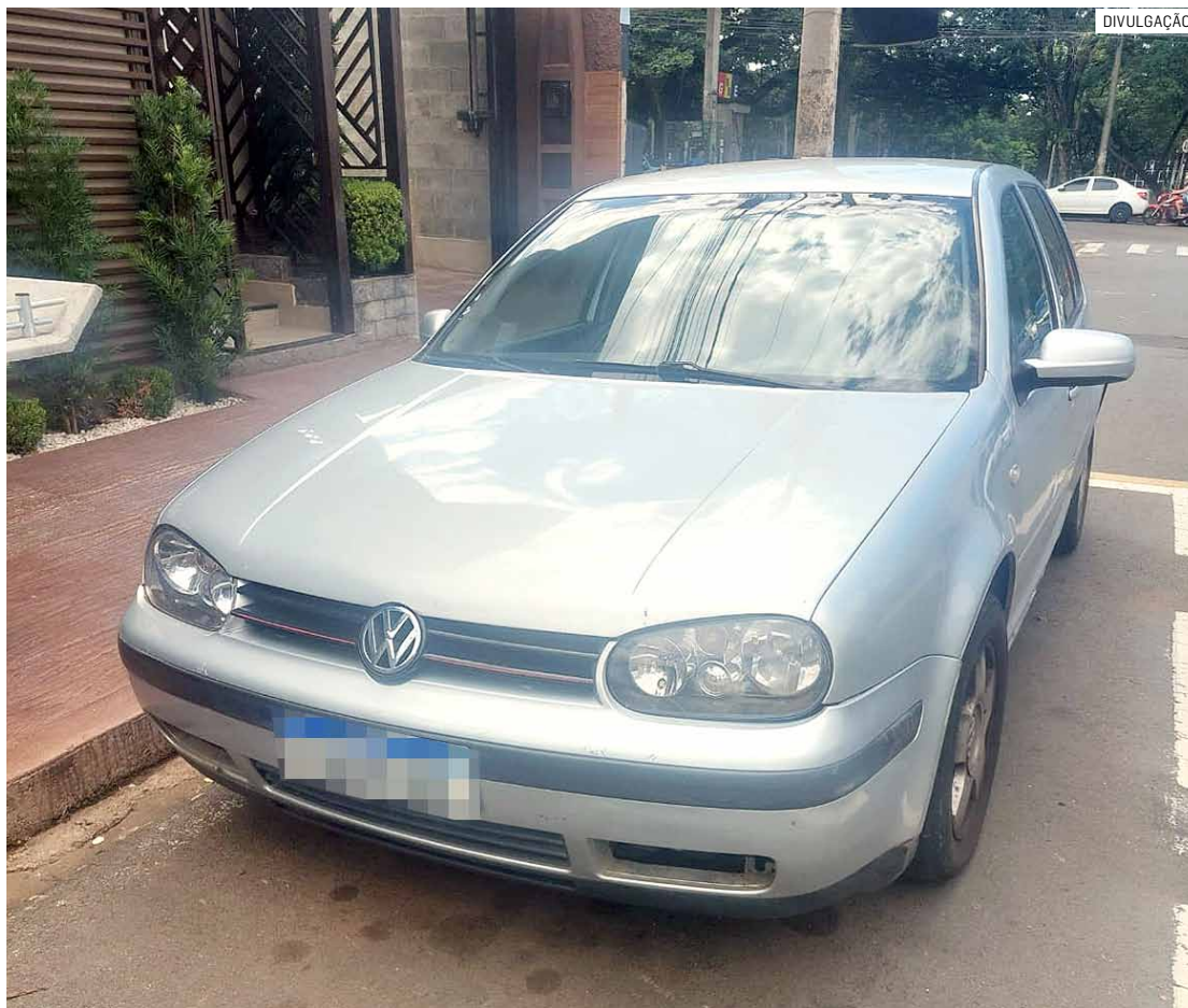
Estelionatários estavam em um veículo Golf quando foram abordados pela Polícia Militar

Em depoimento, a vítima teria sido abordada por uma mulher, que dizia ter ganho um bilhete premiado e que o dinheiro precisava ser sacado no banco, mas, como a suspeita supostamente não possuía documentos, precisava de ajuda para realizar o saque e, para isso, prometeu um dinheiro para a vítima ajudá-la.