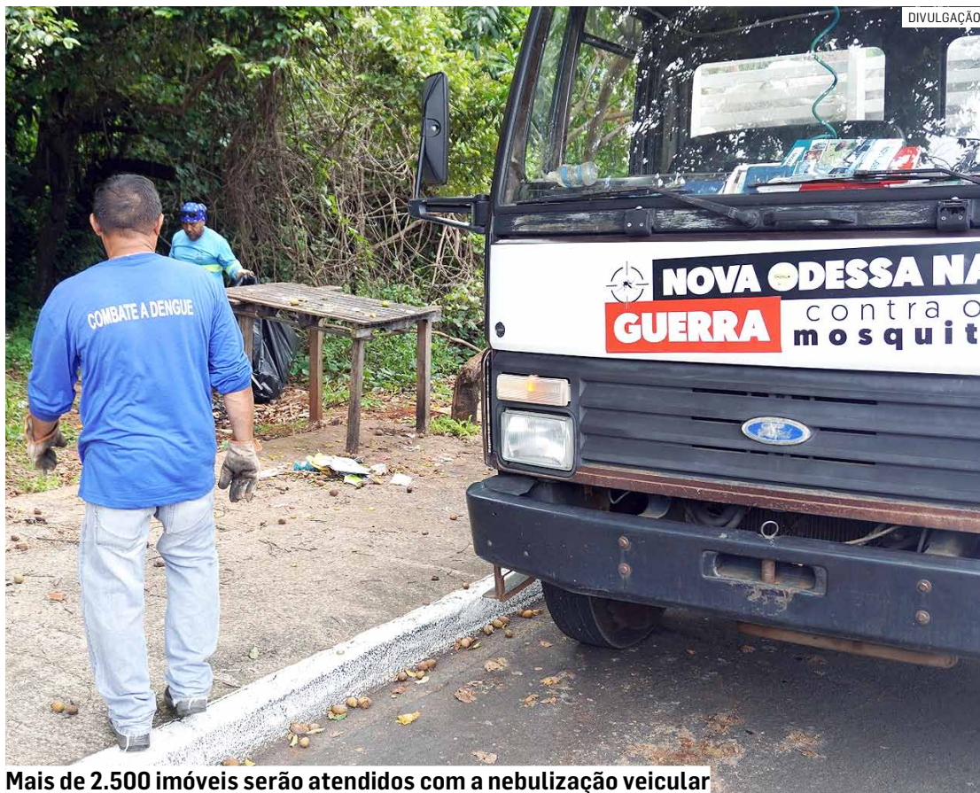
Mais de 2.500 imóveis serão atendidos com a nebulização veicular

O "fumacê" foi retomado no início do mês, em regiões onde há mais de um caso positivo na mesma vizinhança. Nesta segunda-feira (26), por exemplo, a