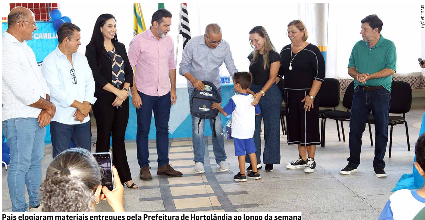
Pais elogiaram materiais entregues pela Prefeitura de Hortolândia ao longo da semana

“Sabe onde confeccionamos o nosso uniforme? É aqui bem pertinho de vocês, a algumas quadras, ali no Terras de Santo Antonio, onde temos uma fábrica. São 50 mulheres que trabalham o dia todo para confeccionar. Além disso, elas também se formam e