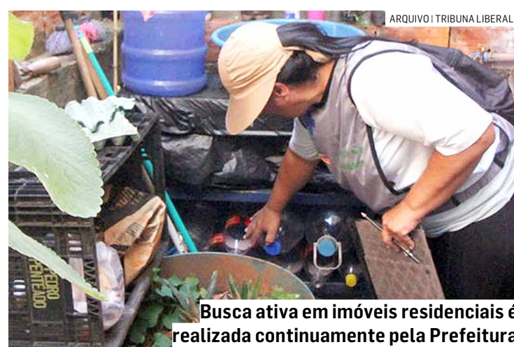
Busca ativa em imóveis residenciais é realizada continuamente pela Prefeitura

Os agentes usam nebulizadores fixados nas costas para espalhar o inseticida em forma de vapor. O trabalho dura entre 15 a 20 minutos. Enquanto a nebulização é realizada, o órgão solicita que os moradores fiquem fora de suas ca-