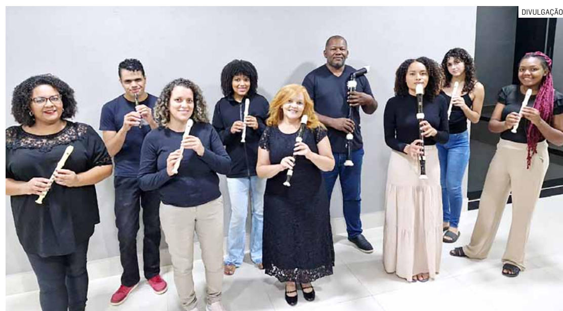
Grupo formado por 12 flautistas da cidade fará apresentações na feira livre do Jd. Amanda

Da Redação • HORTOLÂNDIA tribunaliberal@tribunaliberal.com.br