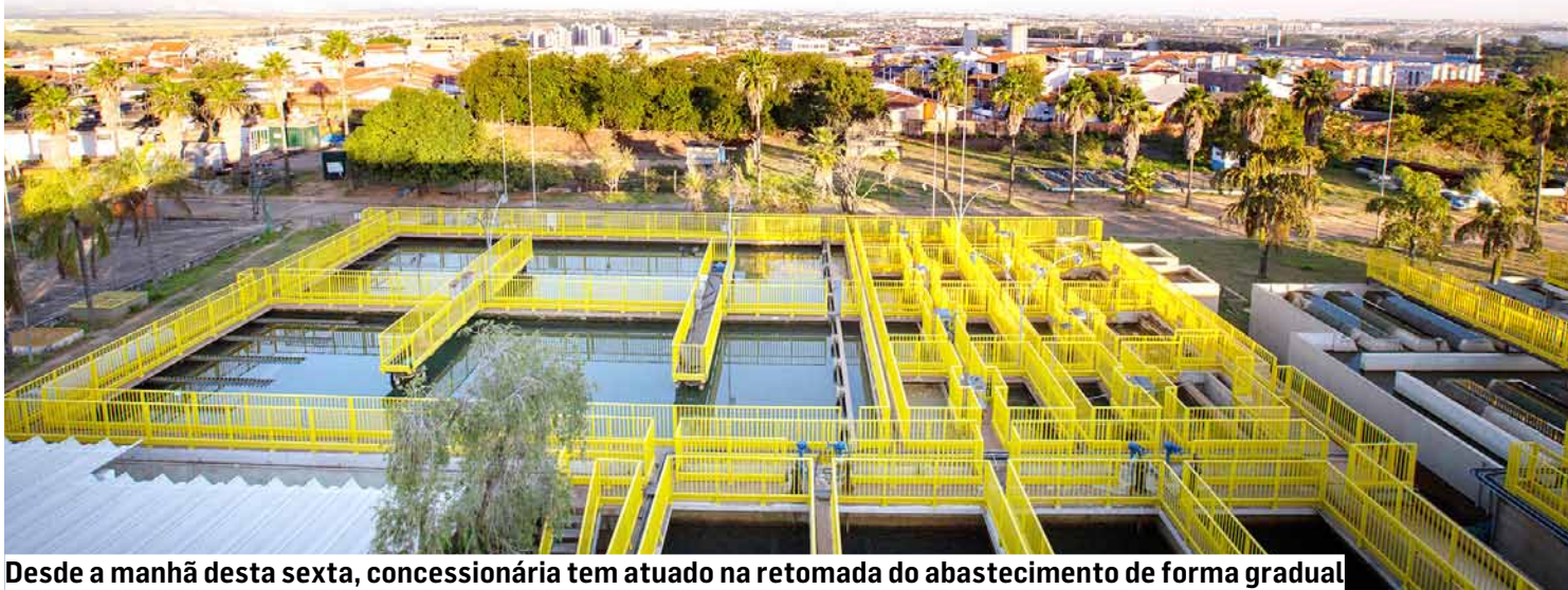
Desde a manhã desta sexta, concessionária tem atuado na retomada do abastecimento de forma gradual

Processo de tratamento de água ficou interrompido por seis horas, o que impactou os níveis dos reservatórios que abastecem as regiões de Nova Veneza, Matão e Área Cura