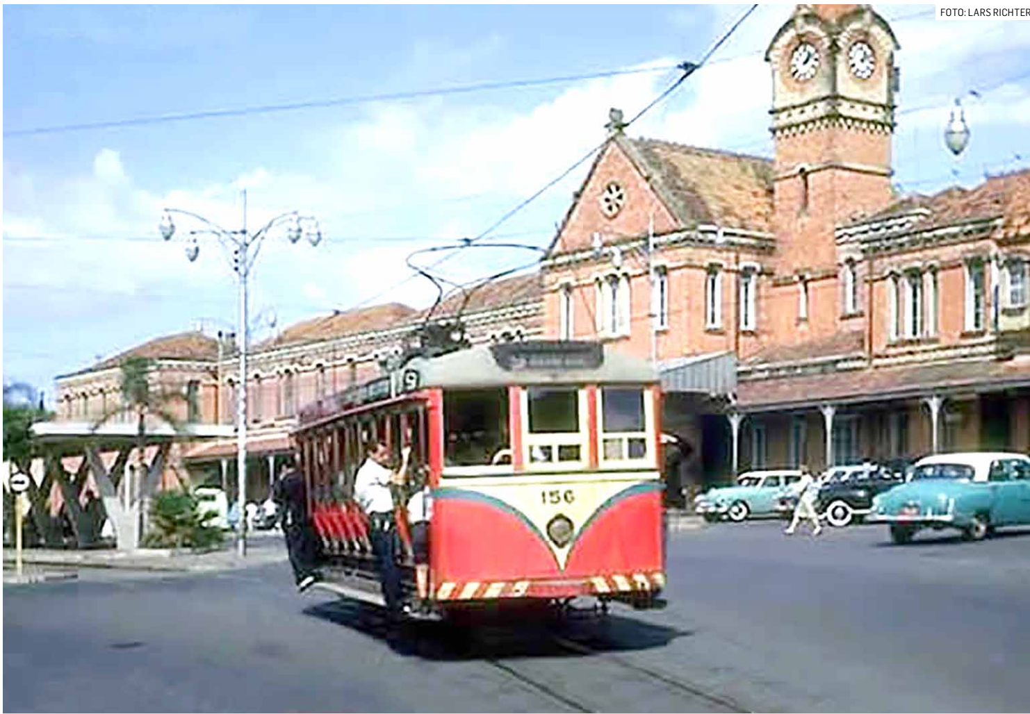
Bonde da CCTC de Campinas