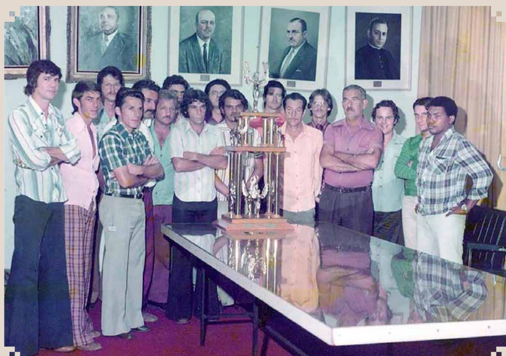
Foto dos funcionários do E.C. Prefeitura, que disputou várias modalidades esportivas no Torneio dos Trabalhadores de Sumaré nas competições de primeiro de maio de 1977. Por grupos, a equipe da Prefeitura sagrou-se campeã da competição, que reunia as principais empresas do município. As competições eram realizadas no feriado, nos dois clubes da cidade – Recreativo e União Cultural. No registro, os funcionários exibem o troféu conquistado no salão nobre da Prefeitura.