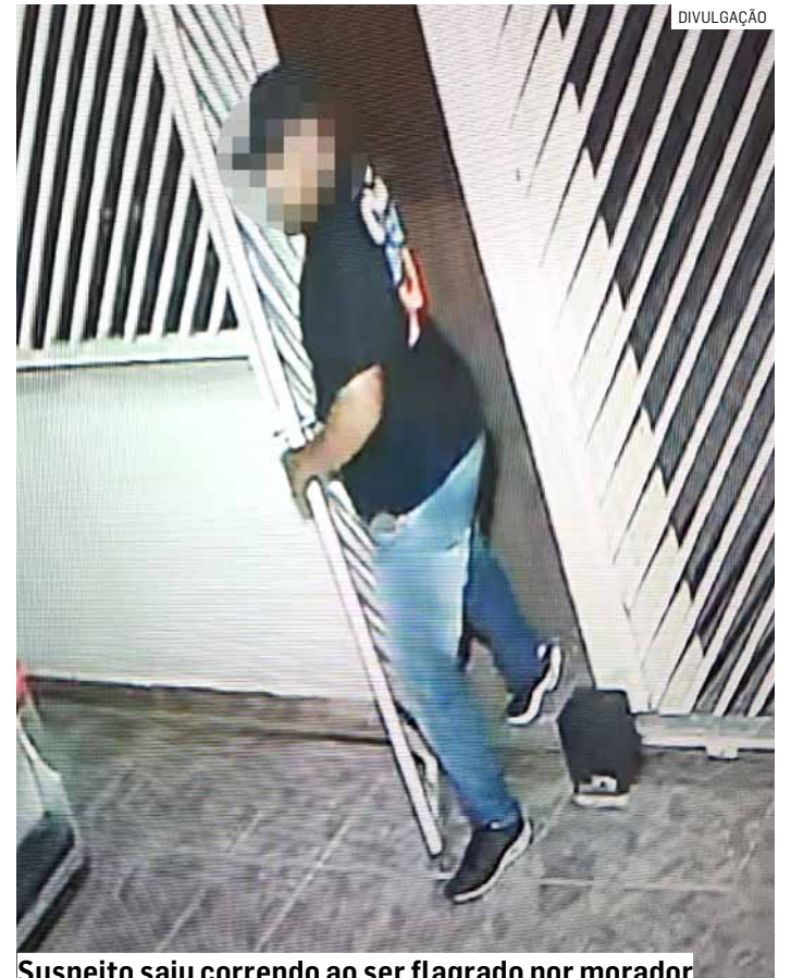
Suspeito saiu correndo ao ser flagrado por morador

Os moradores contam que os assaltantes chegam de carro e até de moto e aproveitam quando as ruas tranquilas estão mais cheias de manhã ou mais à noite. Os roubos acontecem próximos uns dos outros.