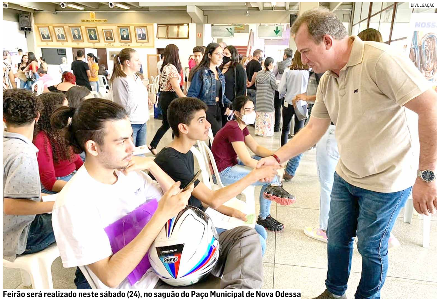
Feirão será realizado neste sábado (24), no saguão do Paço Municipal de Nova Odessa

O evento visa "reunir" num só local empregadores