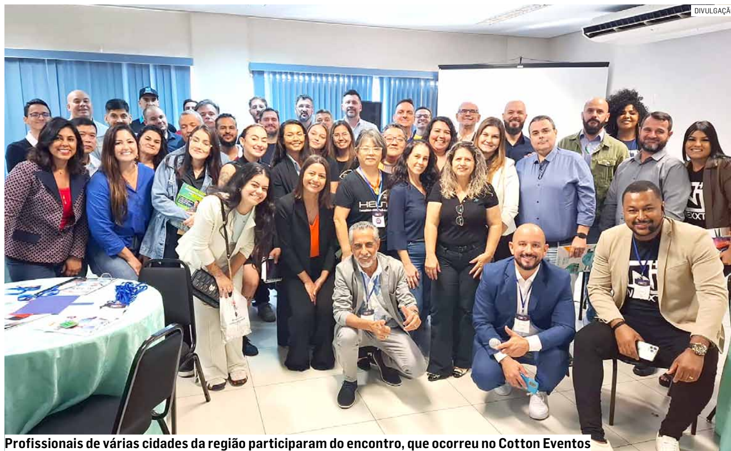
Profissionais de várias cidades da região participaram do encontro, que ocorreu no Cotton Eventos