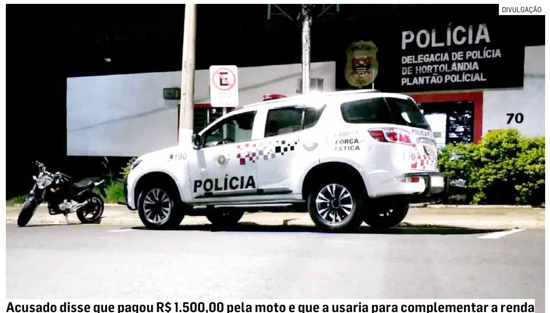
Acusado disse que pagou R$ 1.500,00 pela moto e que a usaria para complementar a renda

A ocorrência foi apresentada no Plantão Policial, onde foi registrado boletim de ocorrência por crime de adulteração de sinal identificador de veículo automotor. O homem foi preso e a moto apreendida.