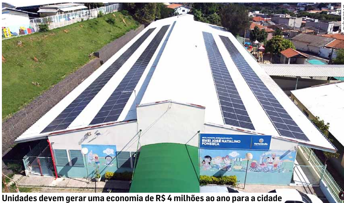
Unidades devem gerar uma economia de R$ 4 milhões ao ano para a cidade

As 21 usinas fotovoltaicas integram o Programa de Eficiência Energética da Prefeitura. O lançamento oficial do programa aconteceu com a presença do ministro das Minas e Energia, Alexandre Silveira, em dezembro do ano passado. O programa integra o novo PIC da Prefeitura. Na cerimônia de lançamento do programa, Silveira destacou que as ações implementadas por Hortolândia no setor energético são um