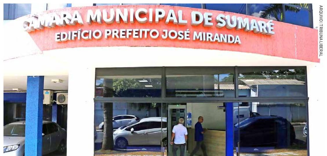
Evento acontece às 14h, no plenário do Legislativo, e será transmitido ao vivo pelo YouTube

tivo de conscientizar a população sobre o tema, envolver a comunidade, trazer visibilidade e buscar uma sociedade mais consciente, menos preconceituosa e mais inclusiva. De acordo com a Organização Mundial da Saúde, cerca de 70 milhões de pessoas são autistas no mundo.