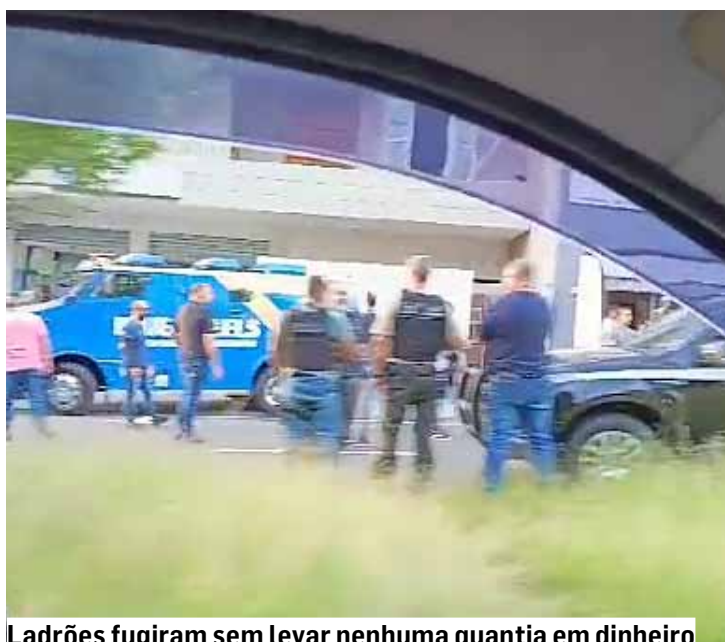
Ladrões fugiram sem levar nenhuma quantia em dinheiro

Quatro bandidos atacaram o veículo de transporte de valores pouco antes das 16h; crime ocorreu em frente à casa lotérica na av. Joaquim Marcelino Leite