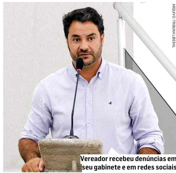
Vereador recebeu denúncias em seu gabinete e em redes sociais

Novamente a redação questionou a prefeitura – via assessoria de imprensa – sobre o apontamento do vereador e não houve retorno.