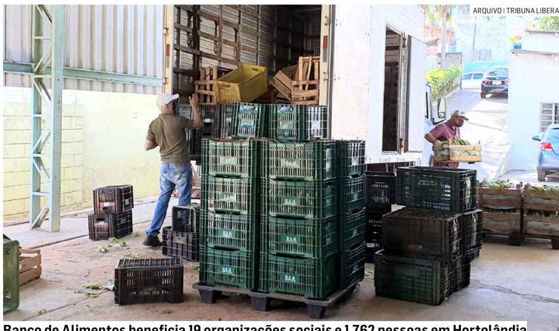
Banco de Alimentos beneficia 19 organizações sociais e 1.762 pessoas em Hortolândia

A Prefeitura de Hortolândia celebra, nesta quinta-feira (25/), a partir das 14h, o aniversário de 17 anos de criação do BAH (Banco de Alimentos de Hortolândia), órgão público municipal vinculado à Secretaria de Educação, Ciência e Tecnologia. O evento comemorativo, aberto ao público, acontecerá no OAPE (Observatório Ambiental Parque Escola), na Rua Bolívia, 290, no Jardim Santa Clara do Lago II.