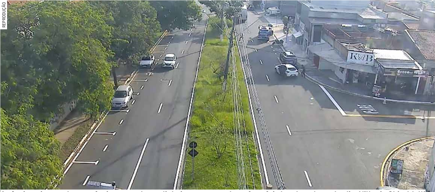
Após tiroteio, assaltantes fugiram sem levar dinheiro; carro usado na fuga foi abandonado no Jardim Villaggio Ghiralde

Quatro homens armados tentaram assaltar veículo que estava em frente à casa lotérica no Jardim Interlagos; câmeras registraram ação dos ladrões