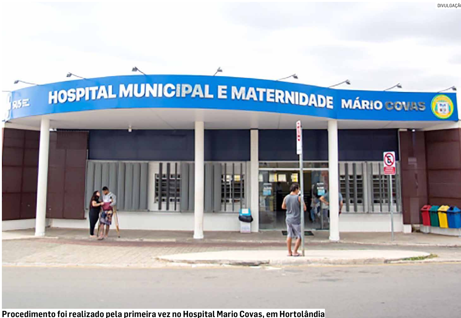
Procedimento foi realizado pela primeira vez no Hospital Mario Covas, em Hortolândia

De acordo com a coordenadora do setor Linha de Cuidado Materno Infan-