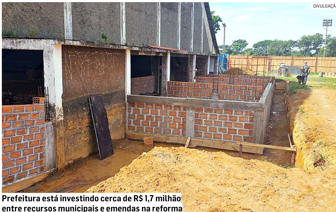
Prefeitura está investindo cerca de R$ 1,7 milhão entre recursos municipais e emendas na reforma

Com um investimento total superior a R$1,7 milhão, proveniente tanto de recursos municipais como de emendas do deputado estadual Dirceu Dalben (Cidadania), as melhorias planejadas para o ginásio incluem a instalação de um novo piso na quadra, modernização da iluminação para 100% LED, renovação da cobertura,