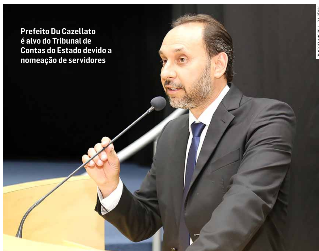
Prefeito Du Cazellato é alvo do Tribunal de Contas do Estado devido a nomeação de servidores

A Prefeitura de Paulínia encontra-se agora no centro de uma análise minuciosa, com as autoridades competentes sendo questionadas a prestar esclarecimentos so-