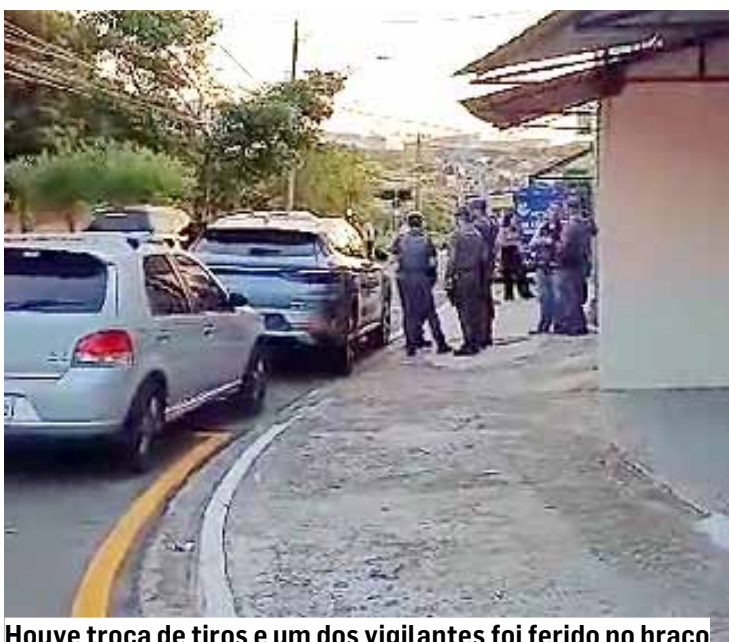
Houve troca de tiros e um dos vigilantes foi ferido no braço