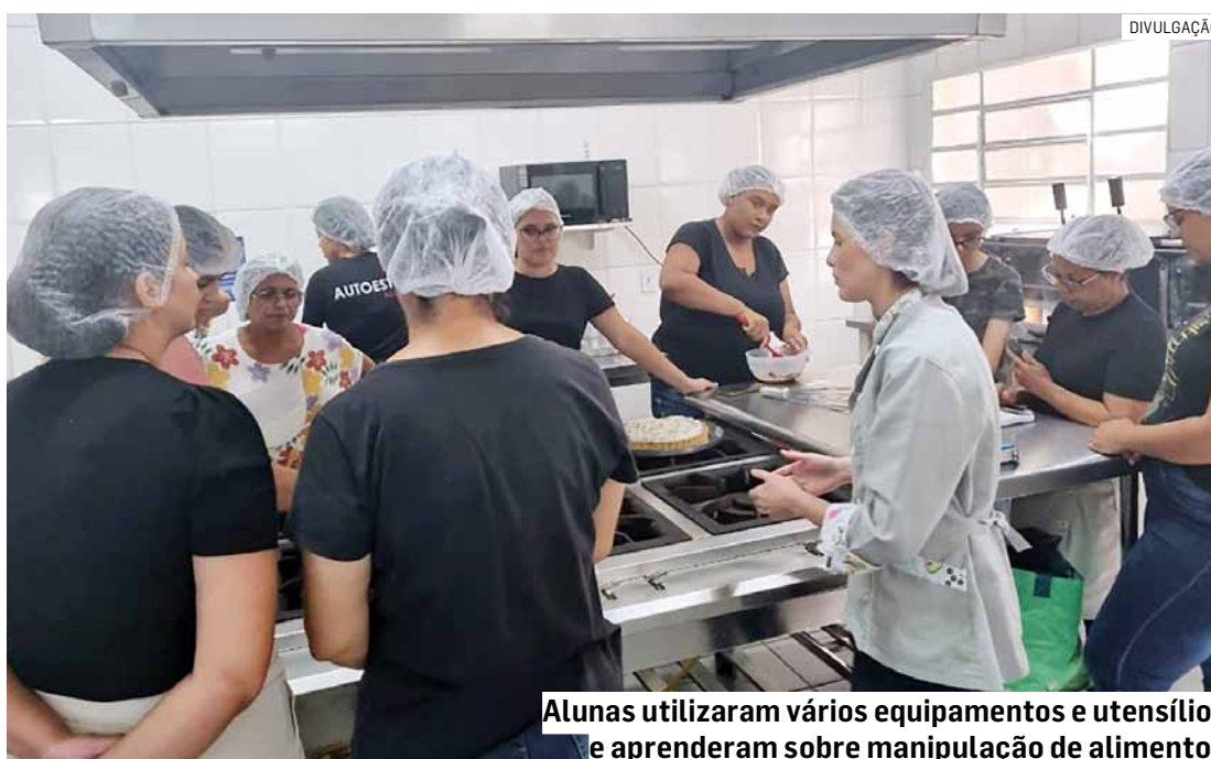
Alunas utilizaram vários equipamentos e utensílios e aprenderam sobre manipulação de alimentos

Dezesseis aprendizes participaram, nesta terça-feira (23), da última aula da oficina gratuita de “Sobremesas e Bolos de Pote”, promovida pela Prefeitura de Hortolândia. A ação aconteceu na Cozinha Escola Comunitária, órgão da Secretaria de Educação, Ciência e Tecnologia localizado no Jardim Novo Ângulo, e visa promover qualificação profissional e oportunidade de geração de renda aos participantes.