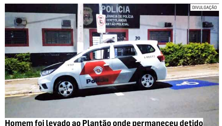
Homem foi levado ao Plantão onde permaneceu detido

Os militares receberam informação via Copom de violência doméstica no endereço do casal. A equipe conversou com a vítima, que relatou as agressões fi-