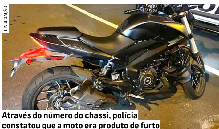
Através do número do chassi, polícia constatou que a moto era produto de furto

Durante patrulhamento de Força Tática, os militares flagraram a motocicleta sem a placa transitando pelo Jardim Maria Antônia. Foi dada ordem de parada com sinais sonoros e luminosos, que foi ignorada pelo condutor. Houve acompanhamento por diversos policiais do bairro e, o