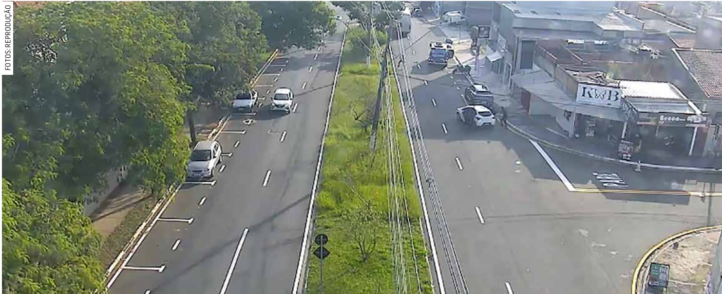
Câmeras da Central de Monitoramento flagram o momento em que os assaltantes fogem do local em um Chevrolet Ônix