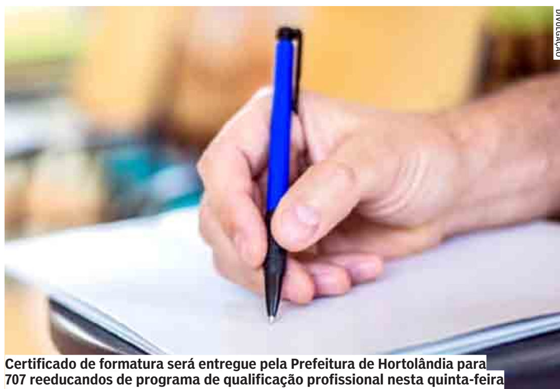
Certificado de formatura será entregue pela Prefeitura de Hortolândia para 707 reeducandos de programa de qualificação profissional nesta quinta-feira

O programa começou em março deste ano com 53 turmas, que ti-