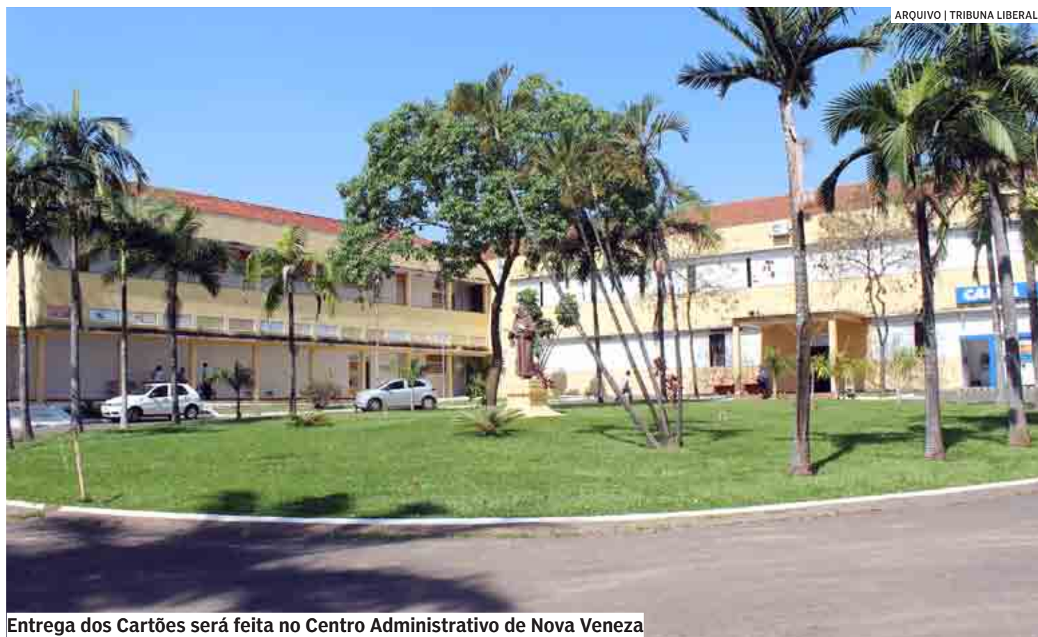
Entrega dos Cartões será feita no Centro Administrativo de Nova Veneza

Cada cartão dá direito ao beneficiário receber três parcelas no valor de R$ 110 cada uma, a fim