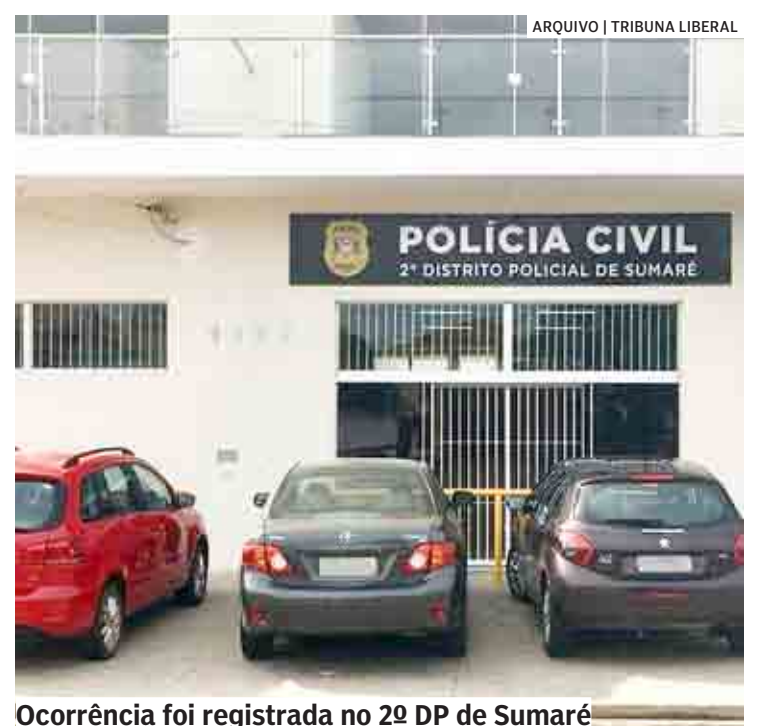
Ocorrência foi registrada no 2º DP de Sumaré

A ocorrência foi apresentada no 2º Distrito Policial de Sumaré ao delegado que confirmou o flagrante por furto qualificado. Depois, o indiciado foi conduzido até a Cadeia Pública de Sumaré, no aguardo da audiência de custódia.