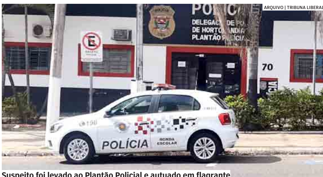
Suspeito foi levado ao Plantão Policial e autuado em flagrante

Ao chegarem ao local, os policiais viram um