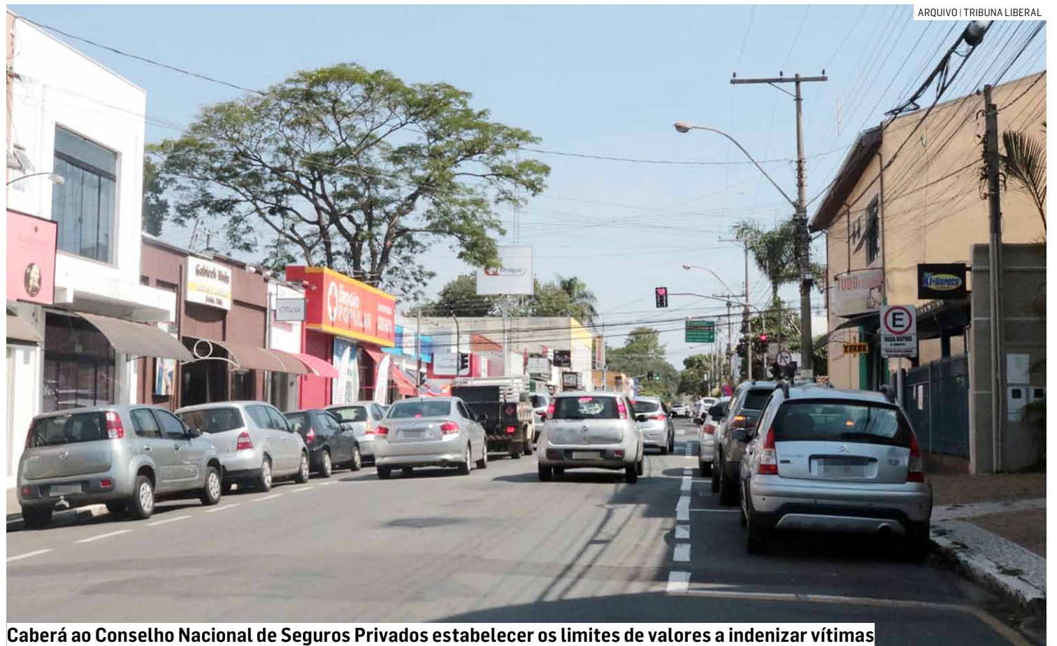
Caberá ao Conselho Nacional de Seguros Privados estabelecer os limites de valores a indenizar vítimas

No exercício da relatoria do projeto, o deputado Rubens Pereira Júnior (PT-MA) acatou mudança na lei do arcabouço fiscal para antecipar do segundo bimestre para o primeiro bimestre de 2024 a possibilidade de o Executivo abrir crédito suplementar permitido na lei em razão de crescimento adicional da receita deste ano, em relação ao mesmo período de 2023.