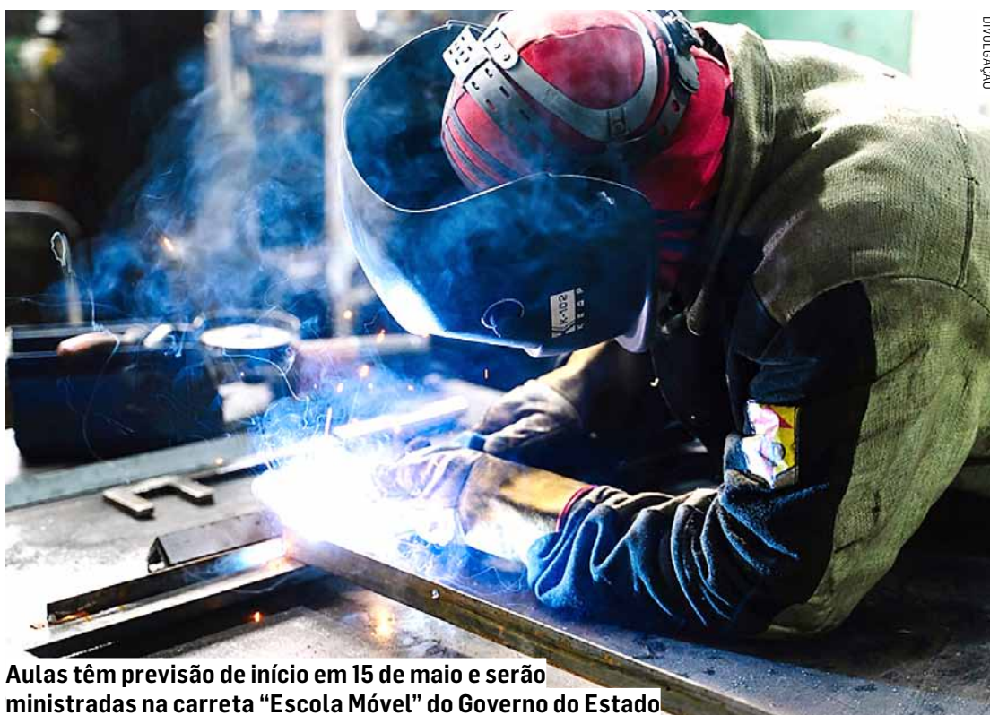
Aulas têm previsão de início em 15 de maio e serão ministradas na carreta "Escola Móvel" do Governo do Estado

Para se inscrever no curso, os candidatos devem ser alfabetizados, ter no mínimo 16 anos de idade e ter disponibilidade para assistir às aulas presencialmente em Hortolândia. No total, serão ofertadas 60 vagas, que serão divididas nas turmas da manhã (8h às 12h), da tarde (13h às 17h) e da noite (18h às 22h). As aulas têm previsão de início em 15 de maio e serão ministradas na carreta "Escola Móvel" da Secretaria de Desenvolvimento Econômico do Governo do Estado, que ficará estacionada na Rua Gra-