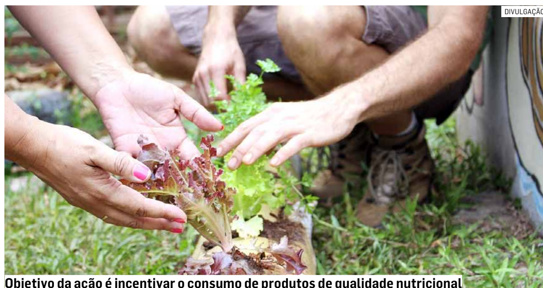
Objetivo da ação é incentivar o consumo de produtos de qualidade nutricional

Ao todo, foram realizados quatro encontros nas instalações do Instituto Saber Social, que fica no Parque Residencial Regina, na região do Nova Veneza, e possui um espaço para o cultivo de hortaliças, e é onde foram realizadas as atividades prá-