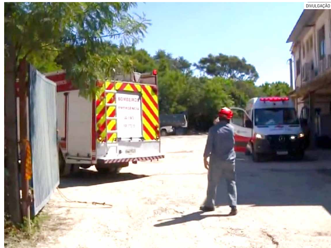
Jovem de 19 anos morreu prensado quando fazia limpeza do concreto no caminhão