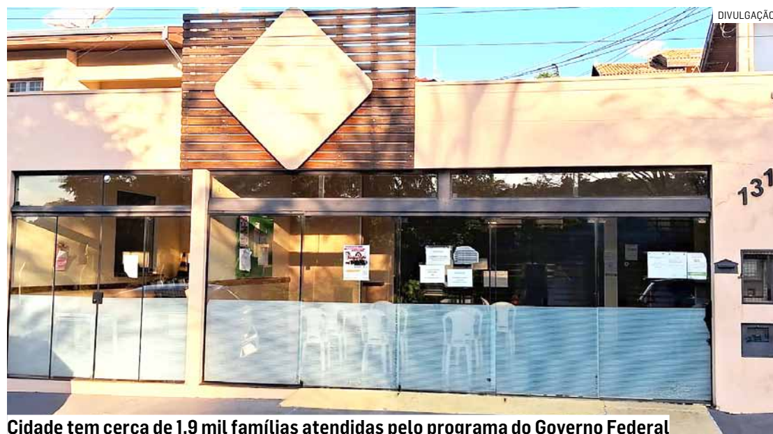
Cidade tem cerca de 1,9 mil famílias atendidas pelo programa do Governo Federal

Com o cartão em mãos, as famílias devem procurar a UBS de referência do bairro duas vezes por ano para fazer o acompanhamento, sem necessidade de agendamento prévio. O monitoramento ocorre a cada seis meses e faz parte das condicionalidades do Programa – caso não seja realizado, o benefício po-