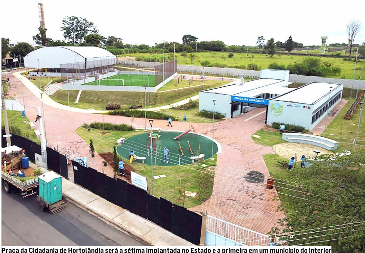
Praça da Cidadania de Hortolândia será a sétima implantada no Estado e a primeira em um município do interior