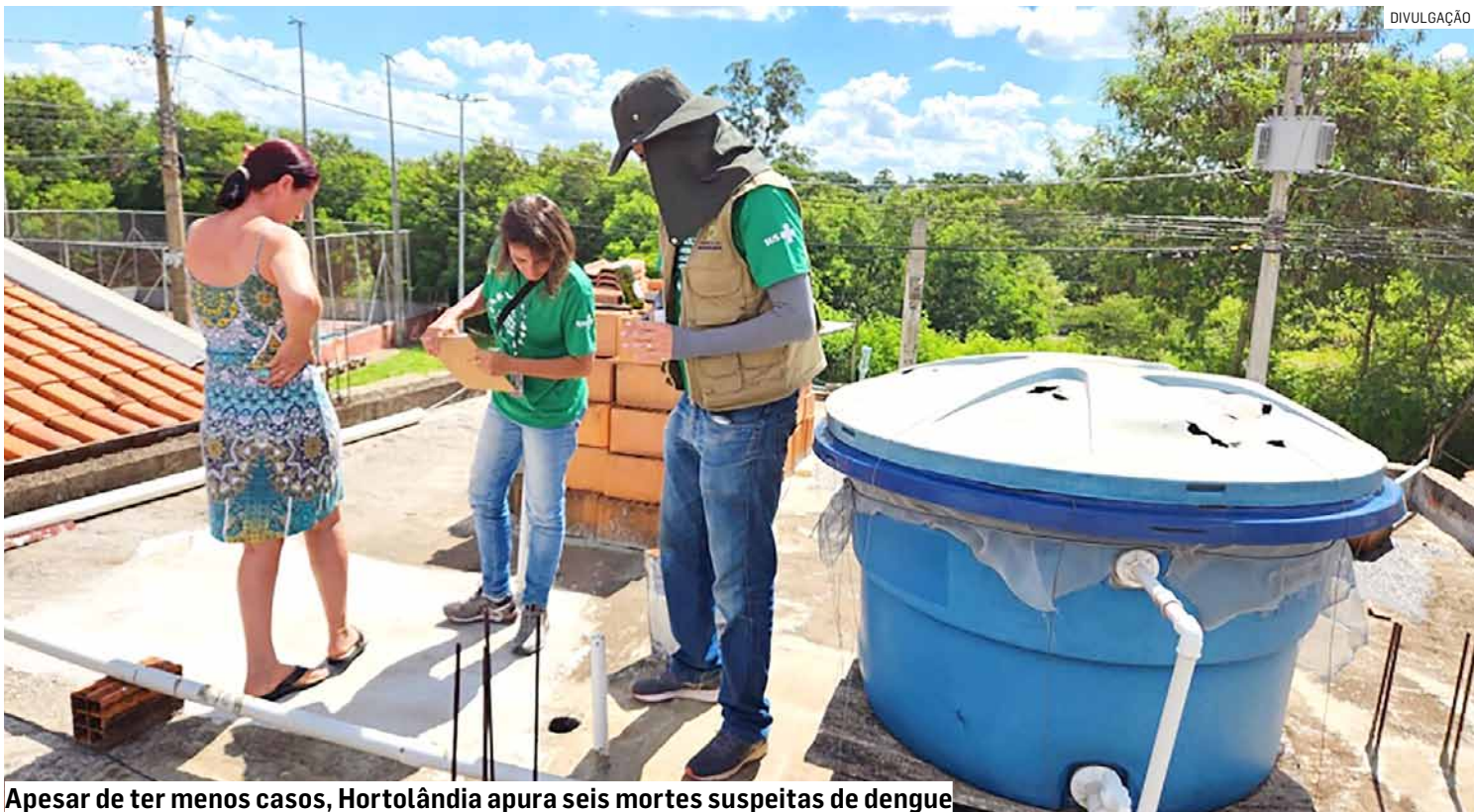
Apesar de ter menos casos, Hortolândia apura seis mortes suspeitas de dengue

Os números destacam a urgência das medidas de controle e prevenção da dengue, que é uma doença viral transmitida pela picada de mosquitos infectados do gênero Aedes, e uma ameaça séria à saúde pública, especialmente em áreas tropicais e subtropicais. A Secretaria de Saúde de Sumaré informou que aguarda os resultados dos óbitos e as orientações à população para manter secas as áreas que possam acumular água, manter caixa d'água tampada, ficar atento aos quintais. A pasta destacou que a sociedade deve ser parceira no momento difícil da dengue. A Saúde ainda reforçou que a população precisa deixar agentes de endemias entrar nas casas para vistoriar e orientar os moradores, além de se atentar aos sintomas da doença e procurar uma unidade de saúde, se for necessário.