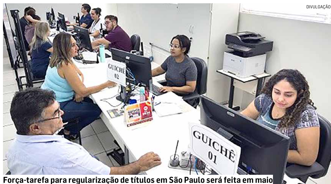
Força-tarefa para regularização de títulos em São Paulo será feita em maio

Nesta reta final de fechamento do cadastro, somente quem tem a biometria coletada pela Justiça Eleitoral pode solicitar os serviços de forma on-line, por meio da página de autoatendimento do TRE-SP.