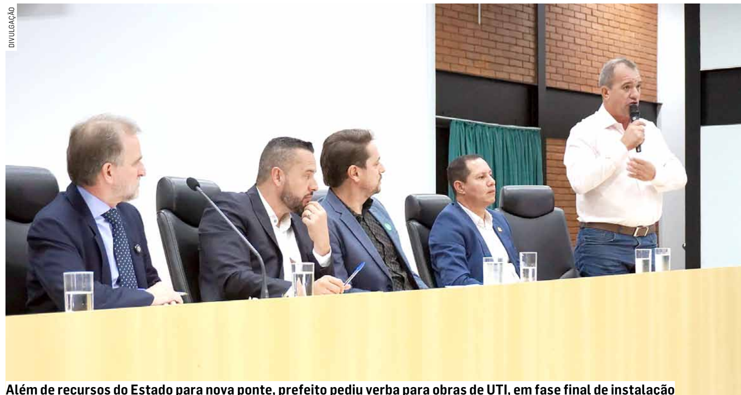
Além de recursos do Estado para nova ponte, prefeito pediu verba para obras de UTI, em fase final de instalação

Da Redação • NOVA ODESSA tribunaliberal@tribunaliberal.com.br