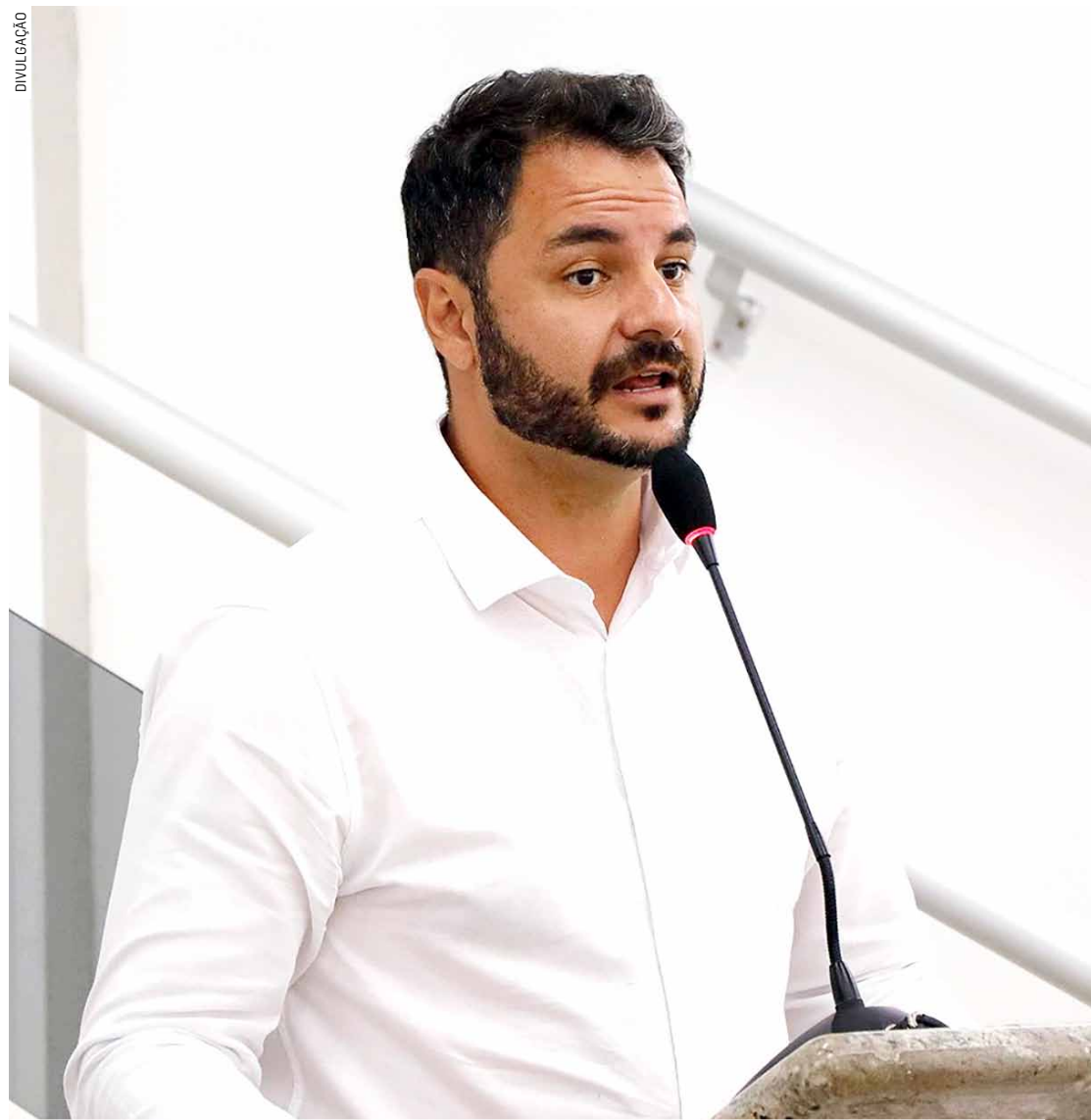
Parlamentar reclama de dificuldade de diálogo com representantes do Poder Executivo

Segundo parlamentar, questionamentos serão feitos à administração municipal via requerimentos e, conforme as respostas, caso será levado ao Ministério Público