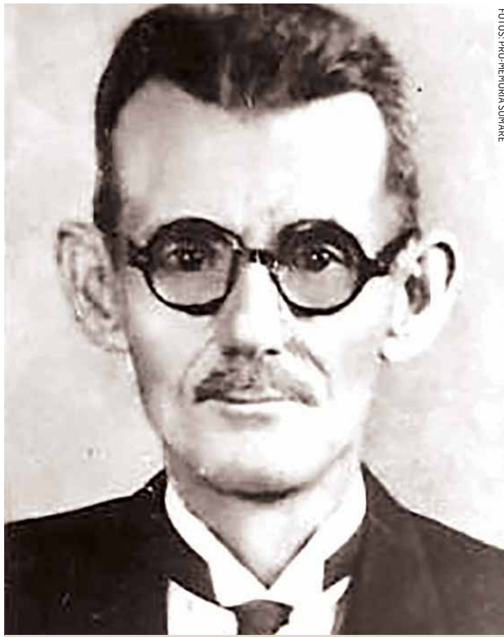
João Francisco Ramos

Na época os governantes dos Estados recebiam o título de Presidente. Manoel governou São Paulo de 1908 a 1912. No seu governo deu-se a construção da Estrada de Ferro Noroeste do Brasil, com o aparecimento de muitas cidades. Lins foi uma delas, em homenagem a ele.