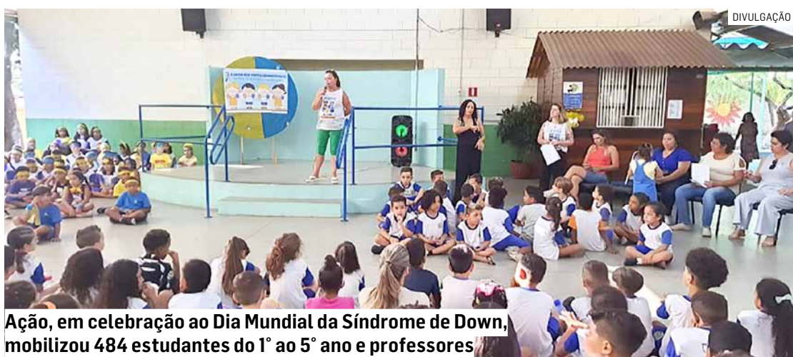
Ação, em celebração ao Dia Mundial da Síndrome de Down, mobilizou 484 estudantes do 1º ao 5º ano e professores

Da Redação • HORTOLÂNDIA tribunaliberal@tribunaliberal.com.br