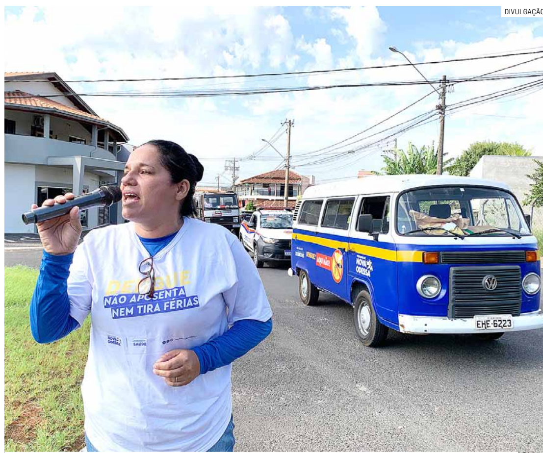
Ações da Prefeitura de Nova Odessa terão apoio de voluntários e instituições parceiras

As mostras deste sábado vão acontecer nas EMEBs (Escolas Municipais de Educação Básica) Professora Alvina Maria Adamson (do Jardim São Jorge), Professora Salime Abdo (Jardim Alvorada), Professora Theresinha Antônia Malagueta Merenda (Jardim Bela Vista), Dante Gazzetta (Centro), Professora Augustina Adamson Paiva (Jardim São Francisco), Professora Alzira Ferreira Delegá (Green Village), Professora Almerinda Delegá Delben (Parque Klavin) e Prefeito Simão Welsh (do Jardim Santa Rita 2).