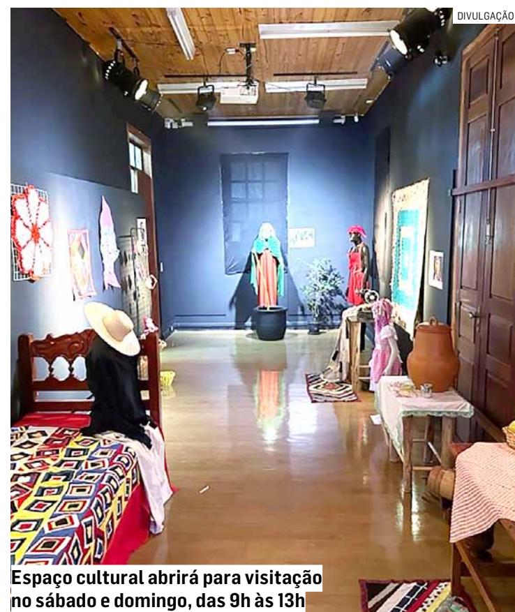
Espaço cultural abrigará para visitação no sábado e domingo, das 9h às 13h

na cercada com grade para tirar fotos ou fazer vídeos da passagem do trem. O museu ainda oferece atrativos tecnológicos. Um deles é a câmera de monitoramento de trens que passam na via férrea. A câmera, do modelo 360°, funciona 24 horas. As imagens da câmera são exibidas em tempo real no canal no YouTube do grupo Railcam Brasil. O equipamento foi inaugurado em maio de 2022. Para que os visitantes possam fazer fotos, selfies e vídeos, o centro conta com Wi-Fi, disponibilizado pelo grupo Railcam Brasil.