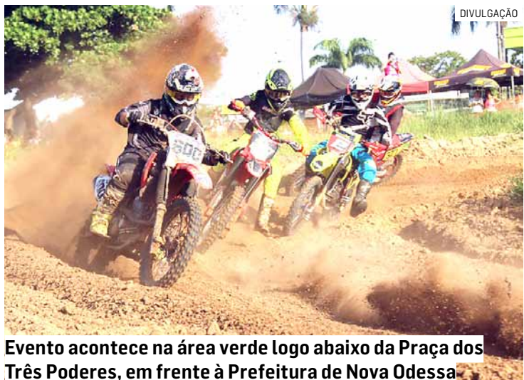
Evento acontece na área verde logo abaixo da Praça dos Três Poderes, em frente à Prefeitura de Nova Odessa

Da Redação • NOVA ODESSA tribunaliberal@tribunaliberal.com.br