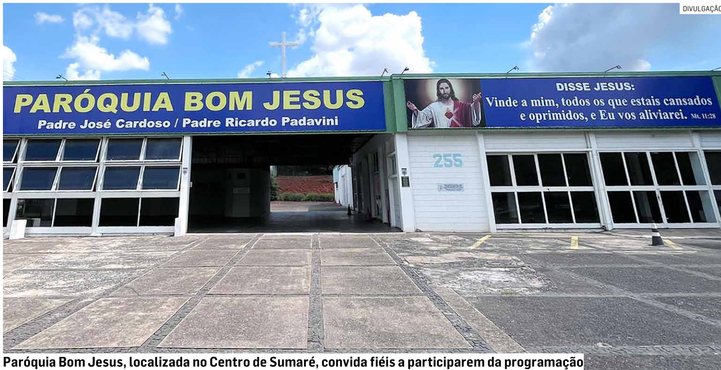
Paróquia Bom Jesus, localizada no Centro de Sumaré, convida fiéis a participarem da programação

A Semana Santa se inicia no próximo domingo, dia 24 de março, com a celebração do Domingo de Ramos, um momento emblemático que marca a entrada triunfal de Jesus em Jerusalém. As missas do Domingo de Ramos estão programadas para às 7h e às 9h30 da manhã. Durante essas celebrações, os fiéis levarão ramos aromáticos para serem abençoados. Os ramos abençoados são le-