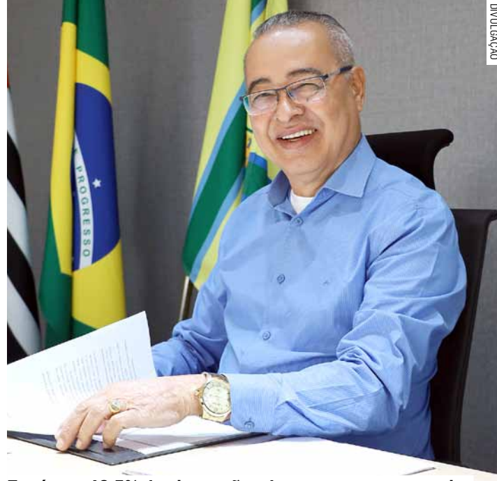
Zezé tem 42,5% das intenções de voto, aponta pesquisa

O cenário político para as eleições municipais de 2024 em Hortolândia está cada vez mais claro, conforme os resultados da pesquisa de intenção de voto realizada pelo Instituto Vox Brasil Opinião e Pesquisas, encomendada pela VTV/SBT, sob registro no Tribunal Superior Eleitoral nº 05861/2024. O atual prefeito, Zezé Gomes, desponta como líder nas preferências dos eleitores, com 42,5% das intenções de voto. Foram ouvidos 518 eleitores entre 14 e 15 de março.