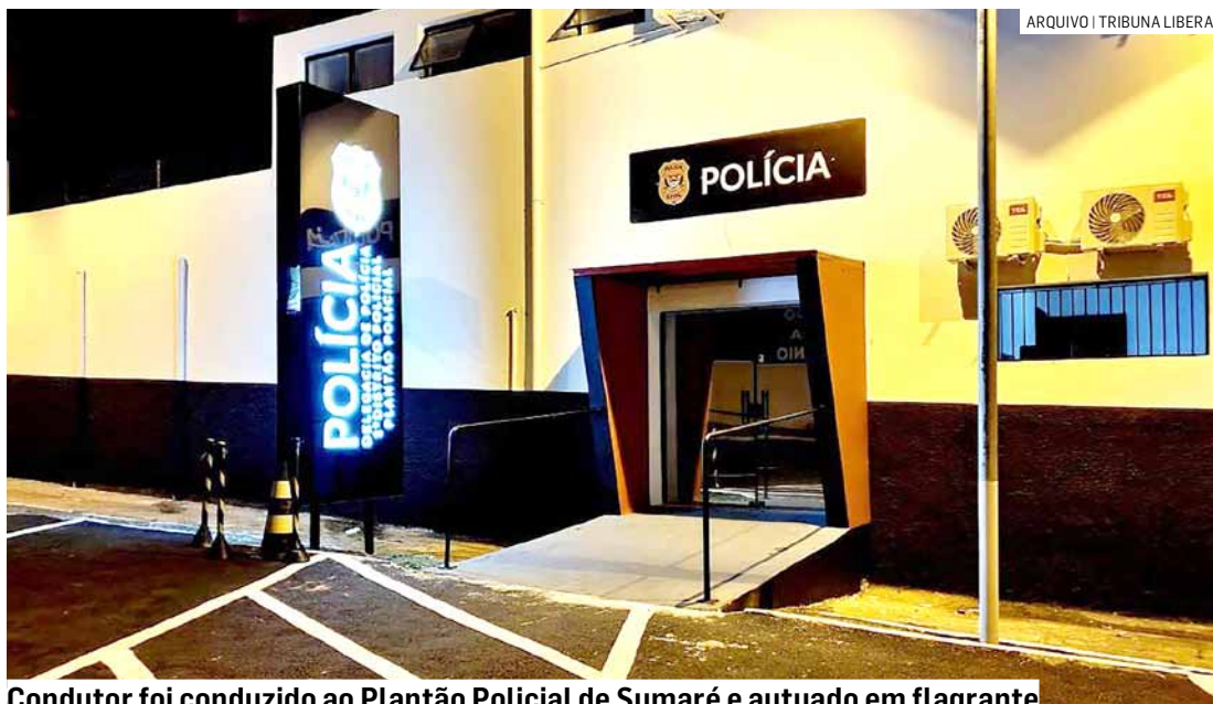
Condutor foi conduzido ao Plantão Policial de Sumaré e autuado em flagrante

Ao constatar a suspeita de embriaguez ao volante foi realizada abordagem onde o condutor desceu do veícu-