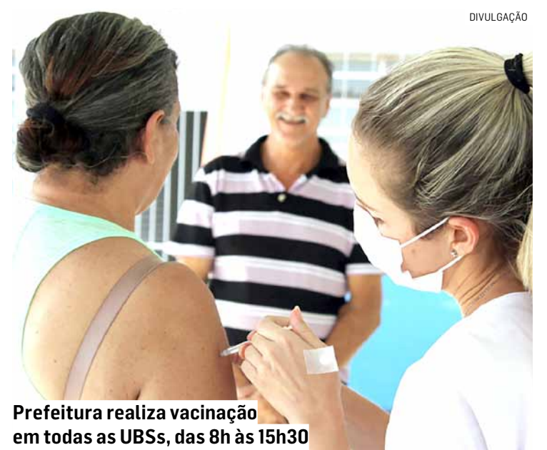
Prefeitura realiza vacinação em todas as UBSS, das 8h às 15h30

Também estão incluídos na lista dos públicos prioritários da campanha deste ano pessoas com comorbidade a partir de seis anos; pessoas com doença crônica; pessoas com deficiência permanente; forças de segurança e salvamento; forças armadas; trabalhadores do transporte coletivo; trabalhadores portuários; caminhoneiros; população privada de liberdade; e população em situação de rua. Neste ano, o Dia D da campanha será em 13/04. A campanha será realizada até 31/05.