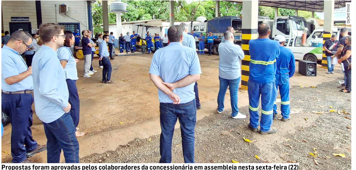
Propostas foram aprovadas pelos colaboradores da concessionária em assembleia nesta sexta-feira (22)

Já o reajuste do Tíquete Alimentação - para quem trabalha em horário de jantar e aos finais de semana - ficou em 14,19%, saindo de R$ 22,77 para R$ 26,00; o Sobreaviso aumentou 5%, o mesmo percentual do