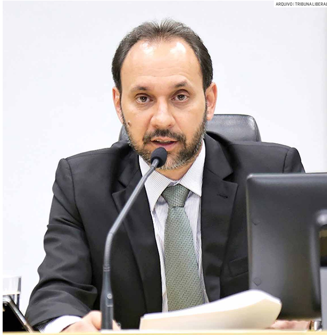
Prefeito de Paulínia contrata empresas para eventos após experiência negativa no Natal

Além disso, a Justiça ordenou a interdição de áreas específicas destinadas ao evento de Natal. O judiciário esclareceu que a decisão foi tomada visando resgar-