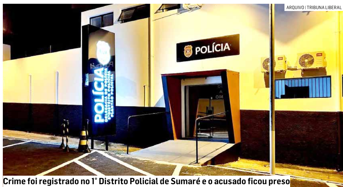
Crime foi registrado no 1º Distrito Policial de Sumaré e o acusado ficou preso

Cézar Oliveira • SUMARÉ tribunaliberal@tribunaliberal.com.br