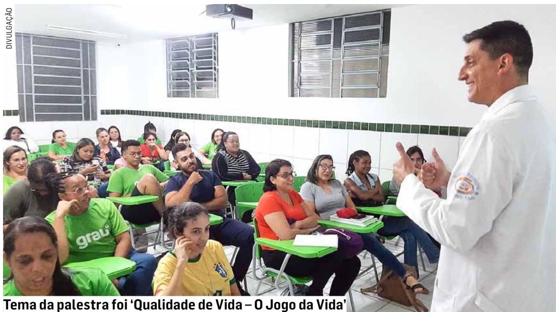
Tema da palestra foi 'Qualidade de Vida - O Jogo da Vida'

Conciliar qualidade de vida e trabalho nem sempre é fácil. Para muitos profissionais de saúde, especialmente os que atuam na linha de frente, o desafio é ainda maior. Eles cuidam de pessoas, mas muitas vezes enfrentam rotinas exaustivas que comprometem seu próprio equilíbrio pessoal. Para virar esse jogo, o Grau Técnico Sumaré promove nesta semana uma série de palestras so-