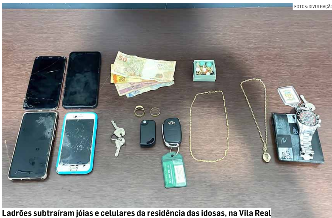
Ladrões subtraíram joias e celulares da residência das idosas, na Vila Real

Cézar Oliveira • HORTOLÂNDIA tribunaliberal@tribunaliberal.com.br