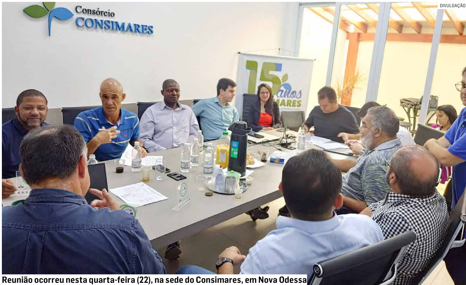
Reunião ocorreu nesta quarta-feira (22), na sede do Consimares, em Nova Odessa

No parecer, o grupo fiscalizador também se posicionou favorável à proposta de contrato de rateio e orçamentária para o exercício de 2024. O valor do contrato de rateio é definido de