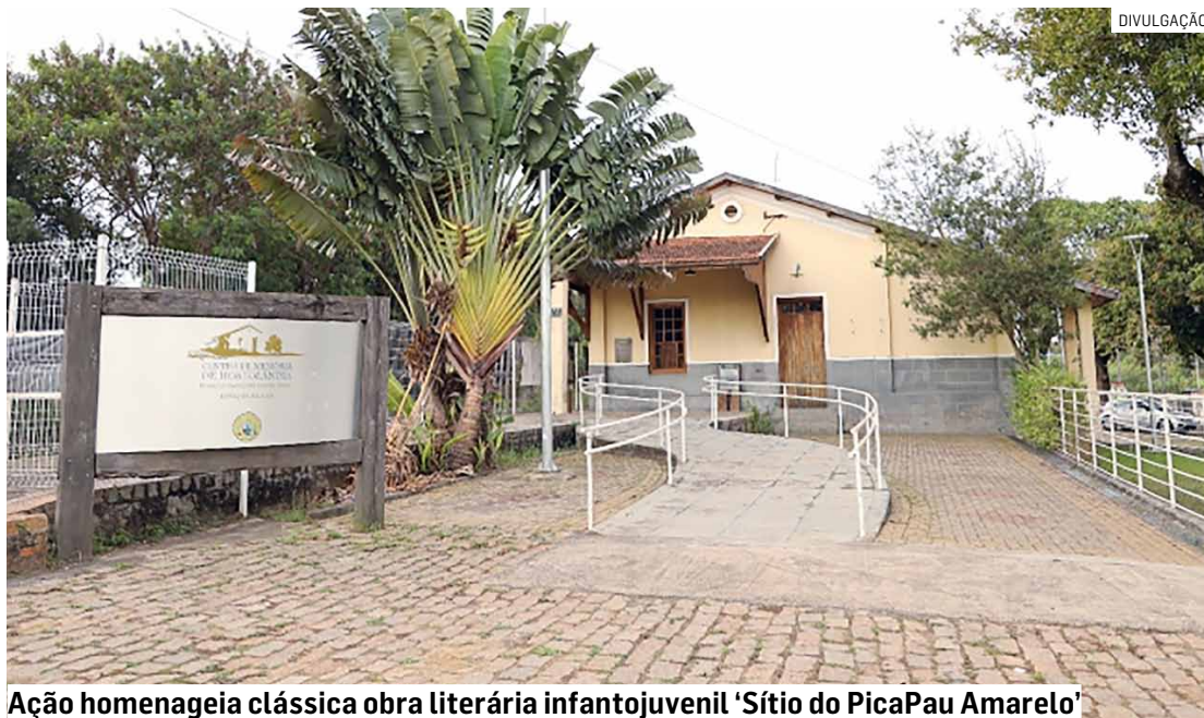
Ação homenageia clássica obra literária infantojuvenil 'Sítio do Picapau Amarelo'

A exposição fica em cartaz até o dia 23 de março e pode ser visitada de segunda a sexta-feira, das 9h às 17h, e no último fim de semana do mês. No museu, o público também pode co-