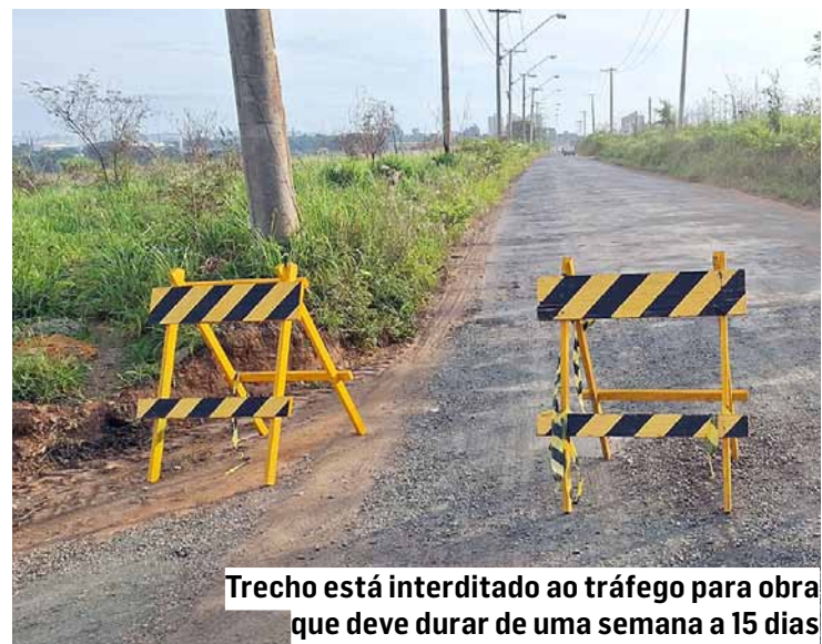
Trecho está interditado ao tráfego para obra que deve durar de uma semana a 15 dias

Começou a instalação de uma nova rede de galerias de águas pluviais (da chuva) no início do trecho não pavimentado da avenida Brasil, em Nova Odessa. A obra utiliza tubos de concreto armado de grande diâmetro (1.200 milímetros) e deve durar cerca de uma semana a 15 dias. Por isso, o trecho em questão está interditado para o tráfego. Enquanto durarem as obras, a rota alternativa para os motoristas que passam pelo local se