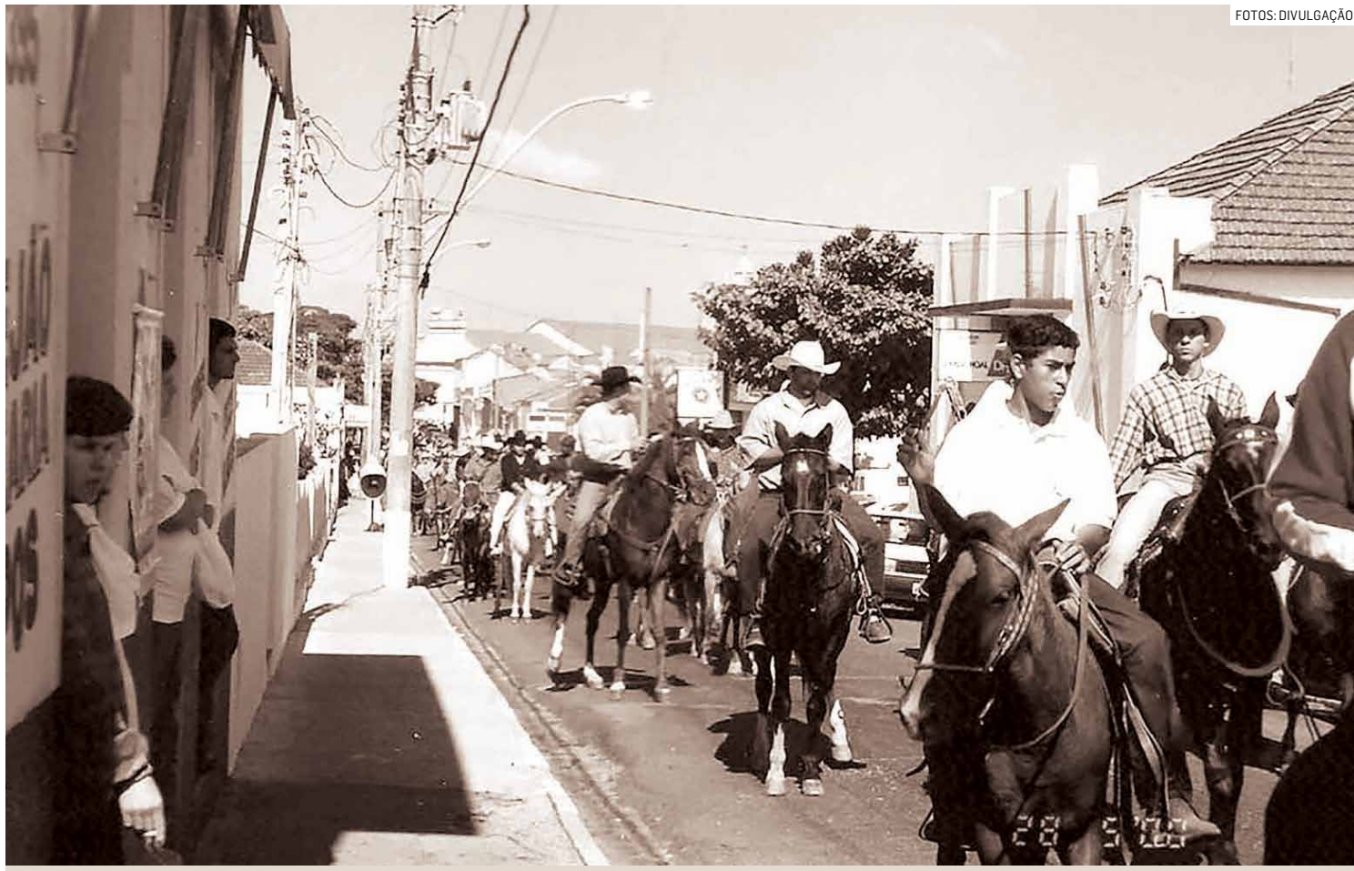
Romeiros de Monte Mor