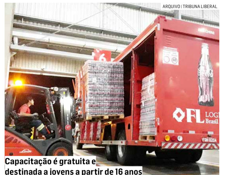
Capacitação é gratuita e destinada a jovens a partir de 16 anos

A iniciativa Coletivo Online faz parte da Plataforma Coletivo Jovem, que tem como foco a empregabilidade de jovens a partir de 16 anos, em situação de vulnerabilidade social. É considerado o maior programa de empregabilidade de jovens no Brasil. Desde o início de sua implementação, em 2009, a Plataforma já impactou mais de 349 mil jovens em comunidades brasileiras.