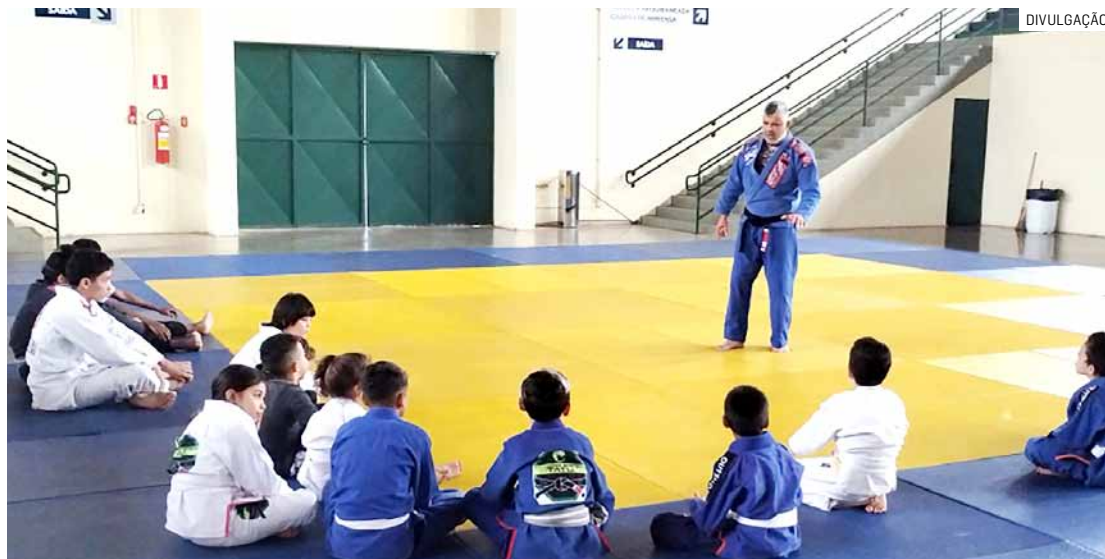
São 24 modalidades gratuitas em espaços localizados em diferentes regiões de Hortolândia

Ainda segundo a Secretaria de Esportes e Lazer, algumas modalidades, como ginástica artística e natação, são mais concorri-