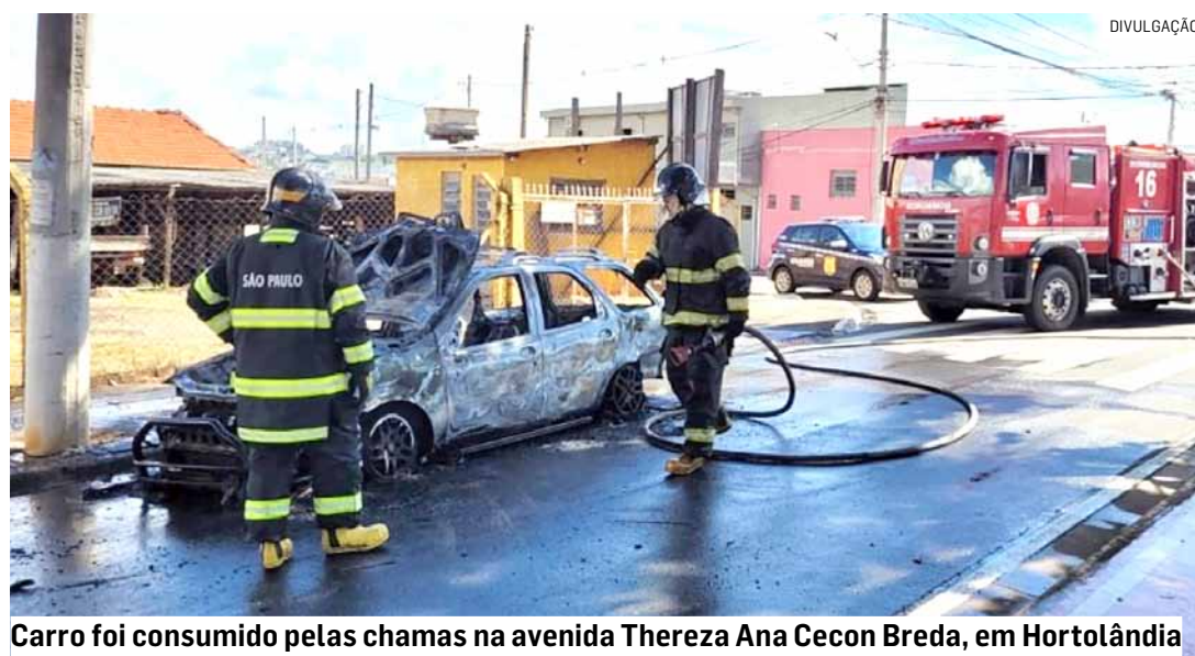
Carro foi consumido pelas chamas na avenida Thereza Ana Cecon Breda, em Hortolândia

Cézar Oliveira • HORTOLÂNDIA tribunaliberal@tribunaliberal.com.br