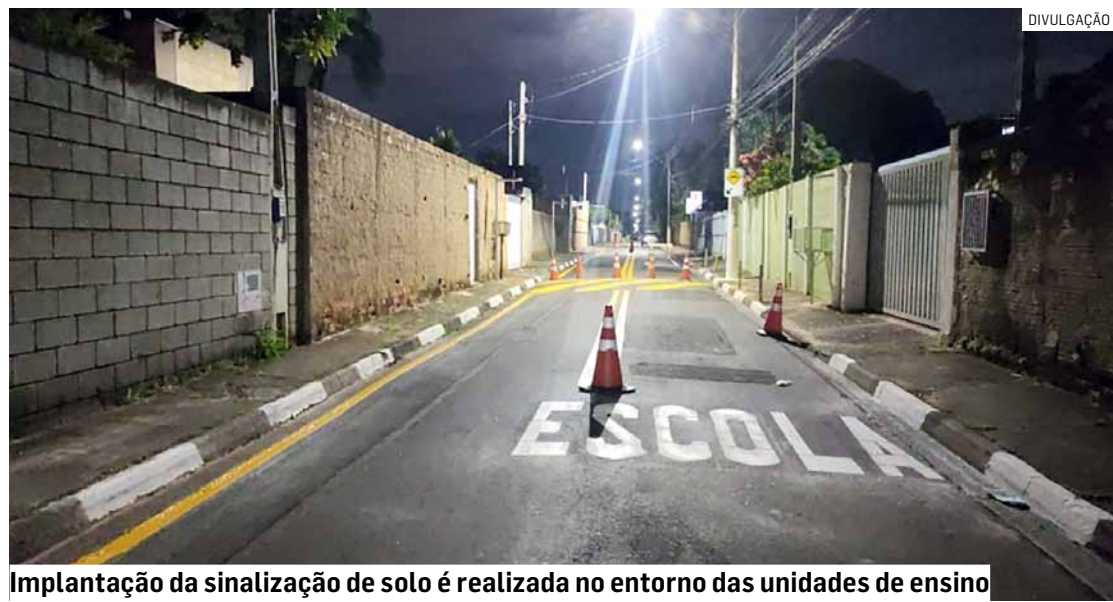
Implantação da sinalização de solo é realizada no entorno das unidades de ensino

Da Redação • HORTOLÂNDIA tribunaliberal@tribunaliberal.com.br