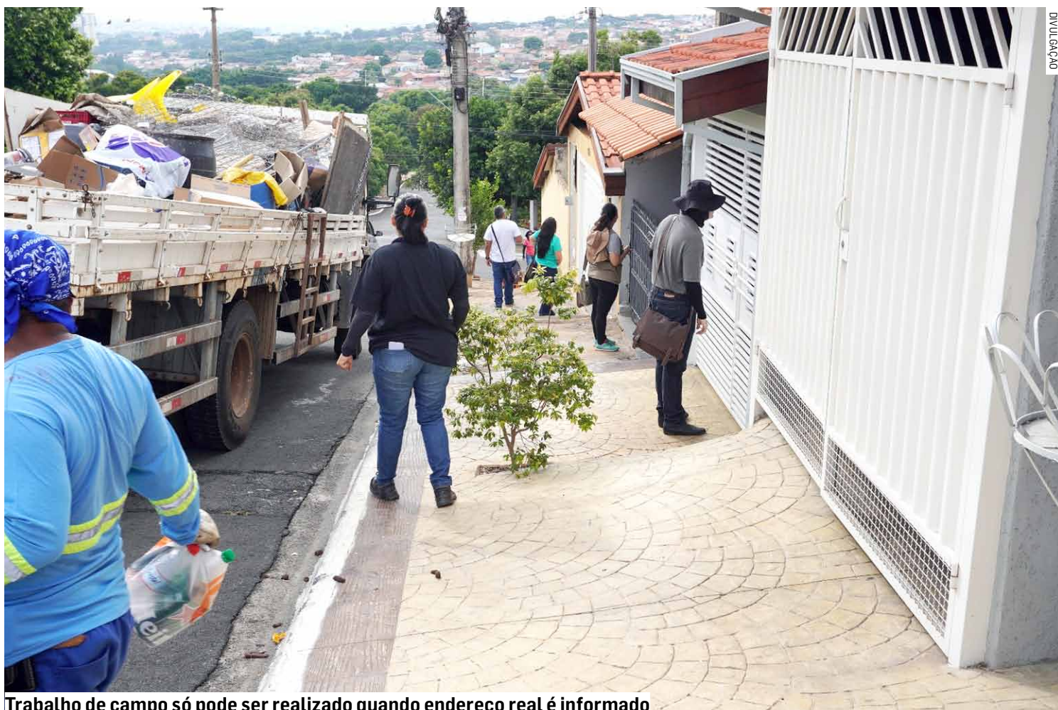
Trabalho de campo só pode ser realizado quando endereço real é informado