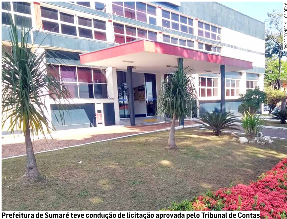
Prefeitura de Sumaré teve condução de licitação aprovada pelo Tribunal de Contas