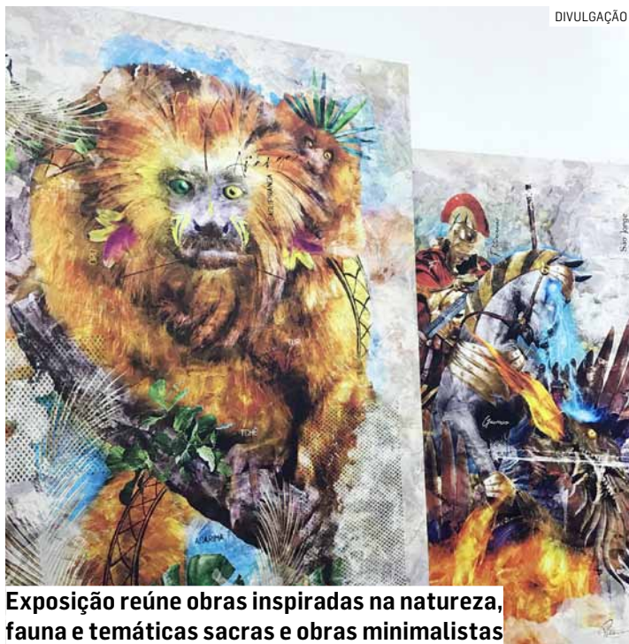
Exposição reúne obras inspiradas na natureza, fauna e temáticas sacras e obras minimalistas

“São trabalhos com características únicas, em es-