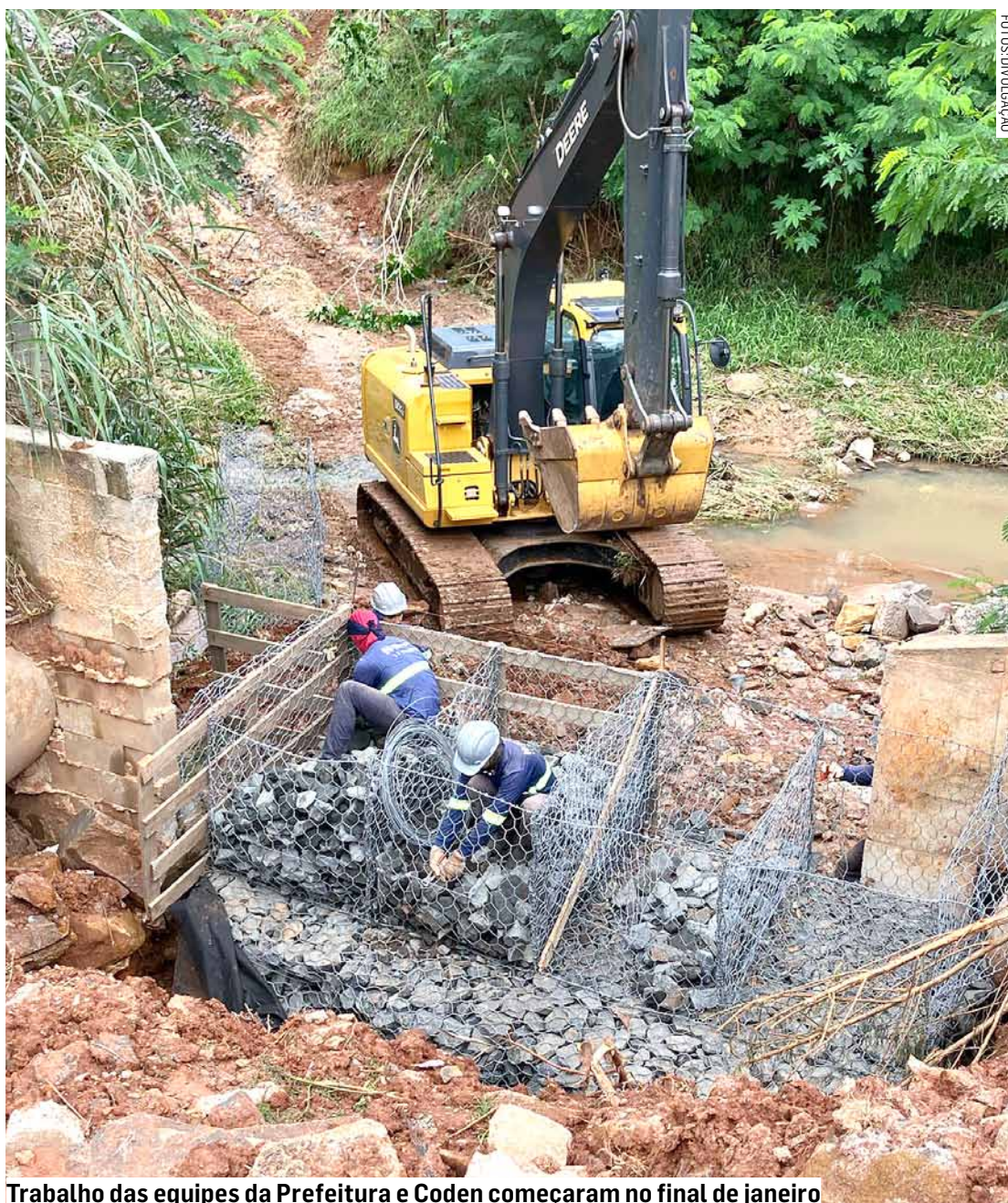
Trabalho das equipes da Prefeitura e Coden começaram no final de janeiro

Também já foi feita parte do desassoreamento do córrego sem nome "canalizado" pela tubulação. Foi a areia desse córrego perpendicular ao Capuava