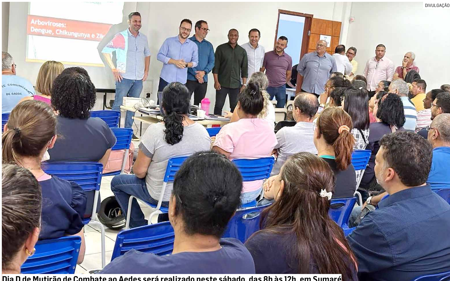
Dia D de Mutirão de Combate ao Aedes será realizado neste sábado, das 8h às 12h, em Sumaré