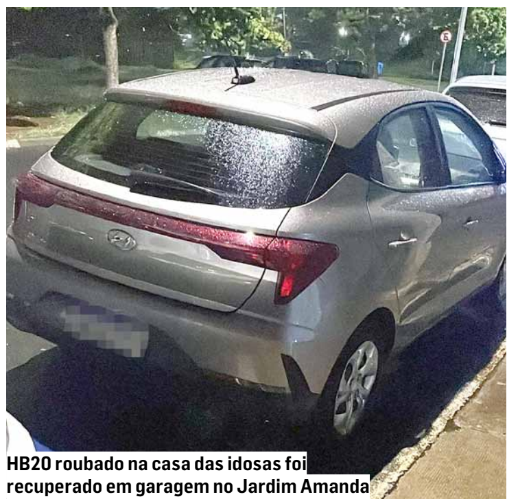
HB20 roubado na casa das idosas foi recuperado em garagem no Jardim Amanda

Bandidos armados renderam as duas mulheres, as levaram para dentro do imóvel e roubaram veículo, joias e celulares; PM conseguiu localizar os suspeitos no Jardim Amanda, por meio de um rastreador