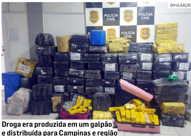
Droga era produzida em um galpão e distribuída para Campinas e região

Já os outros policiais que aguardavam em frente ao galpão abordaram o outro veículo, também ocupado por duas pessoas, e entrou no local, onde havia