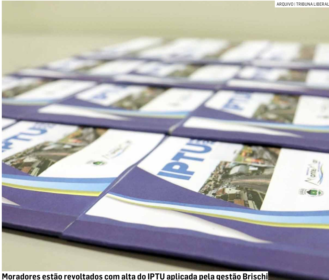
Moradores estão revoltados com alta do IPTU aplicada pela gestão Brischi

A falta de transparência na comunicação sobre