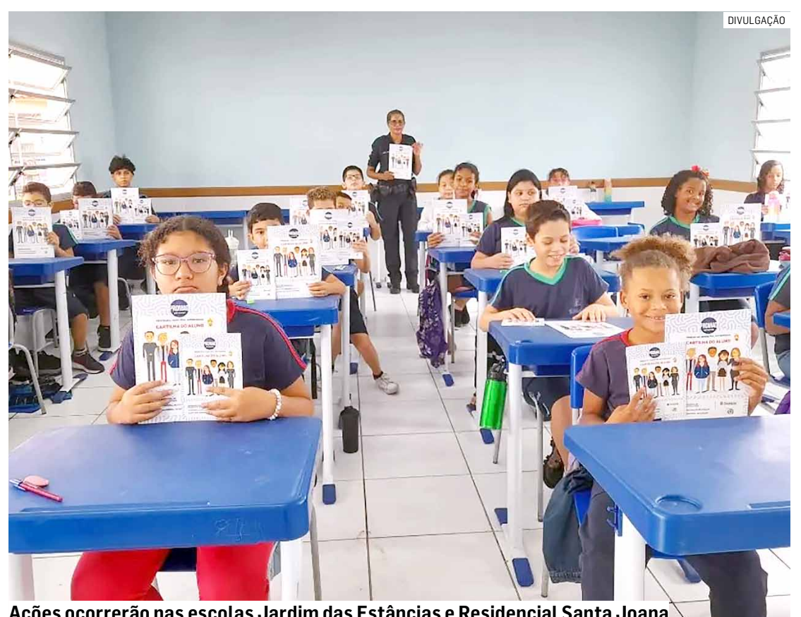
Ações ocorrerão nas escolas Jardim das Estâncias e Residencial Santa Joana