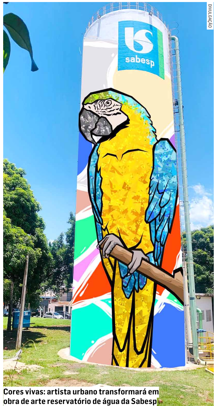
Cores vivas: artista urbano transformará em obra de arte reservatório de água da Sabesp