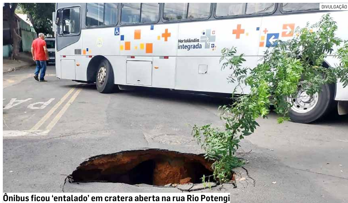
Ônibus ficou 'entalado' em cratera aberta na rua Rio Potengi