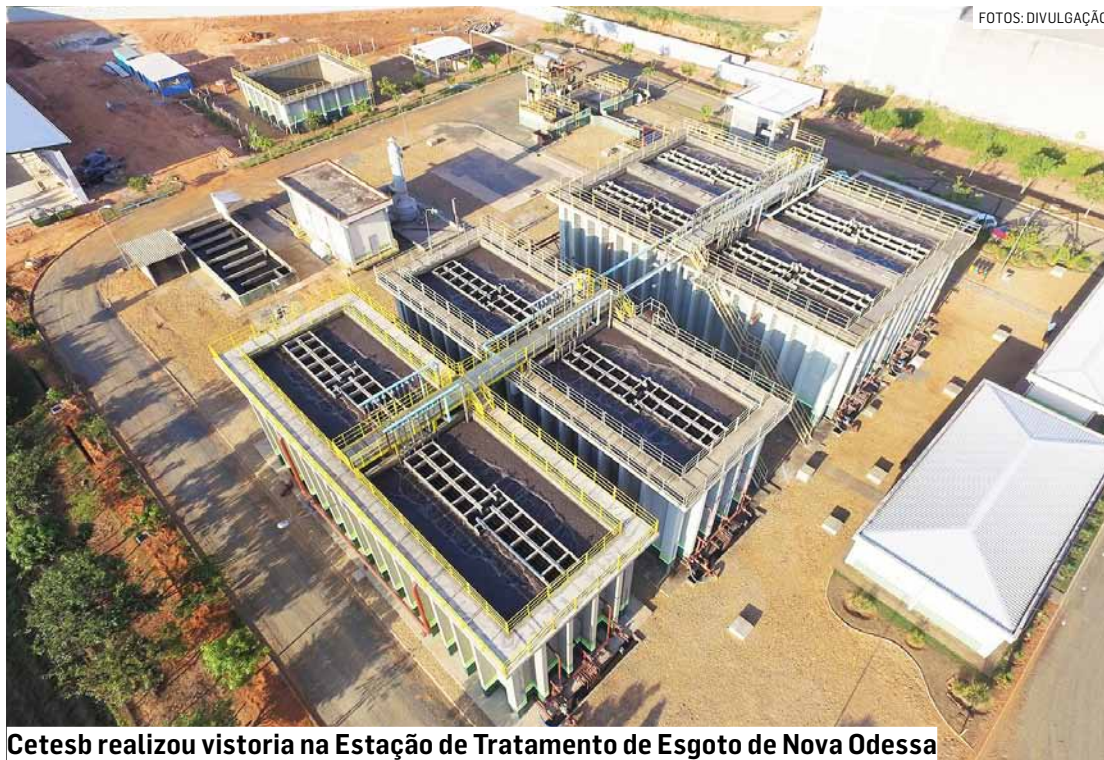
Cetesb realizou vistoria na Estação de Tratamento de Esgoto de Nova Odessa

Na terça, o diretor-presidente da Coden Ambiental,