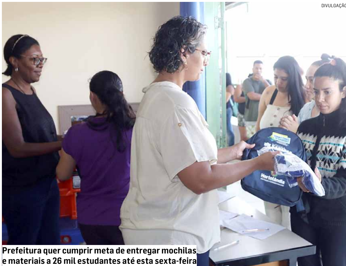
Prefeitura quer cumprir meta de entregar mochilas e materiais a 26 mil estudantes até esta sexta-feira