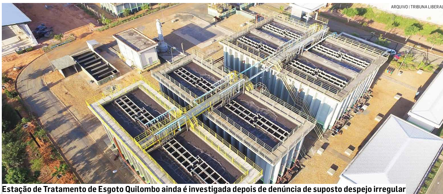
ARQUIVO | TRIBUNA LIBERAL