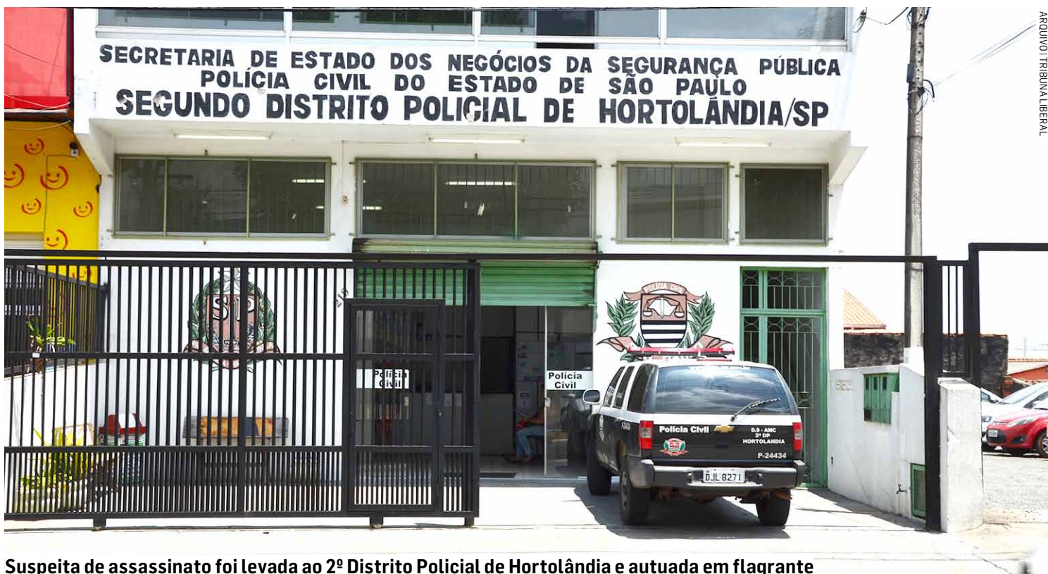
Suspeita de assassinato foi levada ao 2º Distrito Policial de Hortolândia e autuada em flagrante

A faca, objeto possivelmente utilizado como ins-