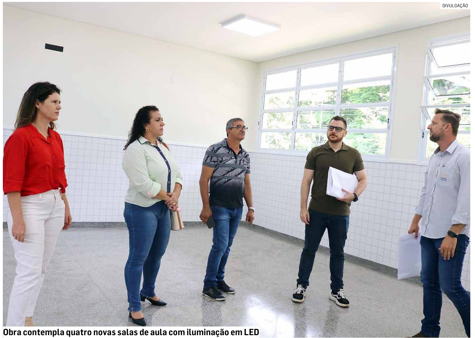
Obra contempla quatro novas salas de aula com iluminação em LED

As salas contam com acabamento de primeira linha. "A Midas é uma