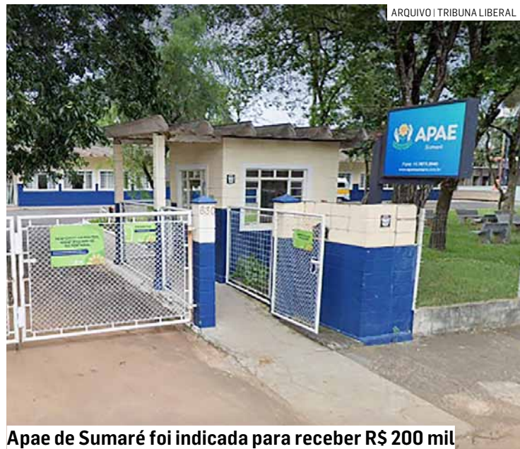
Apae de Sumaré foi indicada para receber R$ 200 mil