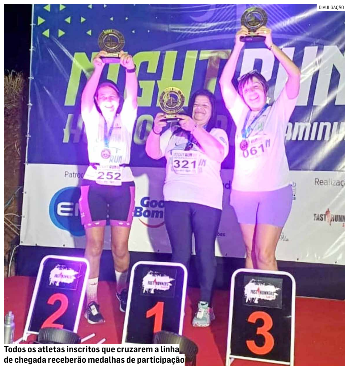
Todos os atletas inscritos que cruzarem a linha de chegada receberão medalhas de participação