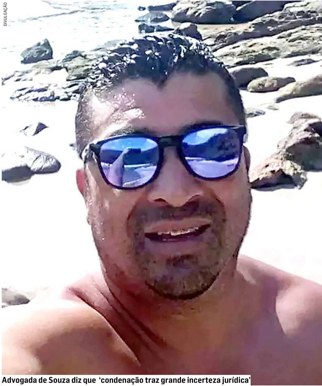
Advogada de Souza diz que 'condenação traz grande incerteza jurídica'

Este é o 12º morador da RMC (Região Metropolitana de Campinas) a ser condenado e o 2º de Sumaré a receber pena do STF (Supremo Tribunal Federal) por participação na invasão à sede dos Três Poderes, em Brasília, no ano passado