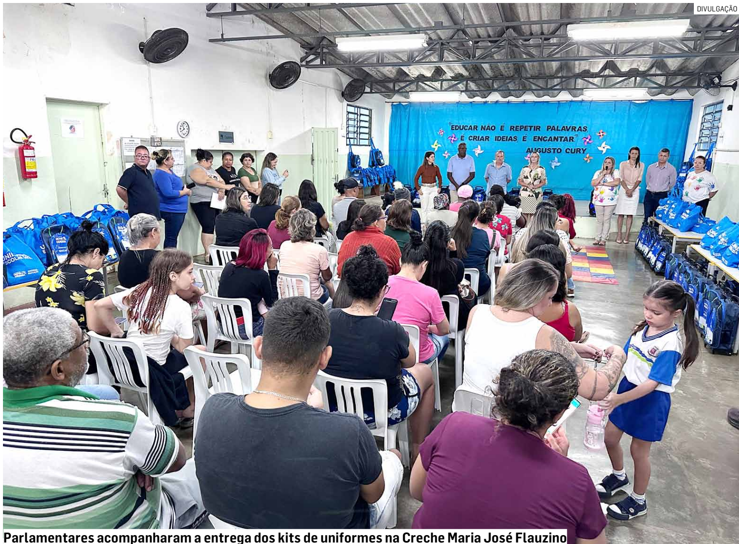
Parlamentares acompanharam a entrega dos kits de uniformes na Creche Maria José Flauzino