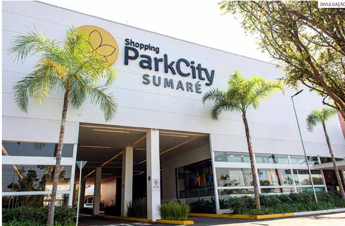
Atividades acontecem neste sábado, das 13h às 17h, na Alameda ParkCity e são gratuitas

A iniciativa tem o apoio de órgãos públicos e de entidades do município. No Espaço Pet Love, da Secretaria de Proteção Animal atra-