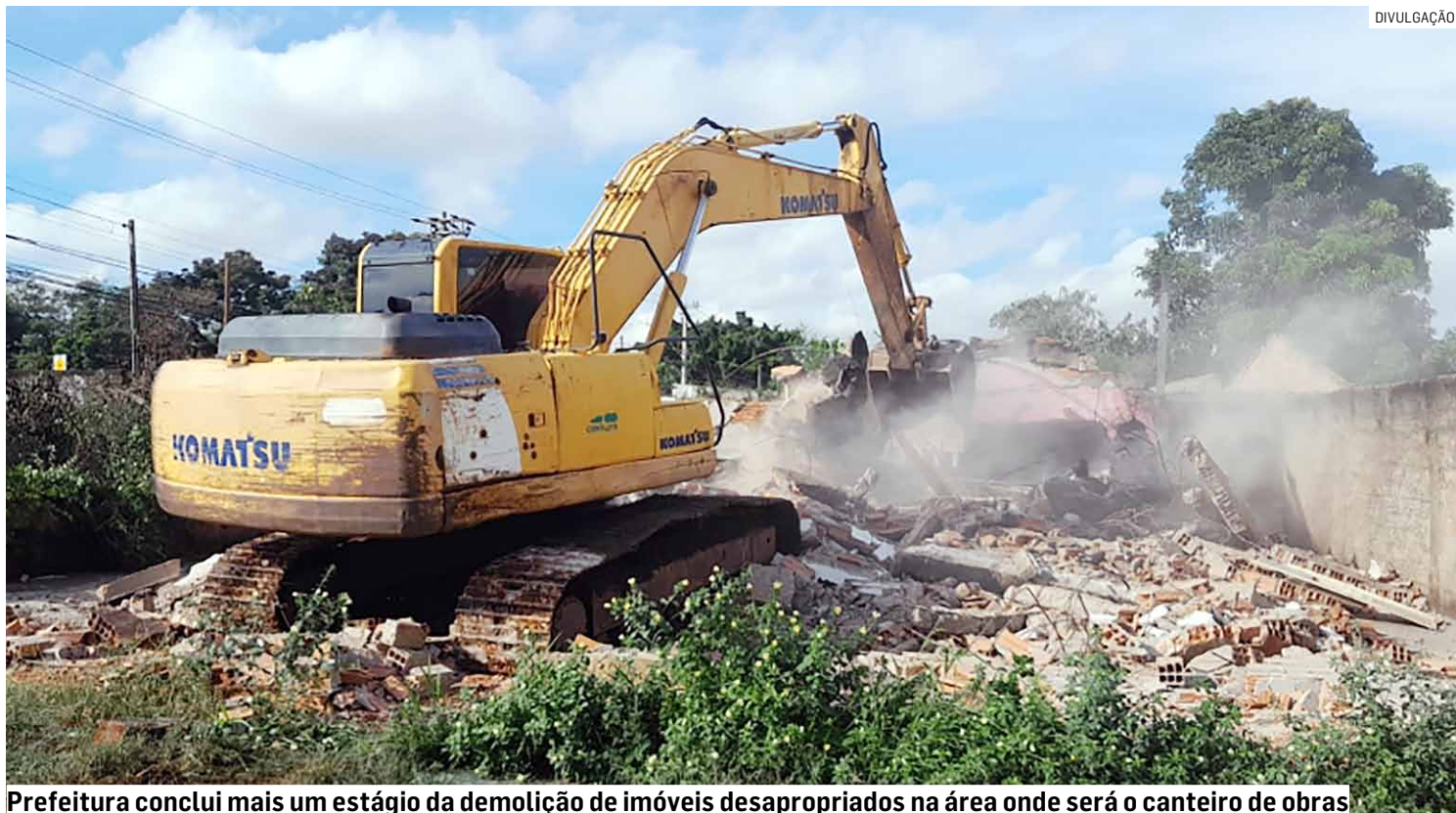
Prefeitura conclui mais um estágio da demolição de imóveis desapropriados na área onde será o canteiro de obras

“Vamos acabar com o congestionamento no local, melhorar o ir e vir das pessoas, evitar acidentes