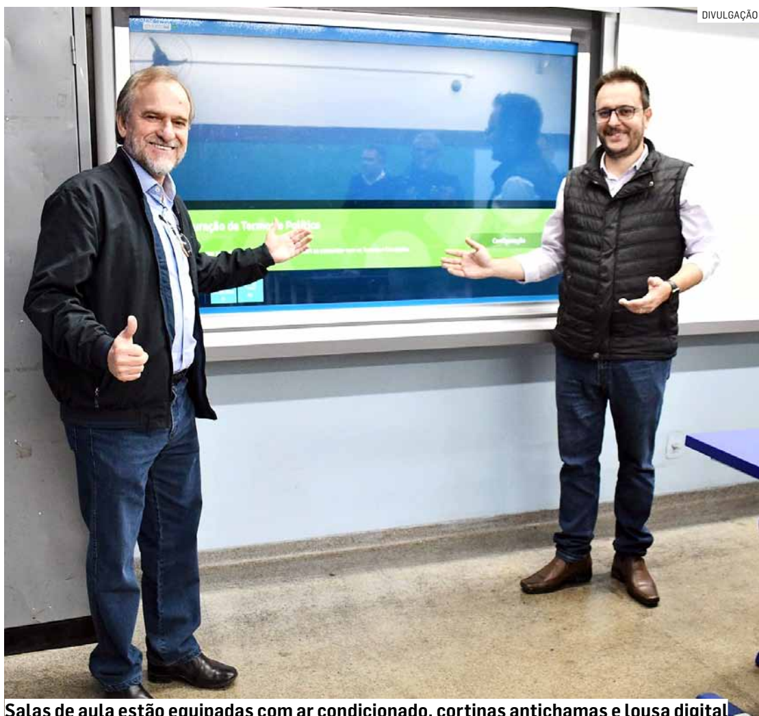
Salas de aula estão equipadas com ar condicionado, cortinas antichamas e lousa digital

O Proeb (Programa Pró Educação Básica) foi ampliado. Agora, são 84 escolas de Educação Infantil parcei-