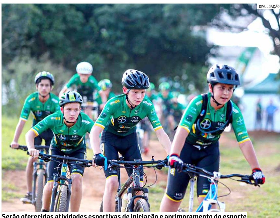
Serão oferecidas atividades esportivas de iniciação e aprimoramento do esporte

Além disso, serão oferecidas atividades esportivas de iniciação e aprimoramento do ciclismo Mountain Bike, preparação física, atividades lúdicas e educacionais