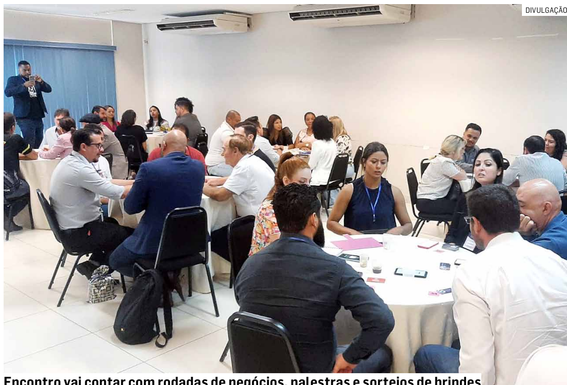
Encontro vai contar com rodadas de negócios, palestras e sorteios de brindes

O encontro será no Cotton Eventos, das 7h30 às 10h, e é aberto a empresários, comerciantes, em-