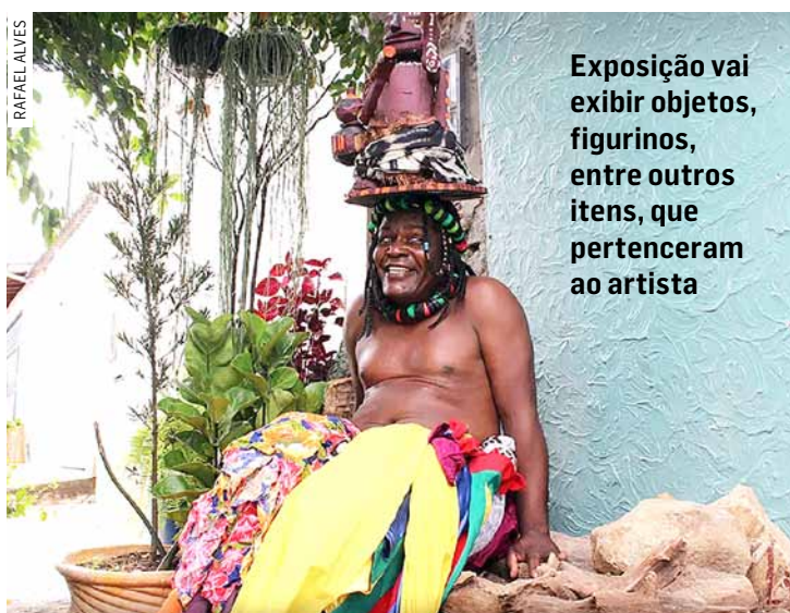
Exposição vai exibir objetos, figurinos, entre outros itens, que pertenceram ao artista