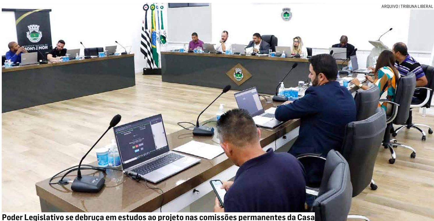
Poder Legislativo se debruça em estudos ao projeto nas comissões permanentes da Casa

De acordo com o projeto, o município seria autorizado a realizar os procedimentos de licenciamento ambiental em seu território, com base em um convênio de cooperação técnica e administrativa celebrado com a Cetesb (Com-