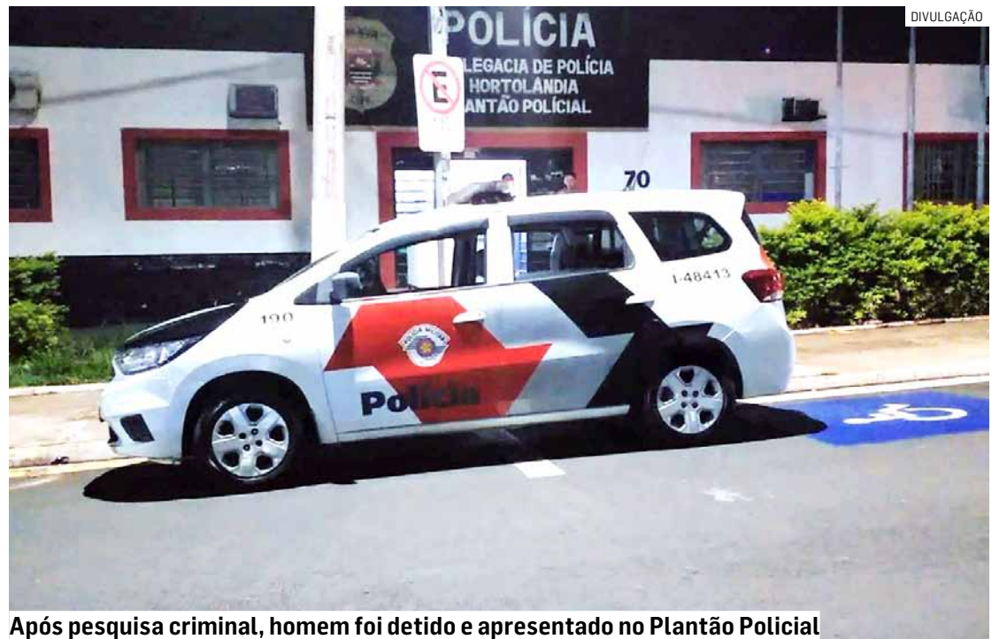
Após pesquisa criminal, homem foi detido e apresentado no Plantão Policial

Em pesquisa criminal do trio, constatou-se que o condutor do Civic era procurado pela Justiça, por receptação e porte de drogas. Ele foi conduzido ao Plantão Policial de Hortolândia, onde permaneceu detido.