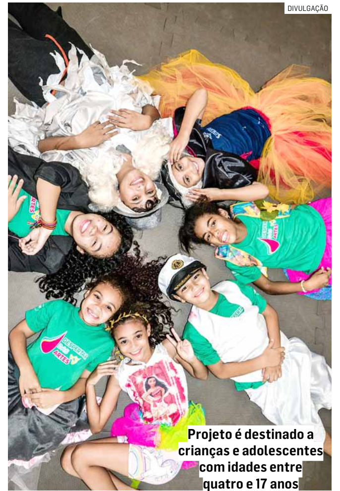
Projeto é destinado a crianças e adolescentes com idades entre quatro e 17 anos

Da Redação • SUMARÉ tribunaliberal@tribunaliberal.com.br