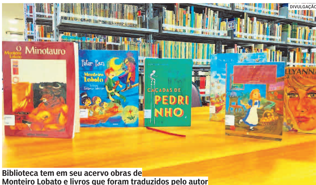
Biblioteca tem em seu acervo obras de Monteiro Lobato e livros que foram traduzidos pelo autor

Durante este mês são comemoradas datas importantes na área da literatura. Em razão disso, abril é o Mês do Livro. Uma das datas comemoradas é nesta segunda-