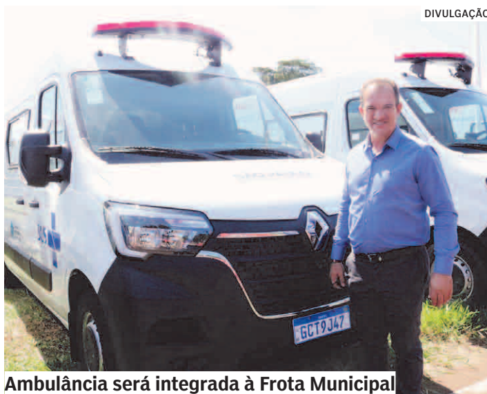
Ambulância será integrada à Frota Municipal

O prefeito de Nova Odessa Cláudio José Schooder, o Leitinho, recebeu nesta segunda-feira (18/04), das mãos do governador Rodrigo Garcia, as chaves de mais uma ambulância zero quilômetro para a Central 192. A assinatura do termo de permissão de uso do veículo ocorreu durante a iniciativa "Governo na Área".