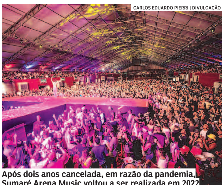
Após dois anos cancelada, em razão da pandemia, Sumaré Arena Music voltou a ser realizada em 2022