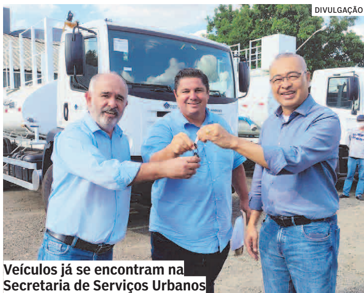
Veículos já se encontram na Secretaria de Serviços Urbanos

Dois caminhões pipa Volkswagen, modelos 24260 e 24.280, equipados com reservatórios de 12 mil e 15 mil litros de água, respectivamente, foram conquistados pelo município de Hortolândia nesta segunda-feira (18/04) junto ao Governo do Estado. Os caminhões estão avaliados em aproximadamente R$ 1 milhão.