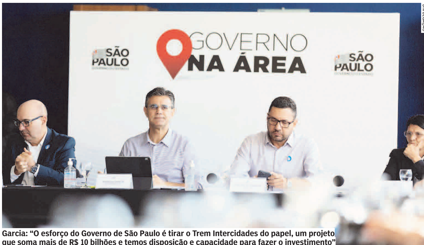
Garcia: “O esforço do Governo de São Paulo é tirar o Trem Intercidades do papel, um projeto que soma mais de R$ 10 bilhões e temos disposição e capacidade para fazer o investimento”

Com estimativa de investimentos de R$ 10,2 bilhões, o Trem Intercidades terá 100 km de extensão, com serviço expresso entre Campinas, Jundiaí e São Paulo e um sistema com paradas en-