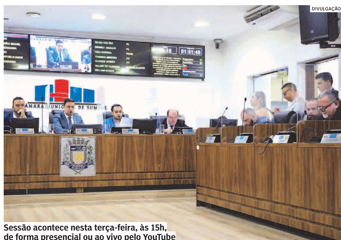
Sessão acontece nesta terça-feira, às 15h, de forma presencial ou ao vivo pelo YouTube