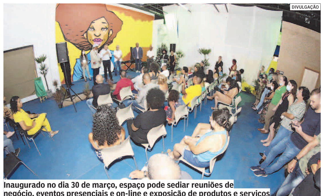
Inaugurado no dia 30 de março, espaço pode sediar reuniões de negócio, eventos presenciais e on-line e exposição de produtos e serviços