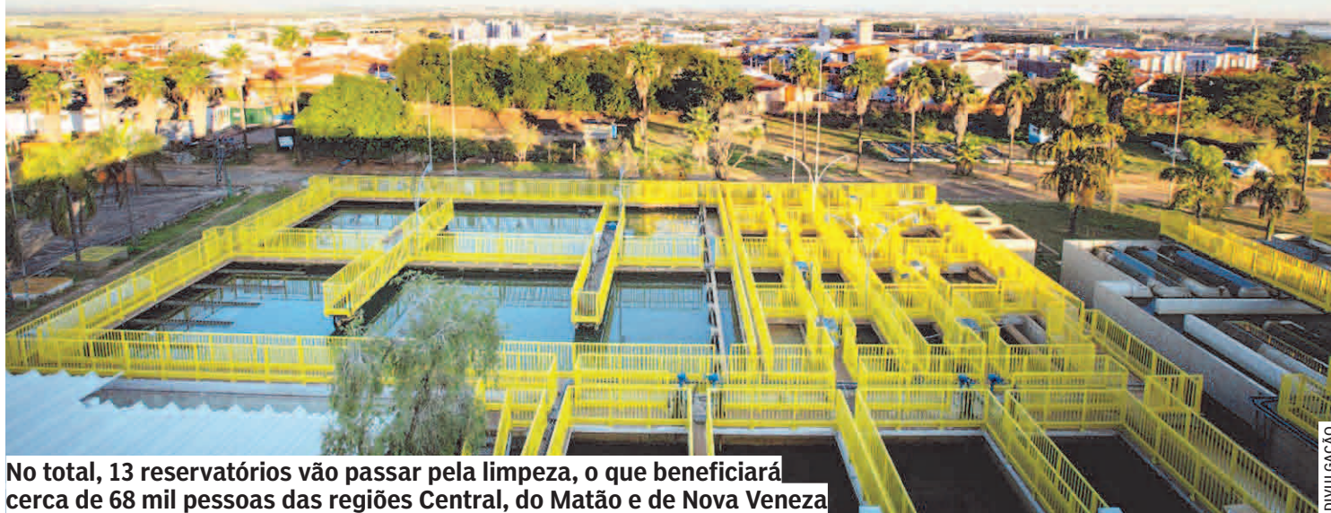
No total, 13 reservatórios vão passar pela limpeza, o que beneficiará cerca de 68 mil pessoas das regiões Central, do Matão e de Nova Veneza

Objetivo é garantir a qualidade da água distribuída à população da cidade; atividades terão início ainda no primeiro semestre deste ano