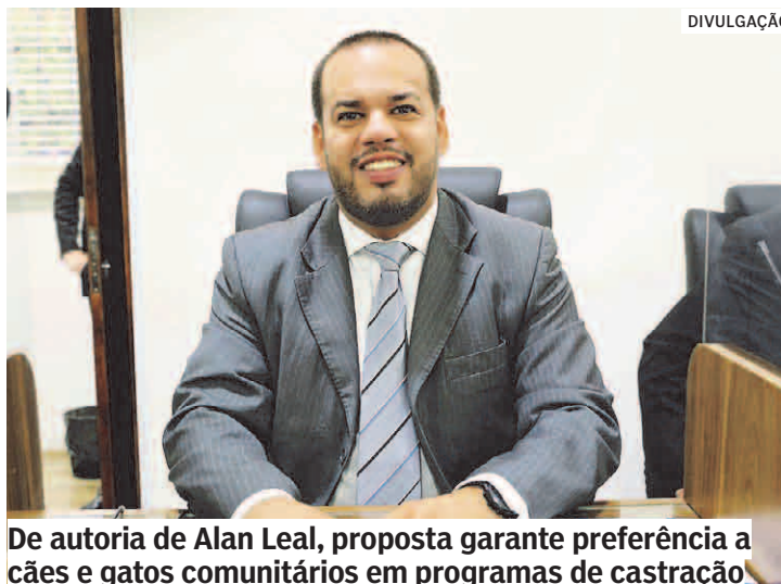
De autoria de Alan Leal, proposta garante preferência a cães e gatos comunitários em programas de castração

Segundo o projeto, os cães e gatos comunitários terão preferência nos