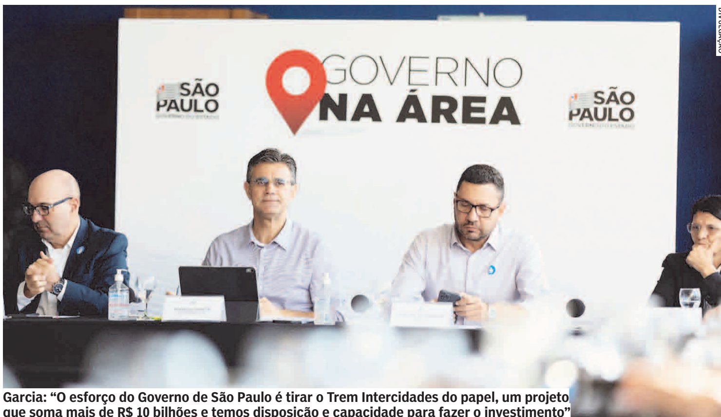
Garcia: “O esforço do Governo de São Paulo é tirar o Trem Intercidades do papel, um projeto que soma mais de R$ 10 bilhões e temos disposição e capacidade para fazer o investimento”

Com estimativa de investimentos de R$ 10,2 bilhões, o Trem Intercidades terá 100 km de extensão, com serviço expresso entre Campinas, Jundiaí e São Paulo e um sistema com paradas en-