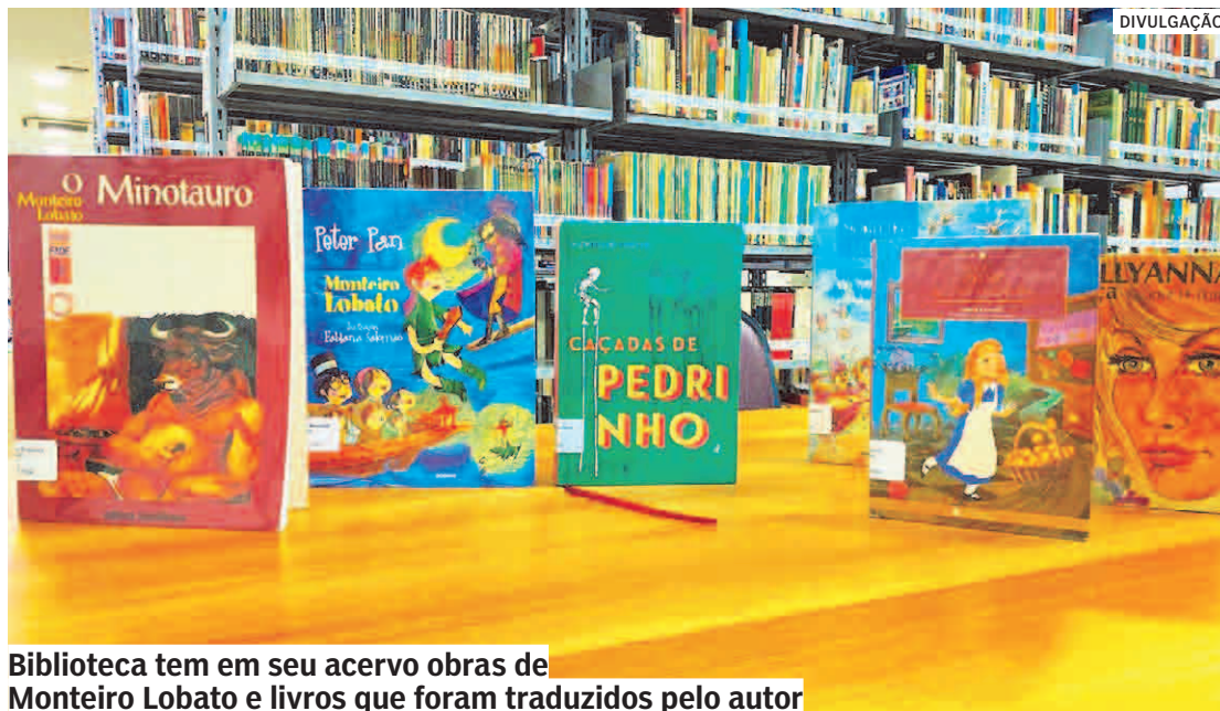
Biblioteca tem em seu acervo obras de Monteiro Lobato e livros que foram traduzidos pelo autor

Durante este mês são comemoradas datas importantes na área da literatura. Em razão disso, abril é o Mês do Livro. Uma das datas comemoradas é nesta segunda-