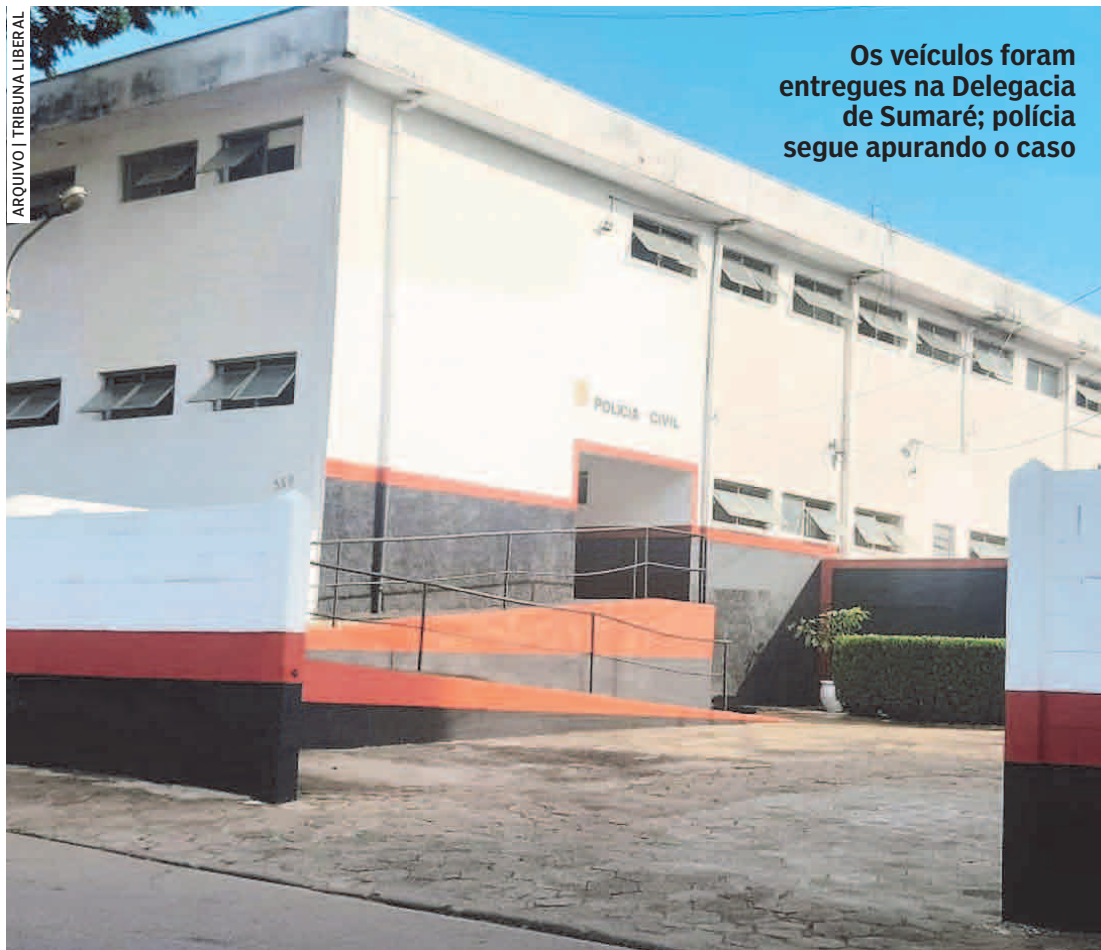
Os veículos foram entregues na Delegacia de Sumaré; polícia segue apurando o caso

A defesa dos clientes ingressou com requerimento de inquérito policial no 2º Distrito Policial de Hortolândia. Do mesmo modo, também ingressaram com liminar, para reaverem o dinheiro, e aguardam