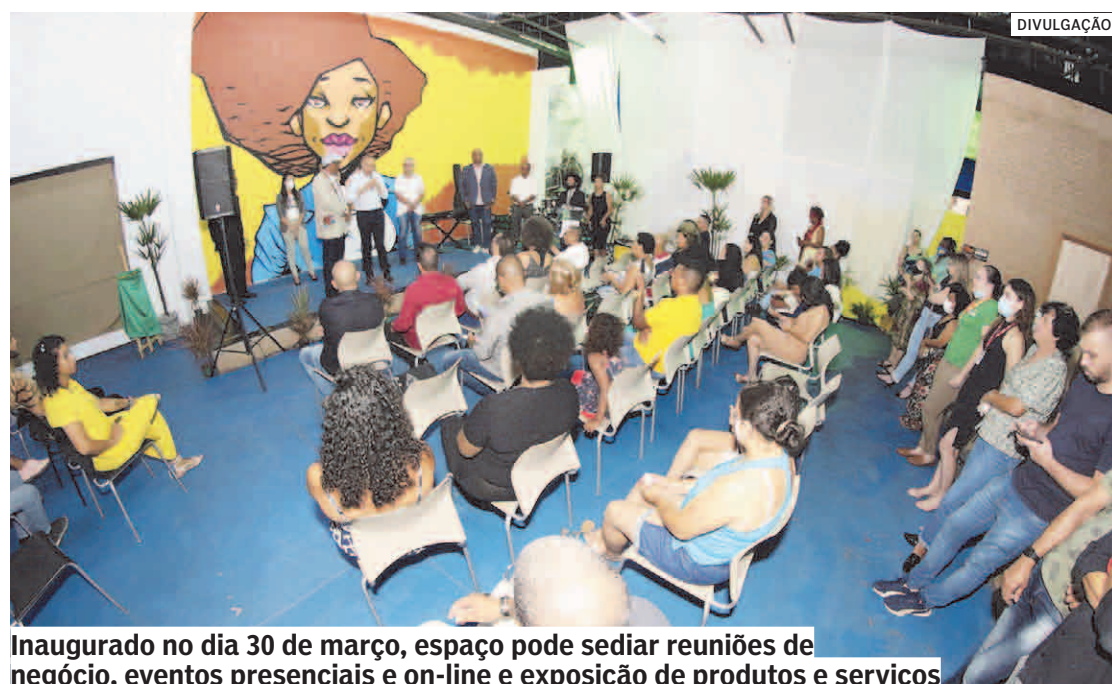
Inaugurado no dia 30 de março, espaço pode sediar reuniões de negócio, eventos presenciais e on-line e exposição de produtos e serviços