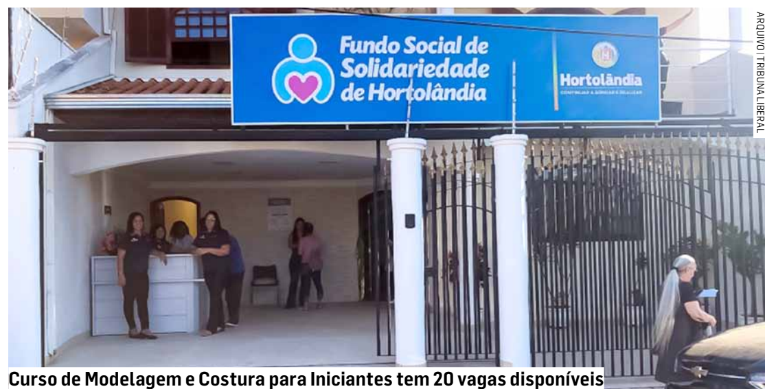
Curso de Modelagem e Costura para Iniciantes tem 20 vagas disponíveis

Também está disponível a inscrição para o Workshop de Alongamento do Zero e Cutilagem Perfeita, no dia 25 de março, das 18h às 22h, na Igreja Vivendo em Graça Church, localizada na avenida Thereza Ana Cecon Breda, 658, Vila Real. São 100 vagas disponíveis com certificado.