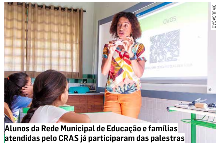
Alunos da Rede Municipal de Educação e famílias atendidas pelo CRAS já participaram das palestras

Na última terça-feira (12), por exemplo, a palestra aconteceu na EMEB (Escola Municipal de Educação Básica) Avelino Xavier Alves, no Jardim dos Lagos. “Estou muito feliz com a receptividade e o interesse dos alunos. As crianças já têm conhecimento do assunto, mas através das palestras, estamos ampliando o assunto”,