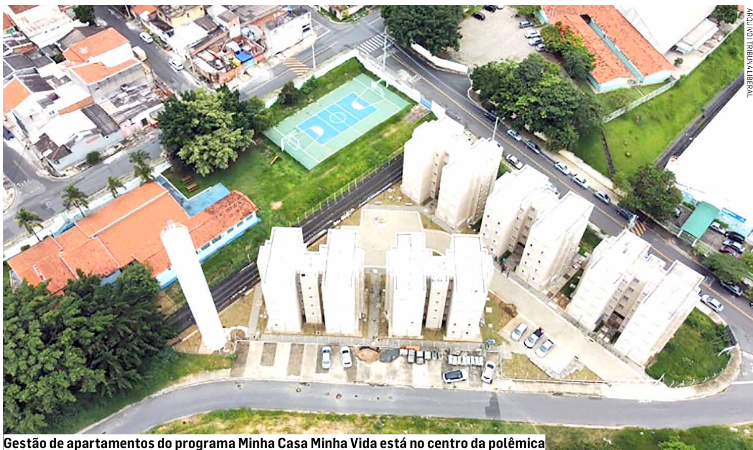
Gestão de apartamentos do programa Minha Casa Minha Vida está no centro da polêmica

A investigação teve início a partir de denúncias de