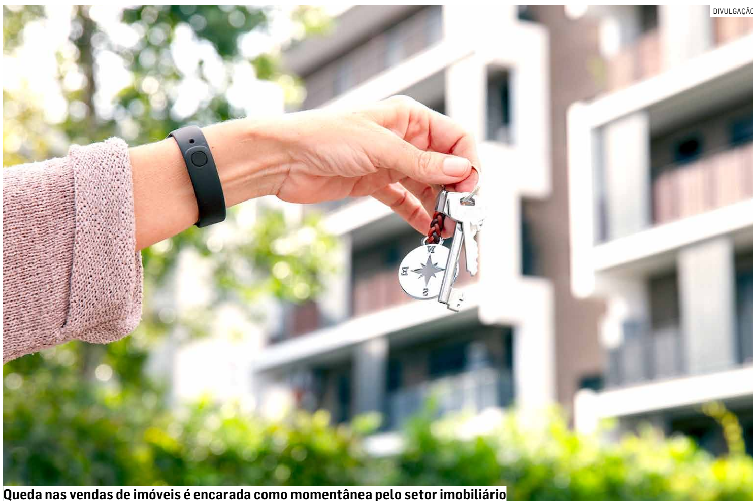
Queda nas vendas de imóveis é encarada como momentânea pelo setor imobiliário

O Conselho Regional de Corretores de Imóveis de São Paulo (CRECISP) divulgou um estudo abrangente referente ao mês de janeiro de 2024, analisando o mercado imobiliário de Campinas e região. A pesquisa, que envolveu 40 imobiliárias em cidades como Americana, Campinas, Hortolândia, Indaiatuba, Jaguariúna, Mogi Guaçu, Monte Mor, Nova Odessa, Paulínia, Santa Bárbara D'oeste, Sumaré e Valinhos, revela uma queda significativa nas vendas, enquanto as locações continuam em ascensão.