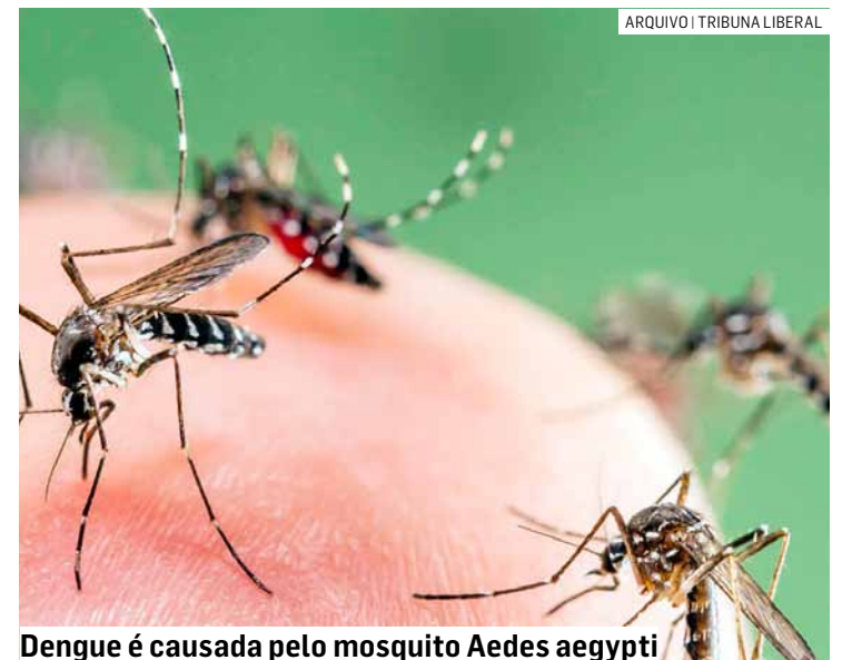
Dengue é causada pelo mosquito Aedes aegypti

Os especialistas também compararam os preços praticados no dia 8 de março para um mesmo item e foram apuradas diferenças expressivas, chegando a até 107% - enquanto em um estabelecimento online o valor era R$ 18,99, em outro o mesmo item estava à venda por R$ 39,38. Foram comparados os preços de nove tipos de repe-