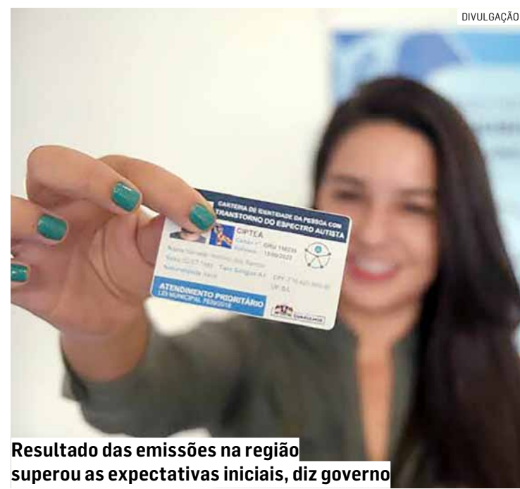
Resultado das emissões na região superou as expectativas iniciais, diz governo

A implementação da Carteira da Pessoa Autista está alinhada às diretrizes da Lei Federal 13.977/20 e da Lei Estadual 17.651/23, sancionada em março pelo Governo de São Paulo. Essa iniciativa é parte do Plano Estadual Integrado para Pessoas com Transtorno do Espectro do Autismo (PEIP-TEA), ativo desde abril de 2023 pelo decreto estadual nº 67.634, que integra uma gama de ações do governo estadual voltadas para a inclusão e a autonomia das pessoas com deficiência.