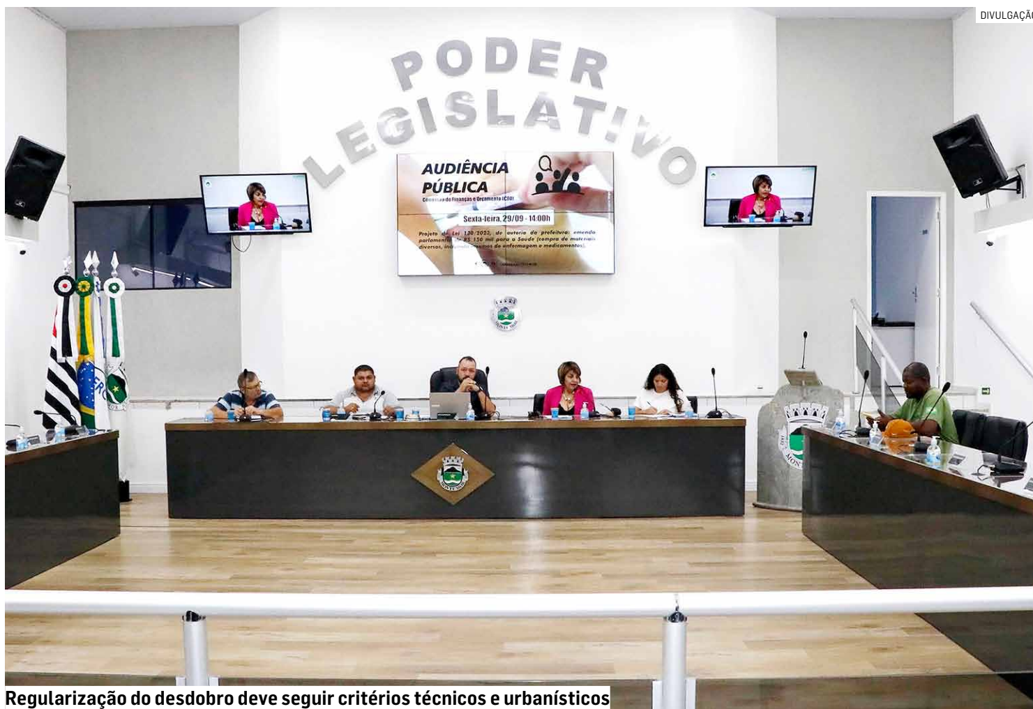
Regularização do desdobro deve seguir critérios técnicos e urbanísticos

Conforme o texto, os "lotes ou glebas" - ou seja, terrenos - com área igual ou superior a 250 m 2 "cuja posse entre duas pessoas seja comprovadamente anterior à data de publicação desta Lei" poderão ser desdobra-