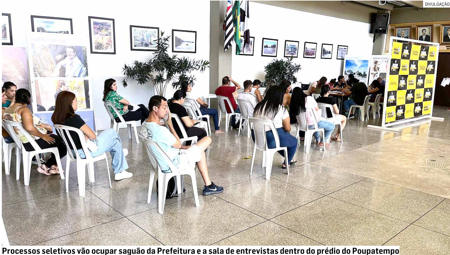
Processos seletivos vão ocupar saguão da Prefeitura e a sala de entrevistas dentro do prédio do Poupatempo

As atividades da função incluem executar serviços de limpeza e organização da área industrial, executar as tarefas de coleta, tratamento e armazenamento de resíduos (cavacos, ligas e scraps industriais), conforme procedimentos estabelecidos e identificar iniciativas de melhoria de qualidade no sistema.