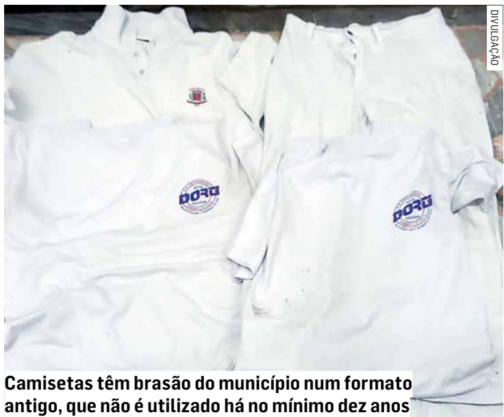
Camisetas têm brasão do município num formato antigo, que não é utilizado há no mínimo dez anos

Da Redação • NOVA ODESSA tribunaliberal@tribunaliberal.com.br