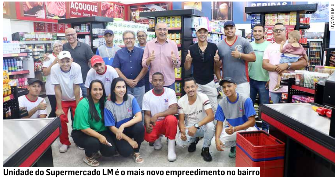
Unidade do Supermercado LM é o mais novo empreendimento no bairro