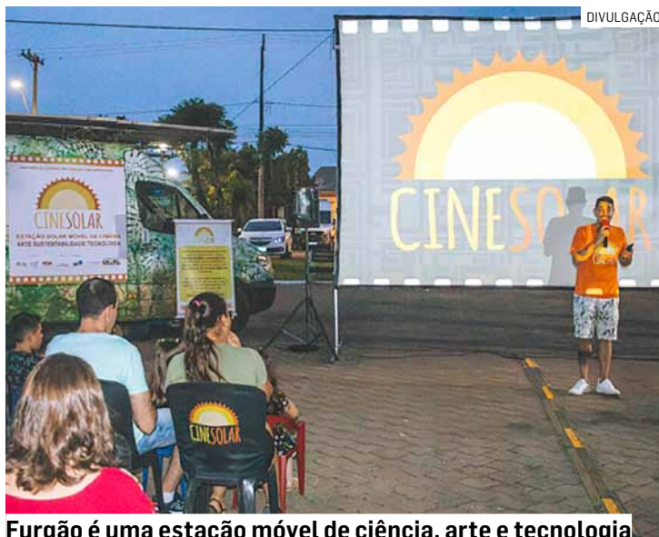
Furgão é uma estação móvel de ciência, arte e tecnologia

O projeto é um cinema itinerante, montado num furgão movido a energia solar. As sessões acontecem por meio do veículo,