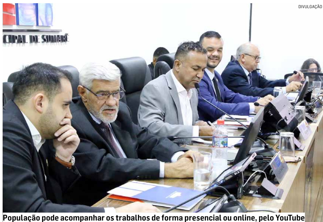
População pode acompanhar os trabalhos de forma presencial ou online, pelo YouTube