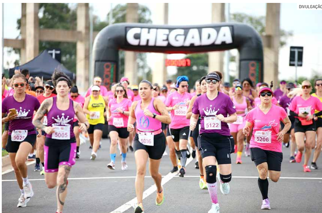
Modalidade vem crescendo e 'caindo no gosto' de homens e mulheres hortolandenses

Durante a "Ladies Run", o prefeito acompanhou a largada e destacou a criação do futuro Centro de Eventos, que vai funcionar embaixo da Ponte da Esperança (Estaiada). "Aqui, no futuro Centro de Eventos, já instalamos a primeira etapa do piso intertravado. Teremos uma infraestrutura completa para rece-