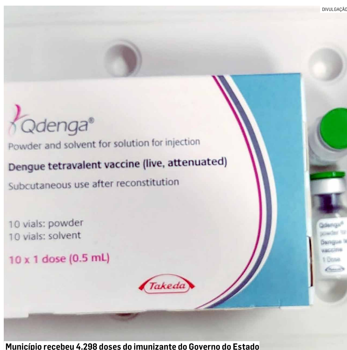
Município recebeu 4.298 doses do imunizante do Governo do Estado

A coordenadora ainda ressalta que Hortolândia realizou capacitação e