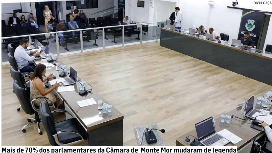
Mais de 70% dos parlamentares da Câmara de Monte Mor mudaram de legenda

Dos 15 vereadores que integram a Câmara de Monte Mor, 11 comunicaram ao Setor de Processo Legislativo da Casa que mudaram de partido durante o período chamado de "janela partidária" - quando estão autorizados pela legislação brasileira a trocar de legenda sem perder o mandato, ou seja, 73% dos parlamentares optaram por mudar de legenda dentro do período autorizativo, que foi de 7 de março a 5 de abril. O MDB passou a ter o maior número de parlamentares (5), seguido por União, Republicanos, PSB e PDT (dois em cada partido) e PP e PSD (um).