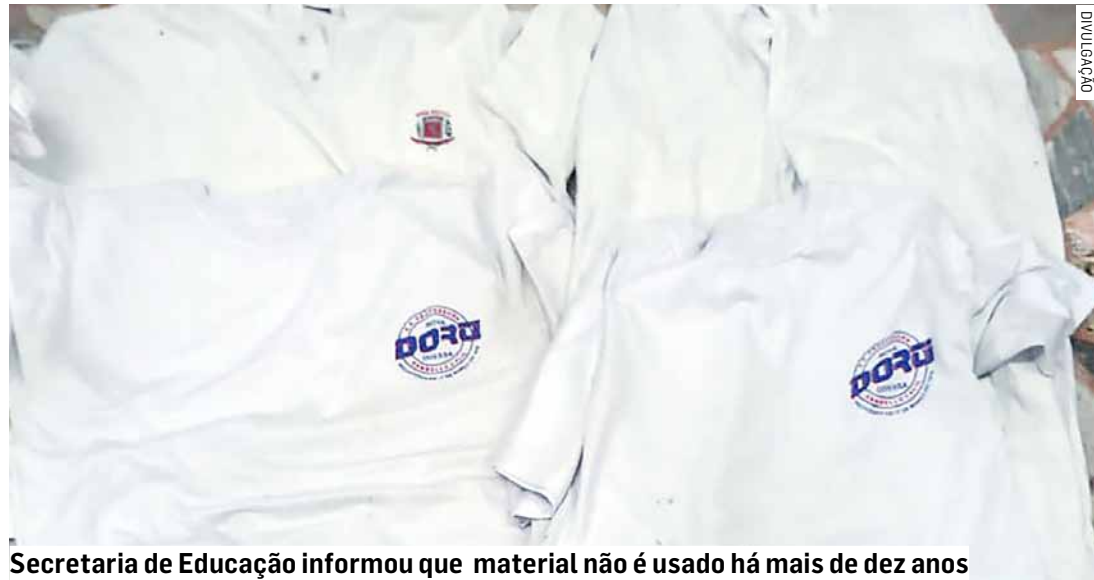
Secretaria de Educação informou que material não é usado há mais de dez anos

mau ainda não se tratar de itens adquiridos ou pagos pela atual gestão municipal, nem do estoque recente da pasta (de 2021 até o momento). PÁGINA 06