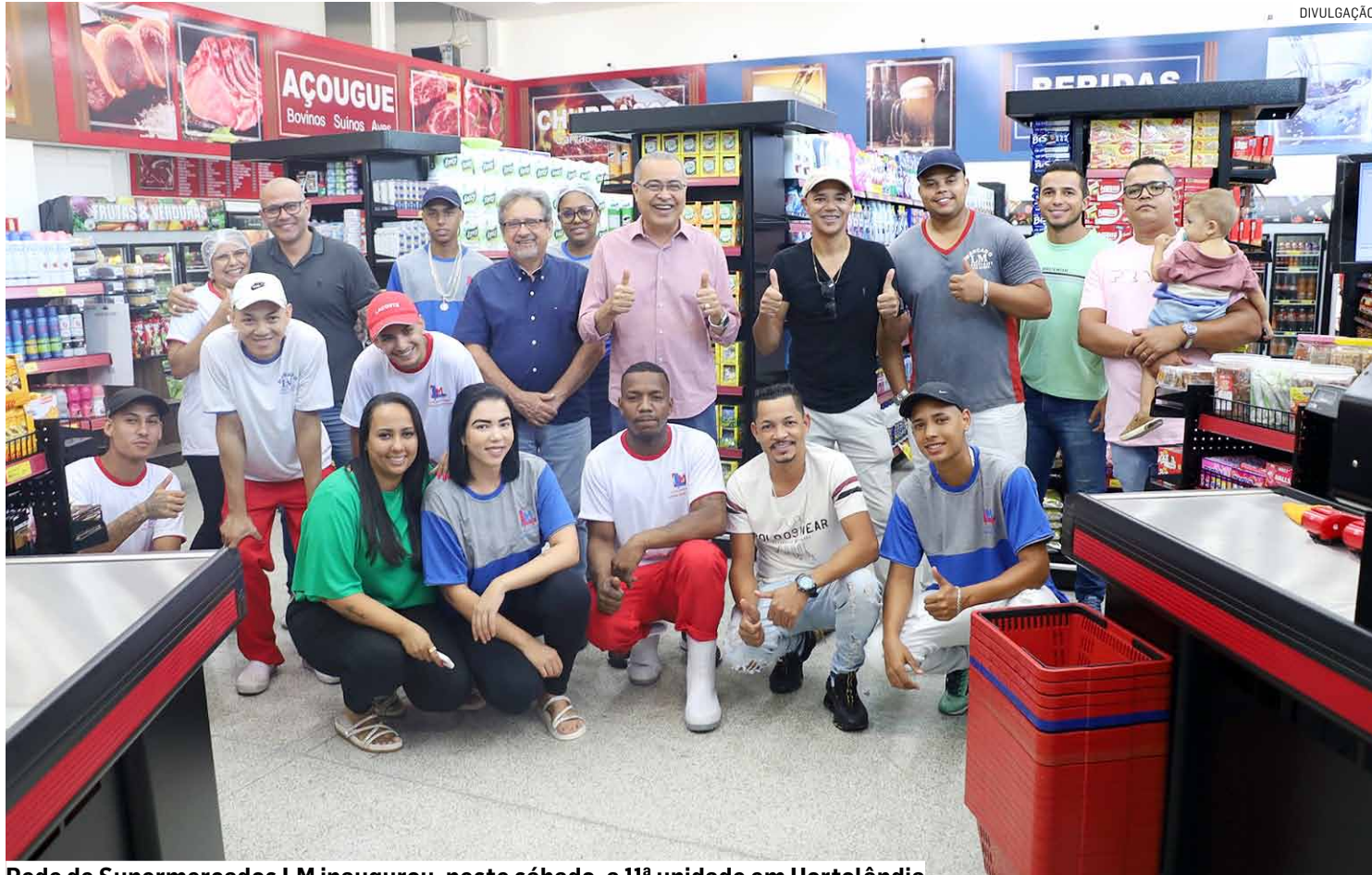
Rede de Supermercados LM inaugurou, neste sábado, a 11ª unidade em Hortolândia

De acordo com o prefeito Zezé Gomes, presente na inauguração do supermercado, a chegada do desenvolvimento na região do Nova Europa é fruto do planejamento e da vontade política de se fazer um diferencial numa região que carecia de investimentos públicos, especialmente em mobilidade urbana. “Por conta do planejamento adotado a partir de 2017, com o nosso saudoso Angelo Perugini, estava claro que precisávamos interligar o município, com grandes viários, para facilitar o dia-a-dia da população, como também para escoar a produção local. Neste sen-