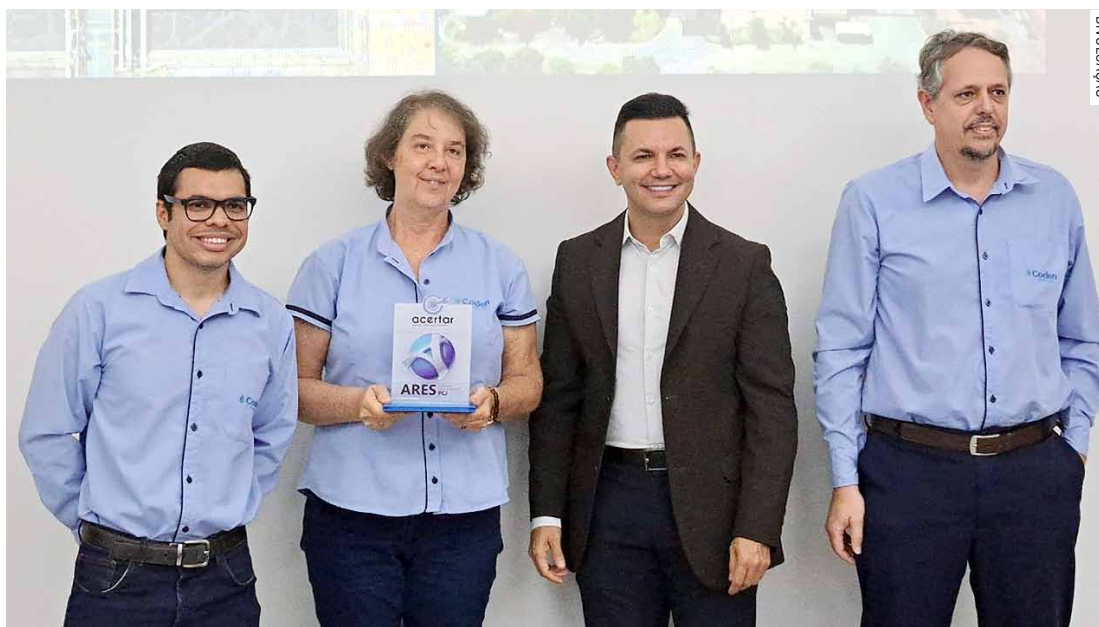
Representantes da Coden Ambiental de Nova Odessa receberam a premiação da Ares-PCJ

Ao todo foram avaliadas a certificação de 34 prestadores que finalizaram o 3º ciclo da metodologia Acertar da Ares-PCJ, sendo 17