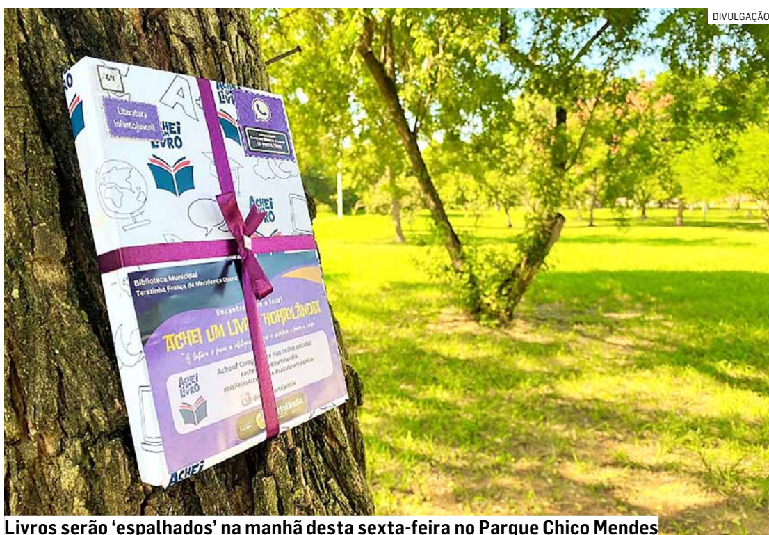
Livros serão 'espalhados' na manhã desta sexta-feira no Parque Chico Mendes

A ideia é fazer com que os livros sejam encontrados ao acaso pelas pessoas que, porventura, estiverem passando no local. Portanto, quem tiver a sorte de achar um dos livros, pode pegá-lo e levá-lo. O coordenador reforça que os livros não ficam escondidos, e nem se