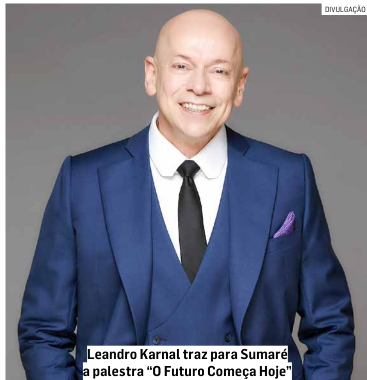
Leandro Karnal traz para Sumaré a palestra “O Futuro Começa Hoje”