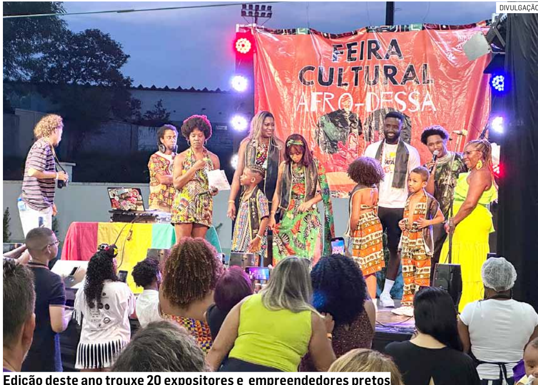
Edição deste ano trouxe 20 expositores e empreendedores negros