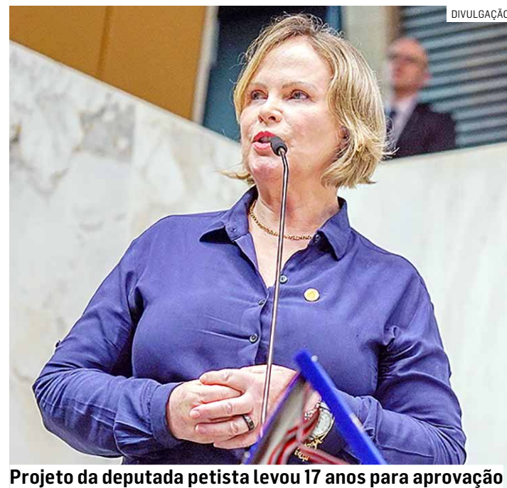
Projeto da deputada petista levou 17 anos para aprovação

Os cartórios de registro civil do Estado de São Paulo terão de comunicar imediatamente à Defensoria Pública os registros de nascimento de bebês sem identificação de paternidade. A lei estadual 17.894, de autoria da deputada Ana Perugini (PT), foi sancionada na terça-feira (9) pelo governador Tarcísio de Freitas (Republicanos). A nova legislação é resultado do projeto aprovado pela Alesp (Assembleia Legislativa de São Paulo) no dia 5 de março, após 17 anos de tramitação. PÁGINA 08