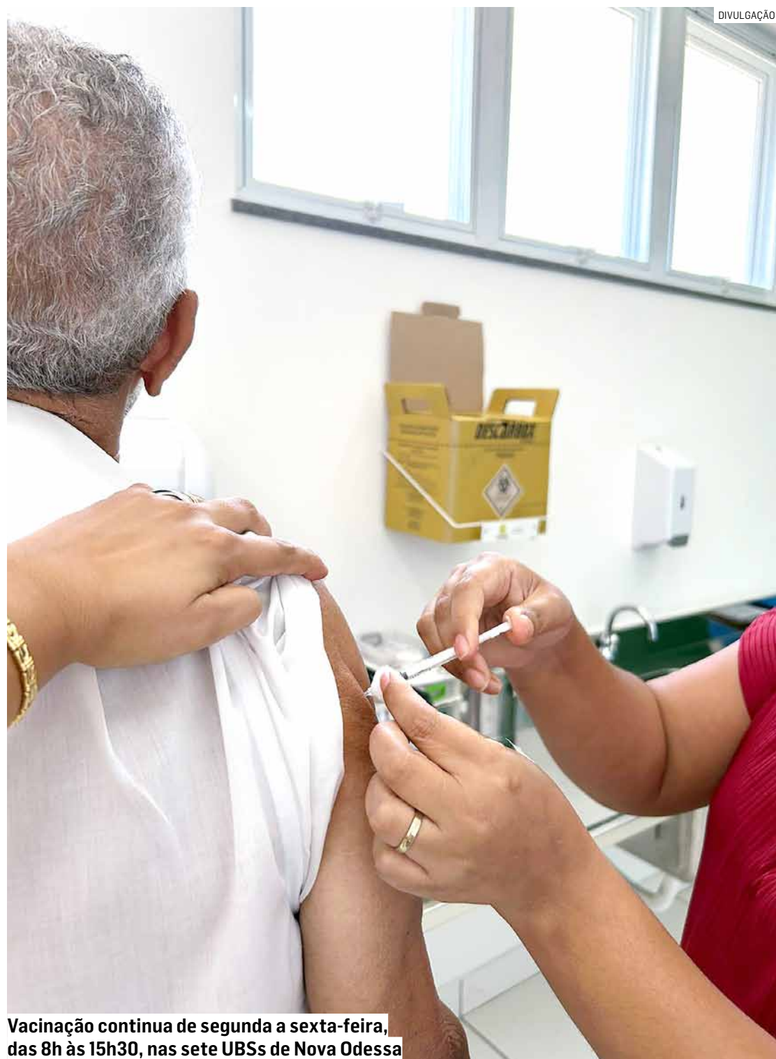
Vacinação continua de segunda a sexta-feira, das 8h às 15h30, nas sete UBSs de Nova Odessa