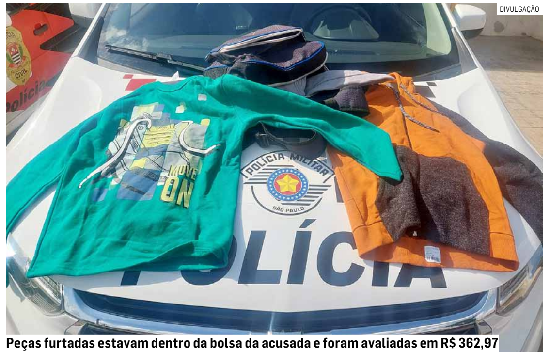
Peças furtadas estavam dentro da bolsa da acusada e foram avaliadas em R$ 362,97

Ela foi conduzida ao 2º Distrito Policial de Sumaré, onde a vítima reconheceu a acusada e as roupas que totalizavam R$ 362,97. A mulher permaneceu presa à disposição da justiça.