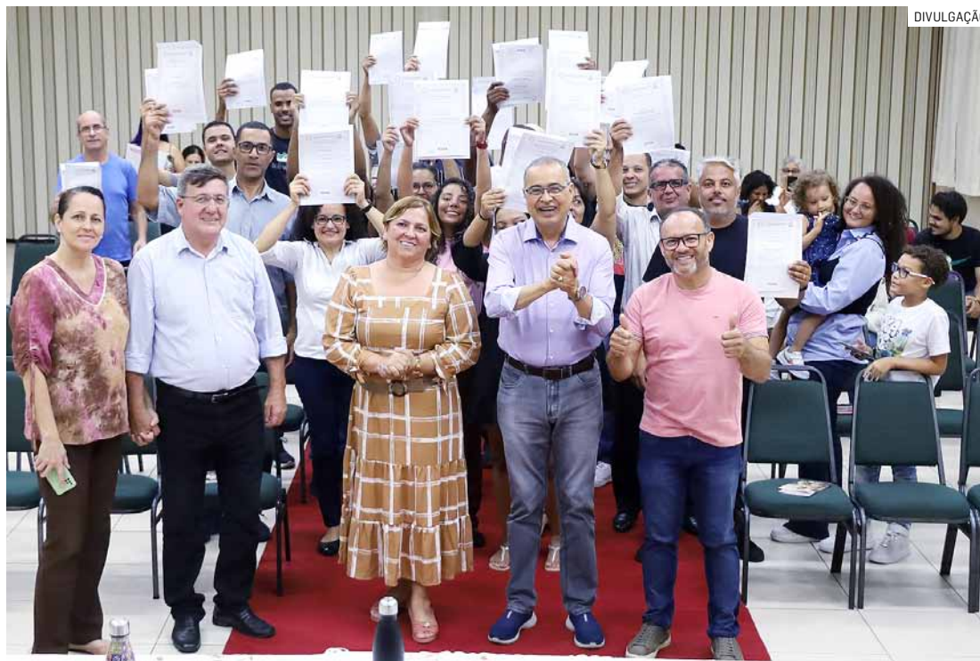
Cerimônia de diplomação reuniu alunos, familiares e autoridades públicas da cidade

Presente no evento, o prefeito de Hortolândia, Zezé Gomes (Republicanos), participou da entrega simbólica dos certificados aos alunos. “Quando eu vejo esses alunos, eu acabo lembrando parte da minha história. Minha faculdade foram os cursos profissionalizantes que cursei no Senai. Fiz oito cursos na época, o que me capacitou para conseguir um emprego em uma multinacional e mudar minha vida. Hortolândia vive um momen-