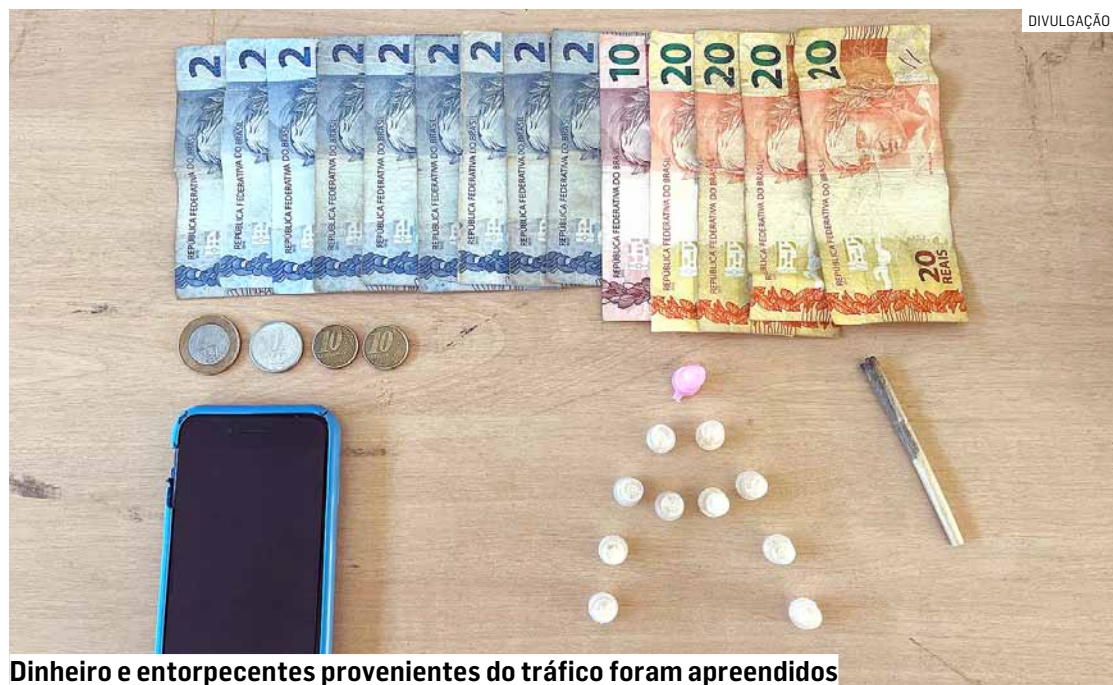
Dinheiro e entorpecentes provenientes do tráfico foram apreendidos

Cézar Oliveira • SUMARÉ tribunaliberal@tribunaliberal.com.br