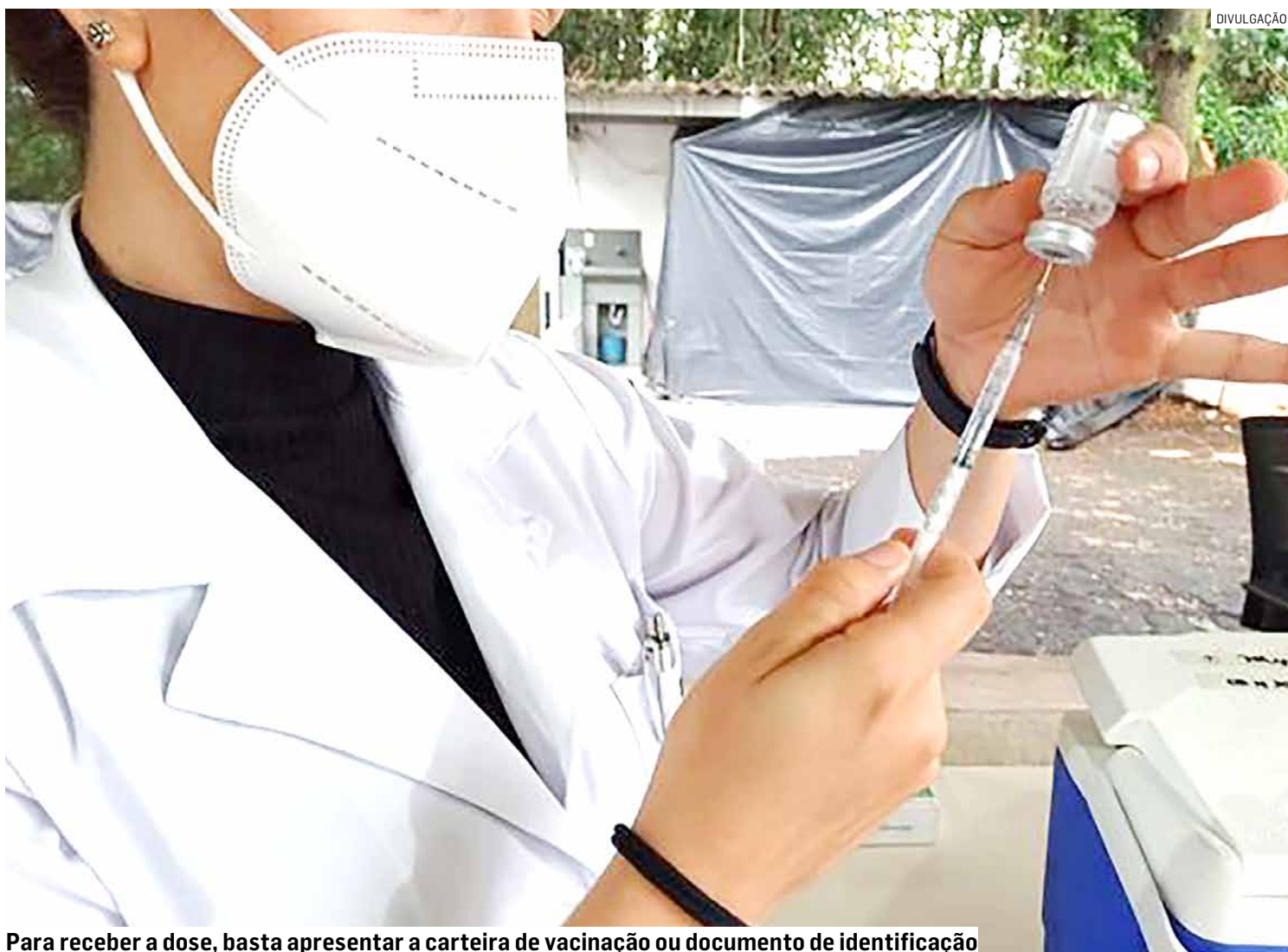
Para receber a dose, basta apresentar a carteira de vacinação ou documento de identificação

Além disso, a equipe de Controle da Dengue da Prefeitura de Sumaré realiza o