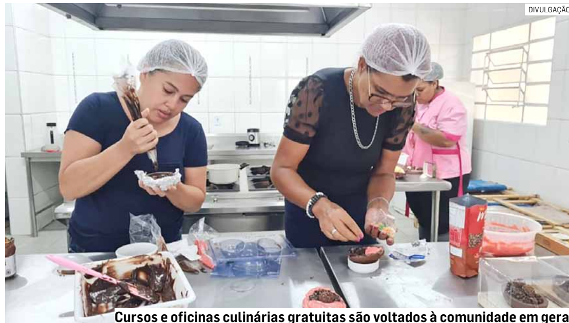
Cursos e oficinas culinárias gratuitas são voltados à comunidade em geral

A Prefeitura de Hortolândia lança, nesta sexta-feira (12), às 10h, o Projeto Cozinhamento. Aberto ao público, o evento de lançamento, com a presença de autoridades e convidados, será na Cozinha Escola Comunitária, órgão da Secretaria de Educação, Ciência e Tecnologia, localizada na Rua Osvaldo de Souza, 325, Jardim Novo Ângulo. O Cozinhamento é uma parceria com a Secretaria de