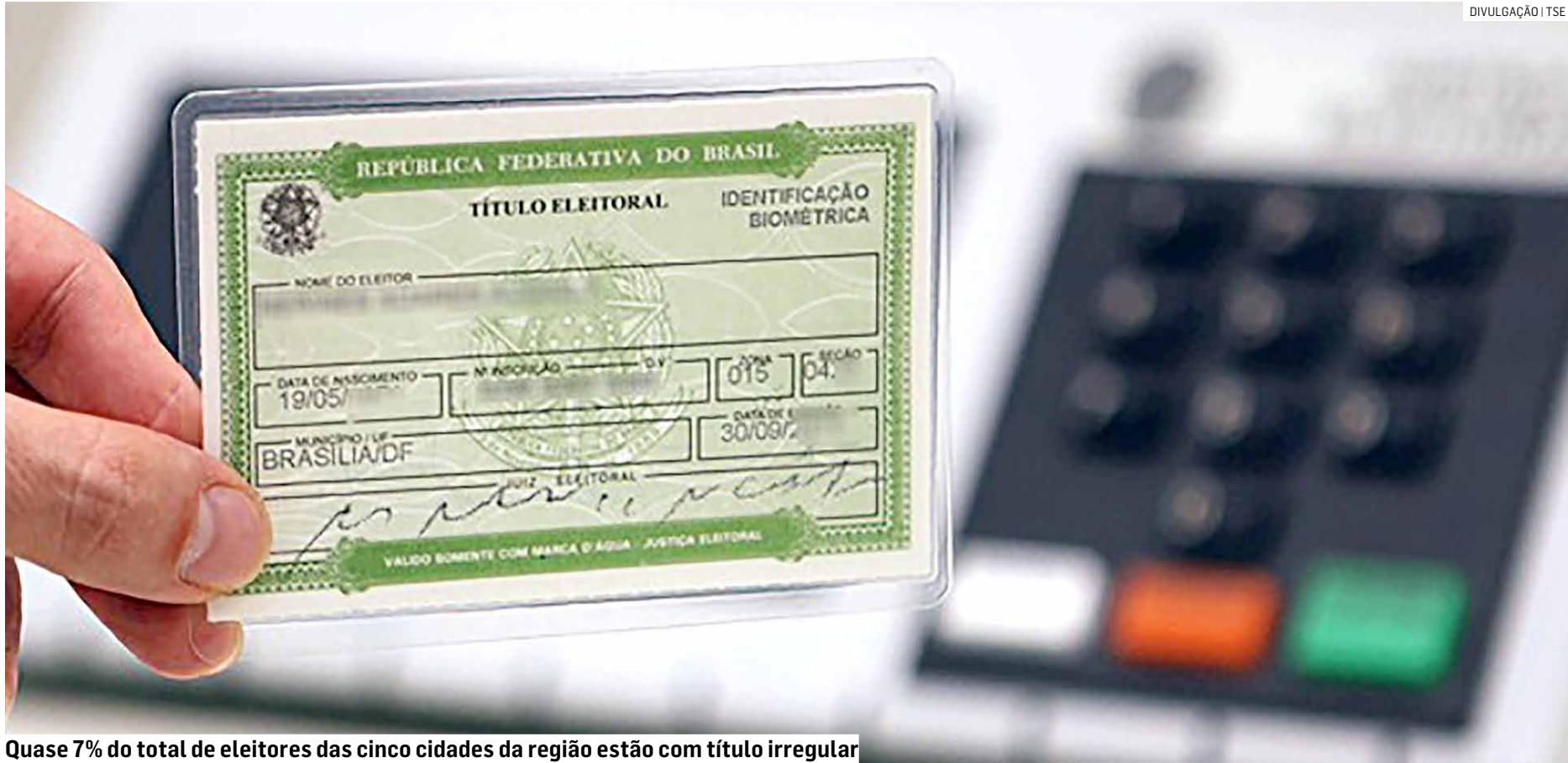
Quase 7% do total de eleitores das cinco cidades da região estão com título irregular

De acordo com o TRE-SP, o cancelamento de títulos eleitorais ocorre por vários motivos, entre eles a ausência nos três últimos turnos de votação ou na falta de comparação com a re-