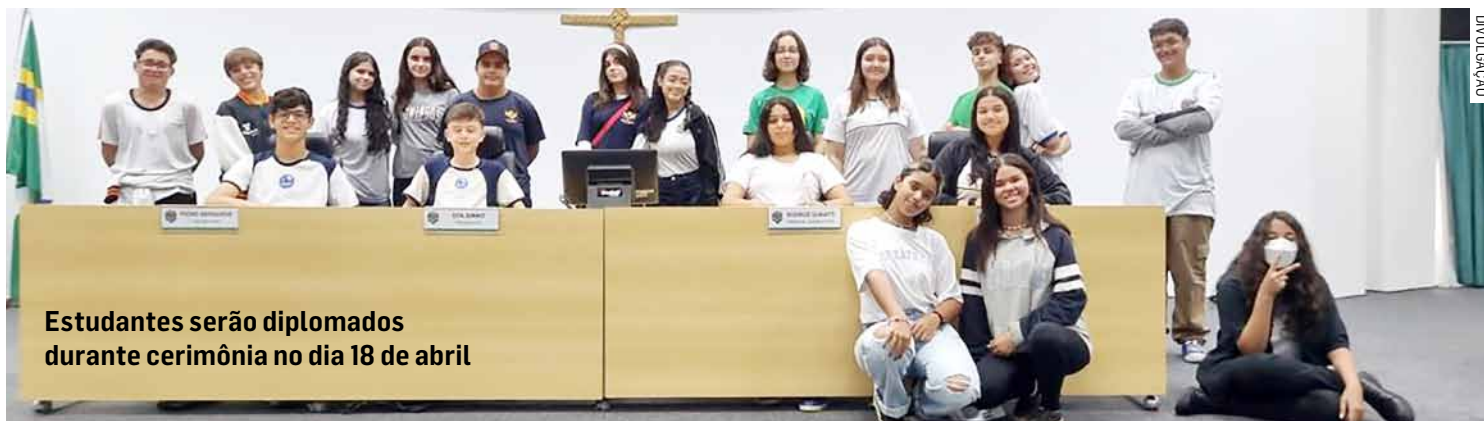
Estudantes serão diplomados durante cerimônia no dia 18 de abril

Da Redação • PAULÍNIA tribunaliberal@tribunaliberal.com.br