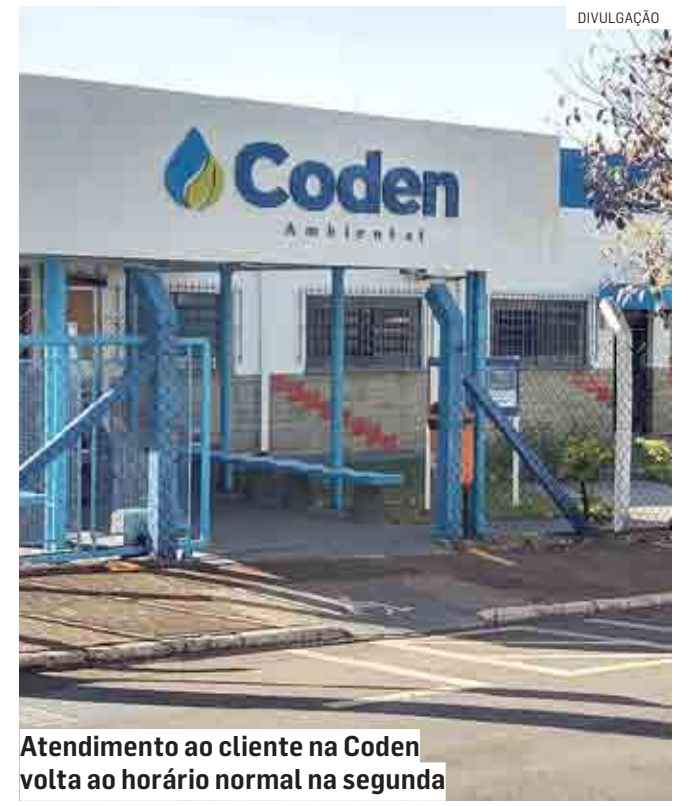
Atendimento ao cliente na Coden volta ao horário normal na segunda

Informações adicionais podem ser obtidas a qualquer momento junto ao SAC (Serviço de Atendimento ao Consumidor), por meio de ligação gratuita para 0800 771-1195.