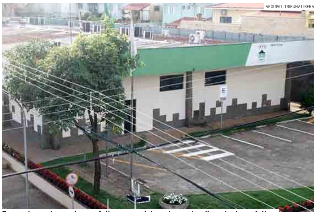
O parcelamento precisa ser feito presencialmente no atendimento da prefeitura

O parcelamento, junto ao processo de negociação, precisa ser feito no atendimento da prefeitura, presencialmente,