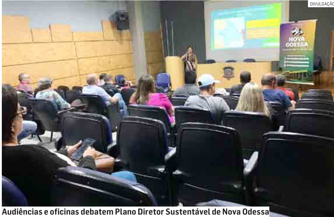
Audiências e oficinas debatem Plano Diretor Sustentável de Nova Odessa

partir das 18h15, tem como tema “Saneamento Básico”, com representantes da Secretaria de Meio Ambiente, da Coden Ambiental, dos Conselhos Municipais relacionados ao tema e demais interessados (como detalhado acima), bem como “de todos os representantes que a consultoria e a Secretaria de Obras acharem pertinentes”.