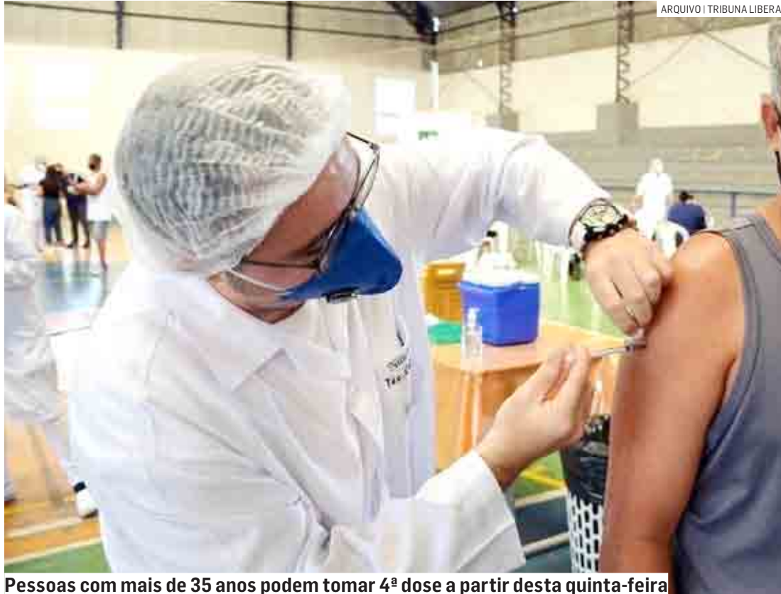
Pessoas com mais de 35 anos podem tomar 4ª dose a partir desta quinta-feira

A Vigilância Epidemiológica segue recomendando o uso de máscaras