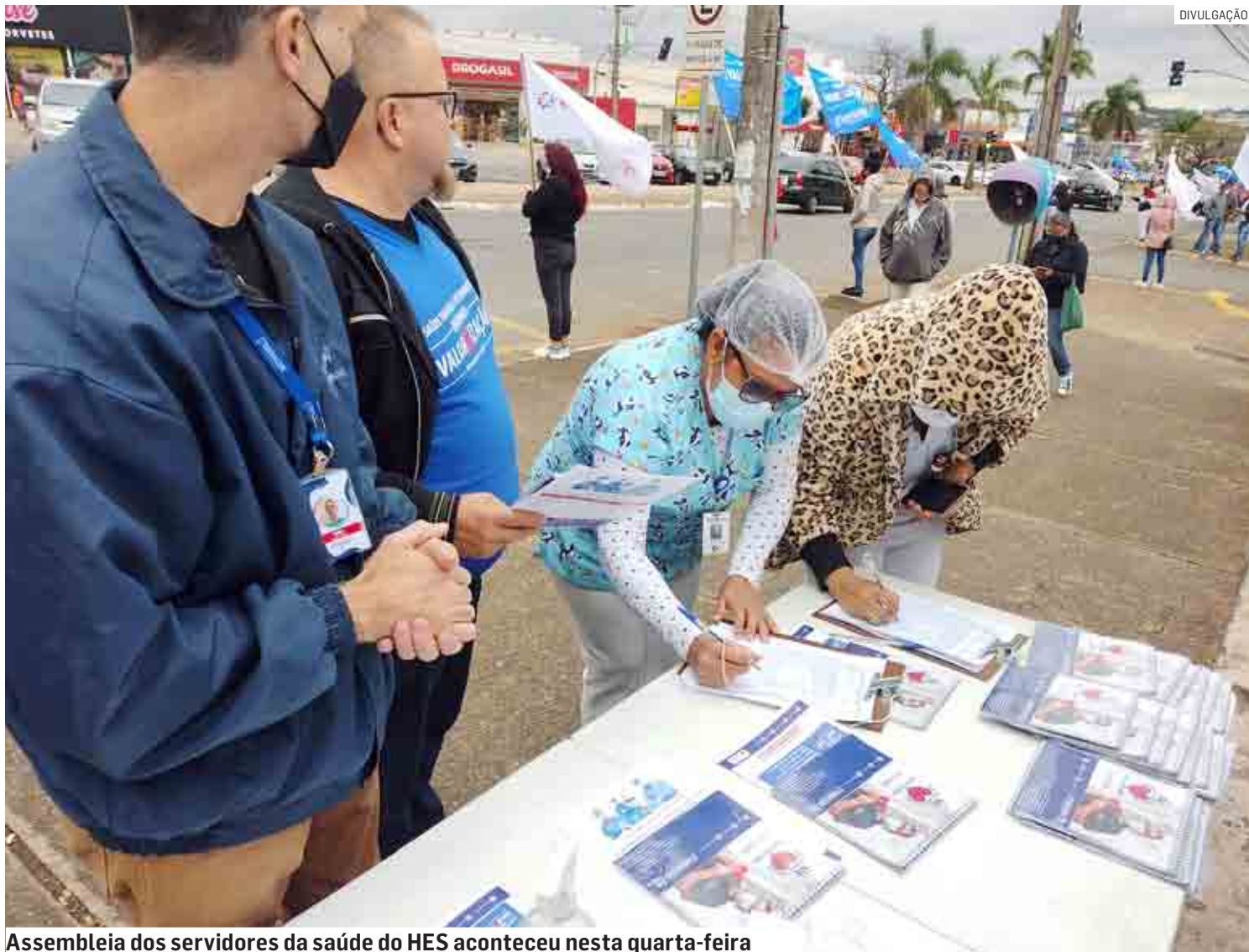
Assembleia dos servidores da saúde do HES aconteceu nesta quarta-feira