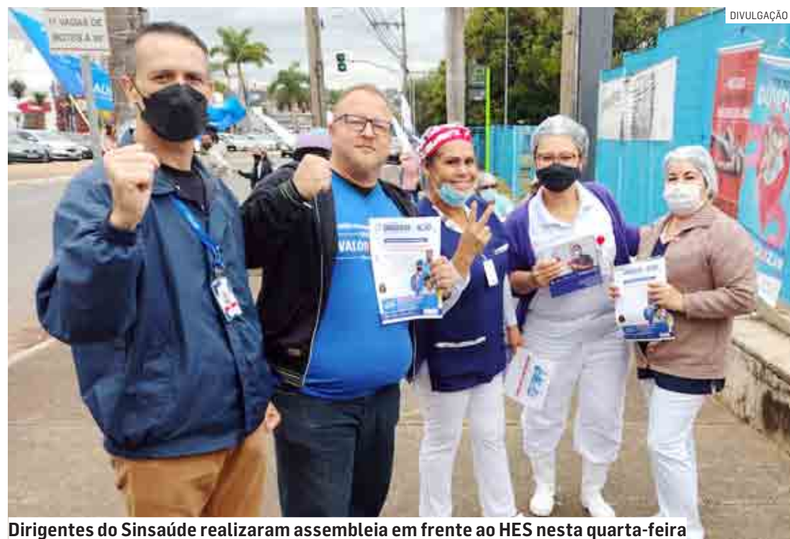
Dirigentes do Sinsauúde realizaram assembleia em frente ao HES nesta quarta-feira

SUMARÉ (CENTRO | NOVA VENEZA | PICERNO | MARIA ANTONIA | ÁREA CURA | MATÃO) ♦ HORTOLÂNDIA ♦ NOVA ODESSA ♦ MONTE MOR ♦ ELIAS FAUSTO ♦ PAULÍNIA ♦