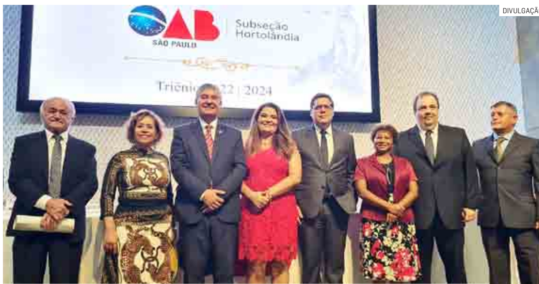
Diretoria da OAB de Hortolândia promove eventos no mês dedicado aos advogados