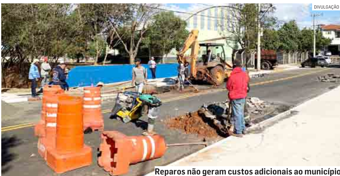
Reparos não geram custos adicionais ao município

Da Redação | NOVA ODESSA tribunaliberal@tribunaliberal.com.br