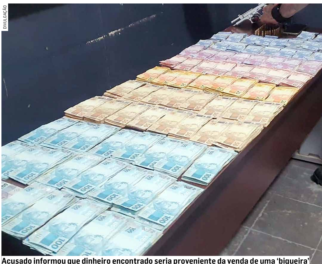
Acusado informou que dinheiro encontrado seria proveniente da venda de uma 'biqueira'

O homem foi conduzido ao Plantão Policial de Hortolândia, onde foi autuado pelo crime de porte ilegal de arma de fogo de calibre restrito.