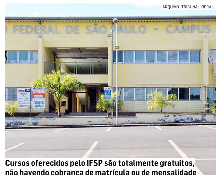
Cursos oferecidos pelo IFSP são totalmente gratuitos, não havendo cobrança de matrícula ou de mensalidade

A prova terá 30 questões de múltipla escolha, com quatro alternativas cada.