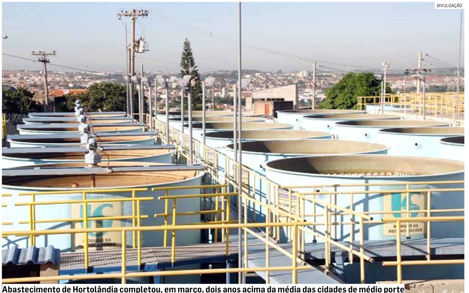
Abastecimento de Hortolândia completou, em março, dois anos acima da média das cidades de médio porte

O índice de satisfação atribuído aos serviços públicos avaliados pela Indsat segue metodologia exclusiva, resultando em um único número de até 1.000 pontos. A pontuação é atingida através do cálculo dos percentuais de ótimo, bom, regu-