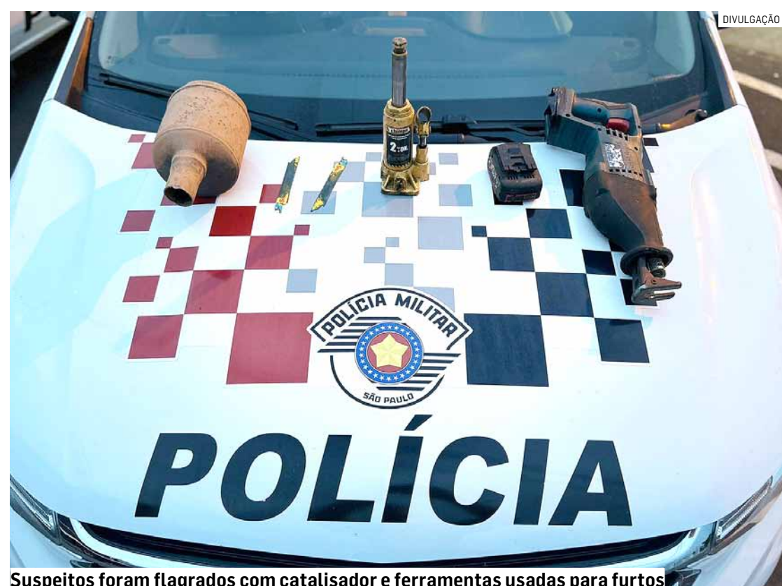
Suspeitos foram flagrados com catalisador e ferramentas usadas para furtos