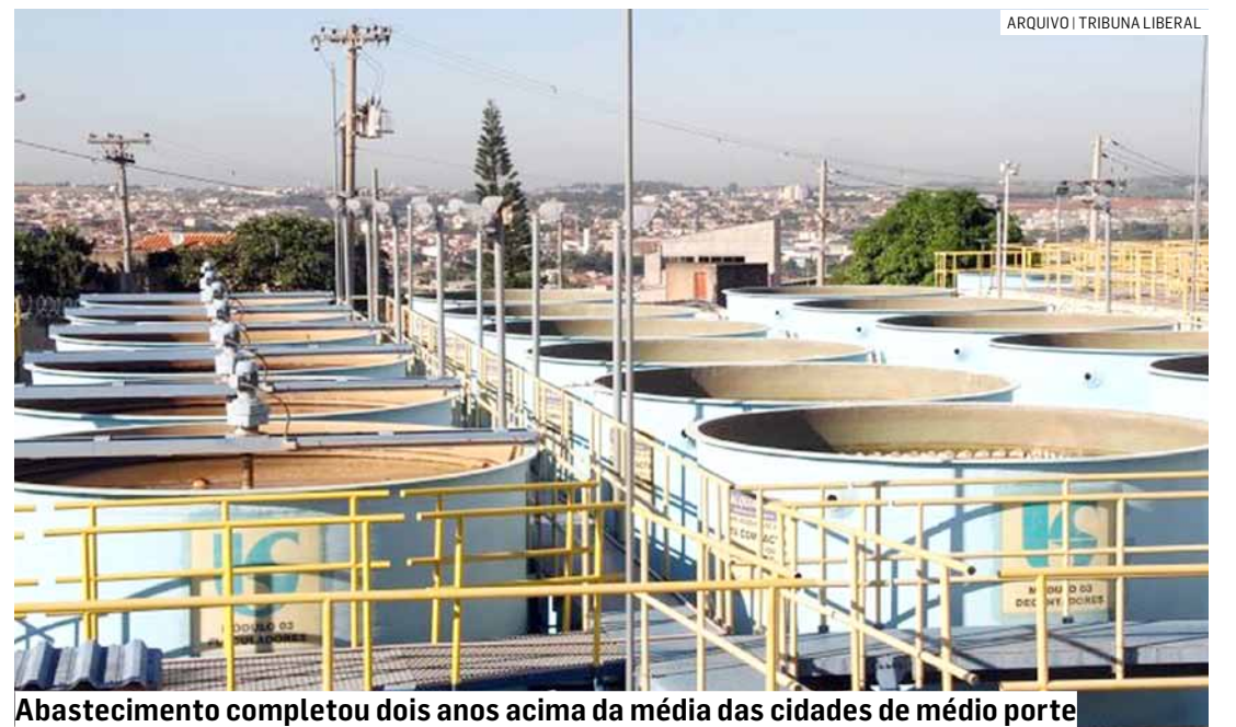
Abastecimento completou dois anos acima da média das cidades de médio porte