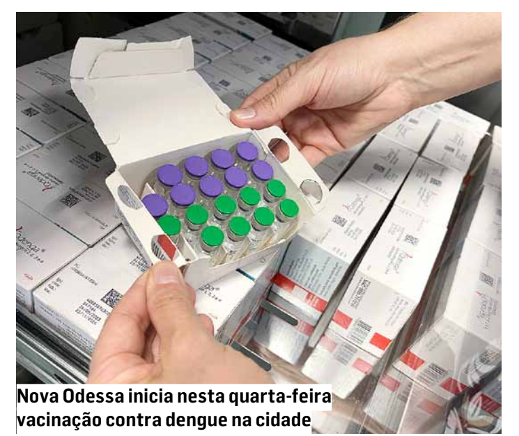
Nova Odessa inicia nesta quarta-feira vacinação contra dengue na cidade

Enquanto isso, prosseguem diariamente as ações da equipe antidengue do Setor de Zoonoses da prefeitura no combate ao mosquito transmissor do vírus da doença, o Aedes aegypti . Nova Odessa não registrou nenhum óbito confirmado por dengue neste e no ano passado. A cidade contabiliza atualmente 1.355 casos positivos. | Da Redação