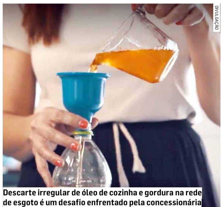
Descarte irregular de óleo de cozinha e gordura na rede de esgoto é um desafio enfrentado pela concessionária

Para combater esse problema em Sumaré, a BRK lançou em novembro de