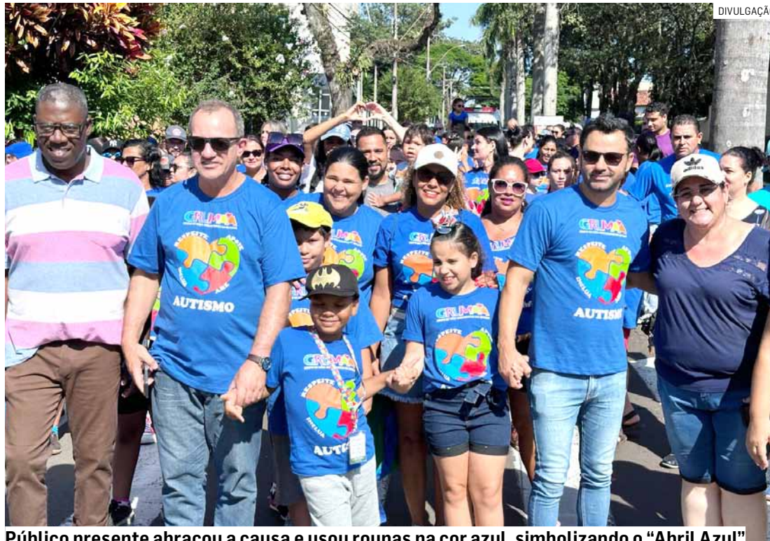
Público presente abraçou a causa e usou roupas na cor azul, simbolizando o “Abril Azul”

A participação foi aberta à população e todos os presentes abraçaram a causa e se mobilizaram em