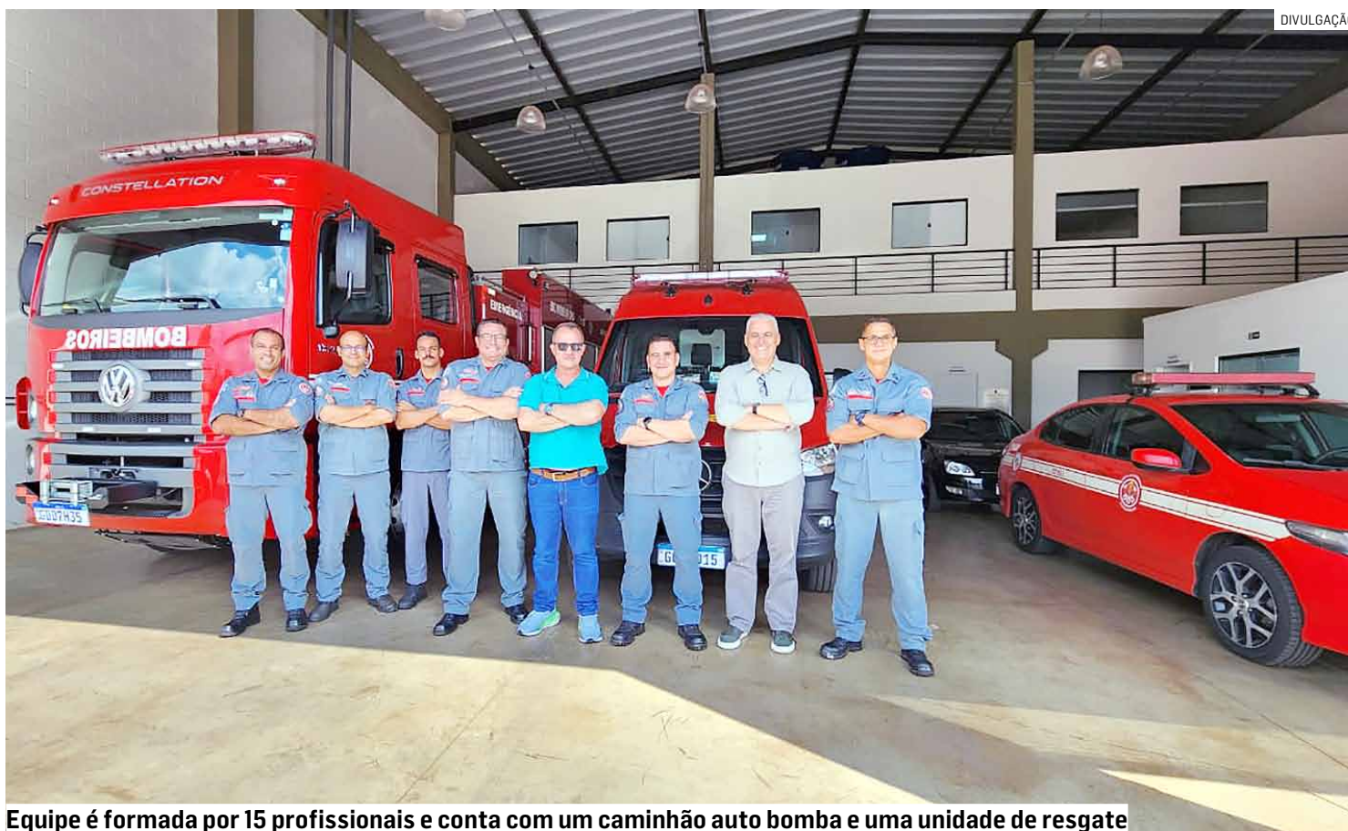
Equipe é formada por 15 profissionais e conta com um caminhão auto bomba e uma unidade de resgate