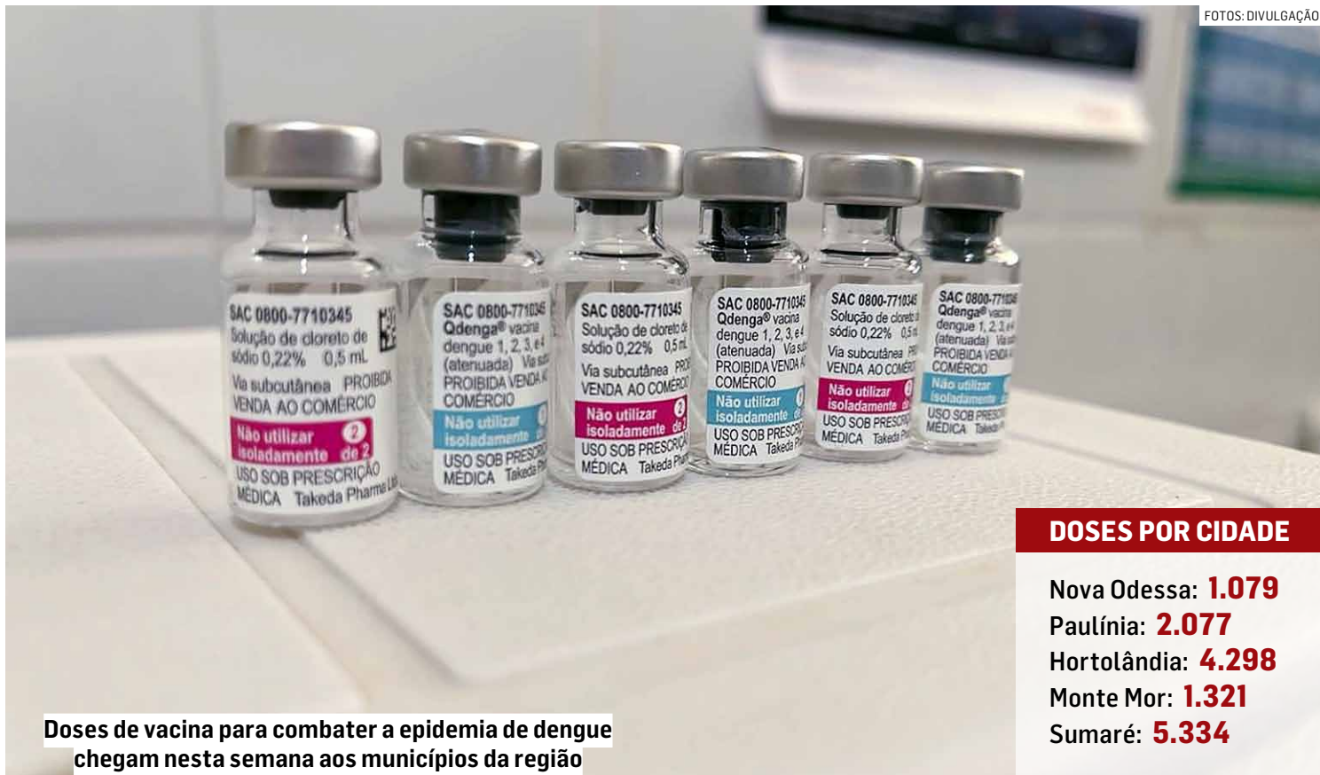
Doses de vacina para combater a epidemia de dengue chegam nesta semana aos municípios da região

A medida acontece depois de o Ministério da Saúde considerar a epidemia na RMC (Região Metropolitana de Campinas). Ago-