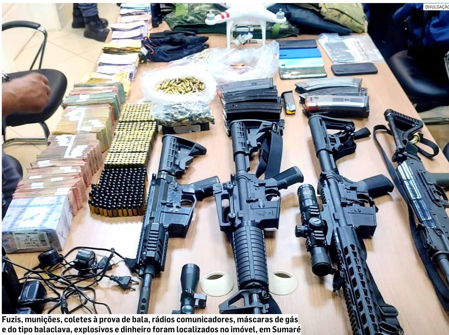
Fuzis, munições, coletes à prova de bala, rádios comunicadores, máscaras de gás e do tipo balaclava, explosivos e dinheiro foram localizados no imóvel, em Sumaré

Policiais militares do 1º Baep (Batalhão de Ações Especiais de Polícia) prenderam dois homens e um foi morto em troca de tiros com a guarnição na noite desta segunda-feira (8), na rua Fernando Cândido da Silva, no Jardim Calegari, em Sumaré. A equipe de ações especiais foi informada que envolvidos em um roubo a banco e a carros-fortes estariam em uma residência no bairro. De acordo com os policiais, a morte e as prisões aconteceram durante as buscas pelos envolvidos nos três casos. O primeiro suspeito foi encontrado na Rodovia dos Bandeirantes, em Hortolândia, por onde passava com uma Land Rover de cor preta, um ex-policia militar era o suspeito que dirigia o veículo. Dentro do carro foram encontrados dispositivos conhe-