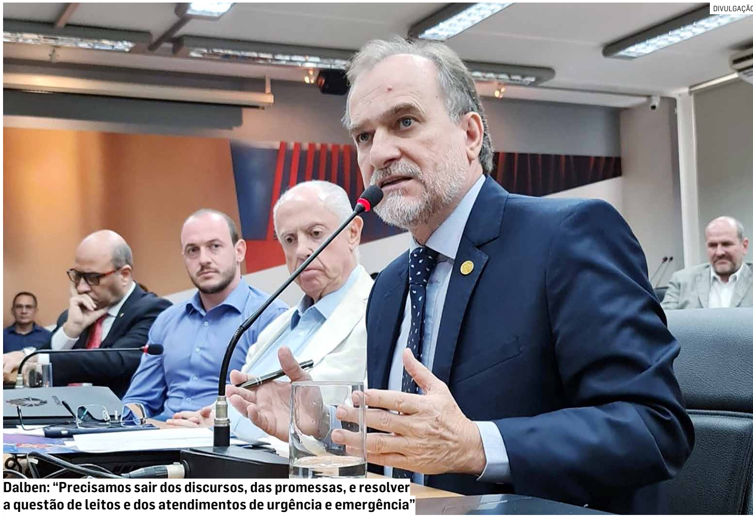
Dalben: “Precisamos sair dos discursos, das promessas, e resolver a questão de leitos e dos atendimentos de urgência e emergência”

“Vamos trabalhar para aumentar os recursos em benefício da Unicamp. Nosso mandato entende a importância das unidades administradas pela universi-