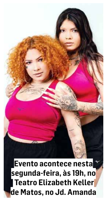
Evento acontece nesta segunda-feira, às 19h, no Teatro Elizabeth Keller de Matos, no Jd. Amanda