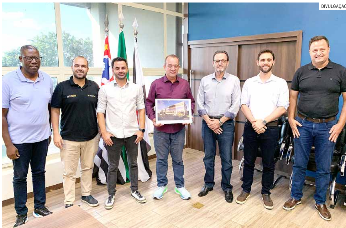
Executivos da empresa confirmaram inauguração da unidade para o último trimestre de 2024

“Desejamos sucesso para a Desktop, e agradecemos pela empresa ter escolhido Nova Odessa para instalar essa grande unidade. Nossa gestão está sempre de portas abertas para os empreendedores que vêm gerar renda e empregos para