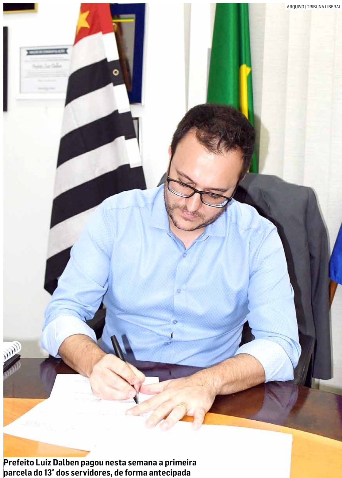
Prefeito Luiz Dalben pagou nesta semana a primeira parcela do 13º dos servidores, de forma antecipada

Legislação fixa revisão geral anual aos colaboradores ativos, inativos e pensionistas da Prefeitura, além de reposição por defasagem de 0,5%, garantindo uma política salarial atualizada de servidores de diversas áreas da administração