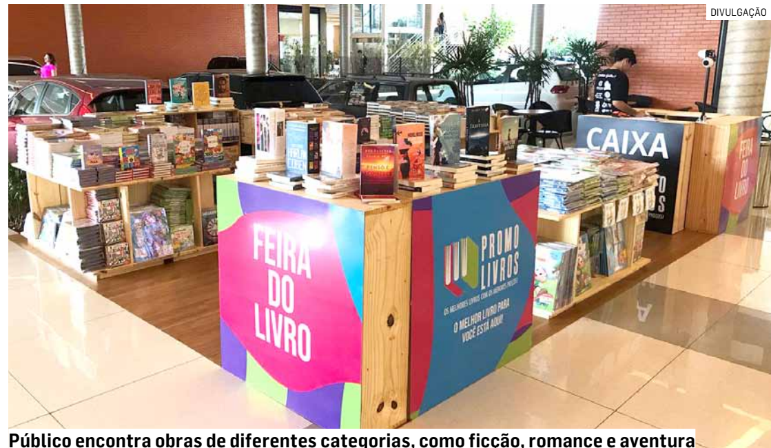
Público encontra obras de diferentes categorias, como ficção, romance e aventura

“O hábito de ler tem inúmeros benefícios, estimula a criatividade e aprimora a comunicação. Com a Feira do Livro Boralé, o Shopping ParkCity Sumaré oferece mais uma opção de compra