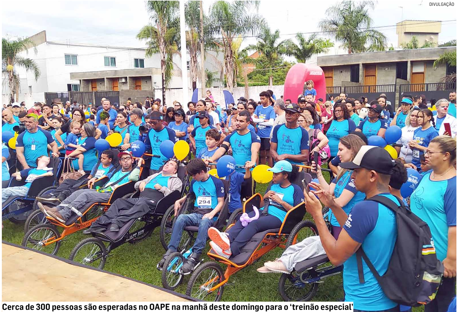
Cerca de 300 pessoas são esperadas no OAPE na manhã deste domingo para o 'treinão especial'

Durante a atividade, é ofertada um café da manhã aos participantes e, neste, alusivo à Páscoa, haverá a presença especial do Coelho da Páscoa que fará a distribuição de chocolates às crianças. Haverá ainda um grupo que fará pintura em rosto e uma equipe de saúde que fará teste de glicemia e aferição da pressão arterial. "Deus é bom o tempo todo. Além de termos um grupo super unido, a cada dia novos parceiros acabam aderindo ao nosso propósito e passam a fazer parte da família Pernas Voluntárias. Agradeço a todos e a Prefeitura de Hortolândia, por meio do prefeito Zezé Gomes, pelo apoio. Tudo isso é feito com muito carinho e com a participação de muitas pessoas. A todos a minha gratidão e, sem dúvida, teremos mais um be-