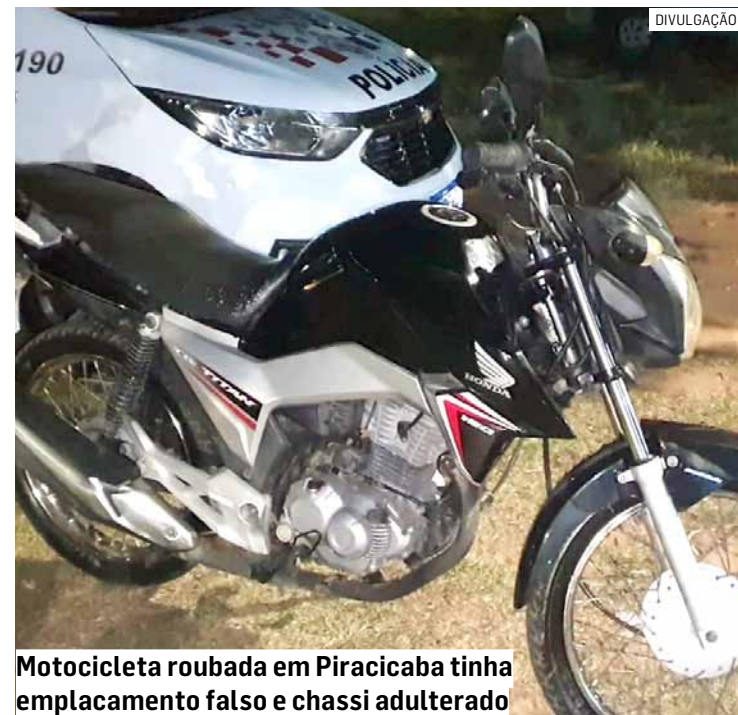
Motocicleta roubada em Piracicaba tinha emplacamento falso e chassi adulterado

Interrogado, o criminoso confessou que usou a rede social para atrair o comerciante para uma emboscada.