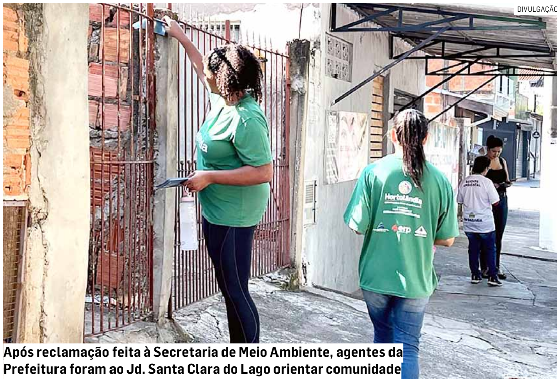
Após reclamação feita à Secretaria de Meio Ambiente, agentes da Prefeitura foram ao Jd. Santa Clara do Lago orientar comunidade

Agentes ambientais da Prefeitura de Hortolândia realizaram ação educativa, com foco no descarte correto de resíduos orgânicos, no Jd. Santa Clara do Lago II. A ação aconteceu, na manhã desta quarta-feira (03/04), após reclamação feita à Secretaria de Meio Ambiente e Desenvolvimento Sustentável, sobre descarte incorreto de resíduos que vinha ocorrendo nas proximidades do OAPE (Observatório Ambiental Parque Escola), órgão da Administração Municipal.