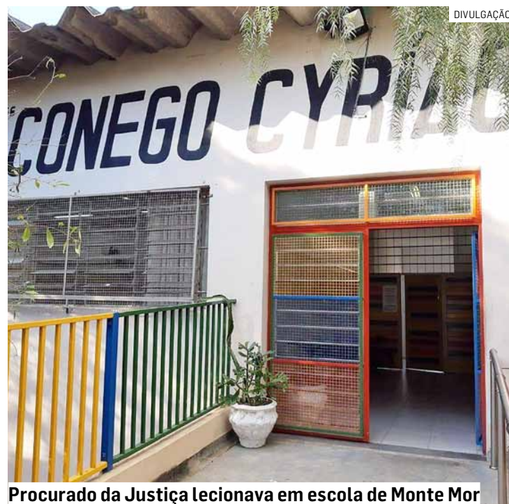
Procurado da Justiça lecionava em escola de Monte Mor

do até a Delegacia do município de Monte Mor, onde o delegado determinou o cumprimento do mandado de prisão, permanecendo o indivíduo à disposição da justiça.