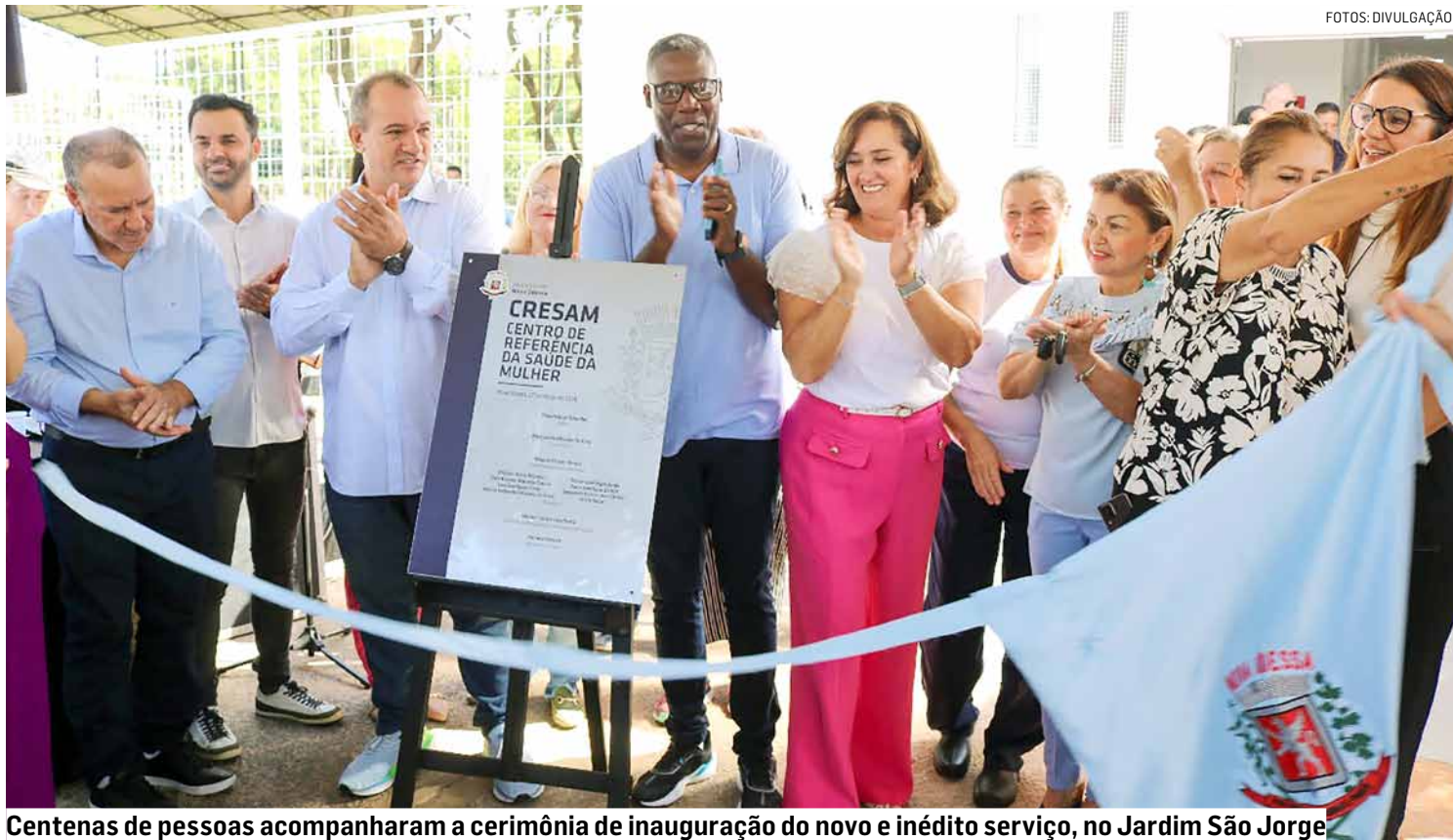
Centenas de pessoas acompanharam a cerimônia de inauguração do novo e inédito serviço, no Jardim São Jorge

As obras do CRESAM foram iniciadas em 2019, ainda na gestão anterior, mas abandonadas logo em seguida. Em função da interrupção da obra inacabada, uma emenda parlamentar