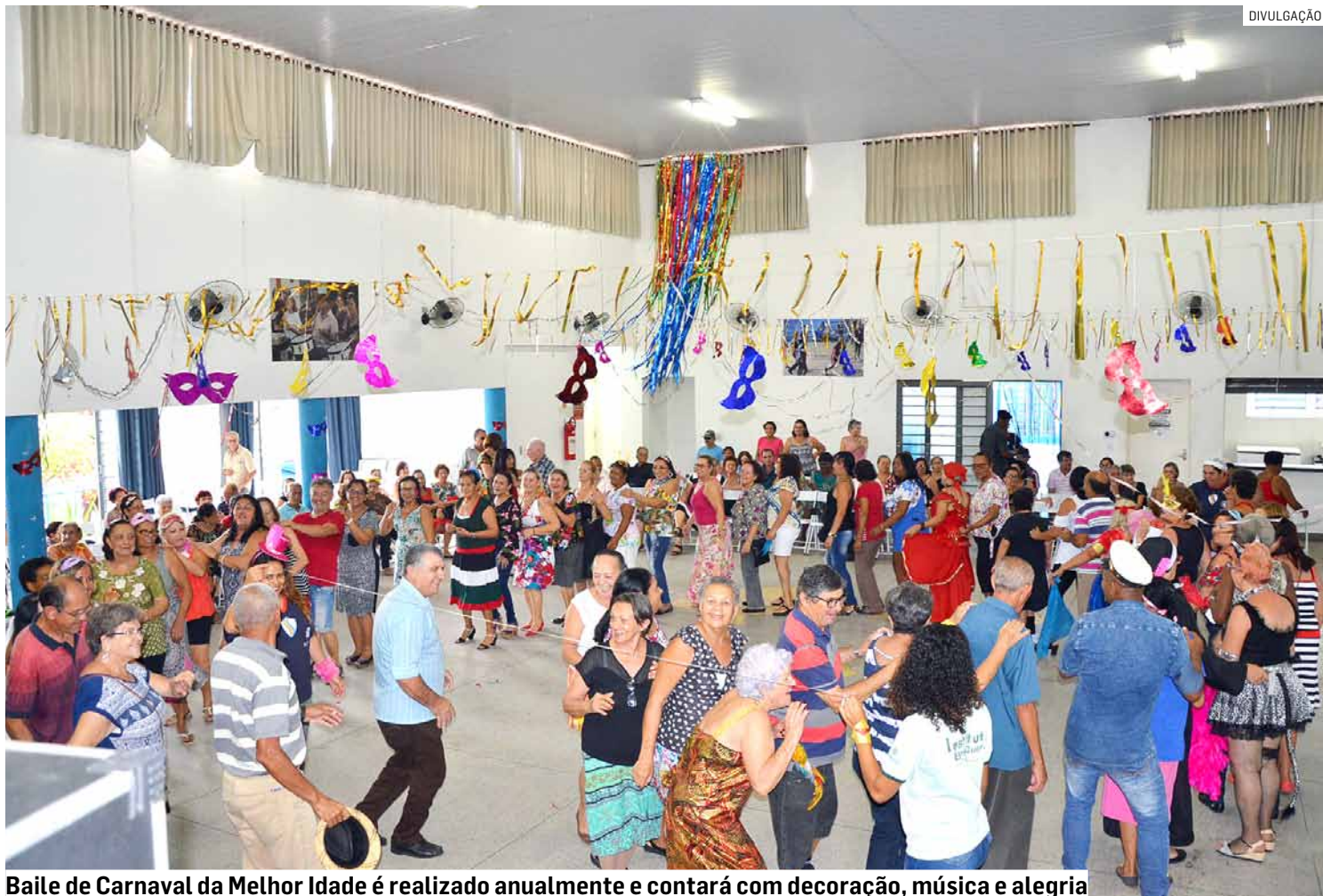
Baile de Carnaval da Melhor Idade é realizado anualmente e contará com decoração, música e alegria

"Anualmente temos nosso tradicional Baile de Carnaval da Melhor Idade, com decoração, as marchinhas, música ao vivo e premiação de diversas categorias, contagiando a todos com muita animação e