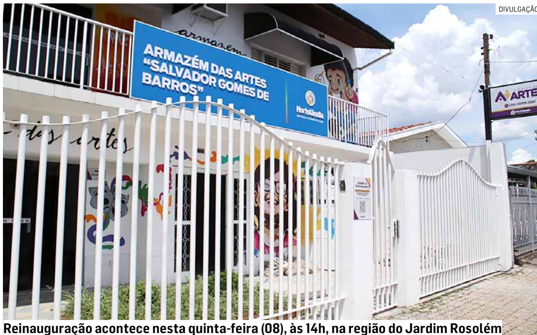
Reinauguração acontece nesta quinta-feira (08), às 14h, na região do Jardim Rosolém

O local contará ainda com uma praça de convivência, onde também serão realizadas atividades, que fica no fundo do local, além de salas administrativas, de coordenação e recepção.