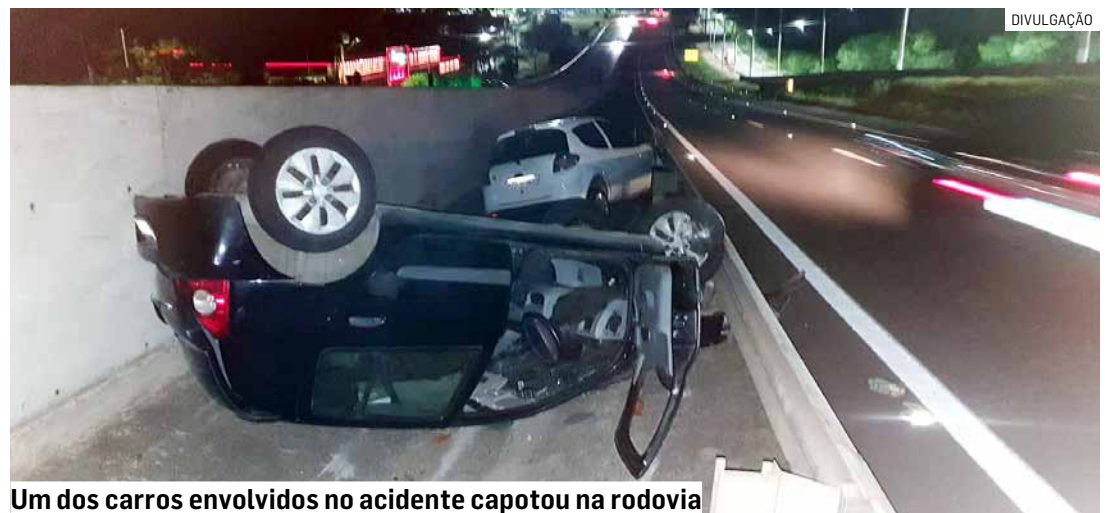
Um dos carros envolvidos no acidente capotou na rodovia

Cézar Oliveira • HORTOLÂNDIA tribunaliberal@tribunaliberal.com.br