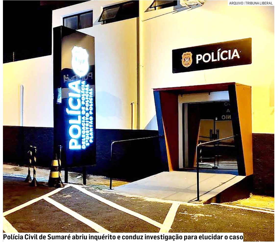
Polícia Civil de Sumaré abriu inquérito e conduz investigação para elucidar o caso

A ocorrência foi apresentada no Plantão Policial de Sumaré. A namorada do homem foi liberada após sua oitiva. As munições foram apreendidas.