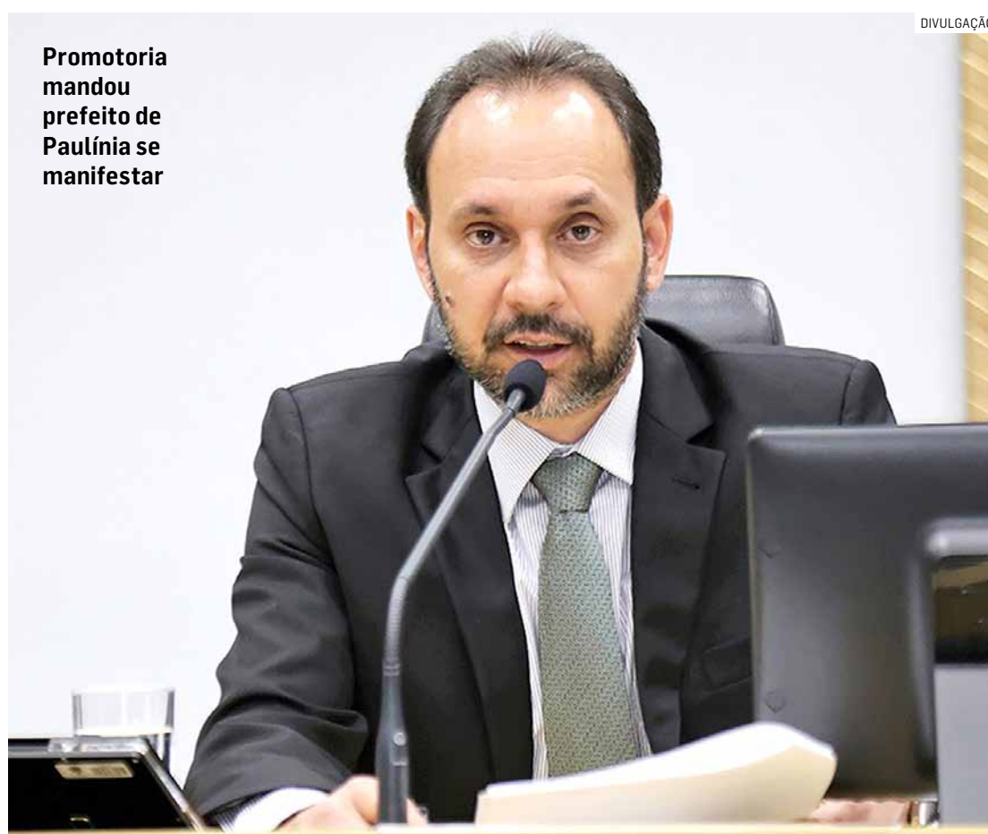
Promotora mandou prefeito de Paulínia se manifestar

“A publicidade dos estudos técnicos referentes aos temas das audiências públicas não estão respeitando os prazos das publicações dos editais de convocação das referidas audiências públicas. Prejudicando assim o amplo debate que é o foco precípua de uma audiência pública”, argumentou o morador.