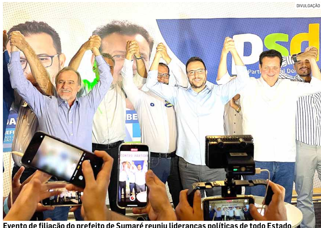
Evento de filiação do prefeito de Sumaré reuniu lideranças políticas de todo Estado

Também participam do encontro partidário do PSD o deputado estadual Oseias de Madureira (PSD), os prefeitos Dário Saadi (Campinas), Gustavo Reis (prefeito de Jaguariúna e presidente do Conselho de Desenvolvimento da Região Metropolitana de Campinas), Mário Botion (prefeito de Limeira e presidente do Conselho de Desenvolvimento da Região