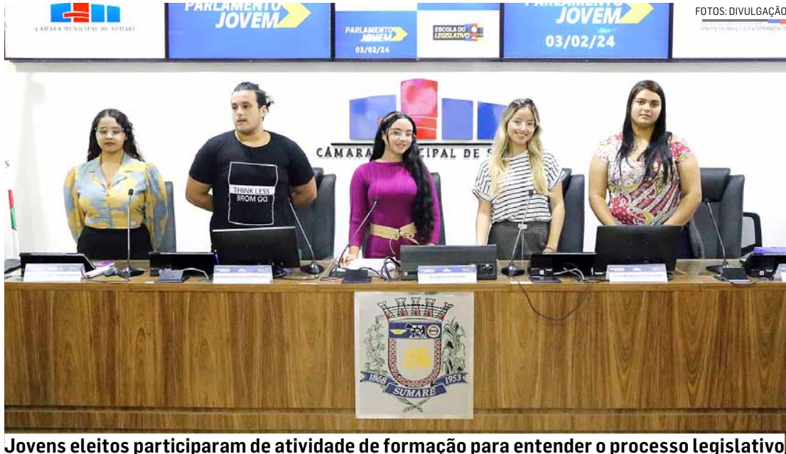
Jovens eleitos participaram de atividade de formação para entender o processo legislativo