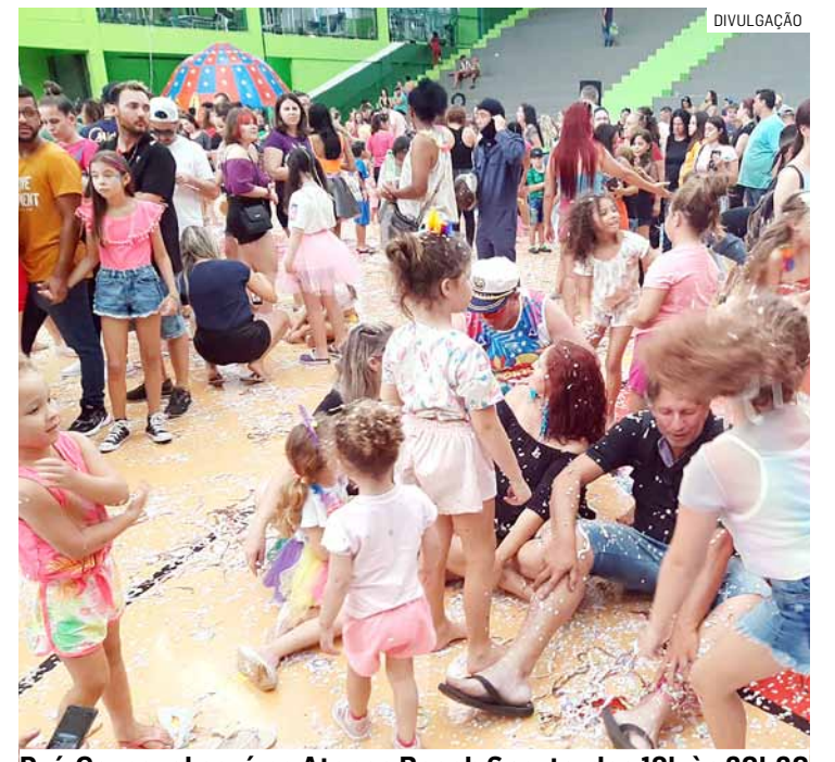
Pré-Carnaval será no Atenas Beach Sports, das 19h às 20h30

Vai ter diversas atividades, como brincadeiras, brinquedos infláveis gratuitos e pintura facial. Vai ter praça de alimentação, mas a venda e consumo de bebidas alcoólicas estão novamente proibidos no CarnaKids.