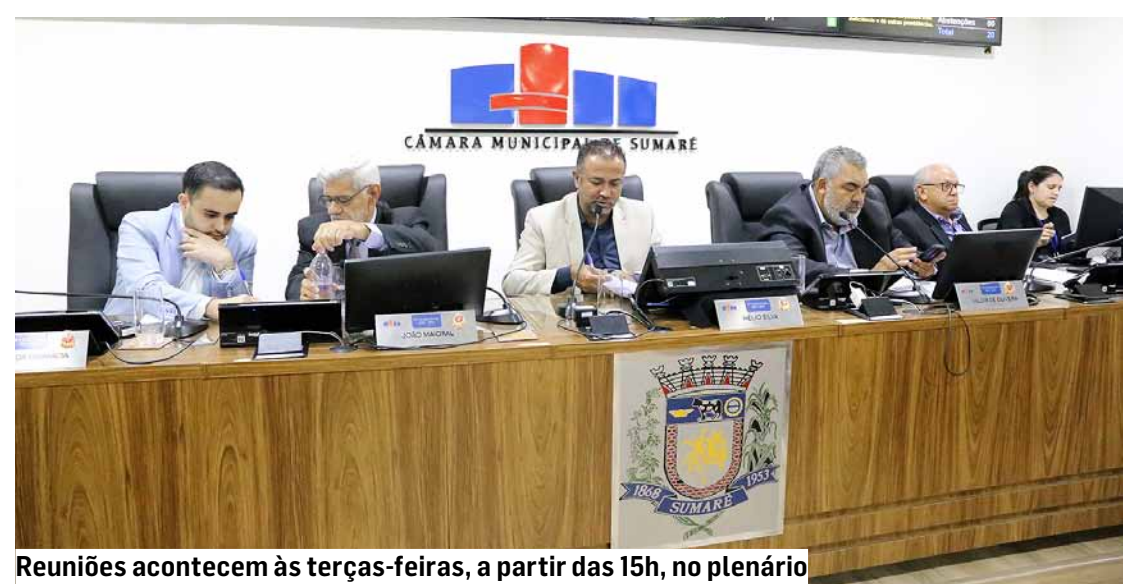
Reuniões acontecem às terças-feiras, a partir das 15h, no plenário