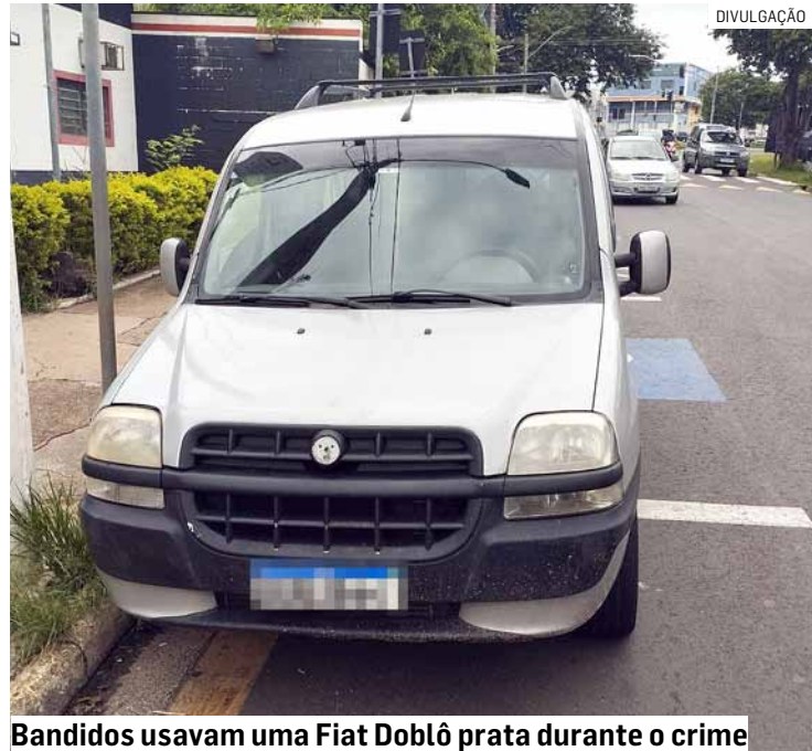
Bandidos usavam uma Fiat Doblo prata durante o crime