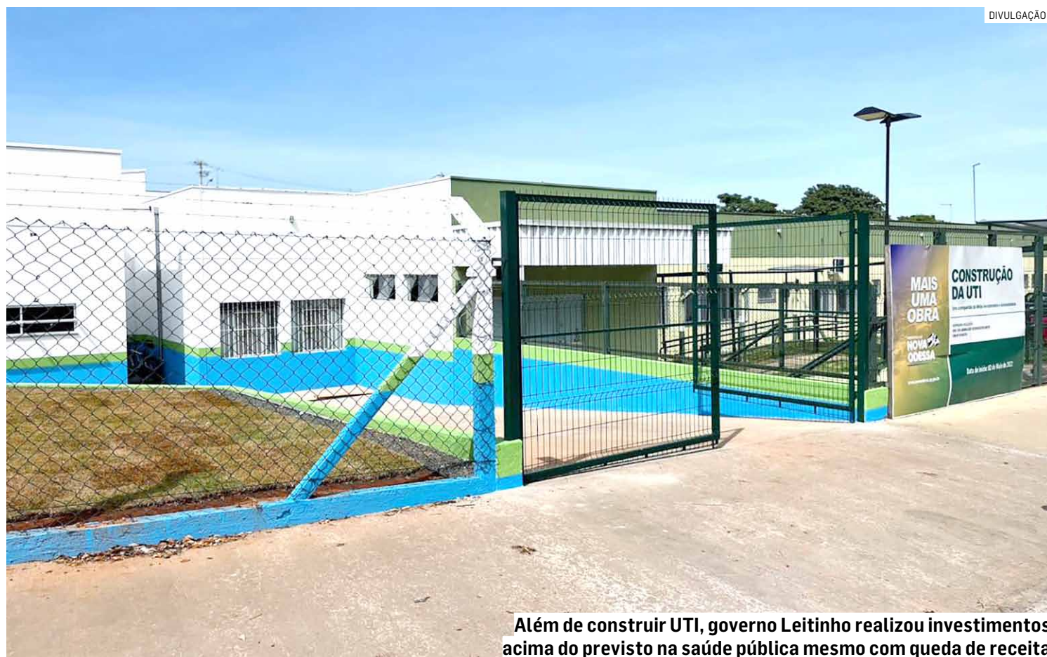
Além de construir UTI, governo Leitinho realizou investimentos acima do previsto na saúde pública mesmo com queda de receita

Mesmo assim, apenas no custeio mensal da rede pública e em novos investimentos na Saúde da população, a Prefeitura aplicou em 2023 um recorde de R$ 99,2 milhões, o equivalente a 39,2% das receitas. Lembrando que, pela Constituição, os municípios deveriam investir apenas 15% do seu orçamento anual em Saúde. Foram R$