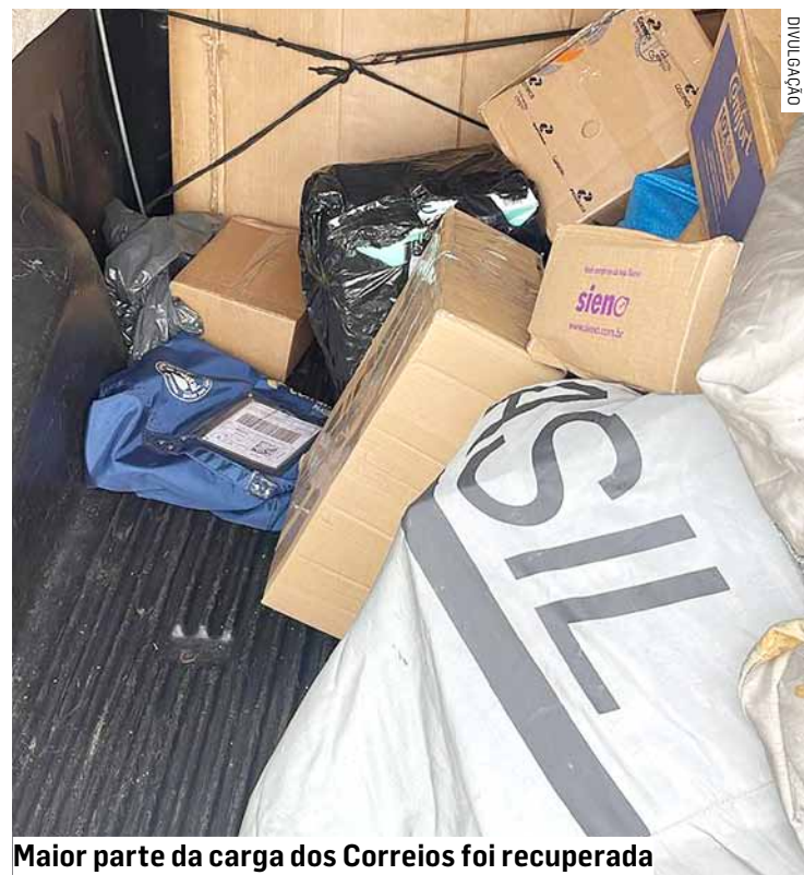
Maior parte da carga dos Correios foi recuperada

O acusado foi encaminhado ao 3º Distrito Policial de Sumaré, onde o delegado determinou pela prisão em flagrante do suspeito pelo crime de roubo.