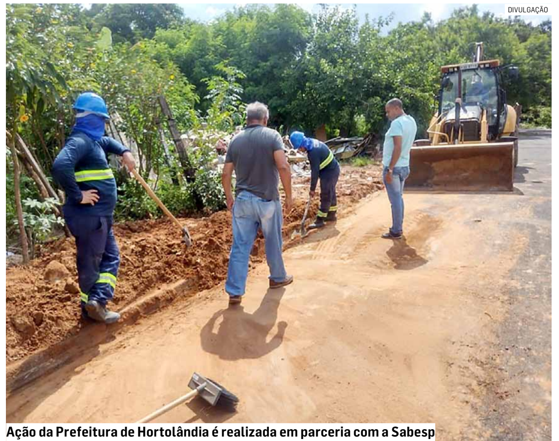
Ação da Prefeitura de Hortolândia é realizada em parceria com a Sabesp

Como parte da iniciativa, os cidadãos têm a oportunidade de colaborar relatando ligações irregulares de esgoto. O aplicativo Agenda Verde, permite que os moradores façam denúncias por meio de seus dispositivos móveis. A identidade dos denunciadores é mantida em sigilo absoluto. Além disso, é possível reportar casos por telefone, ligando para a Secretaria de Serviços Urbanos através do número (19) 3897-9800.