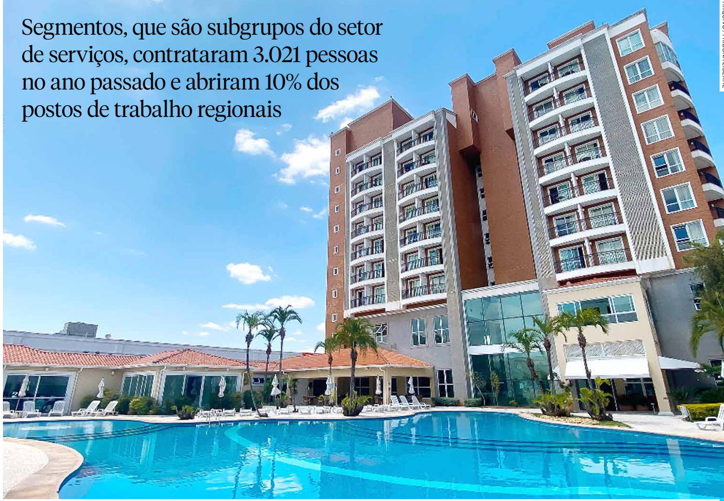
Números de empregos gerados mostram a volta dos turistas de negócios e de frequentadores de eventos e show para região

Segmentos, que são subgrupos do setor de serviços, contrataram 3.021 pessoas no ano passado e abriram 10% dos postos de trabalho regionais