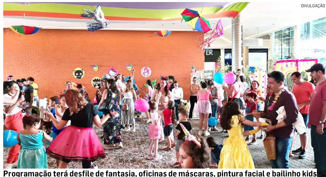
Programação terá desfile de fantasia, oficinas de máscaras, pintura facial e bailinho kids

Da Redação • SUMARÉ tribunaliberal@tribunaliberal.com.br