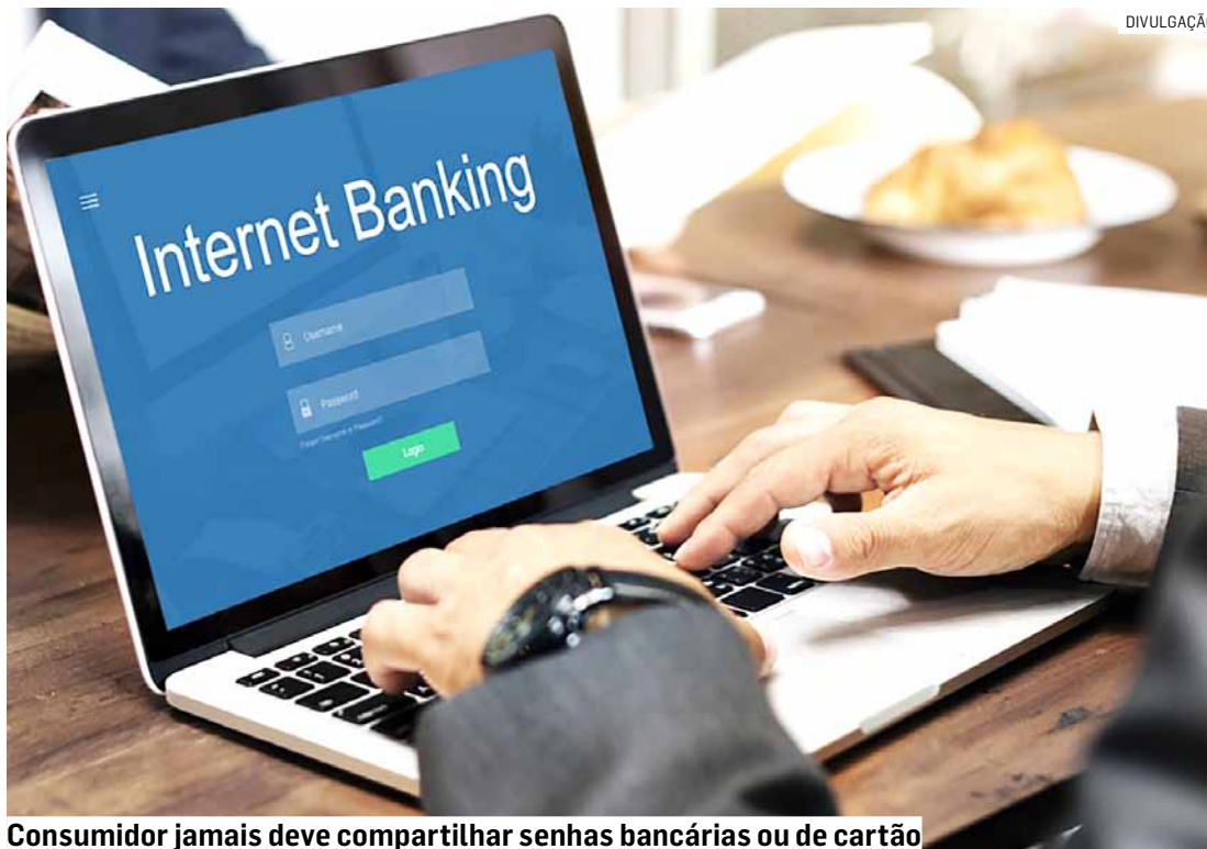
Consumidor jamais deve compartilhar senhas bancárias ou de cartão

A partir do contato, os golpistas tentam conquistar a confiança do consumidor por meio da chamada engenharia social, que são técnicas de manipulação psicológica para induzir o consumidor a fornecer dados pessoais, senhas de cartão ou outras informações. Ao conquistar a confiança do consumidor, o golpista faz com que ele acesse um link ou baixe um programa para que possa ter acesso remoto ao celular do consumidor e ao aplicativo do banco onde ele tenha conta.