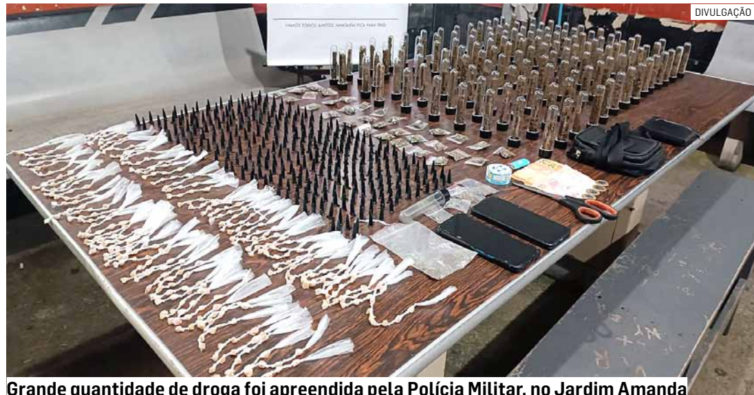
Grande quantidade de droga foi apreendida pela Polícia Militar, no Jardim Amanda

indivíduos havia uma sacola recheada de entorpecentes. Foram apreendidos 140 tubetes e 32 papelotes de maconha, 300 porções de cocaína e 400 pedras de crack. Os dois homens foram encaminhados ao Plantão Policial, onde ficaram presos. Os entorpecentes foram apreendidos.