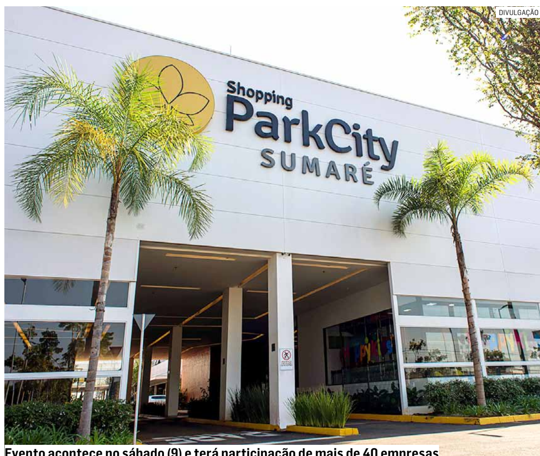
Evento acontece no sábado (9) e terá participação de mais de 40 empresas

Da Redação • SUMARÉ tribunaliberal@tribunaliberal.com.br