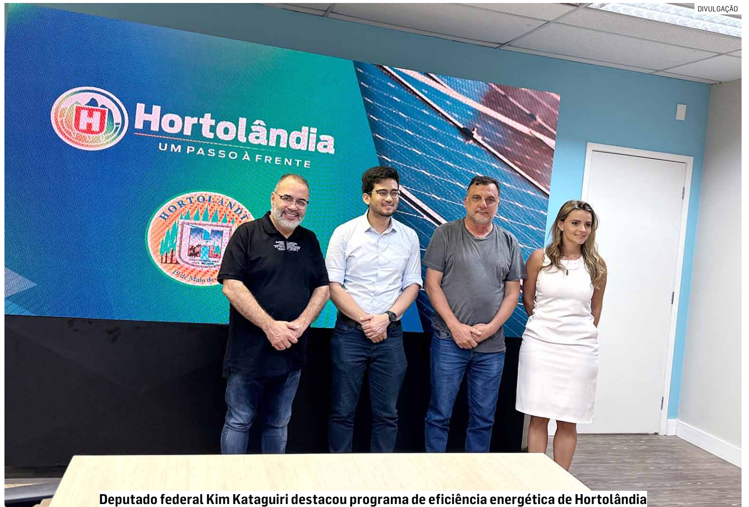
Deputado federal Kim Kataguiri destacou programa de eficiência energética de Hortolândia

“Entregaremos em abril um dos Paços Municipais mais eficientes e econômicos do Brasil. Uma sede autossustentável com 10mil m 2 de construção em um complexo de 60mil m 2 arborizado, que viabiliza também espaços de lazer, cultura e serviços públicos para a população. Com a estratégia utilizada, economizaremos cerca de R$ 7 milhões por ano que hoje são gastos com aluguéis e mais R$ 5 milhões ao ano que são utilizados para pagar a conta de energia elétrica da Prefeitura. Esse é um ganho para a cidade, que refletirá diretamente na melhor prestação de serviços públicos para a população hortolan-