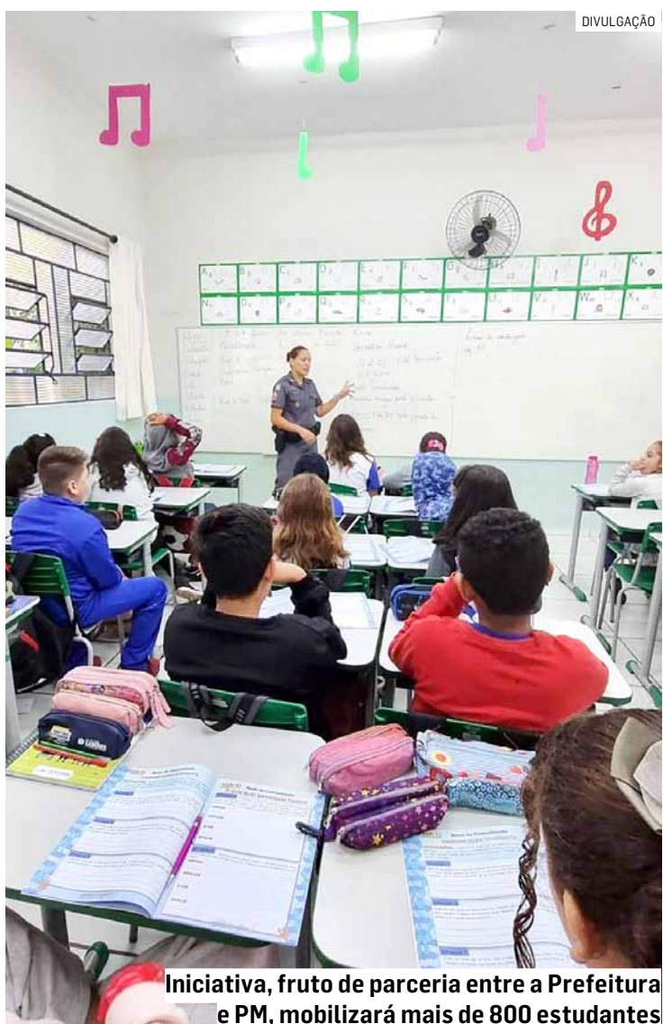
Iniciativa, fruto de parceria entre a Prefeitura e PM, mobilizará mais de 800 estudantes

Da Redação • HORTOLÂNDIA tribunaliberal@tribunaliberal.com.br