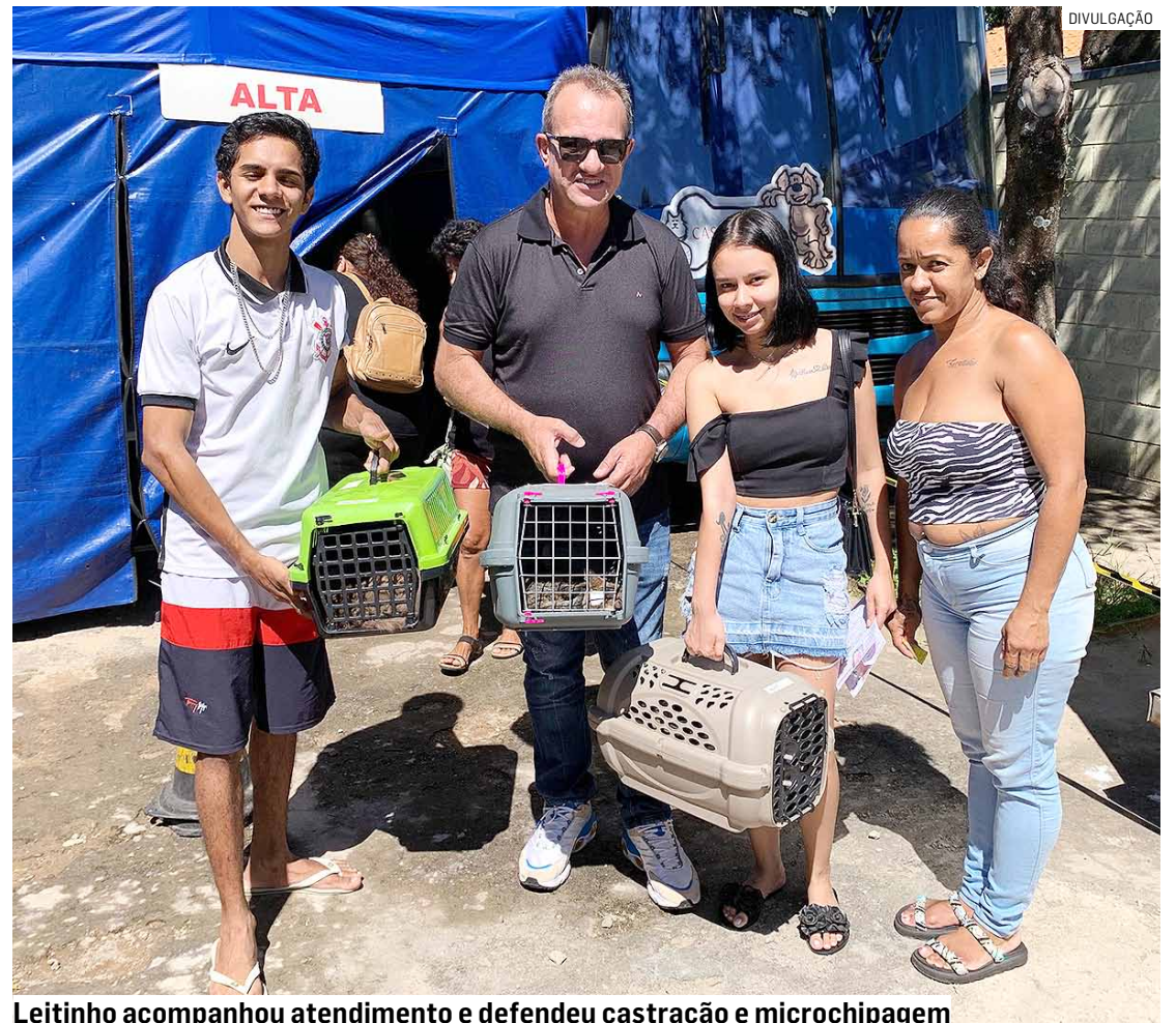
Leitinho acompanhou atendimento e defendeu castração e microchipagem

“Há 40 anos, quando eu era jovem, tinha muitas cadelas com filhotes pelas ruas, mas hoje você não vê mais isso, graças à castração. Eu comecei esse projeto há quase 20 anos atrás,