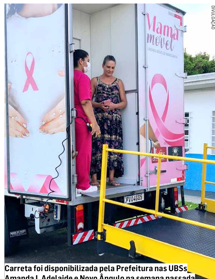
Carreta foi disponibilizada pela Prefeitura nas UBSS Amanda I, Adelaide e Novo Ângulo na semana passada

De acordo com a Secretaria de Saúde, a expectativa é de que também sejam realizadas 350 mamografias na UBS Campos Verdes, ao longo desta semana, totalizando 700 mulheres atendidas. A carreta irá atender somente mulheres que já estavam com o exa-