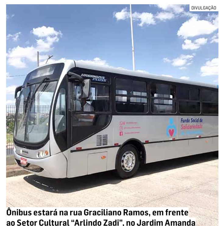
Ônibus estará na rua Graciliano Ramos, em frente ao Setor Cultural “Arlindo Zadi”, no Jardim Amanda

A estrutura interna inclui ainda oito bancos de espera. Já na parte traseira, foi feito um compartimento para armazenar cargas. O espaço será útil para guardar materiais ou objetos recebidos em ações ou campanhas de arrecadação.