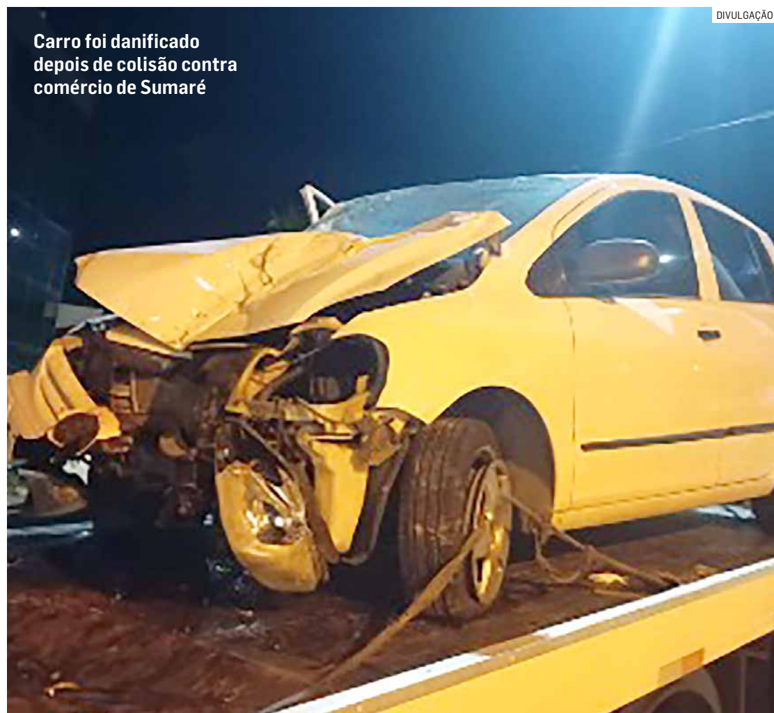
Carro foi danificado depois de colisão contra comércio de Sumaré

Diante das lesões, ambos foram encaminhados à UPA (Unidade de Pronto Atendimento) Matão, e passaram por atendimento, sendo encaminhados ao Plantão Policial de Sumaré, onde a vítima do roubo reconheceu um dos suspeitos como autor do crime. O condutor foi indiciado pelo delito de receptação e permaneceu à disposição da Justiça.