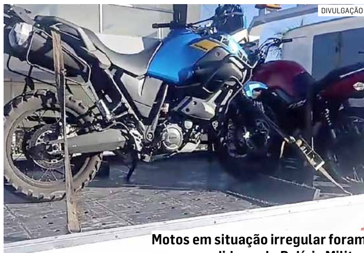
Motos em situação irregular foram apreendidas pela Polícia Militar

O condutor da motocicleta CG Fan vermelha tentou se esconder dentro de uma residência e o con-