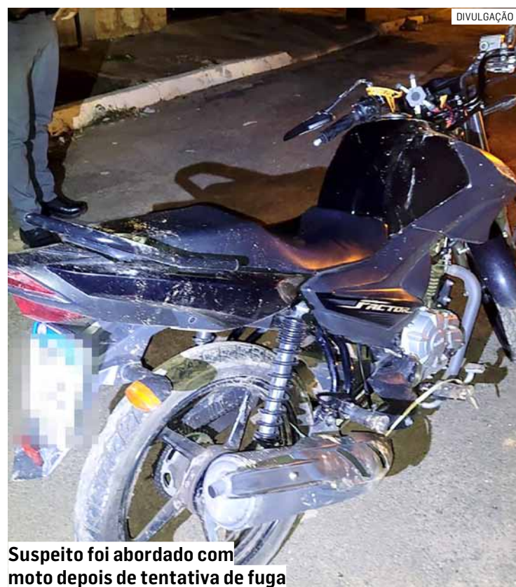
Suspeito foi abordado com moto depois de tentativa de fuga