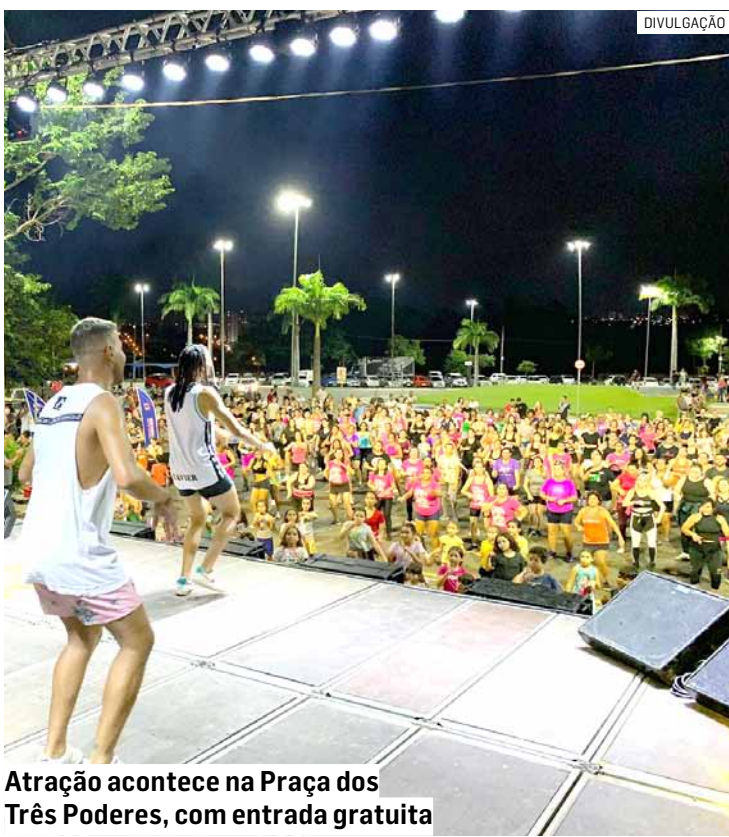
Atracção acontece na Praça dos Três Poderes, com entrada gratuita

Da Redação • NOVA ODESSA tribunaliberal@tribunaliberal.com.br