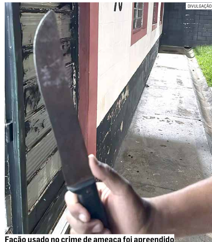
Facão usado no crime de ameaça foi apreendido

A vítima, uma mulher de 59 anos, informou aos agentes que seu marido discutia com ela e, em determinado momento da briga, ele a agrediu, depois pegou um cabo de vassoura e tentou enforcá-la. Além disso, ele pegou um facão e fez ameaças de morte contra ela.