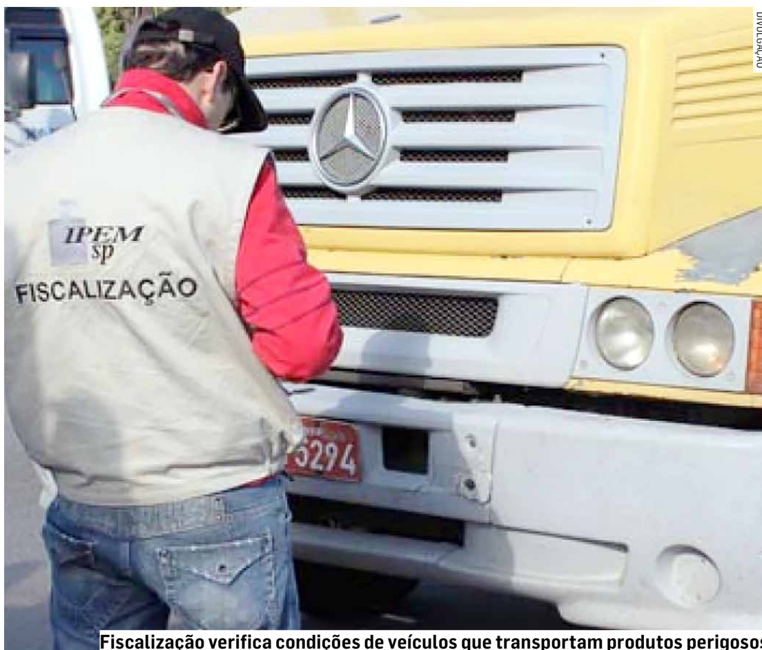
Fiscalização verifica condições de veículos que transportam produtos perigosos

A fiscalização integra o conjunto de ações do Ipem-SP que acontecem em todo o estado de São Paulo para verificar as condições dos veículos que transportam produtos perigosos. Na ocasião, os fiscais do instituto inspecionaram cerca de 50 itens do tanque que transportam combustíveis líquidos, com objetivo de