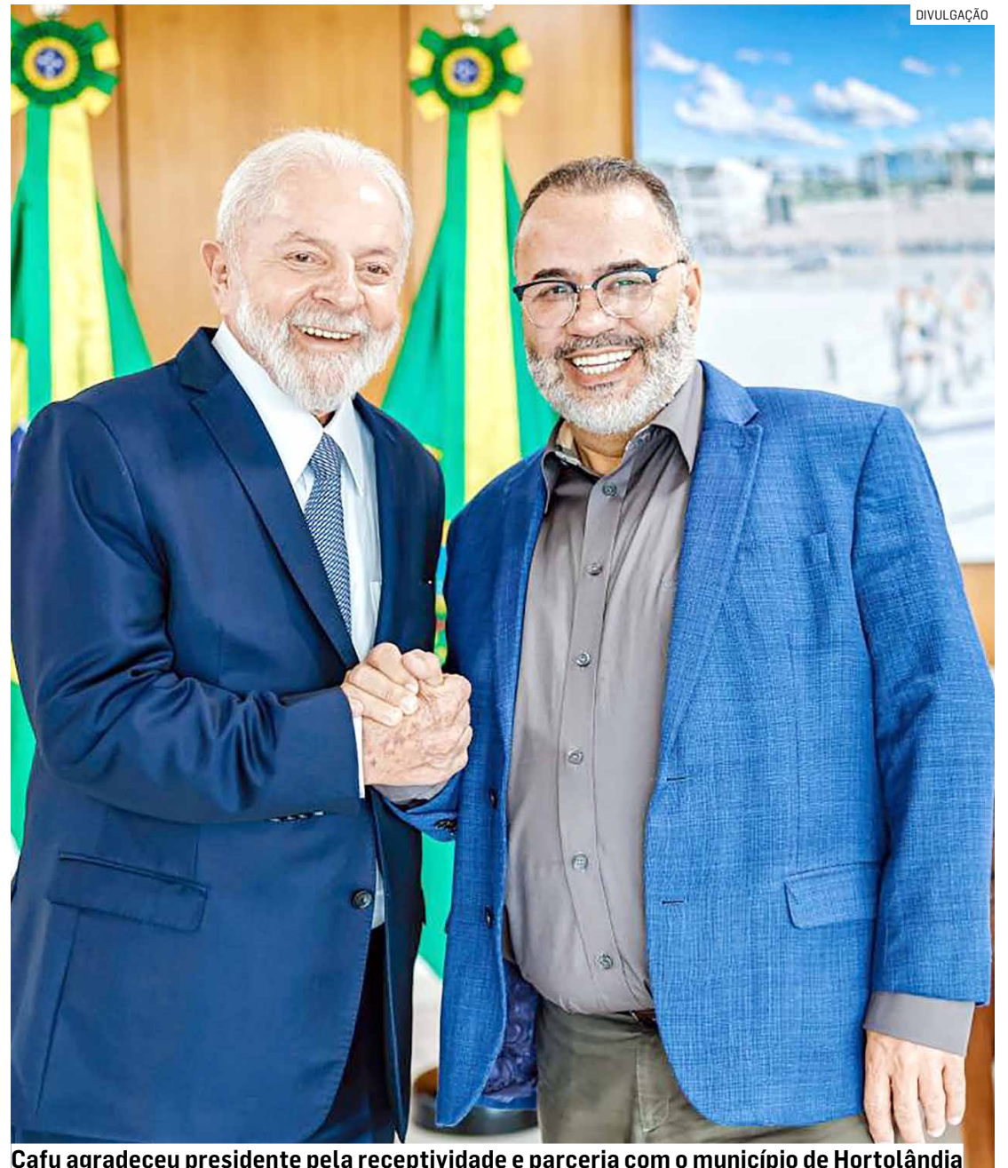
Cafu agradeceu presidente pela receptividade e parceria com o município de Hortolândia

A geração da energia será possível com a ativação de 21 usinas fotovoltaicas, das quais 12 estão em operação desde o fim do ano passado. O programa municipal viabilizará, ainda,