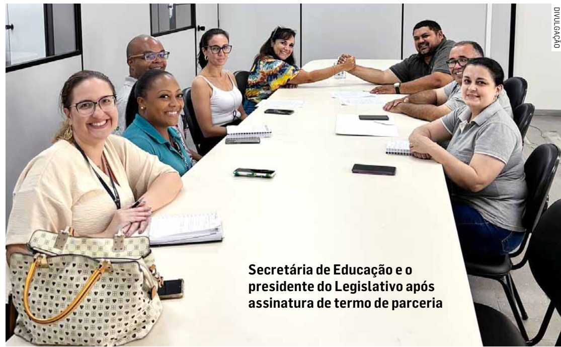
Secretária de Educação e o presidente do Legislativo após assinatura de termo de parceria

Da Redação • MONTE MOR tribunaliberal@tribunaliberal.com.br