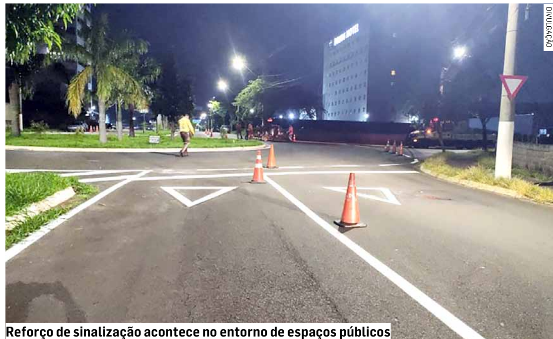
Reforço de sinalização acontece no entorno de espaços públicos

Da Redação • HORTOLÂNDIA tribunaliberal@tribunaliberal.com.br