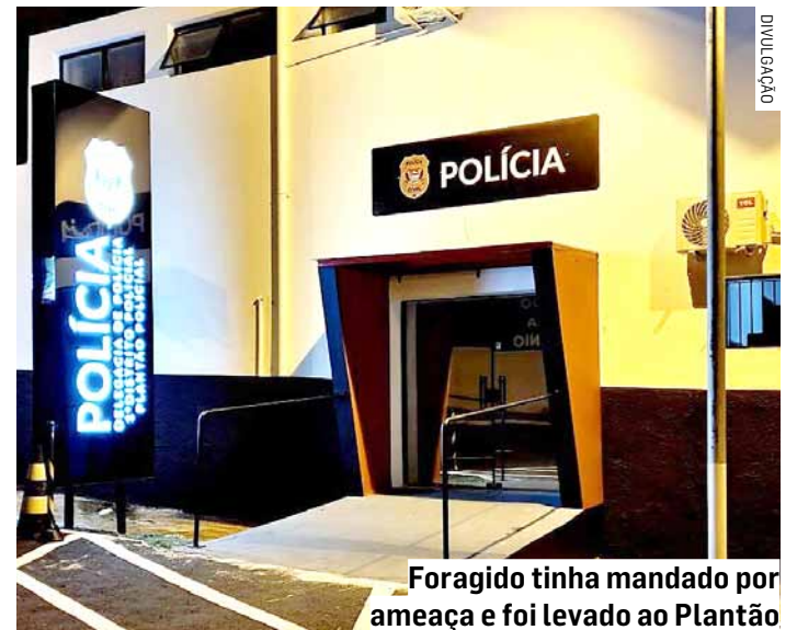
Foragido tinha mandado por ameaça e foi levado ao Plantão

Cézar Oliveira • SUMARÉ tribunaliberal@tribunaliberal.com.br