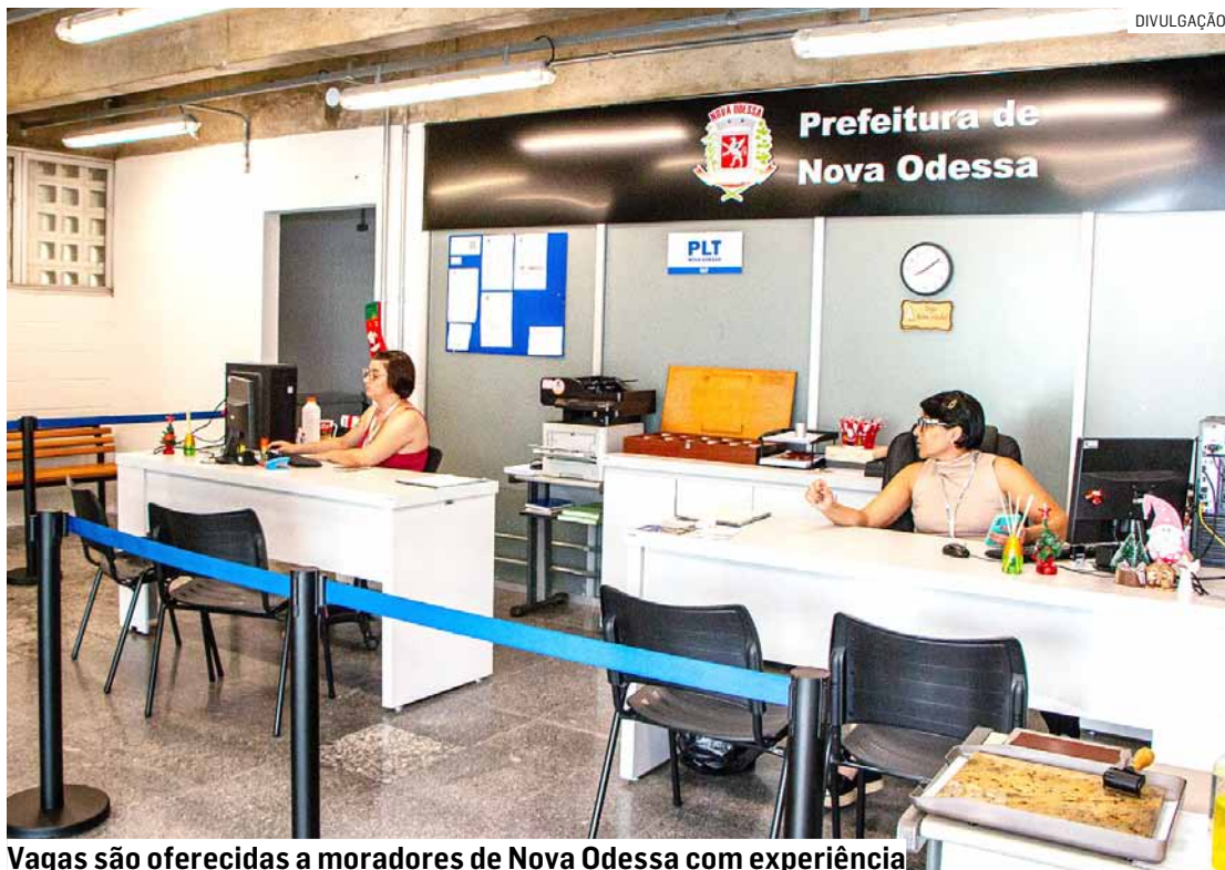
Vagas são oferecidas a moradores de Nova Odessa com experiência

✓ AUXILIAR DE ESTAMPARIA – Masculino, para revisão de cilindro, fazer a revisão na frente da máquina, auxiliar o operador na parte de bombas das tintas. Cobrir operador em horário de almoço, verificar as condições das régua. Ter