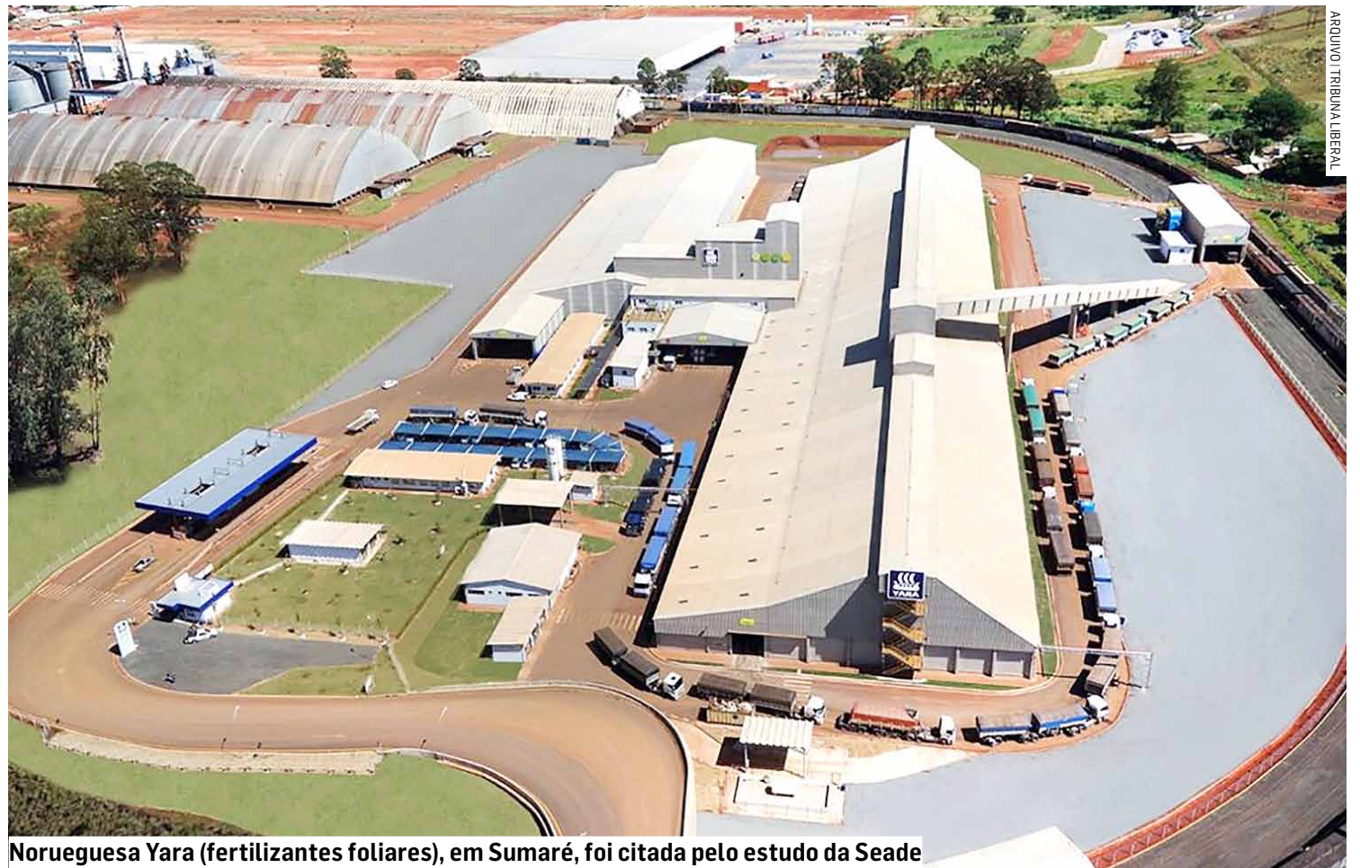
Norueguesa Yara (fertilizantes foliares), em Sumaré, foi citada pelo estudo da Seade

A Pesquisa de Investimentos Anunciados no Estado de São Paulo (Piesp) aponta que, além das empresas nacionais, as de capital estrangeiro também anunciaram a aplicação de recursos no setor P&D. O total de aportes que São Paulo arrecadou no ano passado é mais que o dobro obtido em investimen-