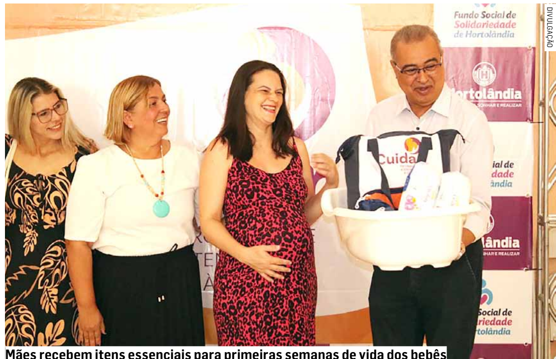
Mães recebem itens essenciais para primeiras semanas de vida dos bebês

“Esse cuidado e este carinho disponibilizado no ‘Programa Cuidar’ oferece os cuidados necessários para as crianças desde a gravidez até os primeiros anos de vida. Não só o kit mas todo o acompanhamento é necessário para contribuir com o desenvolvimento digno e maior qualidade de vida dessas crianças. Nosso cuidado também é com as ‘mamães’. Estimular estas jovens ao estudo e ajudar a inseri-las no mercado de trabalho, além de apoio psicológico. As famílias de nossas cidades de-