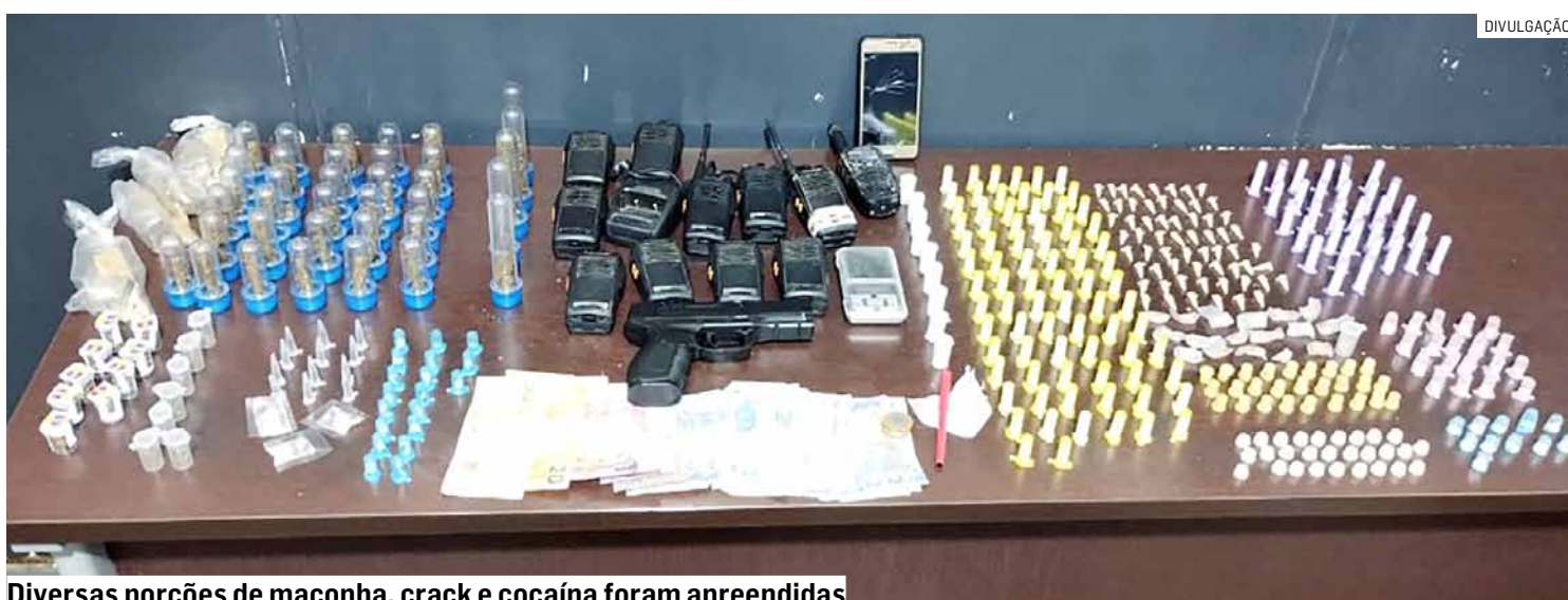
Diversas porções de maconha, crack e cocaína foram apreendidas

O indivíduo foi conduzido juntamente com os materiais ao Plantão Policial, onde o delegado determinou a prisão do suspeito.