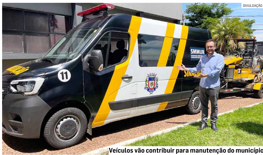
Veículos vão contribuir para manutenção do município