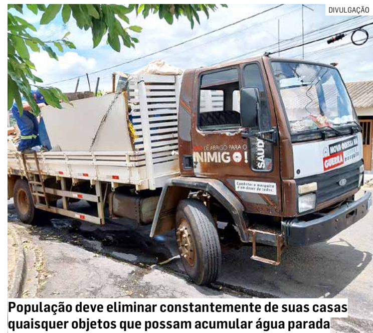
População deve eliminar constantemente de suas casas quaisquer objetos que possam acumular água parada

As visitas casa a casa durante a semana, bem como os arrastões aos sábados, já começaram em 2024. “Esse trabalho de remoção de criadouros é especialmente importante porque, historicamente, cerca