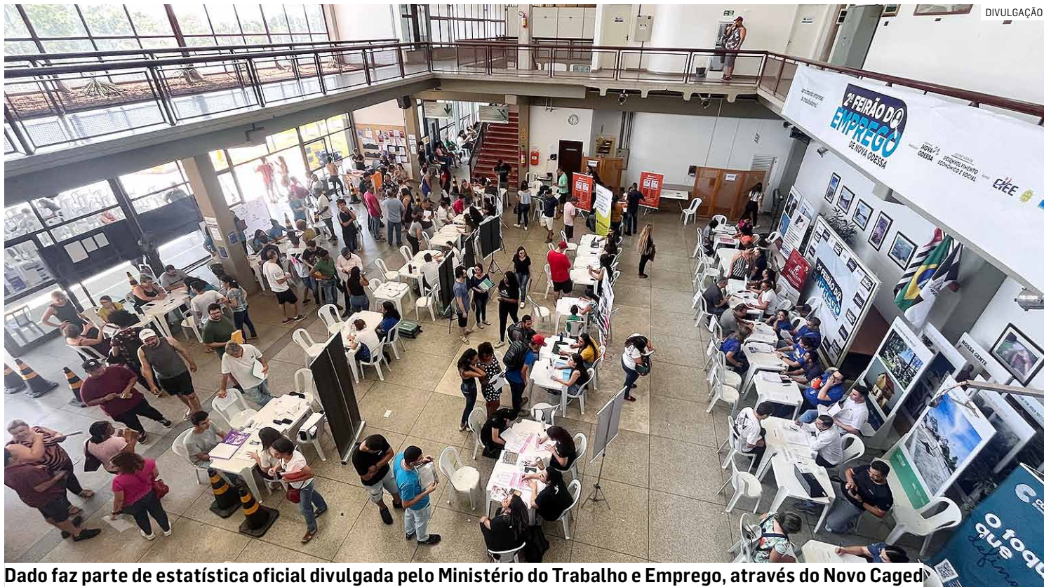
Dado faz parte de estatística oficial divulgada pelo Ministério do Trabalho e Emprego, através do Novo Caged