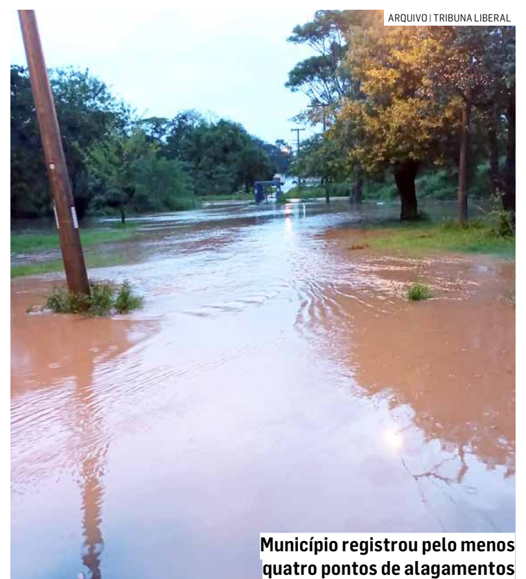
Município registrou pelo menos quatro pontos de alagamentos