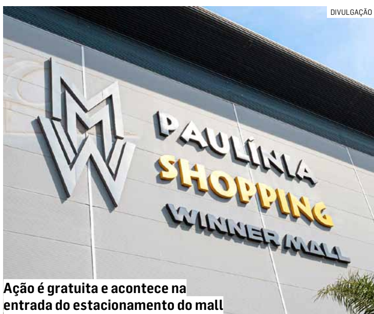
Ação é gratuita e acontece na entrada do estacionamento do mall