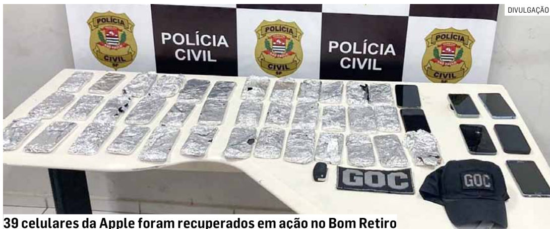
39 celulares da Apple foram recuperados em ação no Bom Retiro

César Oliveira • PAULÍNIA tribunaliberal@tribunaliberal.com.br