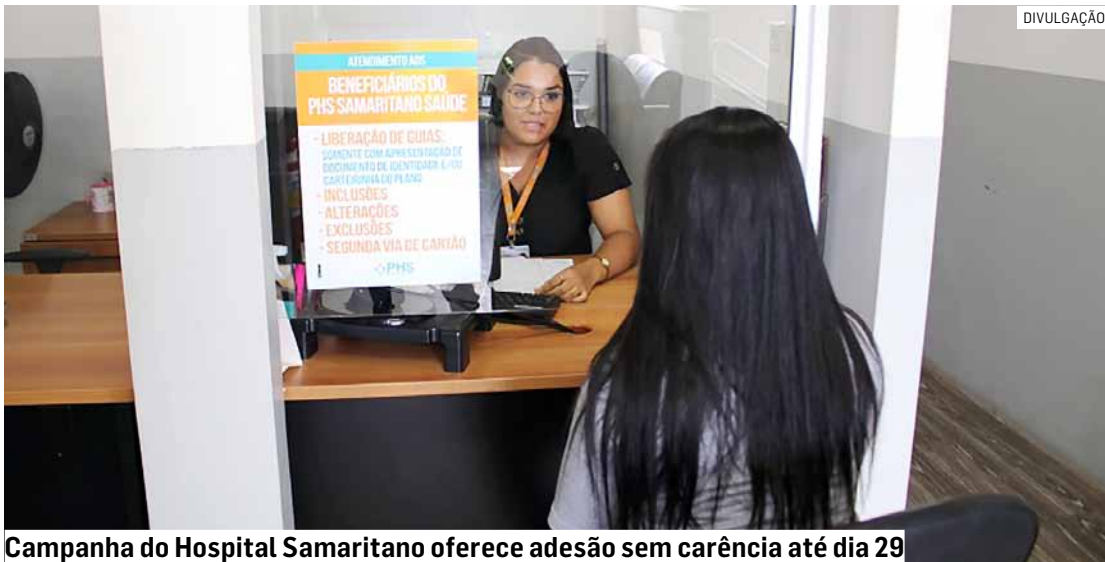
Campanha do Hospital Samaritano oferece adesão sem carência até dia 29

Da Redação • HORTOLÂNDIA tribunaliberal@tribunaliberal.com.br