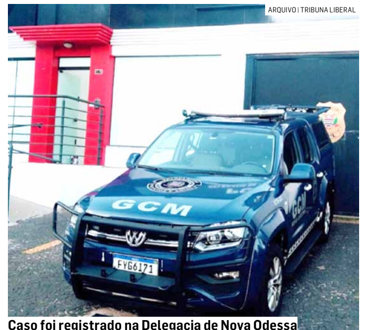
Caso foi registrado na Delegacia de Nova Odessa

Foi necessário o uso de algemas para segurança da equipe e do próprio indiví-